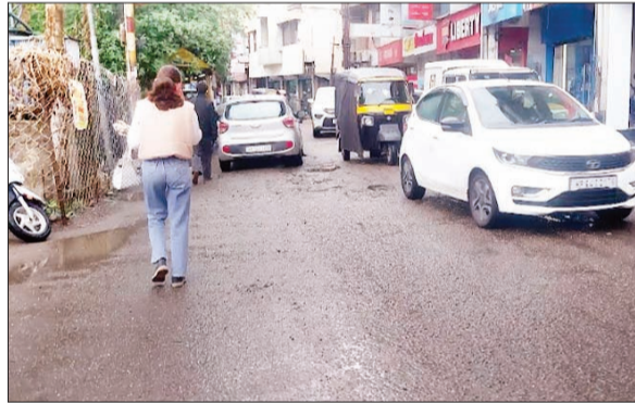
सोलन में बारिश से तापमान में आई गिरावट।

आर मोहन चौहान, सोलन। अप्रैल के महीने में गर्मी की उम्मीद के बजाय जिला सोलन में मौसम ने अचानक करवट ले ली है। पिछले कुछ दिनों से शहर में लगातार बादल छाए रहना, ठंडी हवाएं और हल्की बूंदाबांदी से तापमान इतना गिर गया कि दिसंबर जैसी सर्दी का एहसास होने लगा। अधिकतम तापमान 20-25 डिग्री सेल्सियस और न्यूनतम 8-10 डिग्री के बीच रहने से सुबह-शाम लोग स्वेटर-जैकेट पहनने को मजबूर हो गए हैं।