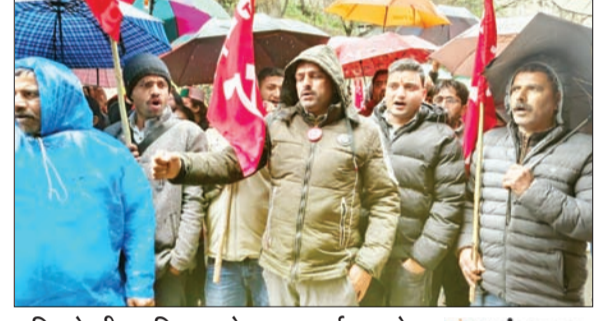
बारिश के बीच सचिवालय के बाहर प्रदर्शन करते

ब्यूरो, शिमला। हिमाचल प्रदेश में 108 और 102 एंबुलेंस सेवाओं से जुड़े कर्मचारियों की हड़ताल तीसरे दिन भी जारी रही। सीटू के बैनर तले प्रदेशभर के सैकड़ों कर्मचारी अपनी मांगों को लेकर छोटा शिमला स्थित सचिवालय के बाहर डटे रहे। बारिश के बावजूद कर्मचारियों का हौसला कमजोर नहीं पड़ा और उन्होंने सरकार के खिलाफ जोरदार प्रदर्शन जारी रखा। इस दौरान एंबुलेंस सेवाएं पूरी तरह बाधित रहीं, जिससे प्रदेश में स्वास्थ्य सेवाओं पर भी असर पड़ा। यूनिون ने चेतावनी दी है कि यदि जल्द मांगें पूरी नहीं हुईं तो आंदोलन को और तेज करते हुए निर्णायक संघर्ष छेड़ा जाएगा।