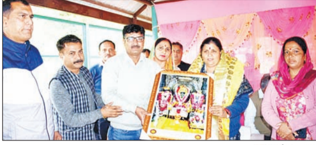
लुनसू वाया कुटार सड़क के सुधारिकरण कार्य का किया भूमिपूजन।