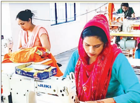
विदेशों में भी भेजी जा रही यूनिफॉर्म।