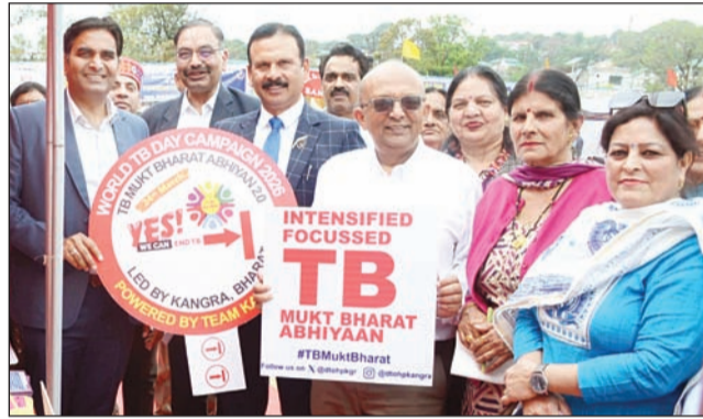
पुलिस ग्राउंड धर्मशाला में आयुष्मान आरोग्य शिविर का आयोजन।