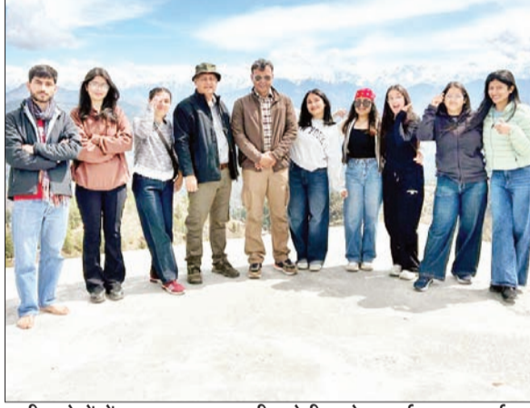
ग्रामीण क्षेत्रों में व्यापक मानवशास्त्रीय क्षेत्रीय शोध कार्य सफलतापूर्वक संपन्न किया गया।

अनंत ज्ञान, चंबा। जिला चंबा में लगातार हो रही भारी बारिश ने जनजीवन को प्रभावित कर दिया है। चंबा-तीसा मुख्य मार्ग पर शरेला के पास सड़क दलदल में तब्दील हो गई, जिससे कई वाहन बीच रास्ते में ही फंस गए। हालात ऐसे बन गए कि वाहनों की आवाजाही पूरी तरह से बाधित हो गई। स्थानीय लोगों के अनुसार, लगातार बारिश के चलते सड़क की हालत बेहद खराब हो गई है और कीचड़ व दलदल के कारण गाड़ियां आगे बढ़ने में असमर्थ हो रही हैं। कुछ वाहनों को निकालने के लिए काफी मशकत करनी पड़ी, वहीं कई वाहन घंटों तक फंसे रहे। प्रशासन और संबंधित विभाग को सूचना दे दी गई है। मौके पर मशीनरी भेजकर सड़क को बहाल करने के प्रयास किए जा रहे हैं, लेकिन बारिश के चलते काम में दिक्कत आ रही है। प्रशासन ने लोगों से अपील की है कि जब तक सड़क पूरी तरह से बहाल नहीं हो जाती, तब तक इस मार्ग पर यात्रा करने से बचें और वैकल्पिक मार्गों का उपयोग करें।