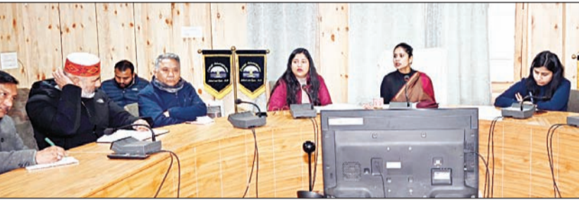
हिमाचल दिवस के आयोजन को लेकर अधिकारियों से चर्चा करती हुई डीसी किरण भड़ाना।

ब्यूरो, केलांग। जिला स्तरीय हिमाचल दिवस को भव्य रूप से मनाने के लिए डीसी कार्यालय केलांग के सम्मेलन कक्ष में महत्वपूर्ण बैठक आयोजित की गई, जिसकी अध्यक्षता उपायुक्त लाहौल-स्पीति किरण भड़ाना ने की। इस अवसर पर उन्होंने सभी विभागों को तैयारियों में कोई कसर न छोड़ने के निर्देश दिए। बैठक को संबोधित करते हुए डीसी किरण भड़ाना ने कहा, 'हिमाचल दिवस हमारे राज्य की सांस्कृतिक धरोहर और एकता का प्रतीक है। सभी विभाग इस अवसर को यादगार बनाने के लिए पूर्ण सहयोग करें तथा अपनी भागीदारी सुनिश्चित करें। उन्होंने जानकारी देते हुए बताया कि उपायुक्त मंत्री हिमाचल प्रदेश सरकार यादविंदर गोमा मुख्यातिथि के रूप में इस कार्यक्रम को अध्यक्षता करेंगे तथा राष्ट्रीय ध्वज फहरायेंगे। विभागवार जिम्मेदारियां स्पष्ट करते हुए उपायुक्त ने लोक निर्माण विभाग