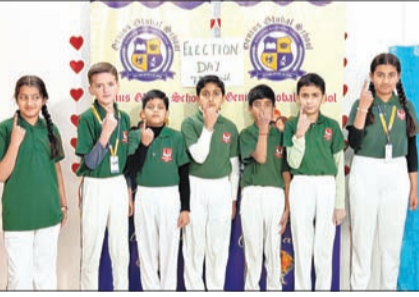
मतदान के दौरान छात्र।