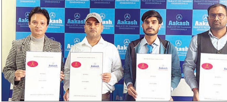
कार्यरत व रिटायर्ड जवानों के बच्चों को 20 फीसदी स्कॉलरशिप का प्रावधान।