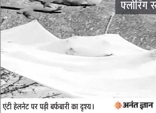
एटी हेलेनेट पर पड़ी बर्फबारी का दृश्य।

सत्यदेव भारद्वाज, शिमला। अप्रैल, जिसे बागवान अपने सपनों के संवरने का महीना मानते हैं, इस बार किसी निर्दयी इन्तिहाज की तरह सामने आया है। खिलती कलियों और उम्मीदों से लदे सब के बागानों पर कुदरत ने ऐसा कहर बरपाया कि हर शाख मानो दर्द की कहानी कहती नजर आई। कभी ओलों की बेरहम चोट, कभी बर्फ की चादर और कभी बेमौसम बारिश की सर्द मार, इन सबने मिलकर बागवानों के अरमानों को झकझोर कर रख दिया है। जिन खेतों में खुशहाली की दस्तक सुनाई देती थी, वहां आज सन्नाटा और चिंता की परछाइयां गहरती जा रही हैं।