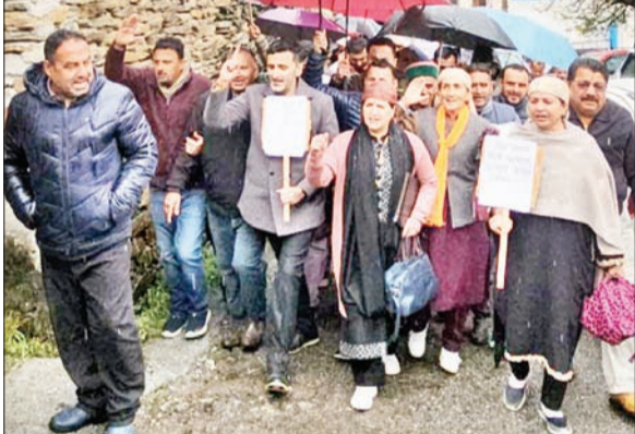
बागवानों की समस्याओं पर प्रदर्शन करते हुए।