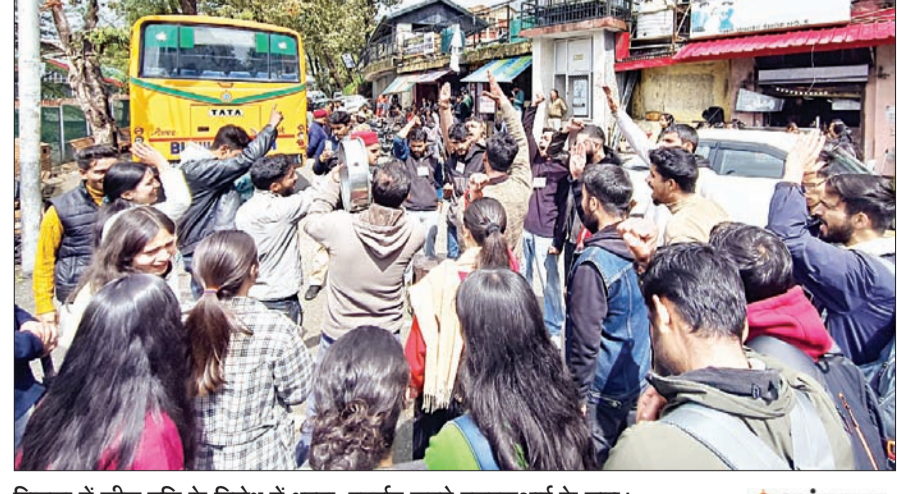
शिमला में फीस वृद्धि के विरोध में धरना-प्रदर्शन करते एसएफआई के छात्र।

ब्यूरो, शिमला। हिमाचल प्रदेश की छात्र फेडरेशन ऑफ इंडिया विश्वविद्यालय इकाई ने हिमाचल प्रदेश विश्वविद्यालय द्वारा 28 मार्च 2026 को ईसी बैठक में लिए गए फीस वृद्धि के फैसले के विरोध में धरना-प्रदर्शन किया। संगठन ने इस निर्णय को छात्र विरोधी बताया है और कहा कि विश्वविद्यालय प्रशासन ने 10 से 15 प्रतिशत तक फीस बढ़ाती की है, जबकि संबद्ध महाविद्यालयों में यह वृद्धि और अधिक है। इसके साथ ही परीक्षा शुल्क में भी करीब 40 प्रतिशत तक इजाफा किया गया है, जिससे छात्रों पर अतिरिक्त आर्थिक बोझ पड़ा है। एसएफआई ने आरोप लगाया कि इस तरह के फैसलों से उच्च शिक्षा की पहुंच सीमित हो रही है और गरीब व मध्यम वर्ग के छात्र शिक्षा से वंचित हो सकते हैं। संगठन का कहना है कि विश्वविद्यालय का मूल उद्देश्य सभी वर्गों तक शिक्षा