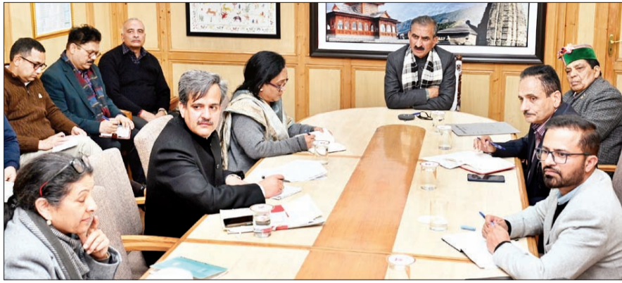
सीएम सुक्खू स्वास्थ्य शिक्षा विभाग की समीक्षा बैठक की अध्यक्षता करते हुए।