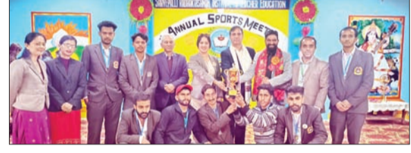
खेलकूद प्रतियोगिता के विजेता खिलाड़ी सम्मानित किए।