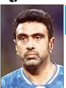
हमने रन बनाने के मौके दिए: विटोरी

एजेंसी, सैन फ्रांसिस्को। भारत के पूर्व ऑफ स्पिनर रविचंद्रन अश्विन अब अमेरिका की टी-20 लीग में खेलते नजर आएंगे।