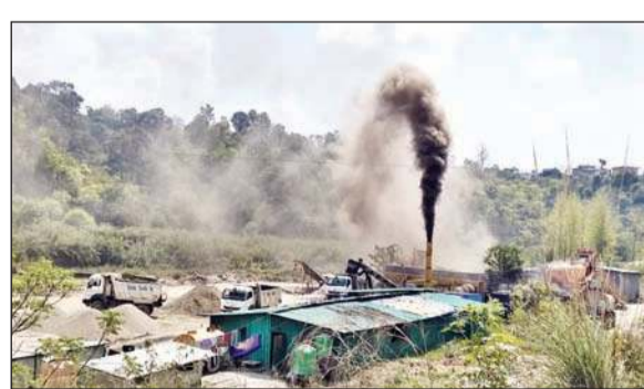
धनेटा के साथ मान खड्ड में लगाया प्लांट।

प्लांट से निकलने वाला काला धुआं और धूल आसपास के गांवों में फैलकर लोगों के स्वास्थ्य पर गंभीर असर डाल रहा है। पनसाई, डोहा, डहू, बेहा, मांजरा के सैकड़ों लोगों को इस परेशानी से जूझना पड़ रहा है। यह प्लांट प्राथमिक स्कूल बेहा से महज 400 मीटर दूर है, आबादी से इसकी दूरी करीब 150 मीटर है, जबकि