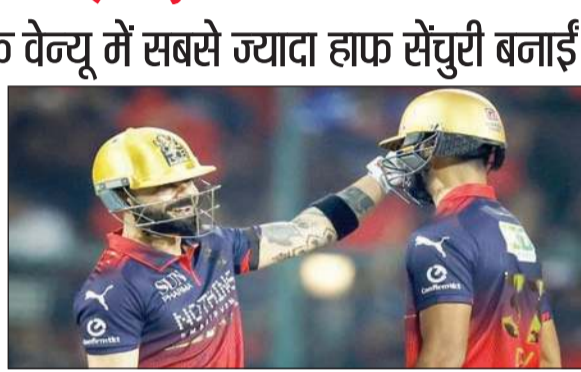
(आरआर) हैं। आरआर ने 2025 में गुजरात टाइटंस के खिलाफ 212/2 का लक्ष्य 15.5 ओवर में हासिल किया था।

एजेंसी, बेंगलुरु। डिफेंडिंग चैंपियन रॉयल चैलेंजर्स बेंगलुरु (आरसीबी) ने आईपीएल का सबसे तेज रन चेज करके 19वें सीजन में जीत से शुरुआत की।