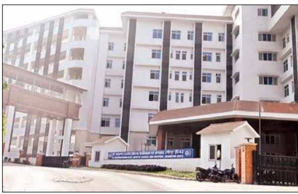
हमीरपुर जिले में तीन बड़ी परियोजनाओं मेडिकल कॉलेज, बस स्टैंड और इंडोर स्टेडियम का निर्माण कार्य तेजी से जारी।

स्थापित करने के लिए प्रदेश सरकार ने मंजूरी प्रदान की है। जोल सप्टड में मेडिकल कॉलेज के विभिन्न भवनों एवं ब्लॉकों के लिए लगभग 500 करोड़ रुपए जारी किए जा चुके हैं। नए परिसर में अकैडमिक ब्लॉक और अस्पताल भवन का कार्य पूरा हो चुका है। इसी परिसर में क्रिटिकल केयर ब्लॉक, सभागार और अन्य भवनों के कार्य भी प्रगति पर हैं। यहां कैंसर केयर संस्थान के निर्माण के लिए 90 करोड़ रुपए जारी किए गए हैं। वहीं पर नर्सिंग कॉलेज, डेंटल कॉलेज, 200 बिस्तर का मदर-चाइल्ड अस्पताल, नशा मुक्ति एवं उपचार केंद्र, प्रशासनिक ब्लॉक, छात्रावास और अन्य भवनों के निर्माण कार्य शुरू करने के लिए भी सभी आवश्यक औपचारिकताएं