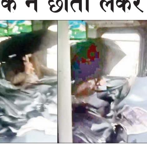
बारिश में छाता लेकर बस को चलाता चालक।

चालक को मजबूरन छाता लगाकर बस चलानी पड़ी। बस में साथ बैठे एक यात्री ने इस पूरे घटनाक्रम का वीडियो बना लिया, जो अब सोशल मीडिया पर खूब वायरल हो रहा है। स्थानीय लोगों का कहना है कि यह कोई पहला मामला नहीं है। इस बस को लेकर पहले भी कई बार छत टपकने, शीशे टूटने और बीच