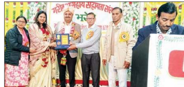
सदस्यों को प्रशस्ति पत्र देकर किया सम्मानित।

उन्होंने बताया कि संस्था ने बीते एक वर्ष में 86 गरीब व जरूरतमंद लोगों को आर्थिक सहायता प्रदान की है। पिछले 22 वर्षों में संस्था द्वारा लगभग 90 लाख रुपए की राशि जरूरतमंदों को वितरित की जा चुकी है। कार्यकारिणी सदस्यों के साथ विभिन्न क्षेत्रों में 47 ग्रामीण प्रबंधक सक्रिय रूप से कार्य कर रहे हैं। वर्तमान में संस्था के सदस्यों की