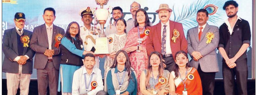
द्रोणाचार्य कॉलेज रैत में दो दिवसीय नवरंग वार्षिक उत्सव का आयोजन किया।