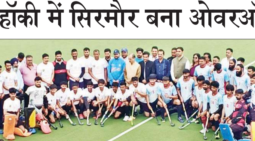
स्टेट ओपन हॉकी चैंपियनशिप की विजेता और उपविजेता टीमें मुख्यातिथि के साथ।

अनंत ज्ञान। ब्यूरो, अना। हिमाचल प्रदेश की रज्ज स्तरीय ओपन हॉकी चैंपियनशिप में सिरमौर जिले ने शानदार प्रदर्शन करते हुए ओवरऑल चैंपियन का खिताब अपने नाम कर लिया।