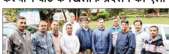
पालमपुर में निर्माण कामगार संघ ने की बैठक।