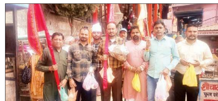
बाबा बालक नाथ के दर्शनों के लिए जाते श्रद्धालु।

मंदिर प्रशासन द्वारा जारी विवरण के मुताबिक 29 मार्च को कुल 26,72,324 रुपए