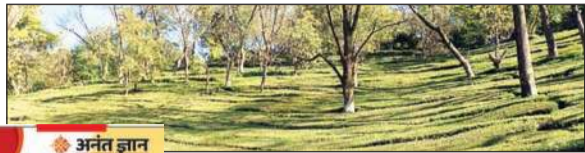
अनंत ज्ञान स्पेशल

राजेश कुमार, धर्मशाला। हाल ही में हुई बारिशों से कांगड़ा घाटी में अप्रैल के पहले तोड़ की चाय की पैदावार अच्छी होने की उम्मीद बंध गई है। पहले तोड़ की चाय की विदेशों में खासी डिमांड रहती है। धर्मशाला चाय उद्योग की बात करें तो विभिन्न वैरायटी की चाय तैयार की जाती है। धर्मशाला चाय उद्योग में रोज टी में बल्गेरियन रोज का इस्तेमाल होता है। वहीं, यहां की स्मॉक टी को फ्रांस में खासा पसंद किया जाता है। इसके अलावा उलांग चाय, हैंडमेड चाय, सन ड्राई, आर्थोडाक्स, ब्लैक ऑर्थोडाक्स, ग्रीन टी, रोज टी तैयार की जाती है।