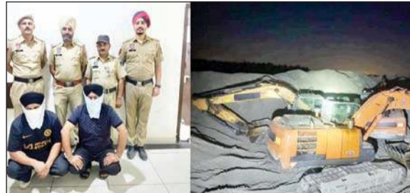
पुलिस टीम के साथ गिरफ्तार किए दो आरोपी।