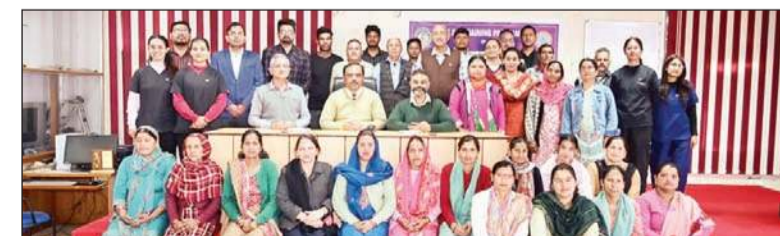
कृषि विवि ने किसानों के लिए प्रशिक्षण कार्यक्रमों की शृंखला आयोजित की।