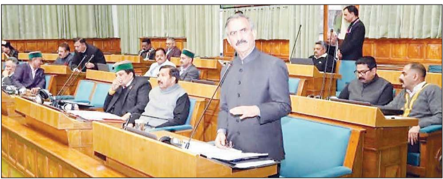
विधानसभा में प्रश्नकाल के दौरान सदस्यों के सवालों के जवाब देते मुख्यमंत्री सुक्खू।