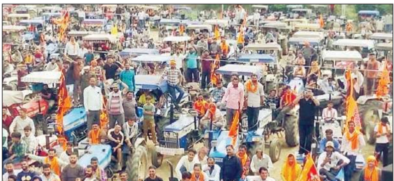
पुलिस की सख्ती पर प्रशासन और प्रदेश सरकार के खिलाफ रैली निकाली।

रविंद्र चौधरी, फतेहपुर। जिला पुलिस नूरपुर में अवैध खनन के खिलाफ पुलिस की सख्ती अब बड़ा जनमुद्रदा बनता जा रहा है। जिला पुलिस द्वारा खड्डों और नदी-नालों से रेत-बजरी निकालने के मामलों में लगातार कार्रवाई की जा रही है, जिसके तहत नियमों की अवहेलना करने वाले ट्रेक्टर चालकों के चालान कटे जा रहे हैं और उनके वाहनों को जब्त कर अदालत में पेश किया जा रहा है। इस कार्रवाई से ट्रेक्टर चालकों और छोटे किसानों में भारी नाराजगी फैल गई है। उनका कहना है कि रेत-बजरी का काम ही उनकी आजीविका