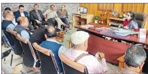
समीक्षा बैठक की अध्यक्षता करती डीसी गंधर्वा राठौड़।

अनंत ज्ञान हमीरपुर। उपायुक्त गंधर्वा राठौड़ ने शनिवार को सामाजिक न्याय एवं अधिकारिता विभाग की विभिन्न योजनाओं, अभियानों और अधिनियमों से संबंधित छह जिला स्तरीय समितियों की बैठक की अध्यक्षता की। इस दौरान विभागीय कार्यों की प्रगति को समीक्षा करते हुए आवश्यक दिशा-निर्देश जारी किए गए। जिला दिव्यांगता समिति की बैठक में उपायुक्त ने बताया कि जिले में लगभग 5260 दिव्यांगजनों को यूडीआईडी कार्ड प्रदान किए जा चुके हैं और उन्हें विभिन्न सरकारी योजनाओं के माध्यम से लाभान्वित किया जा रहा है। उन्होंने निर्देश दिए कि सभी सरकारी भवनों, सार्वजनिक स्थलों, परिवहन सेवाओं, अस्पतालों, कार्यालयों और शौचालयों में दिव्यांगों के लिए आवश्यक सुविधाएं सुनिश्चित की जाएं। साथ ही मेडिकल कॉलेज अस्पताल में दिव्यांगजनों के लिए दस्तावेज बनवाने के लिए विशेष व्यवस्था करने के निर्देश दिए गए। अनुसूचित जाति एवं जनजाति अत्याचार निवारण अधिनियम के तहत मामलों की समीक्षा करते हुए उपायुक्त ने बताया कि वर्ष 2025-26 के दौरान 26 एफआईआर दर्ज हुई हैं। इनमें से 13 मामलों की जांच जारी है, 3 मामलों में चालान पेश हो चुके हैं और 11 मामलों की कैंसलेशन रिपोर्ट तैयार की जा रही है। उन्होंने पुलिस और अभियोजन विभाग को निर्देश दिए कि ऐसे मामलों में किसी प्रकार की देरी न हो। साथ ही विभिन्न अदालतों में लंबित 28 मामलों की स्थिति पर तहत मामलों की समीक्षा करते हुए अधिनियम 1999 के अंतर्गत आयोजित बैठक में बताया गया कि मानसिक विकलांगता, ऑटिज्म, सेरोब्रल पाल्सी और बहु-विकलांगता से ग्रस्त व्यक्तियों के