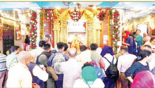
माता के दर्शनों के लिए उमड़ी श्रद्धालुओं की भारी भीड़।