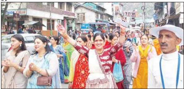
रामनवमी पर निकाली शोभायात्रा में झूमते भक्त।

कमलेश वर्मा, कुल्लू। भगवान श्री राम के जन्मोत्सव 'रामनवमी' के पावन अवसर पर इस्कॉन (अंतरराष्ट्रीय कृष्णभावनामृत संघ) द्वारा कुल्लू शहर वीरवार को भव्य और भक्तिमय शोभायात्रा निकाली गई। इस यात्रा में सैकड़ों की संख्या में इस्कॉन भक्तों के अलावा अन्य श्रद्धालुओं ने हिस्सा लिया। इस मौके पर पूरा शहर और 'हरे कृष्णा, हरे रामा के उद्घोष से गुंजायमान हो उठा।