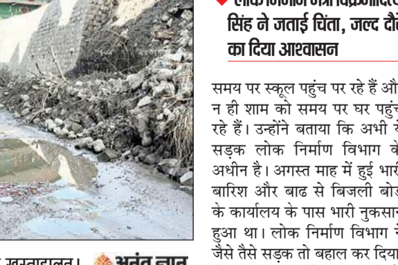
फोरलेन पुल से अलेउ तक सड़क की खस्ताहालत।

मनाली। ब्यास नदी पर फोरलेन पुल से अलेउ तक सड़क की हालत वाहन चालकों और पर्यटकों के लिए परेशानी का सबब बन गई है। सड़क की हालत इतनी खराब है कि अब यहां गाड़ी चलना ही मुश्किल हो गया है। खास कर टू व्हीलर चलाना तो भगवान के भरोसे ही है। ब्यास नदी पर बने पुल से पंजाब नेशनल बैंक तक सड़क इतनी खराब है कि महज दो किलोमीटर की दूरी तय करने में घंटों का समय लग रहा है। सामझ नहीं आता है कि सड़क में गड्ढे हैं या गड्ढों में सड़क बनी है। हर रोज कोई न कोई गाड़ी का एक्सल टूट रहा है। सोशल मीडिया में लोक निर्माण मंत्री विक्रमादित्य ने भी इस सड़क की हालत पर चिंता जाहिर की है और उन्होंने शीघ्र स्वयं निरीक्षण करने का आश्वासन दिया है। बारिश के दिनों में कीचड़ और धूप के दौरान धूल से इस मार्ग के