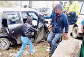
दुर्घटना में क्षतिग्रस्त वाहन। अनंत ज्ञान

पंडोह। चंडीगढ़-मनाली राष्ट्रीय मार्ग पर पंडोह के पास कार और बस की भिड़ंत में दो लोगों की मौत हो गई, जबकि दो गंभीर रूप से घायल हो गए। घायलों का उपचार जौनल अस्पताल मंडी में चल रहा है। प्रत्यक्षदर्शियों के अनुसार वीरवार सुबह करीब 9 बजे एक निजी बस कुल्लू की ओर जा रही थी, तीनों सामने से आ रही