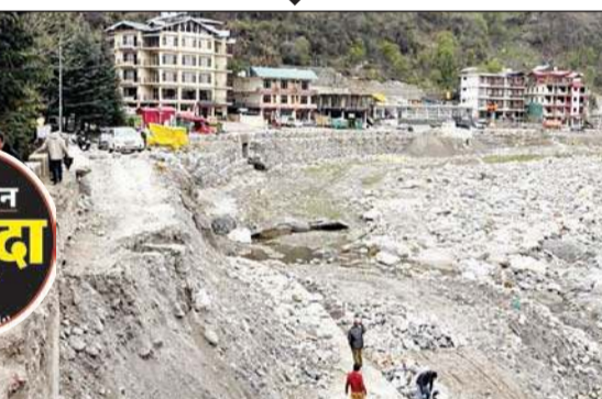
एनएच पर 17 मील में कछुआ गति से चल रहा कार्य।