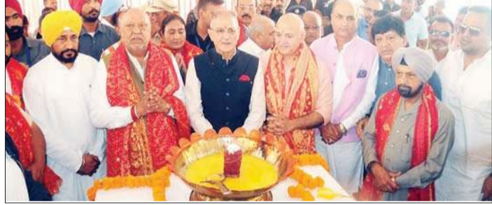
राम नवमी पर शोभायात्रा में पहुंचे राज्यपाल कविंद्र गुप्ता।

अनंत ज्ञान ब्यूरो, शिमला। पंजाब के एक दिवसीय दौर के दौरान राज्यपाल कविंद्र गुप्ता ने जालंधर स्थित प्रसिद्ध शक्ति पीठ देवी तालाब मंदिर में आयोजित राम नवमी शोभा यात्रा में भाग लिया। इस अवसर पर उन्होंने मंदिर में विधिवत पूजा-अर्चना कर प्रदेशवासियों के सुख, शांति और समृद्धि की कामना की। राज्यपाल की उपस्थिति से पूरा वातावरण भक्तिमय हो उठा और श्रद्धालुओं में विशेष उत्साह देखा गया। राज्यपाल ने कहा कि राम नवमी जैसे पावन पर्व भारतीय संस्कृति की समृद्ध परंपराओं को संजोए रखने का कार्य करते हैं। उन्होंने कहा कि ऐसे धार्मिक आयोजन