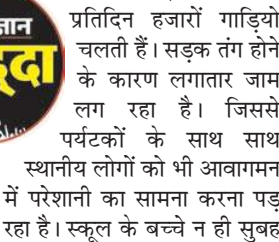
अनंत ज्ञान मुद्दा