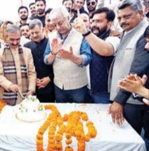
सीएम सुखू कार्यकर्ताओं के साथ जन्मदिन का केक काटते हुए।