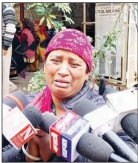
मृतक की मां आंखों में आंसू लिए न्याय की गुहार लगाते हुए।

ब्यूरो, कुल्लू। कुल्लू मुख्यालय में स्थित शोशाभाटी (चंडीगढ़ बिहाल) के समीप एक युवती ने गले में फंदे पर झूलकर अपनी जीवन इहलौला समाप्त कर ली। मृतक युवती की मां ने क्षेत्रीय अस्पताल में युवती के ससुराल वालों पर प्रताड़ित करने के गंभीर आरोप लगाए हैं।