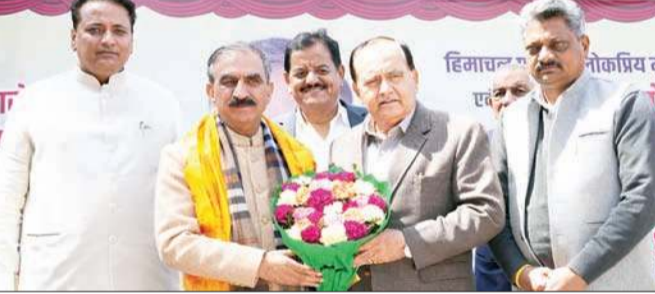
मुख्यमंत्री को जन्मदिवस की शुभकामनाएं देते विधानसभा अध्यक्ष।