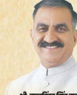
श्री सुखविंदर सिंह सुक्खू माननीय मुख्यमंत्री हिमाचल प्रदेश