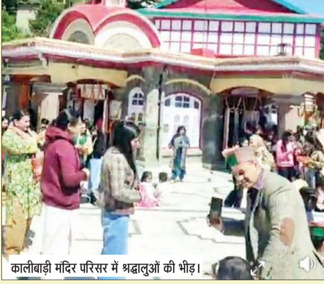
कालीबाड़ी मंदिर परिसर में श्रद्धालुओं की भीड़।

'जय माता दी' के जयघोषों से गुंज उठा। दूर-दराज इलाकों से आए श्रद्धालुओं ने मां के दरबार में शीश नवाकर अपनी मनोकामनाएं अर्पित की। कालीबाड़ी मंदिर, जो मां श्यामला को समर्पित माना जाता है और जिसकी आस्था कोलकाता की मां काली से भी जुड़ी हुई है, आज भक्तों की अकीर्त का केंद्र बना रहा। मंदिर परिसर में भजन-कीर्तन का समां बंधा रहा, जहां भक्त भाव-विभोर होकर मां की स्तुति में लीन नजर आए। माहौल में एक रूहानी कैफियत थी, जहां संगीत, श्रद्धा और भक्ति का संगम पूरे वातावरण को पाक और सरसब्ज बना रहा था। हर ओर श्रद्धालुओं की भीड़, आरती की धुन और घंटियों की मधुर आवाज एक दिव्य अनुभूति का एहसास करा रही थी।