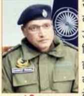
राज्य स्तरीय नलवाड़ी मेले के पावन अवसर पर अनंत ज्ञान समाचार पत्र प्रबंधन तथा सभी को हार्दिक बधाई एवं शुभकामनाएं। यह मेला हमारी सांस्कृतिक एकता और सामाजिक समरसता का अद्भुत उदाहरण है। जिला पुलिस द्वारा मेले के दौरान सुरक्षा के पुरख्ता इंतजाम किए गए हैं ताकि सभी लोग सुरक्षित वातावरण में इस उत्सव का आनंद ले सकें। मैं सभी से अपील करता हूँ कि यातायात नियमों का पालन करें, किसी भी संदिग्ध गतिविधि की सूचना तुरंत पुलिस को दें और प्रशासन के साथ सहयोग बनाए रखें। आप सभी का सहयोग ही इस आयोजन को सफल और सुरक्षित बनाएगा।

राज्य स्तरीय नलवाड़ी मेले के शुभ अवसर पर जिला बिलासपुर के समस्त नागरिकों एवं प्रदेशवासियों के साथ-साथ अनंत ज्ञान समाचार पत्र प्रबंधन को हार्दिक शुभकामनाएं। नलवाड़ी मेला हमारी समृद्ध सांस्कृतिक विरासत, परंपराओं और आपसी भाईचारे का प्रतीक है। यह मेला न केवल हमारी ऐतिहासिक पहचान को सहेजता है, बल्कि स्थानीय कलाकारों, हस्तशिल्पियों और व्यापारियों को एक महत्वपूर्ण मंच भी प्रदान करता है। जिला प्रशासन द्वारा मेले के सफल आयोजन के लिए सभी आवश्यक व्यवस्थाएं सुनिश्चित की गई हैं। मैं सभी आगंतुकों से आग्रह करता हूँ कि मेले का आनंद लेते हुए स्वच्छता बनाए रखें व प्रशासन का सहयोग करें।