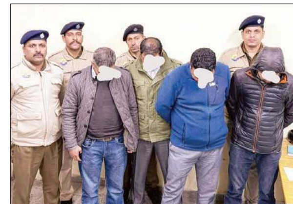
एनडीपीएस मामले में सलिस चार पुलिस कर्मी गिरफ्तार।