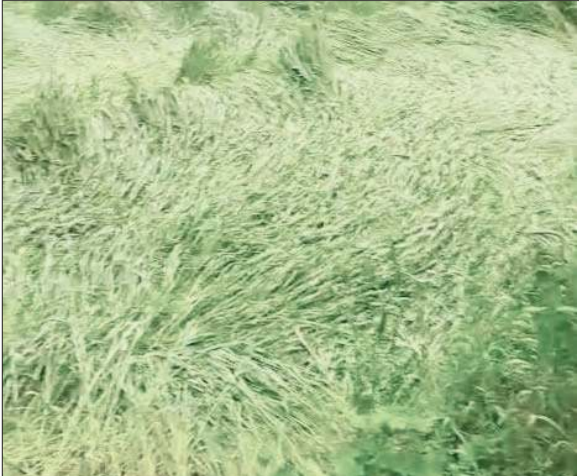
तूफान से खेतों में बिछी गेहूं की फसल।

जोगिंद्रनगर। उपमंडल जोगिंद्रनगर के मझारनू क्षेत्र में रविवार रात आए तेज तूफान के कारण गेहूं की खड़ी फसल को भारी नुकसान पहुंचा है। तेज हवा के झोंकों से खेतों में लहलहा रही गेहूं की फसल जमीन पर ही लेट गई, जिससे किसानों की मेहनत पर पानी फिरता नजर आ रहा है। स्थानीय किसानों ने बताया कि पिछले कई महीनों से कड़ी मेहनत के बाद तैयार हुई गेहूं की फसल को अचानक आए तेज तूफान ने खेतों में ही गिरा दिया। फसल के गिर जाने से उत्पादन प्रभावित होने की आशंका है और किसानों को आर्थिक नुकसान उठाना पड़ सकता है। कई खेतों में गेहूं पूरी तरह जमीन पर बिछ गई है, जिससे किसानों में चिंता का माहौल बना हुआ है। इसके अलावा क्षेत्र में की जा रही सब्जियों की खेती की हालत भी खराब हो गई है। तेज हवाओं और बारिश के कारण कई जगहों पर सब्जियों की