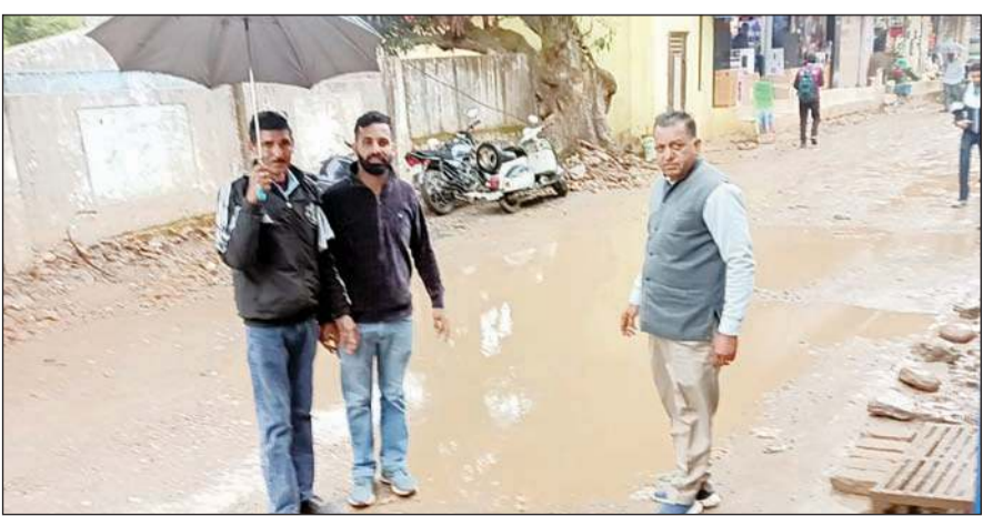
बारिश से सड़क पर जलभराव होने से राहगीर और वाहन चालक हो रहे परेशान।