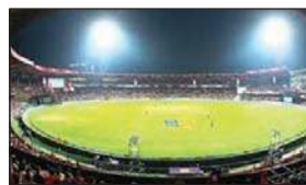
गंत वर्ष आरसीबी की विक्ट्री सेरेनी ने भगवद् गजने के बाद लगी थी टोक