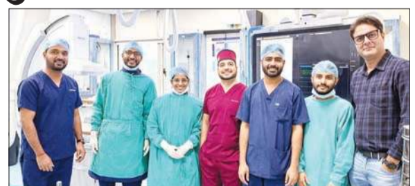
एम्स बिलासपुर के डॉक्टरों की टीम।

ब्यूरो, बिलासपुर। ऑल इंडिया इंस्टिट्यूट ऑफ मेडिकल साइंसेस बिलासपुर के रेडियोलॉजी विभाग ने चिकित्सा क्षेत्र में एक उल्लेखनीय उपलब्धि हासिल करते हुए मात्र अढ़ाई महीनों में 100 से अधिक उन्नत इंटरवेंशनल रेडियोलॉजी प्रक्रियाएं सफलतापूर्वक पूरी कर ली हैं। इस उपलब्धि ने न केवल एम्स बिलासपुर की चिकित्सा क्षमताओं को नई पहचान दी है, बल्कि हिमाचल व आसपास के राज्यों के मरीजों के लिए आधुनिक और न्यूनतम इनवेसिव उपचार सुविधाओं के द्वार भी खोल दिए हैं। इन प्रक्रियाओं में सिर से लेकर पैरों तक की विभिन्न वैस्कुलर और नॉन-वैस्कुलर इंटरवेंशन शामिल हैं। विशेषज्ञों की टीम ने स्ट्रेक से पीड़ित मरीजों में कैरोटिड आर्टरी स्टेंटिंग, जटिल परिधीय धमनियों के उपचार, एंजोप्लास्टी, इंटरवेंशनल ऑकोलॉजी से जुड़ी टोएसीड प्रक्रिया, बिलियरी स्टेंटिंग तथा गंभीर पेरिफेरल