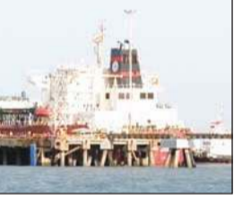
वाला पहला एलपीजी जहाज है। शिवालिक जहाज पर करीब 46 हजार मीट्रिक टन एलपीजी लदी

एजेंसी, नई दिल्ली। अमेरिका-इसराइल और ईरान के बीच जारी जंग के बीच एलपीजी केरियर जहाज शिवालिक कतर से गैस लेकर भारत पहुंच गया है। यह जहाज सोमवार शाम 5 बजे गुजरात के मुंद्रा पोर्ट पर पहुंचा। यह जहाज 14 मार्च को होर्मुज स्ट्रेट पार कर भारत की ओर रवाना हुआ था। मिडिल-ईस्ट में जारी संघर्ष के बीच यह भारत पहुंचने