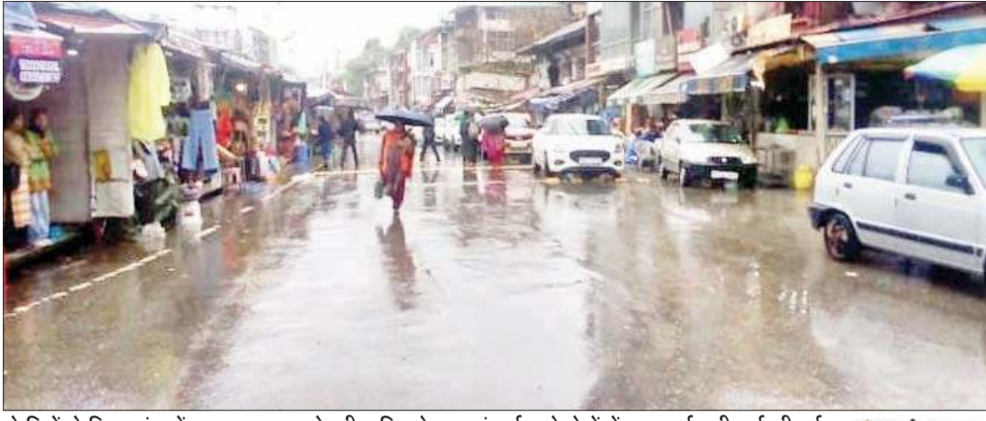
दो दिनों से जिला चंबा में रुक-रुक कर हो रही बारिश के बाद ऊंचाई वाले क्षेत्रों में ताजा बर्फबारी दर्ज की गई ।