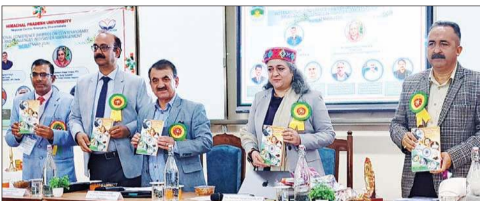
70 हजार लोगों को सिविल डिफेंस के लिए प्रशिक्षित किया जाएगा।