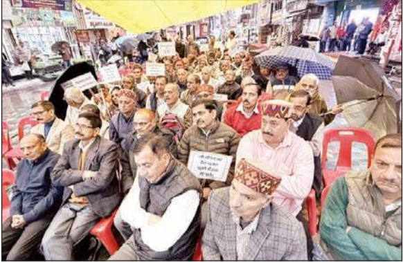
गांधी चौक में धरना-प्रदर्शन करते पेंशनर्स।

विक्रम डटवालिया, हमीरपुर। हमीरपुर के गांधी चौक पर सोमवार को हिमाचल प्रदेश पेंशनर्स संयुक्त संघर्ष समिति के आह्वान पर जिले के पेंशनरों ने जनवरी 2016 से देय संशोधित वेतनमान तथा पेंशन के एरियर का भुगतान न किए जाने के विरोध में धरना-प्रदर्शन किया। वहीं, डीसी के माध्यम से प्रदेश सरकार को ज्ञापन भेजकर मांग की कि उनकी देनदारियों का आगामी बजट में प्रावधान किया जाए, अन्यथा 30 मार्च को प्रदेशभर के हजारों पेंशनर्स विधानसभा का घेराव करेंगे।