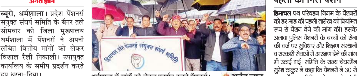
धर्मशाला में मांगों को लेकर प्रदर्शन करते पेंशनर्स।

लंबित वित्तीय लाभों की मांग को लेकर प्रदेश सरकार पर साधा निशाना