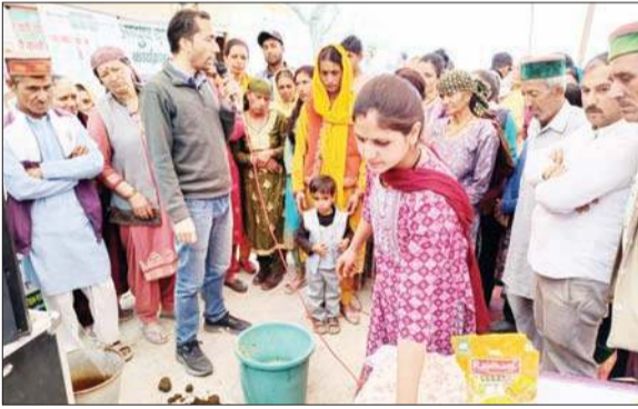
मेले में किसानों को जैविक खाद व दवा बनाने प्रशिक्षण का दिया।

मेले के दौरान अनुभवी आयुर्वेदिक चिकित्सकों द्वारा निःशुल्क चिकित्सा शिविर लगाया