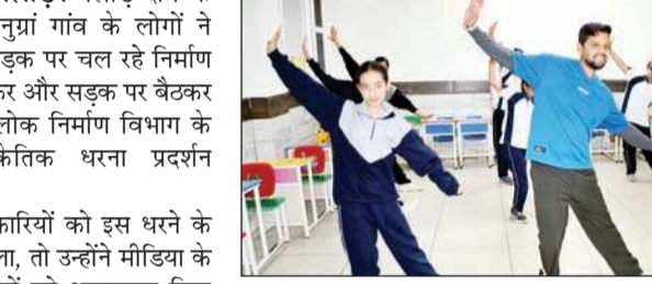
खेल, नृत्य तथा कला से संबंधित गतिविधियां आयोजित होंगी।