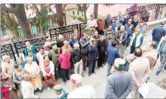
शिमला में मांगों को लेकर प्रदर्शन करते पेंशनर्स।

उन्होंने कहा कि यदि समय रहते उनकी समस्याओं का समाधान नहीं किया गया तो पेंशनरों को मजबूर होकर आंदोलन को और