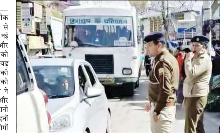
पीक आवर्स के दौरान यातायात व्यवस्था संभालते पुलिस कर्मी। अनंत ज्ञान

ब्यूरो, शिमला। शिमला शहर में पीक आवर्स के दौरान बढ़ते ट्रैफिक जाम से राहत दिलाने के लिए जिला पुलिस ने नई व्यवस्था लागू की है। कार्यालयों और विद्यालयों के समय सुबह तथा शाम को सड़कों पर वाहनों का दबाव अचानक बढ़ जाने से कई प्रमुख मार्गों पर जाम की स्थिति बन जाती है। इसी समस्या को ध्यान में रखते हुए पुलिस प्रशासन ने यातायात प्रबंधन को अधिक सुदृढ़ और प्रभावी बनाने के लिए विशेष निगरानी व्यवस्था शुरू की है, ताकि शहर में वाहनों की आवाजाही सुचारु बनी रहे और लोगों को अनावश्यक परेशानी का सामना न करना पड़े।