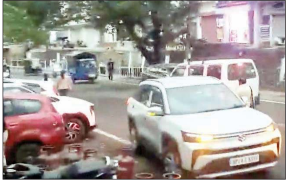
दिन में लाइट जला कर चलते वाहन।

अनंत ज्ञान ब्यूरो, बिलासपुर। जिला बिलासपुर में सोमवार को मौसम ने अचानक करवट ले ली। घने काले बादलों, धुंध व तेज हवाओं के कारण दिन में ही अंधेरे जैसा माहौल बन गया, जिससे सड़कों पर चल रहे वाहन चालकों को दिन के समय ही गाड़ियों की लाइटें जलाकर सफर करना पड़ा। सुबह से ही आसमान में बादल छाए। रात व कई क्षेत्रों में हल्की बूँदाबादी के साथ ओलावृष्टि भी हुई। ओले गिरने के कारण तापमान में अचानक गिरावट दर्ज की गई, जिससे जिले