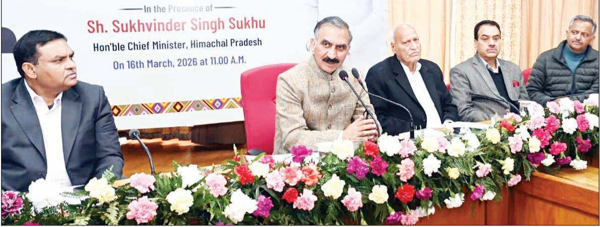
राष्ट्रीय डेयरी विकास बोर्ड के साथ आयोजित बैठक की अध्यक्षता करते हुए मुख्यमंत्री सुखविंद सिंह सुखू।

ब्यूरो, शिमला। प्रदेश में डेयरी क्षेत्र को सशक्त बनाकर किसानों की आय बढ़ाने की दिशा में सरकार ने एक महत्वपूर्ण कदम उठाया है। राज्य सरकार और राष्ट्रीय डेयरी विकास बोर्ड (एनडीडीबी) के बीच तीन अहम समझौता ज्ञापनों पर हस्ताक्षर किए गए हैं। मुख्यमंत्री सुखविंद सिंह सुखू की उपस्थिति में हुए इन समझौतों का उद्देश्य दुग्ध उत्पादन, प्रसंस्करण और विपणन व्यवस्था को आधुनिक बनाना तथा किसानों को पारदर्शी और समय पर भुगतान सुनिश्चित करना है। मुख्यमंत्री ने कहा कि सरकार डेयरी उत्पादों को अब हिम ब्रांड के तहत बाजार में बेचेगी। सरकार की प्राथमिकता गांवों की अर्थव्यवस्था को मजबूत करते हुए किसान के हाथ में सीधे पैसा पहुंचाना है। सीएम सुखू ने कहा कि राज्य सरकार प्रदेश के विभिन्न स्थानों पर मिल्क प्रोसेसिंग यूनिट स्थापित करने पर आने वाले समय में 300 करोड़ खर्च करेगी। समझौते के तहत कांगड़ा जिले में नई मिल्क यूनिट का गठन किया जाएगा, जिसमें कांगड़ा, ऊना, हमीरपुर और चंबा जिलों को शामिल किया गया है। इससे दुग्ध संग्रहण, प्रसंस्करण और विपणन व्यवस्था को व्यापक आधार मिलेगा। कांगड़ा जिले के ढगवार में लगभग 250