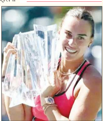
रनरअप और आर्यना सबालेंका ट्रॉफी के साथ। एलिना रायबाकिना रनरअप और आर्यना सबालेंका चुकी थीं। एलिना रायबाकिना ट्रॉफी के साथ। (अनंत ज्ञान)