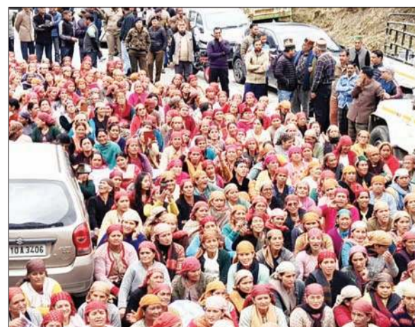
दूध उत्पादक विरोध-प्रदर्शन करते हुए। अनंत ज्ञान

आत्मा सिंह, रामपुर शहर। दत्तनगर में सोमवार को दूध उत्पादकों ने अपनी मांगों को लेकर जोरदार प्रदर्शन करते हुए मिल्क प्लांट के समीप एनएच पर चक्का जाम किया। हिमाचल दूध उत्पादक संघ के बैनर तले आयोजित इस प्रदर्शन में उत्पादकों ने दूध के भुगतान में देरी और अन्य लंबित मांगों को लेकर रोष जताया। दूध उत्पादकों का कहना है कि वे अपनी समस्याओं को लेकर कई बार संबंधित विभाग से लिखित और मौखिक रूप से संपर्क कर चुके हैं, लेकिन अब तक उनकी मांगों पर कोई ठोस कार्रवाई नहीं हुई। इससे उन्हें आर्थिक नुकसान उठाना पड़ रहा है और परिवारों का भरण-पोषण करना भी मुश्किल हो गया है। संघ के प्रतिनिधियों ने बताया कि सबसे बड़ी समस्या दूध के