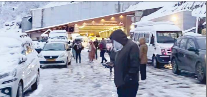
बर्फबारी के चलते फंसे वाहन।