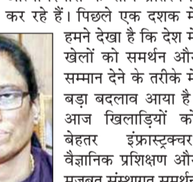
ने जमीनी स्तर पर खेलों के विकास के महत्व पर भी जोर दिया। उन्होंने कहा कि भारतीय खेलों की असली ताकत गांवों, कस्बों और स्कूलों को बेहतर छिपी हुई प्रतिभाओं में है, जिन्हें पहचानने और आगे बढ़ाने की जरूरत है। यदि हम कोचिंग, बुनियादी ढांचे और प्रशिक्षण पर भी जोर देंगे, तो भारत लगातार विश्वस्तरीय खिलाड़ी तैयार कर सकता है। पीटी उषा ने खेल पत्रकारिता की भूमिका को भी महत्वपूर्ण बताते हुए कहा कि खेल पत्रकार केवल परिणाम बताने वाले नहीं होते, बल्कि वे खिलाड़ियों के संघर्ष, भावनाओं और उपलब्धियों को कथानकों को सामने लाते हैं। जिम्मेदार और गहन खेल पत्रकारिता देश में खेलों की मजबूत नींव तैयार करती है।

प्रशिक्षण और संस्थागत समर्थन के कारण भारतीय खिलाड़ी अब वैश्विक मंच पर अधिक आत्मविश्वास के साथ प्रतिस्पर्धा कर रहे हैं। पिछले एक दशक में हमने देखा है कि देश में खेलों की समर्थन और सम्वान देने के तरीके में बड़ा बदलाव आया है। आज खिलाड़ियों को बेहतर इंफ्रास्ट्रक्चर, वैज्ञानिक प्रशिक्षण और मजबूत संस्थागत समर्थन मिल रहा है। पीटी उषा ने जमीनी स्तर पर खेलों के विकास के महत्व पर भी जोर दिया। उन्होंने कहा कि भारतीय खेलों की असली ताकत गांवों, कस्बों और स्कूलों को बेहतर छिपी हुई प्रतिभाओं में है, जिन्हें पहचानने और आगे बढ़ाने की जरूरत है। यदि हम कोचिंग, बुनियादी ढांचे और प्रशिक्षण पर भी जोर देंगे, तो भारत लगातार विश्वस्तरीय खिलाड़ी तैयार कर सकता है। पीटी उषा ने खेल पत्रकारिता की भूमिका को भी महत्वपूर्ण बताते हुए कहा कि खेल पत्रकार केवल परिणाम बताने वाले नहीं होते, बल्कि वे खिलाड़ियों के संघर्ष, भावनाओं और उपलब्धियों को कथानकों को सामने लाते हैं। जिम्मेदार और गहन खेल पत्रकारिता देश में खेलों की मजबूत नींव तैयार करती है।