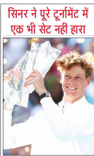
सिनर ने पूरे टूर्नामेंट में एक भी सेट नहीं हारा

एजेंसी, कैलिफोर्निया। कैलिफोर्निया में रविवार को खेले गए प्रतिष्ठित इंडियन वेल्स 2026 टैनिंस टूर्नामेंट के फाइनल में इटली के स्टार खिलाड़ी यानिक सिनर ने रूस के दानिल मेदवेदेव को सीधे सेटों में हराकर अपना पहला इंडियन वेल्स खिताब जीत लिया। कैलिफोर्निया के रेगिस्तानी मौसम में खेले गए इस मुकाबले में सिनर ने शानदार प्रदर्शन करते हुए पूरे मैच में दबदबा बनाए रखा। उन्होंने मैच के दौरान 28 विनर्स और 10 ऐस लगाए तथा नेट पर खेले गए सभी आठ अंकों में सफलता हासिल की। साल का यह उनका पहला खिताब है। इसके साथ ही वह 1990 के बाद पहले खिलाड़ी बन गए हैं जिन्होंने लगातार दो मास्टर्स 1000 खिताब बिना एक भी सेट गंवाए जीते हैं। पेरिस में पिछले वर्ष जीते खिताब से शुरू हुई उनकी जीत की लय इस श्रेणी में 11 मैचों तक पहुंच गई है। सिनर इतिहास में ऐसे तीसरे खिलाड़ी बन गए हैं, जिन्होंने सभी छह एटीपी मास्टर्स 1000 हाई-कोर्ट खिताब जीते हैं। इस उपलब्धि के साथ वह टैनिंस के दिग्गज नोवाक जोकोविच और रोजर फेडरर के विशेष क्लब में शामिल हो गए। (अनंत ज्ञान)