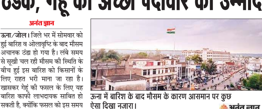
ऊना में बारिश के बाद मौसम के कारण आसमान पर कुछ ऐसा दिखा नजारा।