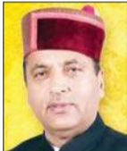
इलेक्ट्रिक स्कूटी के लिए 25 हजार रुपए की सब्सिडी देने की घोषणा की गई थी, लेकिन आज तक यह योजना धरातल पर नजर नहीं आती। इसी तरह प्रदेश में छह ग्रीन कार्सिडार बनाने की घोषणा की गई, जबकि दूसरी ओर इलेक्ट्रिक चांसिंग पर छह रुपये प्रति यूनिट पर्यावरण उपकर लगा दिया गया, जो सरकार की नीतियों में विशेषांश के दर्शाता है। जयराम ने कहा कि सरकार ने हर विधानसभा क्षेत्र में आदर्श स्वास्थ्य संस्थान खोलने, चंबा, नाहन और हमीरपुर में पैट स्कैनिंग शुरू करने, किसानों, बागवानों, खिलाड़ियों और जनजातीय क्षेत्रों के लोगों के लिए कई योजनाओं की घोषणा की थी, लेकिन उनमें से अधिकांश योजनाएं फाइल में बाहर नहीं निकल पाई हैं।

नेता प्रतिपक्ष ने कहा कि सरकार ने बजट और चुनावी भाषणों के बीच का अंतर ही भुला दिया है। उनके