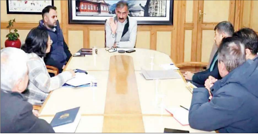
शिमला में सीएम सुखविंद सिंह सुकखू विभागीय बैठक की अध्यक्षता करते हुए।

मुख्यमंत्री सुखविंद सिंह सुकखू ने वित्त वर्ष 2026-27 के बजट को अंतिम रूप देने के लिए शिमला में विभागीय अधिकारियों के साथ विस्तृत बैठक की। बैठक में राज्य की आय बढ़ाने के उपायों, अनावश्यक खर्चों में कटौती और विभिन्न विभागों से प्राप्त प्रस्तावों पर