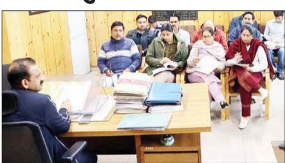
धर्मशाला में हुई जिलास्तरीय समिति की बैठक।

अनंत ज्ञान कौशल विकास, और व्यवसायिक सहायता में 63.80 लाख रुपए की मदद दी गई है, जबकि 6 लाभार्थियों को प्रतियोगी परीक्षा कॉचिंग के लिए 4.43 लाख रुपयों की सहायता प्रदान की गई है। इसके अलावा, 23 स्टार्टअप लाभार्थियों को 32.20 लाख रुपए, 113 विवाह अनुदान लाभार्थियों को 2.24 करोड़ रुपए, और गृह निर्माण के लिए 136 लाभार्थियों को 1.36 करोड़ रुपयों की सहायता दी गई। इस अवसर पर जिला स्तरीय समिति द्वारा उच्च शिक्षा के दो, व्यावसायिक शिक्षा के एक, विवाह अनुदान के एक, गृह निर्माण के 21 तथा स्टार्टअप के पांच मामलों को अनुमोदन प्रदान किया गया। इसके अतिरिक्त उच्च शिक्षा के 21, व्यावसायिक शिक्षा के दो तथा विवाह अनुदान के 11 मामलों को पूर्व कार्याचर स्वीकृति प्रदान की गई। इन सभी मामलों पर कुल 28.75 लाख रुपए की राशि स्वीकृत की गई।