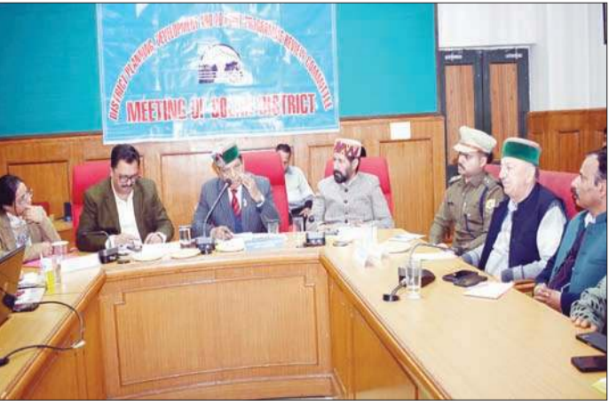
बैठक की अध्यक्षता करते मंत्री कर्नल शांडिल।

ब्यूरो, सोलन। सोलन में जिला योजना, विकास एवं 20-सूत्री कार्यक्रम समीक्षा समिति की बैठक आयोजित की गई, जिसकी अध्यक्षता स्वास्थ्य एवं परिवार कल्याण, सामाजिक न्याय एवं अधिकारिता तथा सैनिक कल्याण मंत्री कर्नल डॉ. धनीराम शांडिल ने की। इस अवसर पर उन्होंने कहा कि 20-सूत्री कार्यक्रम के अंतर्गत आने वाली योजनाओं के लक्ष्य समय पर पूरे किए जाने से ही समाज के विभिन्न वर्गों को समुचित लाभ मिल सकता है। उन्होंने कहा कि बैठक का मुख्य उद्देश्य उन योजनाओं की समीक्षा करना है जो समाज के कमजोर और वंचित वर्गों के उत्थान में महत्वपूर्ण भूमिका निभाती हैं। डॉ. शांडिल ने अधिकारियों को निर्देश दिए कि योजनाओं के क्रियान्वयन