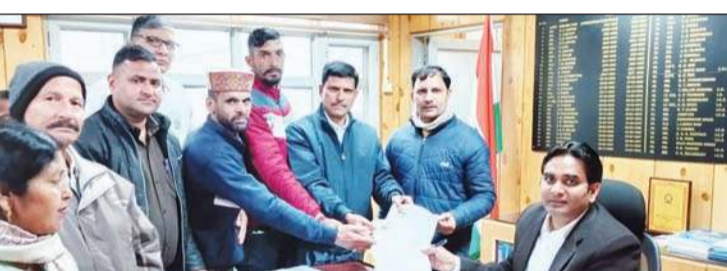
जिला प्रशासन के माध्यम से पीएम और सीएम को ज्ञापन भेजा।