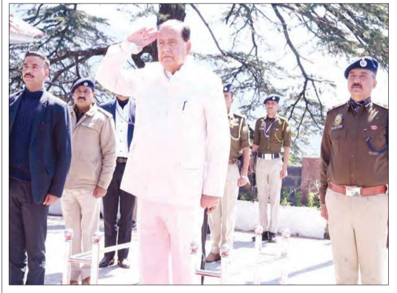
अनंत ज्ञान, शिमला। बजट सत्र के 11वें दिन की कार्यवाही का संचालन करने से पहले विधानसभा अध्यक्ष कुलदीप सिंह पटनिया सचिवालय पहुंचने पर गार्ड ऑफ ऑनर की सलामी लेते हुए।

जवाब में स्वास्थ्य मंत्री धनीराम शांडिल ने बताया कि 33181 लाभार्थियों को पेंशन दी जा रही है। इस योजना में वे हर लाभार्थियों को माह में 3 लाख रुपए मासिक पेंशन दे रहे हैं। रणधीर शर्मा ने पूछा कि 1100 पेंशन लाभार्थियों को कब तक पेंशन दी जाएगी, जवाब में स्वास्थ्य मंत्री ने कहा कि जल्द ही बाकी लाभार्थियों को भी पेंशन दी जाएगी।