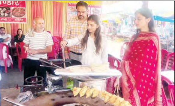
होली मेले में खाद्य सुरक्षा विभाग के अधिकारी विभिन्न दुकानों का निरीक्षण करते हुए, साथ ही इस दौरान उन्होंने दुकानदारों को जरूरी दिशा-निर्देश भी दिए।