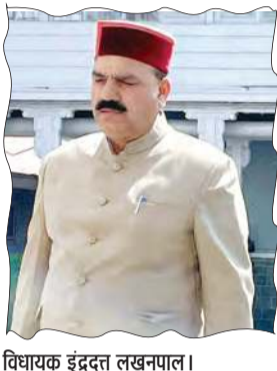
विधायक इंद्रदत्त लखनपाल।