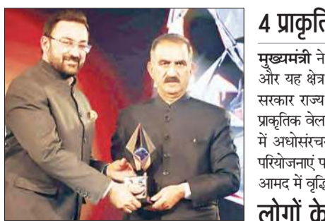
दिल्ली में मिला सम्मान

सीएम ने कहा कि प्रदेश सरकार हिमाचल को वर्ष 2026 तक देश के पहले हरित ऊर्जा राज्य के रूप में स्थापित करने के लिए ठोस प्रयास कर रही है। सकारात्मक क्षेत्र में हिमाचल प्रदेश पावर कॉरपोरेशन लिमिटेड ने वर्ष 2026-27 तक 500 मेगावाट क्षमता की सौर ऊर्जा परियोजनाएं स्थापित करने का लक्ष्य रखा है। इस लक्ष्य को हासिल करने के लिए हिमाचल प्रदेश पावर कॉरपोरेशन लिमिटेड के माध्यम से 626 मेगावाट क्षमता की सौर ऊर्जा परियोजनाएं विकास के विभिन्न चरणों में है।