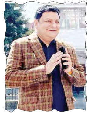
विधायक सुधीर शर्मा।