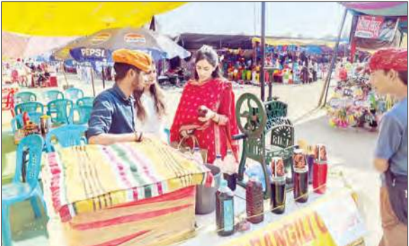
होली मेले में खाद्य सुरक्षा विभाग के अधिकारी विभिन्न दुकानों का निरीक्षण करते हुए, साथ ही इस दौरान उन्होंने दुकानदारों को जरूरी दिशा-निर्देश भी दिए।