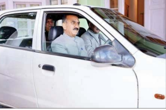
मुख्यमंत्री सुखविंद सिंह सुक्खू बजट 2025-26 प्रस्तुत करने के लिए ऑल्टो कार से विधानसभा पहुंचे। बीते साल भी बजट पेश करने के लिए सीएम अपनी कार से पहुंचे थे। ओकओवर से खुद कार चलाकर विधानसभा पहुंचे। मंत्री-विधायक भी मौजूद रहे।