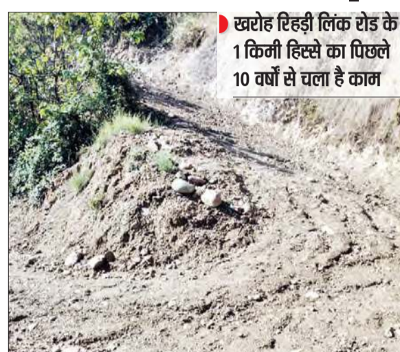
खरोह रिहड़ी लिंक रोड के 1 किमी हिस्से का पिछले 10 वर्षों से चला है काम

दोनों सरकारों से 6 लाख का बजट भी मिल चुका है जिसका जनता को कोई फायदा नहीं हुआ। इस लिंक रोड को धर्मपुर लोक निर्माण विभाग द्वारा बनवाया जा रहा है विभाग हर तीन चार महीने बाद जेसीबी मशीन आती है और इस रोड को खुदाई कर चले जाती है और जब बरसात होती है तो सड़क पर डाली गई पुरी मिट्टी नीचे बह जाती है जिस कारण स्थिति यह बन गई है की अगर कोई सरकार इस सड़क को बनाने का प्रयास भी करे तो मिट्टी तक भी बाहर से मंगानी पड़ सकती है। (अनंत ज्ञान)