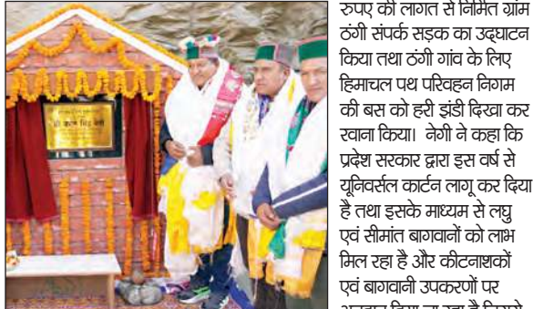
ग्रामीण आर्थिकों को बल मिल रहा है।