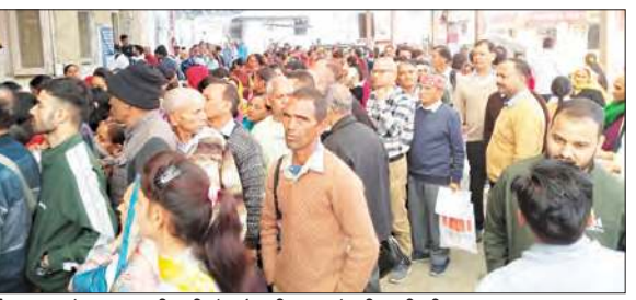
पची काउंटर के बाहर लगी मरीजों और तीमारदारों की भारी भीड़।

वीरवार को भी इस भीड़ में मरीजों के लिए कई दिक्कतें खड़ी कर रहीं, जो मरीज लाइन में सुबह 9 बजे के आसपास लग गए, उनकी लाइन लगातार लंबी होती गई, फिर हुआ यह कि कइयों का नंबर 11 बजे तो कइयों