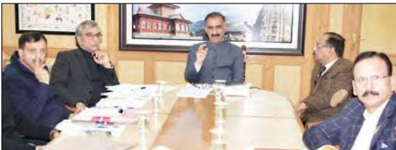
बैठक के दौरान मौजूद मुख्यमंत्री व अन्य विभागों के अधिकारी।

यह जानकारी मुख्यमंत्री सुखचिंद्र सिंह सुखू ने हिमाचल प्रदेश राज्य विद्युत बोर्ड लिमिटेड, ऊर्जा व अन्य संबंधित विभागों की बैठक की अध्यक्षता करते हुए दी। सुखू ने कहा कि 'कम एंड इंसटाल सोलर पावर प्रोजेक्ट्स' पहल के तहत सौर ऊर्जा परियोजनाओं के आवेदन व प्रक्रियाओं पर त्वरित निर्णय लेने के निर्देश दिए गए हैं। आवेदकों की सुविधा के लिए सभी अडचनों को समयबद्ध रूप