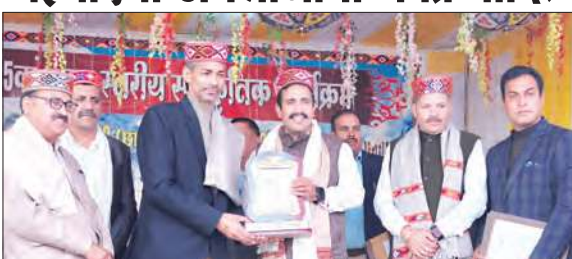
सांस्कृतिक प्रतियोगिता में बतौर मुख्यातिथि पहुंचे लोकनि मंत्री शिक्षक को सम्मानित करते हुए।