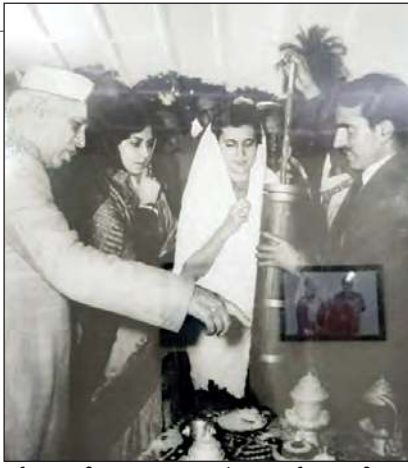
पूर्व प्रधानमंत्री स्व. जवाहर लाल नेहरू व पूर्व प्रधानमंत्री स्व. इंदिरा गांधी मनाली में। (फाइल फोटो)

नेहरू जब पहली बार मनाली आए थे तो उस समय उनके द्वारा प्रयोग की गई चीजों को आज भी धरोहर की तरह मनाली में संभालकर रखा गया है। जब देश के पूर्व प्रधानमंत्री पं. जवाहर लाल नेहरू पहली बार मनाली आए थे तो वह इसी भवन में ठहरे थे और उस वक उन्होंने जो सामान यहां पर प्रयोग किया था, उसे सहेज कर जंगली साहब की कोठी में सहेज कर रख दिया गया था जो आज भी यहां पर सुरक्षित है। इसके अलावा