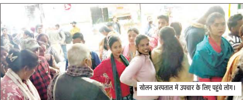
सोलन अस्पताल में उपचार के लिए पहुंचे लोग।

इससे अब अस्पताल में गायनोलॉजिस्ट के तीन डॉक्टर हो चुके हैं। ऐसे में अस्पताल में आने वाली गर्भवती महिलाओं को उपचार के लिए लाइनों में नहीं लगना पड़ेगा। साथ ही समय रहते उपचार भी मिलेगा। अस्पताल में 7 नवंबर को अस्पताल में एक अतिरिक्त गायनोलॉजिस्ट ने ज्वाइन किया है, जो लेप्रोस्कोपिक सर्जरी में भी माहिर है। अस्पताल में लंबे समय से अतिरिक्त गायनोलॉजिस्ट की मांग थी। सोलन के विधायक और स्वास्थ्य मंत्री कर्नल धनीराम शांडिल ने अस्पताल के गायनी वार्ड में बढ़ती ओपीडी को देखते हुए अतिरिक्त गायनोलॉजिस्ट की नियुक्ति किए गए हैं, जबकि अर्वाधि में सोलन की आबादी कई गुणा बढ़ चुकी है। यही कारण है कि सोलन अस्पताल में लगातार डॉक्टरों के पद सृजित करने की मांग है।