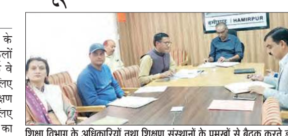
शिक्षा विभाग के अधिकारियों तथा शिक्षण संस्थानों के प्रमुखों से बैठक करते डीसी।

परख की तैयारियों के संबंध में वीरवार को शिक्षा विभाग के जिला एवं ब्लॉक स्तर के अधिकारियों तथा शिक्षण संस्थानों के प्रमुखों से वीडियो कॉन्फ्रेंसिंग के माध्यम से आयोजित बैठक में उपायुक्त ने कहा कि इस राष्ट्रीय सर्वेक्षण के आधार पर ही जिला और राज्य की रैंकिंग तय की जाएगी। उन्होंने बताया कि उच्च साक्षरता दर