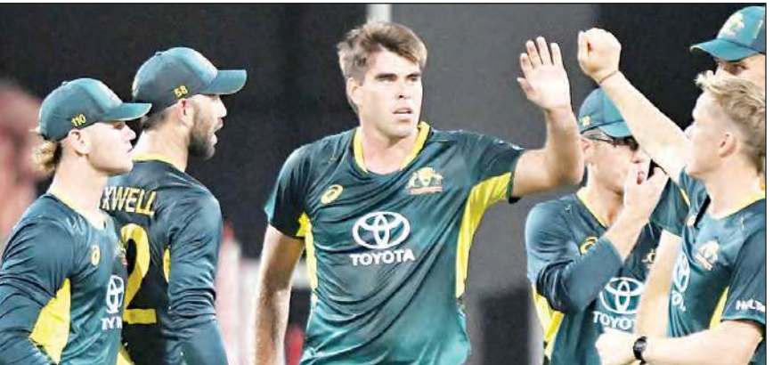
एलिस (9 रन देकर तीन विकेट) और जेवियर बार्टलेट (13 रन देकर तीन विकेट) ने पाकिस्तान का

एजेंसी, ब्रिसबेन ऑस्ट्रेलिया ने रलेन मैक्सवेल की 19 गेंदों में 43 रन की तूफानी पारी से गुरुवार को यहां बारिश के कारण सात ओवर के हुए टी-20 अंतरराष्ट्रीय मैच में पाकिस्तान को 29 रन से शिकस्त दी। बिजली चमकने और बारिश के कारण करीब तीन घंटे की देरी के बाद मैच 7-7 ओवर का कर दिया गया। मैक्सवेल ने ऑस्ट्रेलिया को सात ओवर में चार विकेट पर 93 रन बनाने में मदद की। इसके बाद पाकिस्तान की टीम ने पहली 15 गेंदों में 16 रन पर पांच विकेट गंवा दिये थे, जिससे पूरी टीम नौ विकेट पर 64 रन ही बना सकी। नाथन