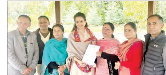
सांसद कंगना भाजपा कार्यकर्ताओं को 10 लाख रुपए का स्वीकृत पत्र सौंपती हुई।