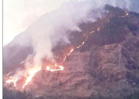
पतलीकूहल के दुआड़ा गांव के साथ लगती पहाड़ी में लगी आग।