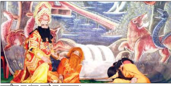
रामलीला का मंचन करते हुए कलाकार।

उन्होंने ये विचार दस दिवसीय रामलीला उत्सव की दूसरी संख्या पर वतौर मुख्यातिथि शिरकत करते हुए व्यक्त किए। उन्होंने रूपए 21000 की