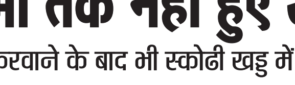
स्कोढी खड्ड में फेंका कूड़ा।

अनंत ज्ञान ब्यूरो, मंडी मंडी शहर में जहां स्वच्छता को लेकर रैलियों को आयोजन किया गया शहर को स्वच्छ बनाने में जहां हर संभव प्रयास किए जा रहे हैं वहीं धरातल पर यह कार्य बहुत की सूक्ष्म रूप में नजर आ रहे है शहर के नदी नालों में देखा जाए तो गंदगी इस कदर पसरी है कि जैसी नदी नाले कूड़े की डोंपिंग साइट हो नगर निगम द्वारा जहां रोजाना शहर में सफाई की जाती है और रोजाना स्वच्छता मित्र हर घर से कूड़ा एकत्रित करते है लेकिन बावजूद उसके फिर से नदी नालों में कूड़े के ढेर देखने को मिल रहे है। नगर निगम जहां सफाई का विशेष ध्यान रख रहा है वहीं दूसरी ओर कार्रवाई न होने पर लोग सफाई व्यवस्था को हक्के में ले रहे है एक ओर जहां लोगों को जागरूक करने के लिए विभाग द्वारा लाखां रुपए खर्च किए जा रहे है दूसरी ओर कुछ लोगों द्वारा जागरूकता अभियान की