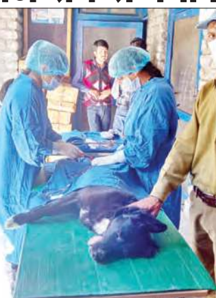
जानवरों की शल्य चिकित्सा करते विभाग के डॉक्टर।

शिविर में होली तहसील की विभिन्न पंचायतों से लगभग पचास भेड़, गाय, घोड़ा व खच्चर पालकों को पशुओं में आने वाली विभिन्न बीमारियों तथा उनके उपचार की