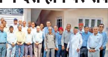
बैठक के दौरान मौजूद पेंशनर्स संघ के सदस्य।