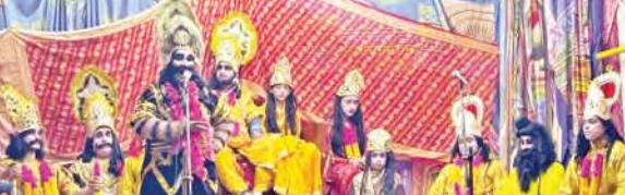
महादेव में खेली जा रही रामलीला के दूसरे दिन सीता स्वयंवर का एक दृश्य