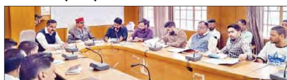
बैठक के दौरान गणमान्य लोग।