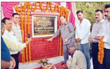
भूमि पूजन के दौरान कुलदीप पठानिया व अन्य।

विधानसभा अध्यक्ष कुलदीप सिंह पठानिया ने भटियात विधानसभा क्षेत्र की दूरराज ग्राम पंचायत बगढार में 88.85 लाख रुपए की लागत से बनने वाली सड़क का भूमि पूजन किया। खुई रोड से