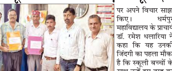
एमओयू साइन करने के दौरान गणमान्य लोग।

गुणात्मक शिक्षा एवं संसाधनों की साझेदारी विषय पर स्कूलों के साथ संवाद के माध्यम से राजकीय महाविद्यालय धर्मपुर ने एक नई पहल को शुरुआत की है।