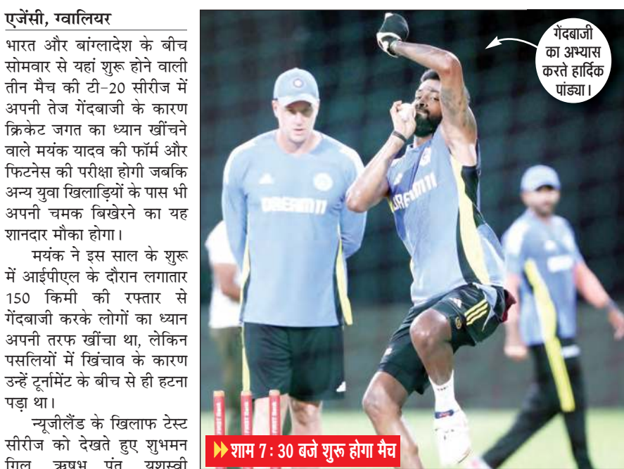
गेंदबाजी का अभ्यास करते हार्दिक पांड्या।