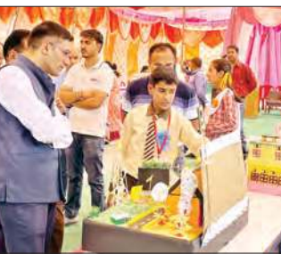
बच्चों द्वारा बनाए हुए मॉडल देते हुए उपायुक्त।