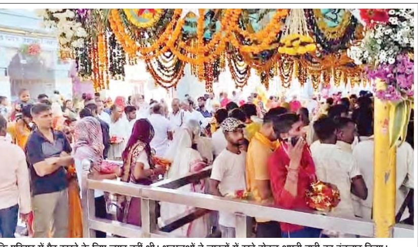
श्री ब्रजेश्वरी मंदिर में तीसरे नवरात्र को भी मंदिर श्रद्धालुओं से भरा रहा। इतनी ज्यादा भीड़ थी कि परिसर में घेर रखने के लिए जगह नहीं थी। श्रद्धालुओं ने लाइनों में खड़े होकर अपनी बारी का इंतजार किया।