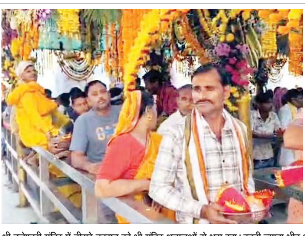
श्री ब्रजेश्वरी मंदिर में तीसरे नवरात्र को भी मंदिर श्रद्धालुओं से भरा रहा। इतनी ज्यादा भीड़ थी कि परिसर में घेर रखने के लिए जगह नहीं थी। श्रद्धालुओं ने लाइनों में खड़े होकर अपनी बारी का इंतजार किया।

जगह नहीं थी। सुबह से ही श्रद्धालु मुख्य तहसील चौक से लेकर मां के दरबार में डोल-नगाड़े बजाते हुए नाचते-गाते मां के दरबार में पहुंचे। मंदिर में इतना रथ था कि श्रद्धालुओं की लाइन मंदिर के मुख्य गेट तक पहुंच गई थी। मंदिर के प्रांगण में शनिवार को बीआरसी सराय वालों ने दूर-दूर से आए श्रद्धालुओं के लिए भंडारे का आयोजन किया था। इसमें पूरी चने, कड़ी चावल, आलू मटर, चटनी, रायता, और मीठे में