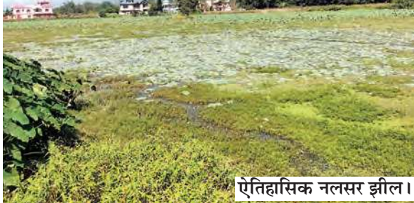
ऐतिहासिक नलसर झील।

15वें वित्त आयोग व मनरेगा के तहत झील के सौंदर्यीकरण का कार्य पूर्ण हो जाने पर इस झील की सुंदरता में और निखार आएगा।