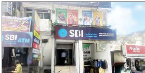
भारतीय स्टेट बैंक की शाखा का बाहरी दृश्य।

भारतीय स्टेट बैंक शाखा बनीखेत बीते कई दिनों से क्षेत्र में चर्चा का विषय बनी हुई है। बैंक के एक कर्मचारी द्वारा करोड़ों रुपए के मामले को लेकर चर्चाओं का बाजार गर्म था, किंतु इन चर्चाओं पर पुष्टि तब हुई जब करीब डेढ़ सप्ताह बाद गबन के हुए शिकार उपभोक्ताओं ने स्थानीय पुलिस थाना में जाकर एसबीआई शाखा के खिलाफ शिकायत दर्ज करवाई।