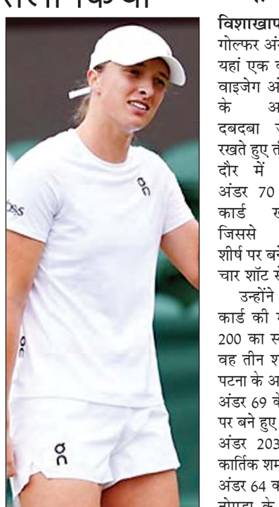
ओलंपिक में कांस्य पदक जीतने में भी मदद की थी।