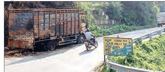
बगली रोड पर तीखे मोड़ पर खड़ा जला हुआ ट्रक।