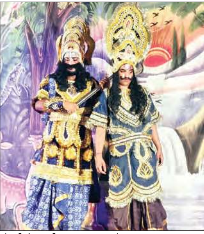
कोटली में रामलीला का मंचन करते हुए कलाकार।