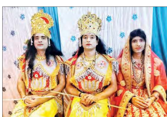
श्री रामलीला में मंचन का एक दृश्य।