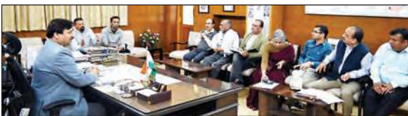
अधिकारियों के साथ बैठक करते हुए उपायुक्त।

उपायुक्त ने कहा कि शहर से सब्जी मंडी, अनाज मंडी, लक्कड़ मंडी और ट्रांसपोर्ट को बाहर स्थानांतरित करने की दिशा में प्रशासन प्रयासरत है। इसके लिए भविष्य की दृष्टि से भूमि का चयन होना बहुत जरूरी है। वहाँ बाजारों के कारण यातायात व्यवस्था को बनाए रखना प्रशासन के समक्ष एक बड़ी चुनौती रहती है। ऐसे में कई बाजार जो कार्ट रोड के साथ