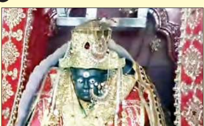
भद्रकाली भलेई माता मंदिर दर्शन करने के लिए खड़े भक्त।