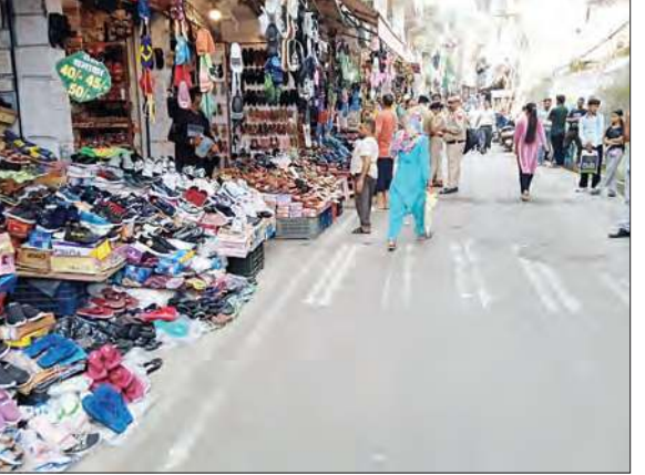
बूट व चप्पल बेचने वाले दुकानदारों को नोटिस जारी किए गए हैं।