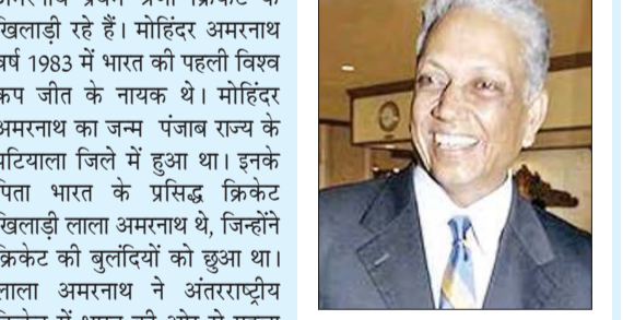
मोहिंदर अमरनाथ जन्म : 24 सितंबर, 1950