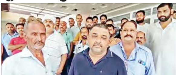
टैक्सी यूनियन के पदाधिकारी डीसी को ज्ञापन देने जाते हुए।