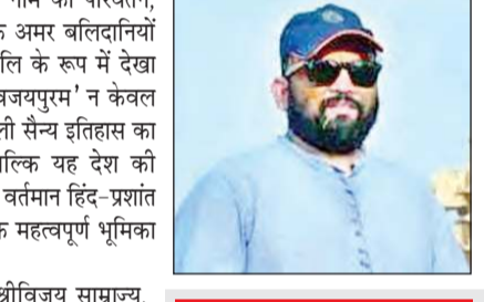
लेखक : डॉ. विमल कुमार कश्यप रक्षा मामलों के जानकार

इतिहास और वर्तमान के इस संगम से अंडमान-निकोबार भारत के सामुद्रिक प्रभाव और राष्ट्रीय सुरक्षा के लिए अत्यंत महत्वपूर्ण स्थान है। अंडमान-निकोबार द्वीप समूह का सामरिक महत्व केवल इसके भूगोल तक सीमित नहीं है, बल्कि यह भारत की समुद्री सुरक्षा और हिंद-प्राशांत क्षेत्र की व्यापक रणनीति में एक महत्वपूर्ण भूमिका निभाता है। चीन की 'स्ट्रिंग ऑफ पील्स' नीति और उसकी व्यापक 'ब्लैक पेंडेंट रोड' योजना भारत के पड़ोसी देशों में चीनी बुनियादी ढांचे का विस्तार किया है। इसी संदर्भ में भारत की 'सागर' (सिक्वोरिटी एंड ग्रोथ फॉर ऑल इन द रीजन) नीति को शामिल करने का उद्देश्य हिंद महासागर क्षेत्र में सुरक्षा और सभी के लिए विकास को सुनिश्चित करना है। (ये लेखक के निजी विचार हैं)