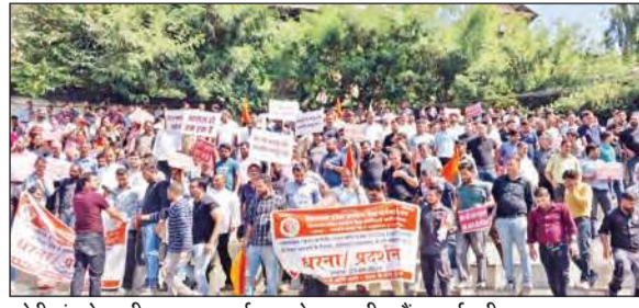
सेरी मंच के समीप धरना-प्रदर्शन करते हुए ग्रामीण बैंक कर्मचारी।