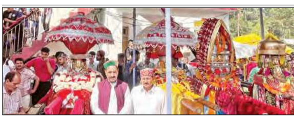
मेला नलवाड़ ख्योड़ समापन समारोह में शिरकत करते स्थानीय देवी देवता।