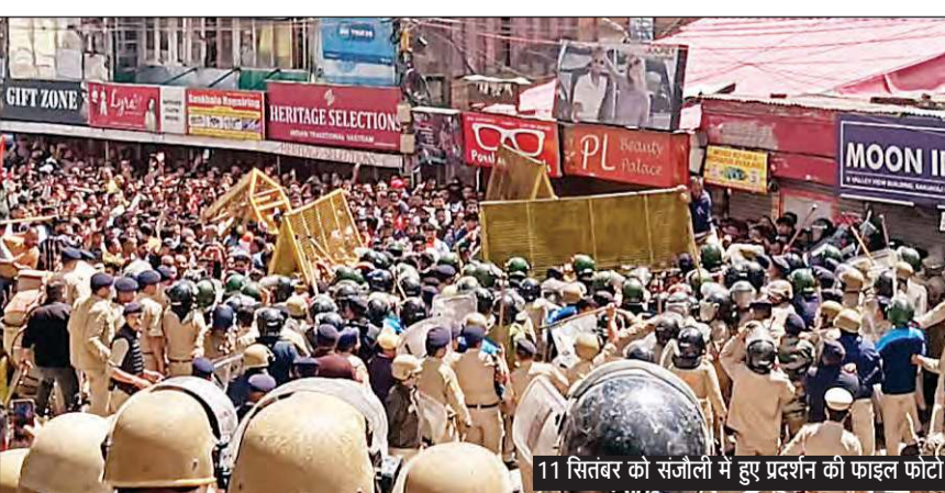
11 सितंबर को संजौली में हुए प्रदर्शन को फाइल फोटो।