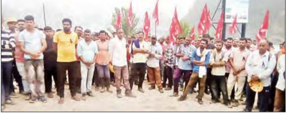
लेबर कोड कानून को लेकर मोदी सरकार के खिलाफ विरोध-प्रदर्शन करते मजदूर।