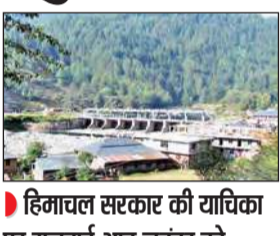
हिमाचल सरकार की याचिका पर सुनवाई आठ नवंबर को

मंडी जिले के जोगिंद्रनगर में स्थापित 110 मेगावॉट की शानन जलविद्युत परियोजना की आपत्तियां सुनने को सुप्रीम कोर्ट राजी हो गया है। हिमाचल सरकार ने सोमवार को सुप्रीम कोर्ट में पंजाब सरकार के उस केस को खारिज करने का आग्रह किया, जिसमें उसने प्रोजेक्ट से संबंधित 99 साल के लीज समझौते की समाप्ति के बाद दोबारा से परियोजना का नियंत्रण अपने अधीन लेने की अपील की है। न्यायमूर्ति