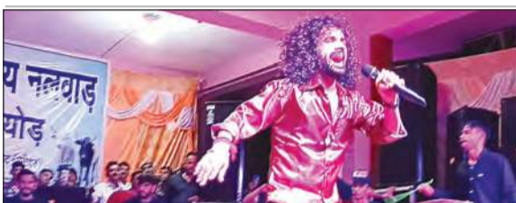
प्रस्तुति देते हुए कलाकार।

मुख्यातिथि सांसद कंगना रनौत ने कहा कि वे जीतने के बाद पहली बार नाचन में आई हैं। इस मौके पर सांसद कंगना ने बासा पंचायत को