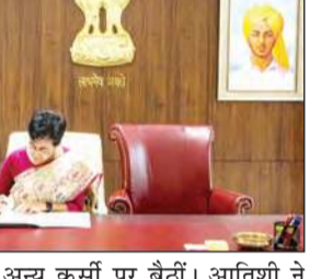
अन्य कुर्सी पर बैठीं। आतिशी ने केजरीवाल सरकार में उनके पास रहे 13 विभागों का प्रभार अपने पास रखा है, जिनमें शिक्षा, राजस्व, वित्त, बिजली और पीडब्ल्यूडी शामिल हैं।

दिल्ली की नई मुख्यमंत्री आतिशी ने सोमवार को अपना कार्यभार संभाला। उन्होंने कहा कि वह उसी तरह काम करेंगी, जैसे भरत ने अपने बड़े भाई भगवान राम की 'खड़ाऊं' को अयोध्या के सिंहासन पर रखकर काम किया था। वह मुख्यमंत्री कार्यालय में केजरीवाल की कुर्सी पर नहीं बैठीं। केजरीवाल की कुर्सी के बगल में रखी सफेद रंग की एक