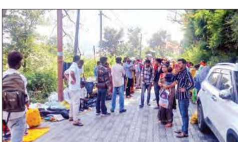
धर्मशाला में गुरुद्वारा मार्ग पर सजी मंडे मार्केट।

नगर निगम ने धर्मशाला में मंडे मार्केट लगाने वाले करीब डेढ़ दर्जन परिवारों को मार्केट को यहां से हटाने के फरमान जारी किए हैं। नगर निगम के फरमान के पीछे संजौली के मस्जिद प्रकरण के बाद प्रवासियों तथा समुदाय विशेष के खिलाफ लोगों में गुस्सा बताया जा रहा है। मूल रूप से गुजरात के ये लोग कांगड़ा शहर के आसपास रहते हैं। इनके अनुसार वे पिछले कई दशकों से धर्मशाला में मंडे बाजार लगाकर गरीब वर्ग को सस्ते कपड़े बेचकर अपने परिवार का पालन-पोषण कर रहे हैं। हालांकि नगर निगम प्रशासन ने यहां से मंडे मार्केट को हटाने का कारण इनकी दुकानों के कारण यातायात प्रभावित होने से संबंधी शिकायतें बताया है।