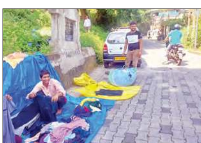
नगर निगम के फरमान पर सामान समेटते दुकानदार।

बताते चलें कि कुछ साल पहले ये लोग कोतवाली बाजार, उसके बाद कचहरी और अब गुरुद्वारा मार्ग पर मंडे मार्केट लगा रहे थे। यातायात बाधित होने की बात कहते हुए नगर निगम ने इन्हें यहां से दाड़ी शिफ्ट होने के निर्देश दिए गए हैं। सोमवार को मार्केट लगाकर बैठे दुकानदारों को नगर निगम के स्टाफ