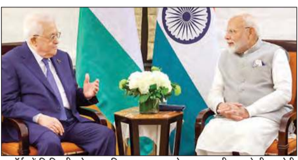
न्यूयॉर्क में फिलिस्तीन के राष्ट्रपति महमूद अब्बास के साथ बातचीत करते पीएम मोदी। सौर गठबंधन का पूर्ण सदस्य बनने पर नेपाल को बधाई दी। नेपाल इस संगठन का 101वां सदस्य है। इसके बाद मोदी ने कुवैत के युवराज शेख सबा खालिद अल-हमद अल-सबा

प्रधानमंत्री नरेंद्र मोदी ने अमेरिका की यात्रा के दौरान न्यूयॉर्क में 19वीं संयुक्त राष्ट्र महासभा के अवसर पर नेपाल, फिलिस्तीन और कुवैत के साथ संबंधों को और ज्यादा मजबूती देने के लिए तीनों देशों के नेताओं से अलग-अलग बैठकें कीं। मोदी ने नेपाल के प्रधानमंत्री केपी शर्मा ओली के साथ बैठक में भारत और नेपाल के बीच द्विपक्षीय संबंधों की समीक्षा की। दोनों नेताओं ने विकास साझेदारी और जलविद्युत क्षेत्र में सहयोग सहित विभिन्न क्षेत्रों में हुई प्रगति पर संतोष व्यक्त किया। मोदी ने अंतरराष्ट्रीय