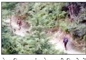
के गुरिनाल गांव के ऊपरी हिस्से में दाना धार वन क्षेत्र में तलाशी अभियान के दौरान आतंकवादियों की ओर से सुरक्षाबलों पर हमला करने के बाद मुठभेड़ शुरू हुई थी अधिकारी ने बताया कि दोनों ओर से गोलीबारी जारी है। (अनंत ज्ञान)

जम्मू-कश्मीर के किश्तवाड़ जिले में आतंकियों ने जवालों ने सुरक्षाबलों के बीच मुठभेड़ अभी भी दहशतगर्दी को घेरा जारी है। किश्तवाड़ के चटरू इलाके में 21 सितंबर से सुरक्षाबलों और आतंकियों के बीच मुठभेड़ हो रही है। सुरक्षाबलों ने दो से तीन दहशतगर्दों को घेर रखा था। पुलिस प्रवक्ता ने बताया कि चटरू इलाके