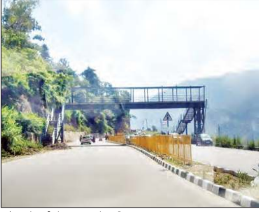
सोलन के बुरी में बना फुटओवर ब्रिज।

जिला मुख्यालय सोलन के बुरी में नेशनल हाईवे-5 पर अब स्थानीय लोगों को सड़क क्रॉस करने में जान जोखिम में नहीं डालनी पड़ेगी। यहां पर लगभग फुट ओवरब्रिज बनकर तैयार हो चुका है।