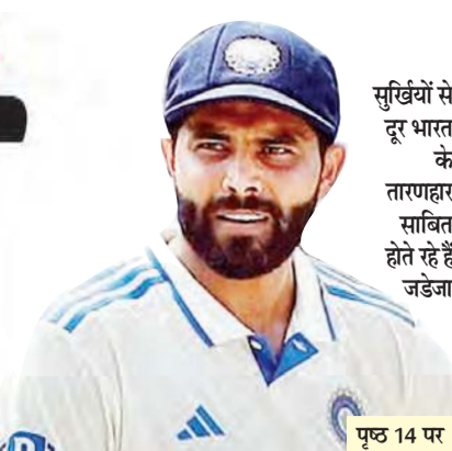
सुखियों से दूर भारत के तारणहार साबित होते रहे हैं जडेजा