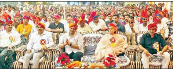
कार्यक्रम के समापन समारोह में सांसद कंगना रणौत व अन्य।