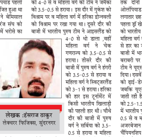
लेखक :हरराज ठाकुर लेखकर फिजिक्स, सुंदरनगर

सभी भारतीय खिलाड़ी, उनके माता-पिता व कोचिंग के साथ भारतीय शतरंज महासंघ की बधाई का पात्र है। देश में खेलों की विडम्बना यही है कि जब खिलाड़ी अंतरराष्ट्रीय स्तर पर कुछ अનોखा कर जाते हैं तो तभी उन्हें तबज्जो दी जाने लगती है। वर्तमान में हिमाचल प्रदेश के प्राइमरी विद्यालयों में खेलों को विराम लगा दिया है। जबकि विदेशों के कुछ बच्चे इसी के लगभग आयु वर्ग में ओलंपिक से मेडल जीत लाते हैं। पिछली बार 28 जुलाई से 10 अगस्त