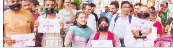
उपायुक्त कार्यालय के बाहर धरना दर्शन करते हुए लोग।

सदस्य मानसिक, सामाजिक और शारीरिक तौर पर प्रताड़ित किए जा रहे हैं।