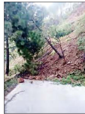
कराड़ाघाट में दरका पहाड़।

इससे यात्रियों को खासी दिक्कतें पेश आईं और गंतव्य पहुंचने में देरी हो गई। प्रशासन ने वाहनों को वाया पिपलूघाट संपर्क, वाया शिवनगर मार्ग व मांगू-सेर गलोटीया मार्ग से गंतव्य की ओर भेजा। जानकारी के अनुसार एनएच-205 वीती रात करीब 3 बजे यह मामला पेश आया, जब बिना बारिश के ही पहाड़ी दरकने से हाईवे कराड़ाघाट के पास बंद हो गया। सुबह 7:00