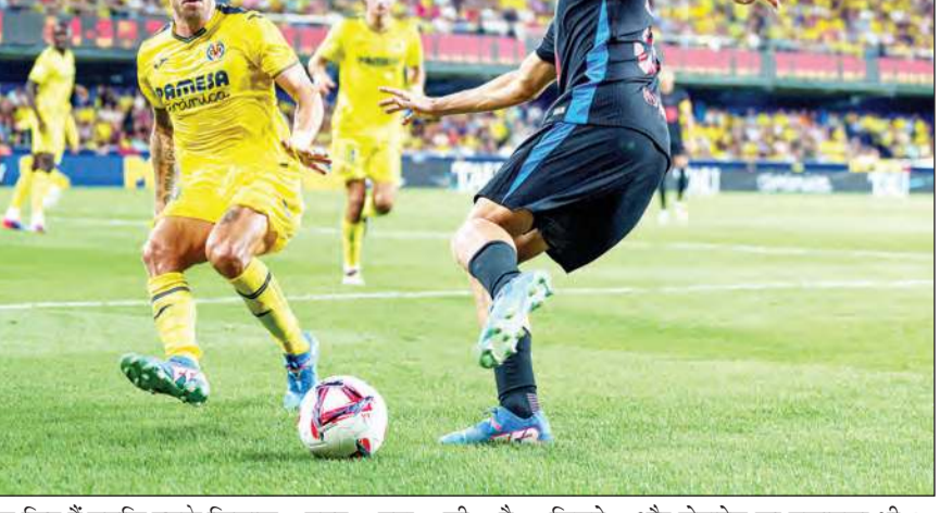
गोल किए हैं जबकि उसके खिलाफ सिर्फ पांच गोल हुए हैं।

मौजूदा सत्र में बार्सीलोना ने अब तक हुए छह मुकाबलों में 22