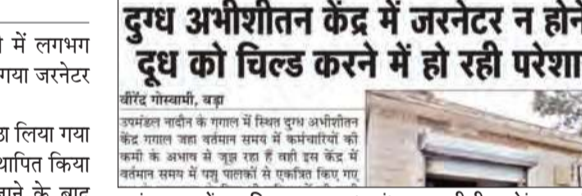
अनंत ज्ञान में प्रकाशित समाचार, (दाएं) दुग्ध अभीशीतन केंद्र जलाड़ी में स्थापित किया गया जरनेटर।

जरनेटर विभाग द्वारा यह कह कर उठा लिया गया था कि केंद्र में अतिशय नया जरनेटर स्थापित किया जाएगा, लेकिन लगभग दो वर्ष बीते जाने के बाद नया जरनेटर स्थापित नहीं किया गया। इसके चलते जलाड़ी में फोनलेन सड़क के कार्य के प्रगति में होने पर यहां आए दिन बिजली के कट लगने के कारण केंद्र का कार्य देखा रहे कर्मचारी को भारी परेशानियों का सामना करना पड़ता था। यही नहीं किसानों से एकत्रित किए गए दूध को बिजली के कट लगने के कारण केंद्र में जरनेटर की सुविधा न होने की बजह