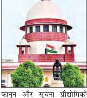
कानून और सूचना प्रौद्योगिकी (आईटी) कानून के तहत अपराध नहीं है। सुप्रीम कोर्ट ने चाइल्ड पोर्नोग्राफी और उसके कानूनी परिणामों पर कुछ दिशा-निर्देश भी जारी किए। कोर्ट ने कहा कि हमने संसद को सुझाव दिया है कि वह पोक्सो में संशोधन करे, ताकि बाल पोर्नोग्राफी की परिभाषा बदलकर 'बच्चों के साथ यौन शोषण और अश्लील सामग्री' किया जा सके।

सुप्रीम कोर्ट ने सोमवार को ऐतिहासिक फैसला देते हुए कहा कि चाइल्ड पोर्नोग्राफी (अश्लील सामग्री) देखना और डाउनलोड करना पोक्सो कानून तथा सूचना प्रौद्योगिकी कानून के तहत अपराध है। न्यायालय ने सुझाव दिया कि संसद को कानून में संशोधन कर 'बाल पोर्नोग्राफी' शब्द को बदलकर 'बच्चों के साथ यौन शोषण और अश्लील सामग्री' करने पर विचार करना चाहिए। अदालतों से 'चाइल्ड पोर्नोग्राफी' शब्द का इस्तेमाल न करने के लिए कहा। सीजेआई डीवाई चंद्रचूड़ की पीठ ने मद्रास हाईकोर्ट के उस आदेश को रद्द कर दिया, जिसमें कहा गया था कि चाइल्ड पोर्नोग्राफी देखना और डाउनलोड करना बाल यौन अपराध संरक्षण (पोक्सो)