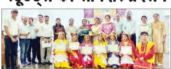
अनंत ज्ञान, पठानकोट