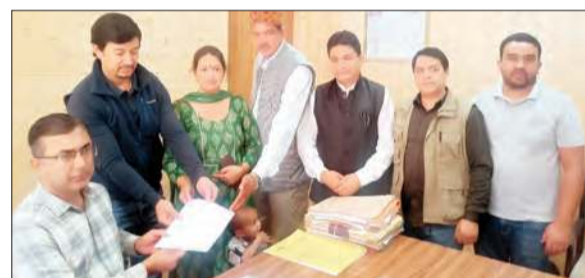
पंचायतों के प्रतिनिधि मनाली में चल रहे स्या केंद्रों के विरोध में एसडीएम को ज्ञापन सौंपते हुए।

प्रतिनिधियों का कहना है कि मनाली शहर और आसपास की 11 पंचायतों में काफी संख्या में स्या और मसाज केंद्र अवैध रूप से संचालित किए जा रहे हैं। इन स्या की आड़ में देह व्यापार का धंधा हो रहा है। इन पंचायतों में नगर परिषद मनाली, पंचायत नसोगी, शलीण, ओल्ड मनाली, शानगा, बुरुआ, पलचान, वशिष्ठ, चचोगा, प्रीणी