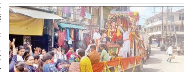
विसर्जन से पहले शोभायात्रा की तस्वीर।