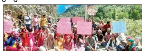
जरी मलाणा सड़क पर तीन गांव के लोग अपनी समस्या को लेकर प्रदर्शन करते हुए।

मंगलवार को तीन गांव के लोग अपनी समस्या को लेकर जरी-मलाणा सड़क पर उतरे और डैम फटने से आई बाढ़ में हुए नुकसान का आकलन न करने पर सरकार के खिलाफ धरना-प्रदर्शन कर राय प्रकट किया। इस दौरान नायब तहसीलदार के साथ भी लोगों की खूब बहस हुई। कुल्लू की मणिकर्ण घाटी के तम माह पूर्व मलाणा नाला में बाढ़ल फटने और मलाणा-एक पावर प्रोजेक्ट का बांध फटने से हुई तबाही को डेढ़ महीने से भी अधिक समय बीत गया है, लेकिन चौहकी, बलाधी गांव के प्रभावितों को पावर प्रोजेक्ट के अधिकारी सुनने को तैयार नहीं हैं।