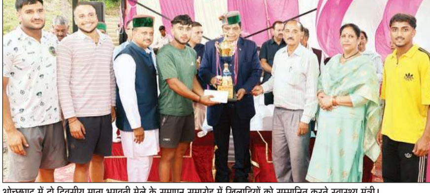
ओच्छघाट में दो दिवसीय माता भगवती मेले के समापन समारोह में खिलाड़ियों को सम्मानित करते स्वास्थ्य मंत्री।