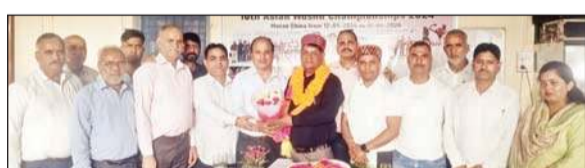
भारतीय टीम के लीडर पीएन आजाद का स्वागत करते गणमान्य।