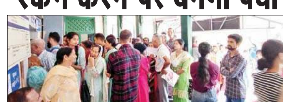
अस्पताल में पर्ची बनाने के लिए लगी लोगों की लंबी लाइन।