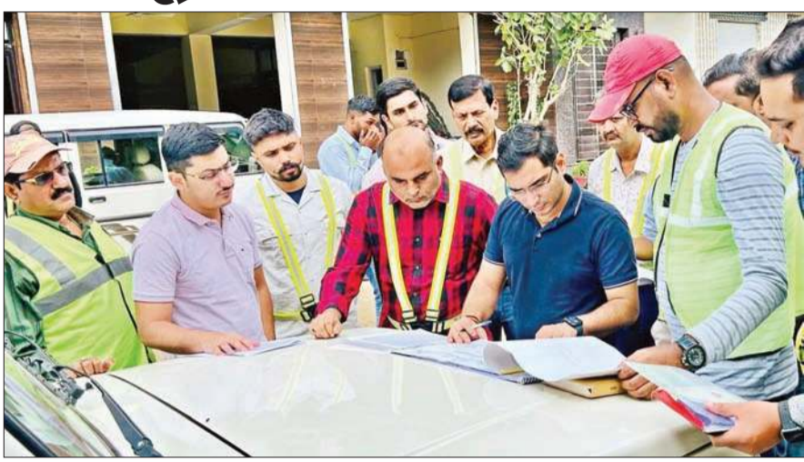
लोगों की शिकायतों के बाद हमीरपुर-अवाहदेवी-मंडी राष्ट्रीय राजमार्ग के कार्य की जांच करती उच्च स्तरीय टीम।

हमीरपुर-अवाहदेवी-मंडी राष्ट्रीय राजमार्ग का कार्य पिछले अर्द्धाई वर्ष से धीमी गति से चला हुआ है। सड़क निर्माण के दौरान कई हादसे भी हो चुके हैं और लोग भी पिछले अर्द्धाई वर्षों से एनएच 03 के निर्माण कंपनी को कार्यप्रणाली को कोस रहे हैं। एनएच के निर्माण में कंपनी की कार्यप्रणाली को लेकर कई लोगों ने सड़क परिवहन एवं राष्ट्रीय राजमार्ग मंत्रालय व प्रदेश सरकार को अपनी शिकायतें भेजी हैं।