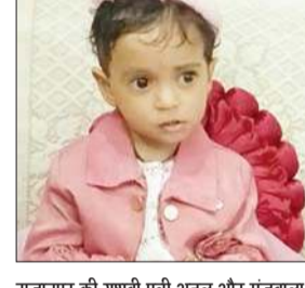
सुजानपुर की यशवी पुत्री अतुल और मज्जबाल को जन्मदिन पर 'अनंत ज्ञान' परिवार की ओर से हार्दिक शुभकामनाएं।