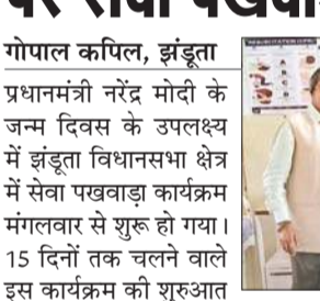
अनंत ज्ञान ब्यूरो, बिलासपुर