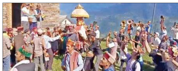
सैज के घाट खनियारागी में शौयरी मेले में उमड़ा आस्था का सैलाब।