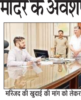
मस्जिद की खुदाई की मांग को लेकर ज्ञापन सौंपते हुए शहर के लोग।

मस्जिद के नीचे मंदिर के अवशेष, खुदाई की मांग को लेकर ज्ञापन सौंपते हुए शहर के लोग।