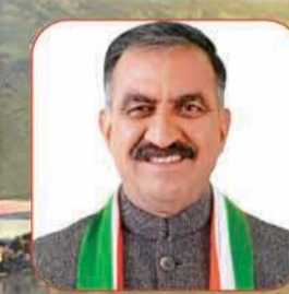
सुखविंदर सिंह सुख मुख्यमंत्री हि.प्र.

की समस्त प्रदेशवासियों को हार्दिक शुभकामनाएं