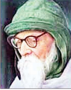
विनोबा भावे जन्म : 11 सितंबर, 1895 मृत्यु : 15 नवंबर, 1982

विनोबा भावे महात्मा गांधी के आदर्शपूर्ण अनुयायी, भारत के एक सर्वाधिक जाने-माने समाज सुधारक एवं 'भूलत यज्ञ' नामक आंदोलन के संस्थापक थे। इनकी समस्त जिंदगी साधु संन्यासियों जैसी रही, इसी कारणशः यह एक संत के तौर पर प्रख्यात हुए। विनोबा भावे अत्यंत विद्वान एवं विचारशील व्यक्तित्व वाले शख्स थे। महात्मा गांधी के परम शिष्य 'जंग ए आजादी' के इस योद्धा ने वेद, वेदांत, गीता, रामायण, कुरआन, बाइबल आदि अनेक धार्मिक ग्रंथों का उन्होंने गहन गंभीर अध्ययन मनन किया। अर्थशास्त्र, राजनीति और दर्शन के आधुनिक सिद्धांतों का भी विनोबा भावे ने गहन अवलोकन चिंतन किया। विनोबा भावे का जन्म गाहोदे, गुजरात, भारत में हुआ था। विनोबा भावे का मूल नाम विनायक नरहरि भावे था। एक कुलीन ब्राह्मण परिवार में जन्मे विनोबा ने 'गांधी आश्रम' में शामिल होने के लिए 1916 में हाई स्कूल की पढ़ाई बीच में ही छोड़ दी। गांधी जी के उपदेशों ने भावे को भारतीय ग्रामीण जीवन के सुधार के लिए एक तपस्वी के रूप में जीवन व्यतीत करने के लिए प्रेरित किया। सन 1921 से लेकर 1942 तक अनेक बार जेल यात्राएं हुईं। सन 1922 में नागपुर का झंझ सत्याग्रह किया। ब्रिटिश हुकूमत ने सीआरपीसी की धारा 109 के तहत विनोबा को गिरफ्तार किया। इस धारा के तहत आठ महीने की गिरफ्तार किया जाता है। नागपुर जेल में विनोबा को पत्थर तोड़ने का काम दिया गया। कुछ महीनों के पश्चात अकोला जेल भेजा गया।