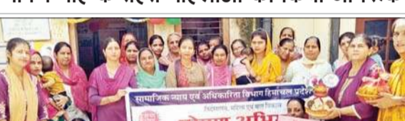
पोषण माह के तहत एक कार्यक्रम में हिस्सा लेने वाली महिलाएं।