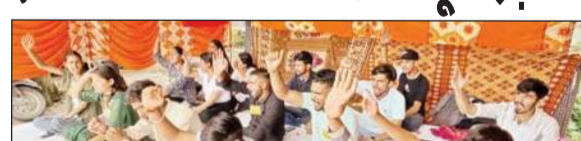
भूख हड़ताल करते हुए एबीवीपी के कार्यकर्ता।