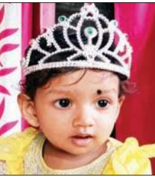
बलद्वारा खुदवा की लक्षिका को जन्मदिन पर 'अनंत ज्ञान' परिवार की ओर से हार्दिक शुभकामनाएं।