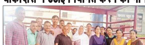
चौकीदार संघ की बैठक के उपरांत संघ के पदाधिकारी व सदस्य।