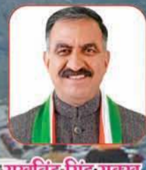
सुखविंदर सिंह सुख मुख्यमंत्री हि.प्र.

की समस्त प्रदेशवासियों को हार्दिक शुभकामनाएं