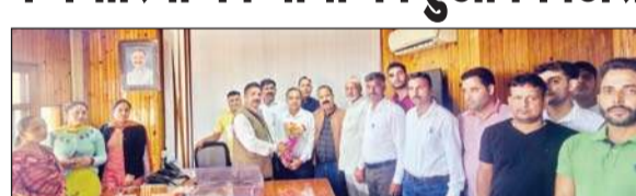
सहकारी सभाएं कर्मचारी संघ के पदाधिकारी प्रबंध निदेशक से मिलने के दौरान।