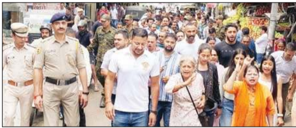
प्रदर्शन करते हुए तथा (नीचे) निगम कार्यालय में हनुमान चालीसा का पाठ करते शहरवासी।