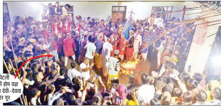
कोटली तुंगल में होम यज्ञ के दौरान देवी-देवता और गुरु

नैना उग्रतारा माता के मंदिर में विशाल जाग का आयोजन किया गया जो लगातार 51 वर्षों से हर साल हो रहा है। इस जाग में हजारों लोगों ने माता के मंदिर में अपनी हाजिरी भर कर सुख शांति