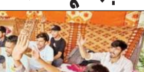
भूख हड़ताल करते हुए एबीवीपी के कार्यकर्ता।