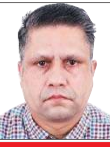
लेखक : सुखदेव सिंह वरिष्ठ पत्रकार, नूरपुर

केयर कार्ड योजना में इलाज करवाकर मानवता की सेवा की जाएगी। चंडीगढ़ पीजीआई अस्पताल में हिमकेयर कार्ड चलने से मरीजों को बहुत लाभ मिलता था। हिमाचल प्रदेश में 31 लाख हिमकेयर कार्ड होल्डर को 292 अस्पताल स्वास्थ्य सुविधाएं उपलब्ध करवा रहे थे। अभी तक कुल 7,707,44 मरीजों का इलाज हुआ, 998 करोड़ खर्च और 370 करोड़ रुपए की देनदारी अभी प्रदेश सरकार को चुकता करनी है। प्रदेश सरकार ने फिलहाल 100 करोड़ रुपए का भुगतान करके कुछेक अस्पतालों में हिमकेयर योजना कार्ड चलाया था। राज्य सरकार पर 87 करोड़ रुपए की कर्जदारी अगर समय रहते खर्चों में कटौती नहीं की, तो हालात बद से बदतर बनने वाले हैं। सरकार ने 125 बिजली यूनिट की सब्सिडी बंद करके एक बहस को छेड़ दिया है। सरकारी मशीनरी में इस फैसले को लेकर असमंजस्य इसलिए कि अगस्त महीने में भी उक्त सुविधा मिलने की बात उजागर हुई है। कांग्रेस ने चुनावों की बेला पर जनता को 300 बिजली यूनिट मुफ्त दिए जाने की घोषणा की थी। राज्य सरकार ने अपनी घोषणा पूरी करने के बजाय 125 बिजली यूनिट की सब्सिडी को खत्म करके विरोधाभास की स्थिति पैदा कर