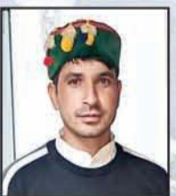
आजम डार संवाददाता चुराह