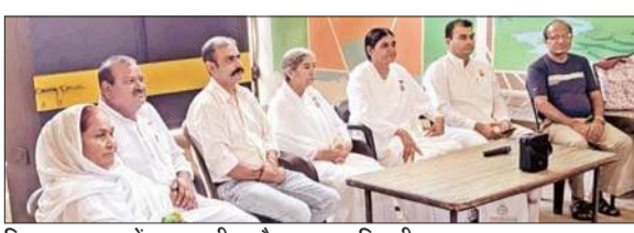
जिला सुधार गृह में ब्रह्मकुमारीज और अन्य पदाधिकारी।

इस अवसर पर जिला ऊना केंद्र की प्रमुख आशा दीदी ने में उपस्थित दो सौ से अधिक सजायापता और विचारार्थी कैदियों को आंतरिक व्यक्तिक विकास हेतु मूल्यों के विकास में एकाग्रता को जीवन में सिद्ध करने के लिए योग बल का