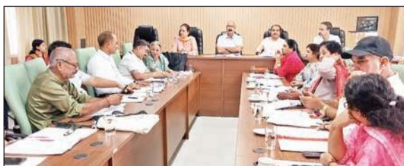
बैठक के दौरान चर्चा करते हुए सामूहिक चित्र में।