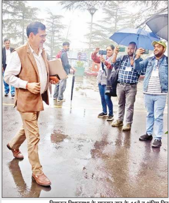
हिमाचल विधानसभा के मानसून सत्र के 11वें व अंतिम दिन मंगलवार को सदन की कार्यवाही में भाग लेने के लिए सचिवालय की तरफ जाते कांग्रेस व भाजपा के विधायक। अंतिम दिन प्रदेश की वित्तीय स्थिति, संजोली मरिजद विवाद और अरवि खनन के अलावा शिक्षा और कानून व्यवस्था पर चर्चा हुई।