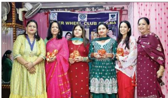
इन्नर व्हील क्लब की सदस्य तीज का पर्व मनाती हुईं।