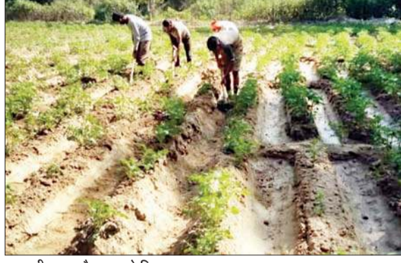
आलू की फसल तैयार करते किसान।

जिले में मौसम पूर्वानुमान से आलू समेत मक्का आदि की फसलों को नुकसान का अंदेशा लगाया जा रहा है। फसल बीमा योजना का लाभ लेने के लिए विशेषज्ञ परामर्श दे रहे हैं। ऐसे में इन फसलों के लिए बीमा कराने की भी अर्वांध निर्धारित है। किसानों को चाहिए समय रहते कृषि विभाग से जानकारी प्राप्त करें। जानकारी के मुताबिक आलू ऊना की प्रमुख फसल है और इसके लिए विभाग ने भी आलू उत्पादकों को सुझाव दिया है।