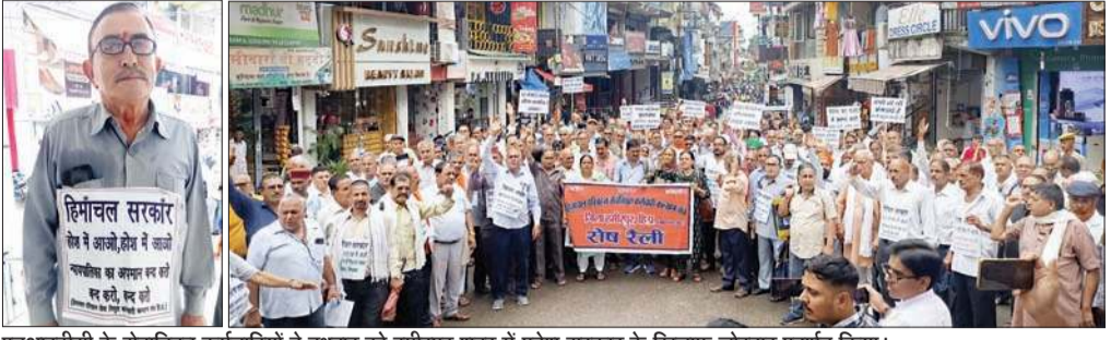
एचआरटीसी के सेवानिवृत्त कर्मचारियों ने बुधवार को हमीरपुर शहर में प्रदेश सरकार के खिलाफ जोरदार प्रदर्शन किया।

एचआरटीसी पेंशनर्स कल्याण संगठन का हमीरपुर में सरकार के खिलाफ जोरदार प्रदर्शन, वित्तीय लाभ नहीं देने पर किया रोष प्रकट