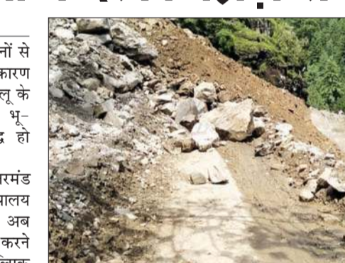
सालों से लगातार भू-स्खलन हो रहा है। बरसात शुरू होते ही यहां पहाड़ी पर से लगातार पत्थरों का गिरना शुरू होता है, जिसके चलते यहां से गुजरने वाले वाहन चालकों को दिक्कत रहती है।

इसके चलते आनी, निरमंड उपमंडलों का जिला मुख्यालय कुल्लू से संपर्क कट गया है, अब इस हाइवे होकर आवाजाही करने वाले छोटे वाहनों को वैकल्पिक मार्ग कंडुगाड से कंडा सड़क पर परिवर्तित किया गया है, जबकि बड़े वाहन, बसें आदि के लिए फिलहाल यह मार्ग पूरी तरह अवरुद्ध हो गया