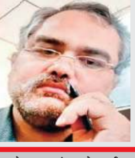
लेखक : संजय गोस्वामी स्वतंत्र टिप्पणीकार

रहा है। पृथ्वी पर देवताओं के राजा को इंद्र कहते थे। जिनमें 14 प्रमुख का नाम पुराणों में है, जिन्होंने 100-100 वर्ष शासन किया था अर्थात् शत-क्रतु थे। क्रतु का अर्थ यज्ञ है, जो संवत्सर चक्र में होता है। राजा रूप में इंद्र पूर्व दिशा (भारत के केंद्र से) के लोकपाल थे। वायुमंडल में सूर्य किरणों के जल बिंदुओं द्वारा परावर्तन से इंद्रधनुष का आकार दिखाई देता है। उसके अतिरिक्त मत्स्य या दंड आकार भी दिखते हैं जिनका प्रभाव इंद्रधनुष जैसा ही है। इसके अनुवाद के बाद किसी अन्य स्पष्टीकरण की आवश्यकता नहीं है। इंद्रायुद्ध 2 प्रकार का है-धनुष और ऐरावत। सूर्य की किरणों में स्थित प्राण, जो प्रकाश करता है, वही इंद्र कहलाता है। नीरातरा: करा भातो: पवनेन विघटिता:। सप्तवर्णा धनु:संस्था दृष्टा इन्द्रधनुर्मनम्॥1175॥ पवन से टकराई हुई सूर्य की किरणें, जो जल के अंदर प्रविष्ट हो जाती हैं, उससे 7 वर्ण वाले धनुष की स्थिति होती है। आच्छन्नं द्युतिम् स्त्रिभ्रं भ्रूमाद् द्वि:कृतं धनु:। अनुलोमं प्रशस्तं स्याज्जलं तथि प्रयच्छति॥1176॥ कुछ कटा हुआ, प्रकाश