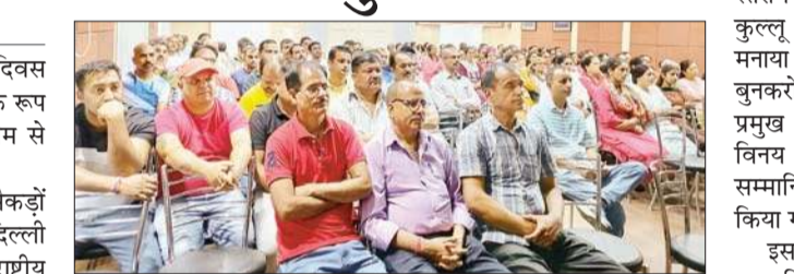
हथकरघा दिवस के अवसर पर भुट्टिको परिसर में उपस्थित बुनकर व अन्य गणमान्य लोग।