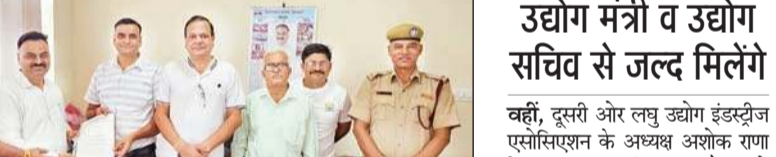
लघु उद्योग संगठन के पदाधिकारी ज्ञापन सौंपते हुए।