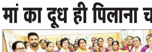
आंगनबाड़ी केंद्र में बाल विकास परियोजना अधिकारी के साथ अन्य महिलाएं।