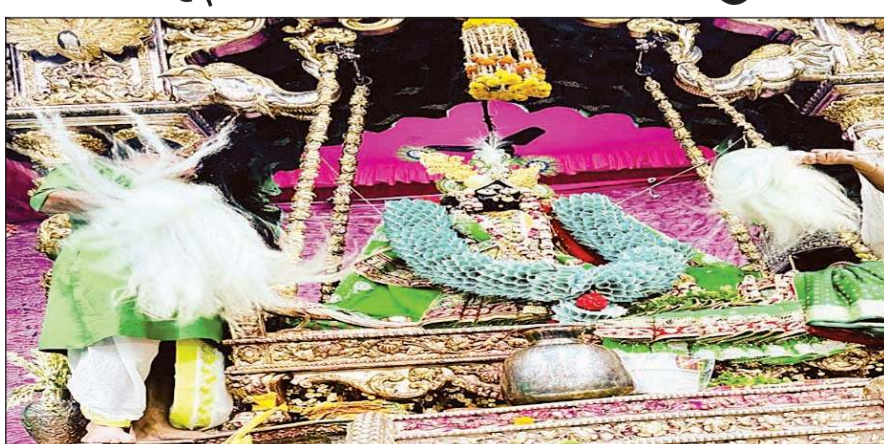
कि इस दिन पहली बार वृंदावन की पवित्र भूमि पर कृष्ण ने राधा संग

एजेंसी, मथुरा वृंदावन के विश्व प्रसिद्ध बांके बिहारी मंदिर में हरियाली-तीज का पर्व हर्षोल्लास के साथ मनाया जा रहा है। भगवान बांके बिहारी को मंदिर के गर्भ-गृह से बाहर निकालकर विशाल 'स्वर्ण-हिंडोले' में झूला झुलाया जा रहा है। अपने आराध्य भगवान बांके बिहारी की इस अनुपम छवि के दर्शन करने के लिए मंदिर-प्रांगण में श्रद्धालुओं का तांता लगा हुआ है। हरियाली-तीज का मथुरा-वृंदावन में विशेष महत्व है। इस दिन यहां के सभी प्रमुख मंदिरों में विराजमान ठाकुरजी को झूला झूलाने की परंपरा है। कहा जाता है