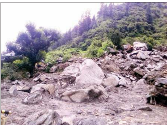
बादल फटने से हुई तबाही का मंजर।

पंडोह नशे और नशेदियों का अड्डा बन चुका है। हर कहीं दिन में शराबी मिलेंगे। चिट्टे और चरस के लिए भी पंडोह की पहचान बनती जा रही है, जो हमारी युवा पीढ़ी के भविष्य पर सवालिया निशान हैं। मंडी-कुल्लू पुलिस पंडोह चरस व चिट्टे के सौदागरों को पकड़ चुकी