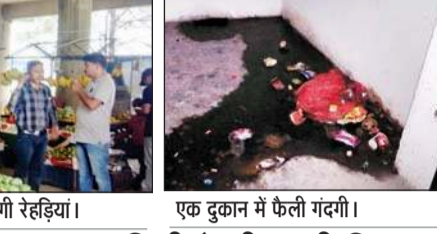
एक दुकान में फेली गंदगी।