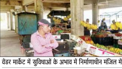
वेंडर मार्केट में सुविधाओं के अभाव में निर्माणाधीन मंजिल में लगी रेहड़ियां।