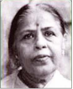
सिद्धेश्वरी देवी जन्म : 8 अगस्त, 1908 मृत्यु : 17 मार्च, 1977