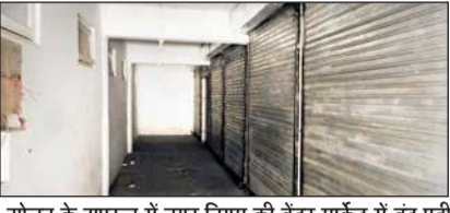
सोलन के सपरून में नगर निगम की वेंडर मार्केट में बंद पड़ी दुकानें (दाएं) नगर निगम की वेंडर मार्केट।

नगर निगम ने सपरून में लाइसेंस धारक रेहड़ी चालकों को आधी अथूरी वेंडर मार्केट में दुकानों का आवंटन कर लावारिस छोड़ दिया। वेंडर मार्केट में निगम के वादे के मुताबिक सुविधाएं नहीं मिल पाईं। इतना ही नहीं ग्राहक नहीं होने से अधिकतर रेहड़ी चालक दुकानें छोड़ने को मजबूर हो गए हैं। इससे इस वर्ग पर रोजी रोटी का संकट आन पड़ा है। हैरानी की बात है कि पुराना स्थान छोड़ने के बावजूद निगम इस वर्ग को आजीविका के प्रति गंभीर नहीं है। (अनंत ज्ञान)