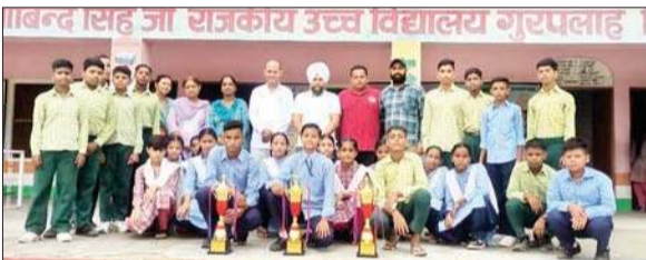
विजेता स्कूली छात्रों का स्वागत करता स्कूल का स्टाफ।