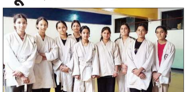
शिमला में होने वाली जूडो प्रतियोगिता में भाग लेने वाली कुल्लू की खिलाड़ी।