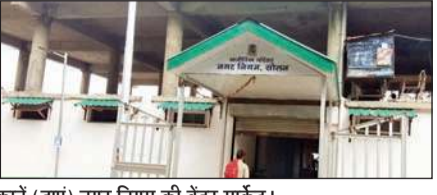
सोलन के सपरून में नगर निगम की वेंडर मार्केट में बंद पड़ी दुकानें (दाएं) नगर निगम की वेंडर मार्केट।