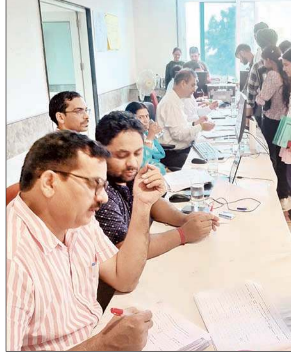
काउंसिलिंग के लिए आए हुए स्टूडेंट्स

पहले दिन एचपीसीईटी की मेरिट के आधार पर सामान्य श्रेणी सहित ऑल इंडिया कोटा, बेटी है अनमोल, ईडब्ल्यूएस कश्मीरी विस्थापित व टीएफडब्ल्यू कोटे के तहत 134 अभ्यर्थियों और दूसरे दिन ओबीसी, एससी, एसटी और इन्हीं वर्गों को उप श्रेणियों के 65 अभ्यर्थियों को सीटें आवंटित की गईं। जिन अभ्यर्थियों को सीटें आवंटित हुई हैं, उन्हें नौ अगस्त तक संबंधित शिक्षण संस्थान में सायं चार बजे तक रिपोर्ट करनी होगी। जो अभ्यर्थी आवंटित शिक्षण संस्थान