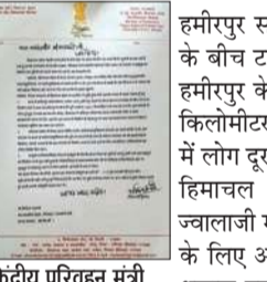
केंद्रीय परिवहन मंत्री को भेजा पत्र।