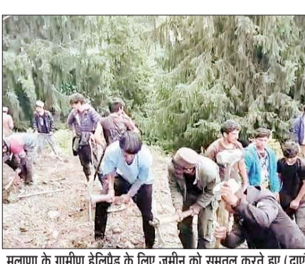
मलाणा के ग्रामीण हेलिपैड के लिए जमीन को समतल करते हुए (दाएं) ग्रामीणों द्वारा खुद तैयार किया गया लकड़ी का पुल।

ग्रामीणों ने समस्या के समाधान के लिए सरकार व प्रशासन से काफी दिनों तक गुहार लगाई, लेकिन उनकी किसी ने एक न सुनी। हार मान कर ग्रामीणों ने आवागमन के लिए खुद ही राह आसान करने की उनी और कर दिखाया।