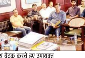
ऊना में अधिकारियों के साथ बैठक करते हुए उपायुक्त