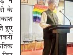
जुड़ने का जो सुझाव दिया गया है, वह वास्तव में एक काबिल ए तारीफ सुझाव है, जिस पर अमल होना चाहिए। देश के कपड़ा मंत्री गिरिराज किशोर के द्वारा जो अपने मंत्रालयों व निगमों और बोर्डों के छोटे से छोटे कर्मचारी व उच्च अधिकारियों तक के लिए सप्ताह में कम से कम एक दिन हथकरघा से बने उत्पादों को पहनने का आह्वान किया गया है निश्चित रूप में हथकरघा बुनकरों को उनका यह उद्यमी बनाने के लिए सहकारिता से