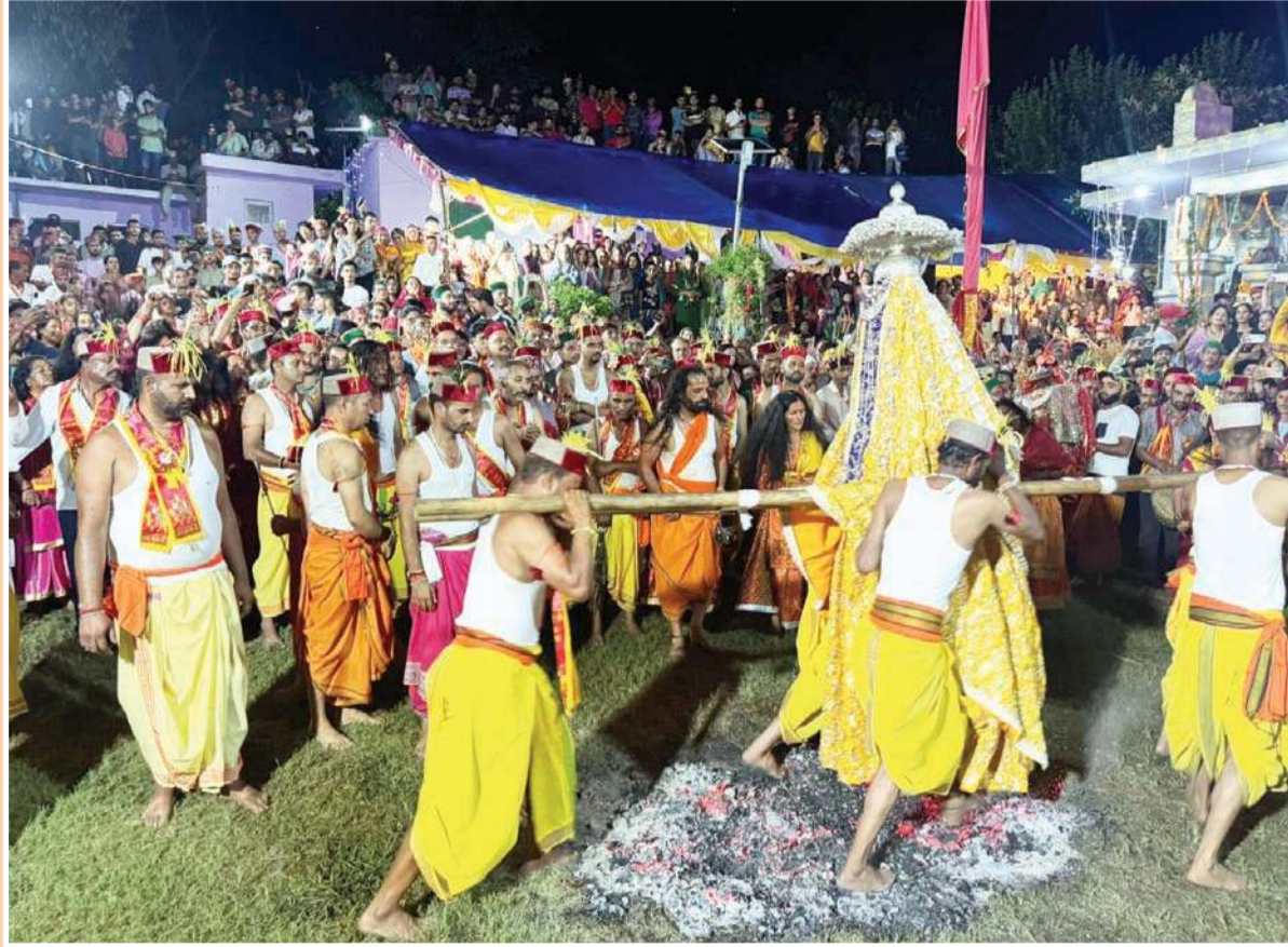
जिला कुल्लू के भुंतर स्थित पिपलागे में नैणा माता मंदिर में माता के 24वें जाग उत्सव के मौके पर माता के गूरों व चेलियों ने देव खेल आने पर दहकते अंगारों पर नृत्य कर आस्था का परिचय दिया।