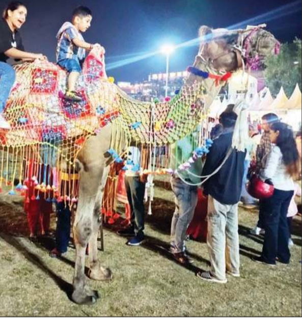
ऊंट की सवारी करते हुए बच्चे।