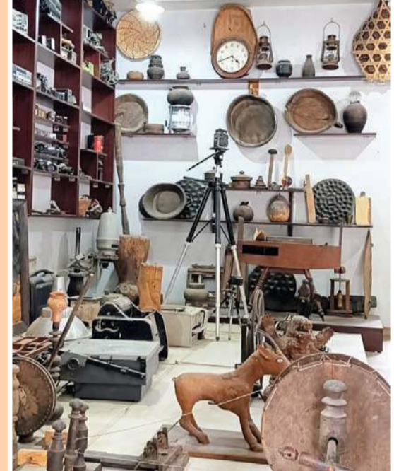
पौराणिक वस्तु संग्रहण व एक ही छत के नीचे हिमाचल को दर्शाने वाली मंडी स्थित हिमाचल दर्शन फोटो गैलरी हिमाचली संस्कृति की जान है।

ADMISSION OPEN DMLT | DOTT | DRIT | B.MLT | B. OTT B.RIT | BMLT(LE) | MSc MLT | MSc MICRO MSc MEDICAL | MICROBIOLOGY | BCA MCA | MBA | BA | MA | BBA | HM | LAW REASONABLE FEES ₹16500/- PER SEMESTER NIMT - MOHALI: 7307307171