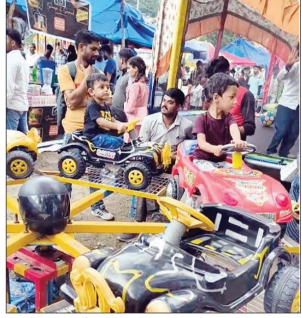
अंतरराष्ट्रीय मिंजर मेले में झूलों का आनंद लेते हुए बच्चे।