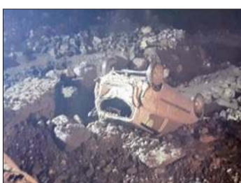
लाहौल-पीति की पिन घाटी में बाढ़ल फटने से हुए नुकसान की तस्वीरें।