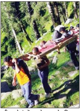
मरीज को कंधों पर लेकर जाते परिनज।

गर्भवती महिला हो या कोई भी व्यक्ति के बीमार पड़ जाने पर कोई सरकारी मदद नहीं मिलती और मरीज को पीट या पालकी पर