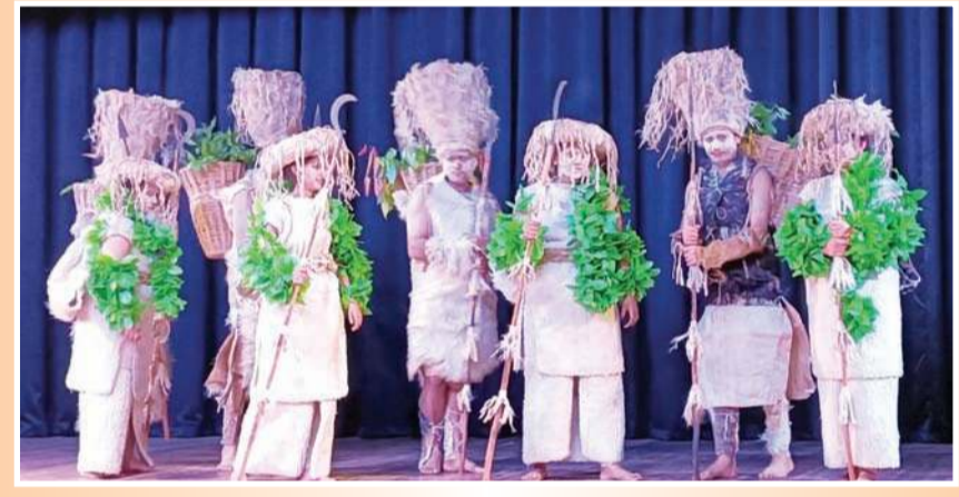
मंडी में पारंपरिक वेशभूषा में सजे कलाकार अपनी प्रस्तुति के लिए बारी का इंतजार करते हुए।