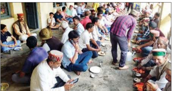
भगवान रघुनाथ मंदिर परिसर में खीर का भंडारा ग्रहण करते हुए श्रद्धालु।

शनिवार को जिला मुख्यालय के साथ लगते भगवान रघुनाथ के मंदिर में भी सावन महीने को देखते हुए हर वर्ष की भांति इस बार भी खीर के भंडारे का आयोजन किया गया। इस अवसर पर मंदिर परिसर में भजन-कीर्तन और पूजा-पाठ का आयोजन भी किया गया। इस दौरान बहुत-सी महिलाओं ने देवी-देवताओं के बहुत से सुंदर भजनों की प्रस्तुति पेश की। खीर के भंडारे के दौरान सबसे पहले