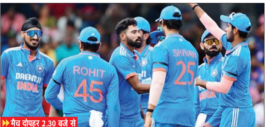
मैच दोपहर 2.30 बजे से

एजेंसी, कोलंबो भारत को अगर श्रीलंका के खिलाफ दबदबा बनाए रखना है तो उसे रविवार को यहाँ होने वाले दूसरे एकदिवसीय अंतरराष्ट्रीय क्रिकेट मैच में स्पिनरों और धीमी पिच से निपटने का तरीका ढूँढना होगा। भारत शुक्रवार को खेले गए पहले वनडे मैच में 231 रन के लक्ष्य का पीछा करते हुए एक समय तीन विकेट पर 130 रन बनाकर अच्छी स्थिति दिख रहा था, लेकिन इसके बाद श्रीलंका के स्पिनर हावी हो गए और भारतीय टीम 230 रन पर आउट हो गई जिससे यह मैच टाई रहा। रोहित शर्मा ने आक्रामक अंदाज में बल्लेबाजी की, लेकिन इसके बाद श्रीलंका के स्पिनरों ने अपनी रणनीति पर अच्छी तरह से अमल किया। भारत ने उनका सामना करने के लिए विराट कोहली, केएल राहुल और श्रेयस अय्यर को उतारा जिन्हें स्पिन गेंदबाजों के खिलाफ काफी सफलता मिली है। इन तीनों को किसी