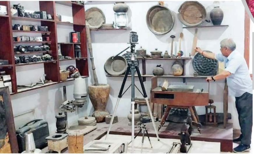
यह है मंडी स्थित हिमाचली संस्कृति को दर्शाने वाली हिमाचल दर्शन फोटो गैलरी। लोग यहां अपनी जिज्ञासा शांत करते हैं।