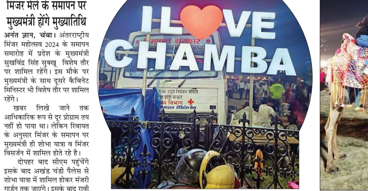
अंतरराष्ट्रीय मिंजर मेले के दौरान लाइट से सजा आई लव चंबा।