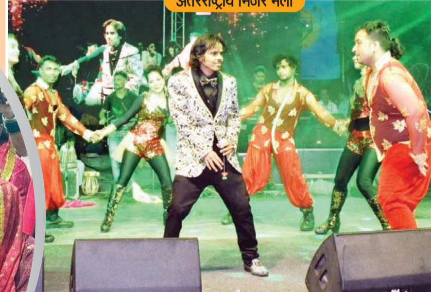
चंबा जिले में चल रहे अंतरराष्ट्रीय मिंजर मेले के दौरान प्रस्तुति देते स्थानीय कलाकार