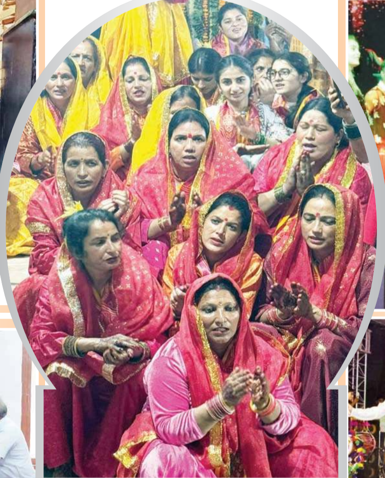
जिला कुल्लू के भुंतर में सावन माह में माता नैणा का जागरण (जाग) धूमधाम से नैणा माता मंदिर पिपलागे में मनाया गया। इस जाग महोत्सव में माता भद्रकाली, माता कोयला, माता शीतला, माता नागरानी अपने कारकूनो और हारियानों सहित विशेष रूप से शामिल हुईं। इस मौके पर भजन मंडली ने भजन-कीर्तन के माध्यम से माता की महिमा का बखान कर श्रद्धालुओं को मंत्रमुग्ध किया। जाग के दिन माता ने सभी भक्तों के दुखों का निवारण किया। जाग में माता के गूरों और चेलियों का दहकते अंगारों पर नृत्य देखने के लिए लोग दूर-दूर से आए थे।