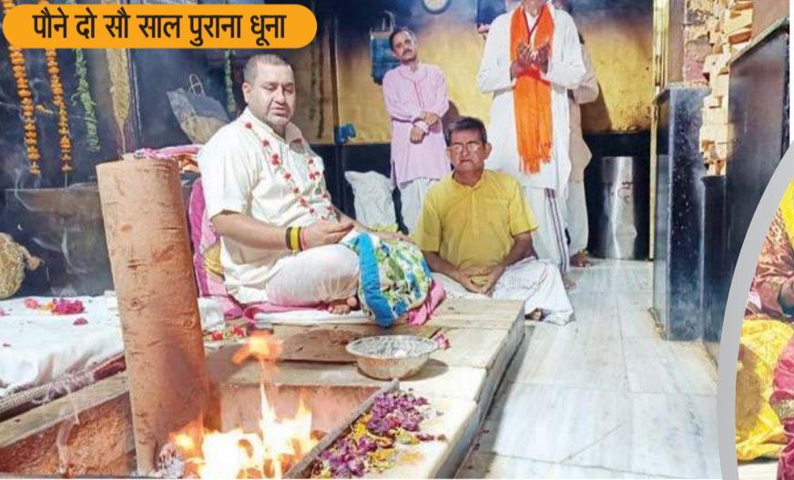
ऊना के नारी बसाल में ऐतिहासिक धार्मिक स्थल डेरा बाबा रुद्रानंद आश्रम हिमाचल ही नहीं, बल्कि उत्तरी भारत में प्रसिद्ध है। यहां अखंड धूना करीब पौने दो सौ साल पुराना है, जहां लाखों लोगों की आस्था जुड़ी है।