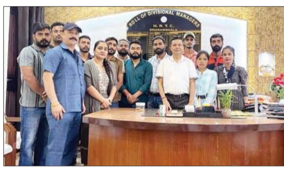
धर्मशाला में डीएम और इंस्ट्रक्टर के साथ भर्ती हुए नए 11 निगम परिचालक।

इसमें यात्रियों का अभिवादन करना तथा स्टॉप की घोषणा करने, समय सारिणी व परमिट की जानकारी होने, फर्स्ट एड बॉक्स तथा दस्तावेज होना सुनिश्चित करने, टिकट, पास व किराए के साथ जारी वेद पास की वैधता टिकट करने के बारे में बताया गया। इसके अलावा संकरी सड़कों पर बस से उतरकर इन ड्राइवर को मदद करने, वर्दी में रहने, ड्राइवर को रोकने तथा आगे बढ़ने के संकेत देने आवश्यकता अनुसार तथा विशेषकर बुजुर्ग तथा बीमार यात्रियों को बोर्डिंग, सिटिंग और सामान में सहायता प्रदान करने तथा बस को पीछे करते समय सीटी बजाने के बारे में बताया गया।