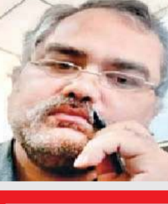
लेखक : संजय गोस्वामी स्वतंत्र टिप्पणीकार

किसी व्यक्ति के प्रति मन में घृणा और क्रोध नहीं बसा लेना चाहिए। घृणा और क्रोध से प्रेरित होने के बजाय न्याय एवं सत्य से प्रेरणा लेनी चाहिए। हम समाज-हित में, न्याय के समर्थन में, संघर्ष करें तथा दुष्ट को दंड दें, किंतु घृणा अथवा बदले की भावना से किसी को नष्ट करने के लिए उत्तारु न हो जाएं। संघर्ष में अपराध वृत्ति वाले (क्रिमिनल) दुष्टों का सहारा लेकर विजय पाने पर भी आपको एक दिन पराजय का मुंह देखना पड़ेगा, क्योंकि वे अंत में आपको भी शिकार बनाए बिना न रह सकेंगे। ईश्वर जिसे आयु और आजीविका प्रदान करता है, हमें मूर्खतावश उसके साथ एक क्षणभर में ही उकताहट हो जाती है। जिसे प्रभु जीवन का अवसर दे रहा है, हमें उससे घृणा करने का अधिकार नहीं है। विरोध एवं संघर्ष करते हुए भी हम इंसाइनियत न खो बैठें तथा संघर्ष एवं विरोध का दायरा सीमित