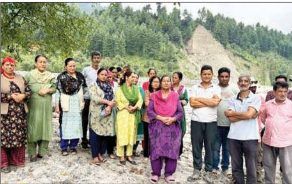
ब्यास नदी का रुख जटेहड़ बिहाल की ओर होने से चिंतित ग्रामीण।

जटेहड़ बिहाल के लोग अभी तक पिछले वर्ष ब्यास में आई बाढ़ की त्रासदी को भूले भी नहीं थे कि वीरवार को उन्हें ब्यास ने फिर से जख्म दे दिए। वीरवार को ब्यास नदी के पानी में हुई वृद्धि के चलते जटेहड़ बिहाल के लगभग 300 परिवारों को दहशत में डाल दिया। लोगों के आशियानों को बचाने के लिए अभी तक किसी प्रकार का कार्य नहीं किया जा रहा है, जबकि ब्यास का पानी लोगों के आंगन से बह रहा है। प्रशासन द्वारा अभी तक सुरक्षा के इंतजाम न किए जाने के कारण लोग अभी भी जाग कर रातों काटने पर मजबूर है। प्रशासन द्वारा यदि शीघ्र ही जटेहड़ बिहाल को बचाने के प्रयास नहीं किए गए तो अंबेडकर भवन, एचपीएमसी का कार्यालय और सीए स्टोर, वन विभाग का विश्राम गृह, गौशाला सहित जटेहड़ गांव में रहने वाले स्थानीय लोगों को बेघर होना पड़ेगा। शनिवार को सभी ग्रामीणों