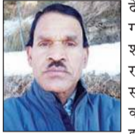
अनंत ज्ञान, चंबा

जिला प्रशासन द्वारा चंबा के स्थानीय मेलों को लेकर जारी की गई अधिसूचना को लेकर ग्राम पंचायत छतराड़ी के लोगों ने कड़ा ऐतराज जताया है।