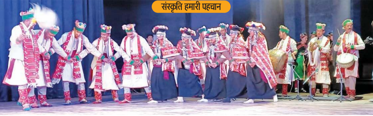
हिमाचल की संस्कृति अपने आप में बेहद समृद्ध है, जिसकी चर्चा चहुँओर है। मंडी के संस्कृति सदन में गत दिनों सांस्कृतिक नृत्य पेश करते हुए पहाड़ी कलाकार।