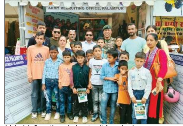
मेले देखने के लिए पहुंचे बाल देखरेख संस्थानों में पढ़ रहे बच्चे।