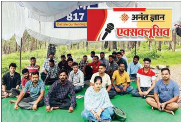
क्रमिक अनशन पर बैठे अभ्यर्थी।

बार-बार कहा जा रहा है कि दो-चार दिन में रिजल्ट घोषित कर दिया जाएगा, लेकिन देरी जारी है। 15 दिन पहले आयोग के मुख्य प्रशासक ने एक सप्ताह के भीतर रिजल्ट घोषित करने को कहा था, मगर अब दो सप्ताह से ज्यादा समय