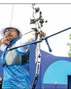
खेलों की महिला टीम स्पर्धा की स्वर्ण पदक विजेता और दूसरी वरीय सुहियोन के खिलाफ 4-2 की बढ़त बना रखी थी, लेकिन अंततः 4-6 (28-26, 25-28,

एजेंसी, पेरिस भारत की अनुभवी खिलाड़ी दीपिका कुमारी को शनिवार को यहाँ दो बार बढ़त बनाने के बावजूद पेरिस खेलों की तीरंदाजी की महिला एकल स्पर्धा के क्वार्टर फाइनल में दक्षिण कोरिया की नैम सुहियोन के खिलाफ हार का सामना करना पड़ा जबकि युवा भजन को भी प्री क्वार्टर फाइनल में हार गई, जिससे ओलंपिक में तीरंदाजी पदक का भारत का 36 साल का इंतजार जारी रहा।