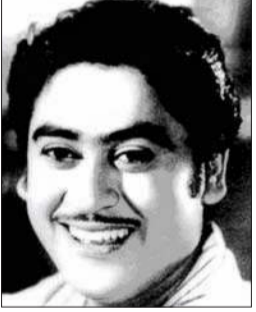
किशोर कुमार जन्म : 4 अगस्त, 1929 मृत्यु : 13 अक्टूबर, 1987

किशोर कुमार भारतीय संगीत के इतिहास में अमर गायक, अभिनेता, निर्देशक, निर्माता और गीतकार थे। किशोर कुमार का असली नाम 'आभास कुमार गांगुली' था। उनका जन्म खंडवा, मध्य प्रदेश में एक बंगाली परिवार में हुआ था। हिंदी सिनेमा की ओर उनका बहुत बड़ा योगदान है। किशोर कुमार के सबसे बड़े भाई अशोक कुमार मुंबई में एक अभिनेता के रूप में स्थापित हो चुके थे और उनके एक और भाई अनूप कुमार भी फिल्मों में काम कर रहे थे। किशोर कुमार बचपन से ही एक संगीतकार बनना चाहते थे। किशोर कुमार ने 81 फिल्मों में अभिनय किया और 18 फिल्मों का निर्देशन भी किया। फिल्म 'पड़ोसन' में उन्होंने जिस मस्त मौला आदमी के किरदार को निभाया, वही किरदार वह जिंदगी भर अपनी असली जिंदगी में निभाते रहे। हिंदी सिनेमा में इलेक्ट्रिक संगीत लाना का श्रेय किशोर कुमार को जाता है। किशोर कुमार केएल सहगल की तरह गायक बनना चाहते थे। किशोर कुमार ने 1957 में बनी फिल्म 'फंदूस' में 'दुखी मन मेरे' गीत को गाकर अपनी ऐसी काह जमाई कि जाने माने संगीतकारों को किशोर कुमार की प्रतिभा का लोहा मानना पड़ा। लता मंगेशकर को किशोर कुमार गायकों में सबसे ज्यादा अच्छे लगते थे। किशोर कुमार को आठ फिल्म फेयर अवार्ड मिले हैं।