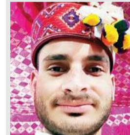
लेखक : मनीष कुमार स्वतंत्र लेखक, जयसिंहपुर

पश्चिम बंगाल के दार्जिलिंग में 17 जून को कंचनजंगा एक्सप्रेस के मालगाड़ी से टकराने के बाद पैसेंजर ट्रेन के गाड़ और मालगाड़ी के लोको पायलट समेत 10 लोगों की जान चली गई और 43 लोग घायल हुए। सीआरएस की रिपोर्ट से पता चलता है कि सिर्फ लोको पायलट की गलती नहीं थी। ट्रेन चलाने के प्रबंधन में कई स्तर पर गड़बड़ियां हुईं, जिनमें से सिग्नल फेलियर और स्टेशन मास्टर व लोको पायलट की पर्याप्त रूप से कार्रवाई नहीं किया जाना, लोको पायलट और ट्रेन मैनेजर के पास वॉकी-टॉकी का न होना, निर्देशों को गंभीरता से नहीं लिया जाना आदि खामियां प्रमुख थीं। इस रिपोर्ट में स्पष्ट रूप से यह भी लिखा गया है कि 'जब अत्यापक को ही विषय की स्पष्ट रूप से समझ नहीं हो तो वह छात्र को क्या पढ़ाएगा' और अब गत दिवस झारखंड के जमशेदपुर में चक्रधर रेल मंडल के बड़बाम्बो के पास हावड़ा-मुंबई मेल डीरेल होकर दुर्घटनाग्रस्त हो गई, ट्रेन के 18 कोच रेललाइन से उतर गए। तबाही का यह मंजर पिछले वर्ष