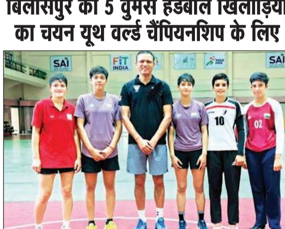
यूथ वर्ल्ड चैंपियनशिप के लिए चयनित हैंडबॉल खिलाड़ी कोच के साथ।