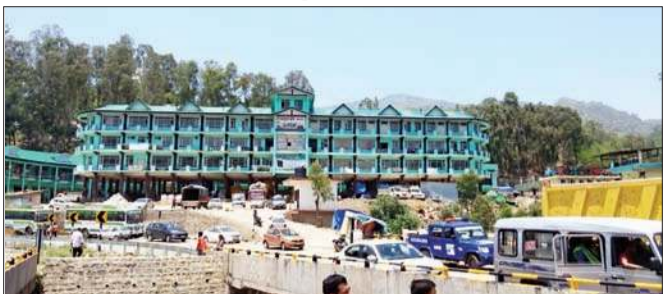
सोलन सब्जी मंडी का बाहरी दृश्य।

एपीएमसी ने सब्जी मंडी सोलन में किसानों, आदतियों और व्यापारियों की सुविधा के लिए 40 मीटर लंबा 40 फुट ऊंचा 20 मीटर चौड़ा शेड बनाने का निर्णय लिया है। इस पर करीब दो करोड़ रुपये की लागत आएगी। इस संबंध में एपीएमसी ने निजी कंपनी को टेंडर का आवंटन कर दिया है।