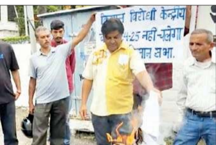
नाहन में केंद्र सरकार के बजट की प्रतियां जलाते किसान सभा के सदस्य।