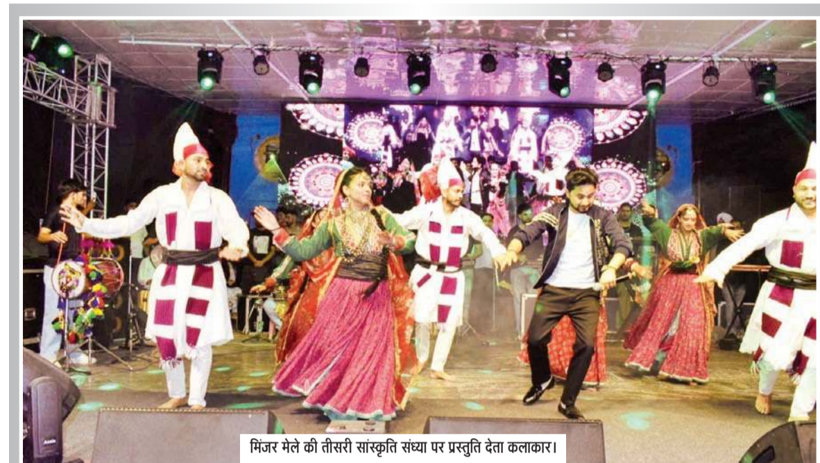
मिंजर मेले की तीसरी सांस्कृतिक संध्या पर प्रस्तुति देता कलाकार।