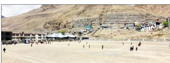
काजा के इस खेल मैदान में आयोजित किया जाएगा सबसे बड़ा क्रिकेट टूर्नामेंट।