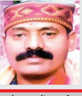
लेखक : नरेंद्र भारती वरिष्ठ पत्रकार, मंडी

लागतार मूसलाधार बारिस हो रही है, सड़कें बह रही है, पहाड़ों में बादल फट रहे हैं, लोग असमय मारे जा रहे हैं। अभी अगस्त माह बाकी है, पता नहीं कुदरत क्या कहर दायगी। प्रशासन भी सक्रिय है, लोगों को सुरक्षित जगह पर आश्रय दे रहा है। लोगों को भी सतर्क रहना चाहिए, नदियों का जलस्तर भी काफी बढ़ चुका है, लोग लापरवाही बरत रहे हैं और बह रहे हैं। ऐसे लोगों पर कार्रवाई करनी चाहिए। मानव को पहाड़ों से छेड़छाड़ बंद करनी होगी ताकि आने वाले समय में ऐसे हादसे रुक सके, वक्त अभी संभलने का है। अगर अब भी सबक नहीं सीखा तो ऐसी तबाही लगातार होती रहेगी। मानव को