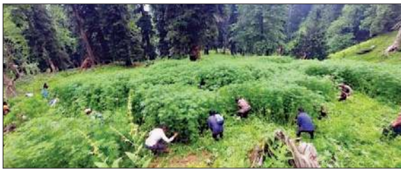
भेखली कोठी सारी के लोग जंगल में भांग के पौधे को काटते हुए।

इसी का ताजा उदाहरण कुल्लू के भेखली कोठी सारी में सामने आया है, जहां पर देव आदेश पर करीब 25 गांवों के 2000 से अधिक लोगों ने माता भेखली के अर्पण आने वाले क्षेत्र (जंगल) में उगी भांग की पौधे उखाड़ा है। जो हां, भेखली कोठी सारी के जंगलों से कोठी के 25 गांवों की स्थानीय जनता ने भांग उखाड़कर नशा मुक्त समाज का संदेश दिया है