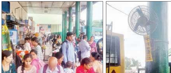
नगरोटा बगवां बस स्टैंड में बस का इंतजार करती सवारियां और खराब पड़ा पंखा।

नगरोटा बगवां का जिन्न हो तो बरखस ही प्रदेश के दिवंगत दिग्गज नेता बाली ध्यान में आ जाते हैं। बतौर परिवहन मंत्री रियल लाइफ के बसों वाले दिवंगत मंत्री जीएस बाली कांगड़ा ही नहीं, प्रदेश की राजनीति का मजबूत और कूटनीतिक चेहरा रहे हैं। वहीं उनके गृह क्षेत्र में उनके ही विभाग के रवैए से यात्री उमस भरी गर्मी पल्लू और रुमाल से पसीना पोंछने को मजबूर हैं। एचआरटीसी में उनके करवाए काम, नौकरियां देने और शिकायतों पर तुरंत कारवाई करने की शैली को कौन नहीं जानता। विकास पुरुष के विभाग के बस अड्डा में सुविधाओं का आलम ये कि 6 में से 3 पंखे