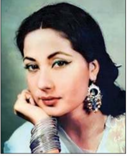
मीना कुमारी जन्म : 1 अगस्त, 1932 मृत्यु : 31 मार्च, 1972

फिल्म जगत की प्रसिद्ध अभिनेत्री मीना कुमारी का पूरा नाम 'महजबीबानो' था। मीना अपनी दर्द भरी आवाज और भावनात्मक अभिनय के लिए बहुत प्रसिद्ध रही हैं। उनकी 'साहिब बीबी और गुलाम', 'पाकीजा', 'परिणीता', 'बहु बेगम' और 'मेरे अपने' दिल को छू लेने वाली कलात्मक फिल्में हैं। मीना का जन्म मुंबई में एक मध्यम वर्गीय मुस्लिम परिवार में हुआ था। जब उनका जन्म हुआ, तब मां-बाप के पास डॉक्टर को देने के पैसे नहीं थे। दोनों ने बच्ची को किसी अनाथालय के बाहर सीढ़ियों पर छोड़ दिया, लेकिन पिता का मन नहीं माना और वह पलट कर भागे और बच्ची को गोद में उठाकर घर ले आए। किसी तरह मुश्किल भरे हालातों से लड़ते हुए उन्होंने उसकी परवरिश की। मीना के पिता एक पारसी थियेटर में काम किया करते थे और माता एक नर्तकी थीं। परिवार की आर्थिक स्थिति खराब रहने के कारण मीना को बचपन में ही स्कूल छोड़ना पड़ा। वर्ष 1939 में बतौर बाल कलाकार उनको विजय भट्ट की फिल्म 'लेदरफेस' में काम करने का मौका मिला। अपनी पहचान को तलाशती मीना को दस साल तक संघर्ष करना पड़ा। वर्ष 1952 में विजय भट्ट के निर्देशन में 'बैजू बावरा' में काम करने का मौका मिला। इस फिल्म की सफलता के बाद मीना बतौर अभिनेत्री अपनी पहचान बनाने में सफल हो गईं। सर्वश्रेष्ठ अभिनेत्री के लिए उन्हें चार बार फिल्म फेयर पुरस्कार मिला।