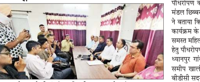
उपायुक्त कार्यालय कर्मचारी संघ के पदाधिकारी पत्रकार वार्ता करते हुए।

मिनिस्ट्रियल स्टाफ के स्टेट कैडर उपायुक्त कार्यालय कर्मचारी संघ ने सरकार से अनुरोध किया कि 3 अक्टूबर, 2023 को स्टेट कैडर की अधिसूचना बारे पुनः विचार किया जाए। संघ के पदाधिकारियों ने निराशा जाहिर कि लगभग 10 महीने से वह सरकार से शांतिपूर्वक अनुरोध कर रहे हैं कि सरकार इस बारे उनसे वार्तालाप करे तथा उनके जो शिकायतें हैं, उनका निराकरण करे। संघ ने कहा कि उन्हें स्टेट कैडर से दिक्कत नहीं है परंतु इसके कारण उनके जो प्रमोशन, वरिष्ठता का नुकसान हो रहा है, उस बारे उनसे सार्थक बातचीत कर निराकरण करे।