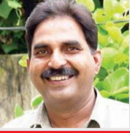
लेखक : संजय सक्सेना स्वतंत्र लेखक

प्रमाण पत्र बना दिए गए और किसी का इस ओर ध्यान ही नहीं गया। अब यह मामला सामने आया है। चौंकाने वाली बात यह भी है कि कुछ को छोड़कर सब के सब जन्म प्रमाण पत्र बांग्लादेश और रोहियांगी मुसलमानों के बनाए गए हैं। खास बात यह है कि यह सब थे तो चुसपैटिए मुसलमान, लेकिन इनका जन्म प्रमाण पत्र हिंदू नामों से बनाया गया था। ग्राम विकास अधिकारी (वीडीओ) की मिलीभगत से बनाए गए इन फर्जी जन्म प्रमाण पत्रों के मामले में जो सनसनीखेज तथ्य सामने आ रहे हैं, उसके अनुसार कुल बने 19,184 फर्जी जन्म प्रमाण पत्रों में आदि संख्या हिंदू नामों से बनाए गए थे और न ही इनका मोबाइल नंबर था। इस बात की प्रबल संभावना है कि बांग्लादेशी व रोहियांगी हिंदू नामों से यहां की नागरिकता हथियाने के लिए इसका इस्तेमाल कर सकते हैं। स्लोन कस्बे में वीडिओ