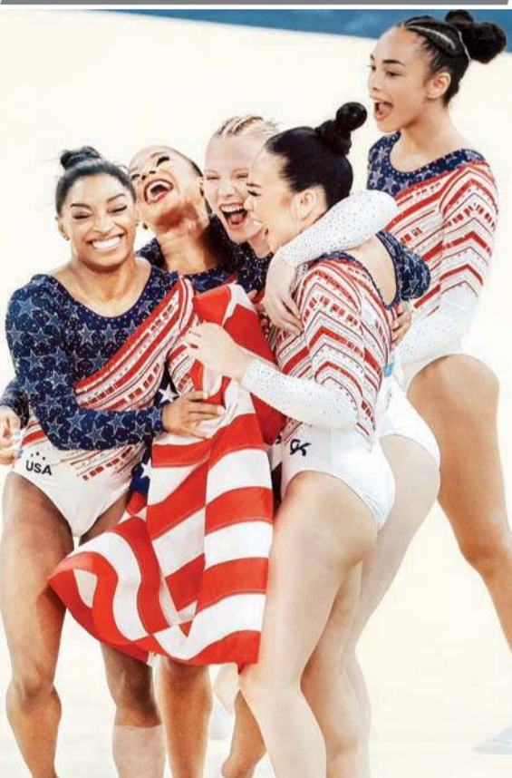
स्वर्ण पदक जीतने के बाद खुशी व्यक्त करती अमेरिका की महिला जिम्नास्टिक टीम।