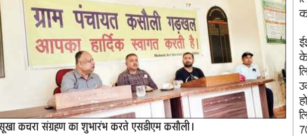
सूखा कचरा संग्रहण का शुभारंभ करते एसडीएम कसौली।