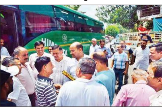
वन महोत्सव का शुभारंभ करने लंबागांव के मनायाइ पहुंचे मंत्री यादवेंद्र गोमा।

आयुष, युवा सेवाएं एवं खेल मंत्री यादवेंद्र गोमा 75वें परिक्षेत्र स्तरीय वन महोत्सव का शुभारंभ ग्राम पंचायत अमर लंबागांव के मनायाइ से किया। मंत्री ने इस अवसर पर अर्जुन किस्म का पौधा रोपित किया। गोमा ने उपस्थित लोगों को वन महोत्सव की बधाई देते हुए कहा कि प्रदेश के प्रत्येक व्यक्ति को पौधा रोपित कर पर्यावरण संरक्षण में अपना योगदान देना चाहिए। उन्होंने कहा कि मुख्यमंत्री सुखविंदर सिंह सुक्खू ने प्रदेश में हरित आवरण को बढ़ाने के लिए मुख्यमंत्री वन विस्तार योजना आरंभ की है। इस योजना में ऐसे क्षेत्रों को चयन किया गया है, जिसमें वन नहीं हैं। उन्होंने कहा कि पालमपुर वन मंडल के अंतर्गत मुख्यमंत्री वन विस्तार योजना में 12 हेक्टेयर क्षेत्र को हरा भरा करने का लक्ष्य