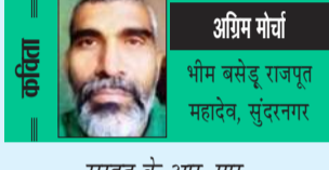
अग्रिम मोर्चा भीम बसेंद्र राजपूत महादेव, सुदामर

आवश्यक है। युवा को आवश्यक कौशल और तकनीकी शिक्षा को महत्वपूर्ण बनाएं। सरकार को उद्यमिता और कौशल विकास को बढ़ावा देने के लिए योजनाएं बनानी चाहिए। युवा को स्व-रोजगार के लिए प्रेरित करना चाहिए। उद्यमिता और स्व-रोजगार के लिए सरकारी समर्थन प्रदान करना चाहिए। सामाजिक जागरूकता अभियान करके अभिभावकों और युवा पीढ़ी में सकारात्मक सोच का संचार करना चाहिए। बच्चों पर लक्ष्य प्राप्ति का अनुचित दबाव नहीं डालना चाहिए, ताकि वे तनाव मुक्त हो कर अच्छी मेहनत करके अपना लक्ष्य प्राप्त कर सकें। स्वरोजगार को भी उतना ही महत्व देना चाहिए, जितना कि सरकारी नौकरी को महत्व देते हैं। बेरोजगारी एक सामाजिक, आर्थिक और मानसिक समस्या है। इसका समाधान हमारे समाज के विकास में मूल्य रख सकता है। सरकार, समाज और व्यक्ति सबको मिलकर इस समस्या का समाधान निकालना होगा ताकि हम एक समृद्ध और संवेदनशील समाज की ओर बढ़ सकें। (ये लेखक के निजी विचार हैं)