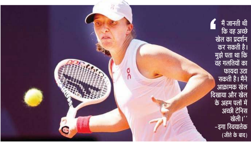
वावरिका को 6-4, 7-5 से पराजित किया। उनका आला मुकाबला जर्मनी के टोक्यो ओलंपिक के स्वर्ण पदक विजेता अलेक्जेंडर ज्वेरेच से होगा, जिन्होंने टॉमस मचाक को 6-3, 7-5 से हराया। अमेरिका के टेलर फिट्ज और टॉमी पॉल दोनों आगे बढ़ने में सफल रहे। फिट्ज ने ब्रिटेन के जैक

विश्व की नंबर-1 महिला खिलाड़ी इगा स्वियातेक ने कुछ विषम पलों से गुजरने के बाद चीन की विश्व में 52वें नंबर की खिलाड़ी वांग जियू को सीधे सेटों में हराकर ओलंपिक खेलों की टेनिस प्रतियोगिता के महिला एकल के क्वार्टर फाइनल में प्रवेश किया। फ्रेंच ओपन में चार बार की चैंपियन स्वियातेक ने वांग को 6-2, 6-4 से हराने के बाद कहा कि यह जीत आसान नहीं थी।