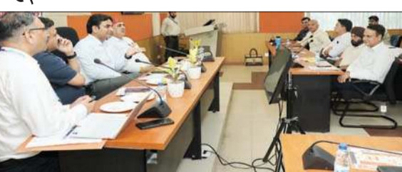
जिला मलेरिया उन्मूलन कार्यक्रम एवं वेक्टर जनित रोगों की समीक्षा करते हुए डीसी।

उपायुक्त हेमराज बैरवा ने कहा कि जिला कांगड़ा में मलेरिया, डेंगू एवं अन्य वेक्टर जनित रोगों से बचाव के लिए लोगों को जागरूक करने के लिए कारगर कदम उठाए जाएं इसके लिए सभी विभागीय अधिकारियों को आपसी समन्वय के साथ मलेरिया से बचाव के लिए रूपरेखा तैयार करने के भी निर्देश दिए गए। डीसी कार्यालय के सभागार में जिला मलेरिया उन्मूलन कार्यक्रम की टास्क फोर्स सभी वेक्टर जनित रोगों की समीक्षा बैठक की अध्यक्षता करते हुए उपायुक्त हेमराज बैरवा ने कहा कि उन्होंने कहा कि मानसून के मौसम में वेक्टर जनित रोगों की संभावना