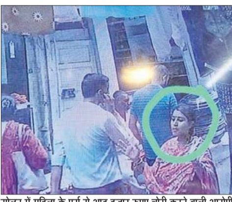
सोलन में महिला के पर्स से आठ हजार रुपए चोरी करने वाली आरोपी महिलाएं, जो सीसीटीवी में कैद हो गईं।

सीसीटीवी में कैद हुई घटना, पुलिस ने की अनजान रहने की अपील