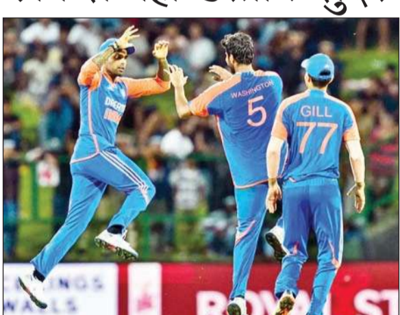
सूर्यकुमार के चौके की मदद से तीन रन का लक्ष्य हासिल कर सीरीज में 'क्लीन स्वीप' किया। सुंदर ने मैच के बाद कहा, 'ईमानदारी से कहूँ तो यह उनका कमाल है। यह उनकी नेतृत्व क्षमता का कमाल है क्योंकि जीत के लिए जब 12 गेंद पर 12 रन चाहिए और सब रिकू सिंह को गेंद सौंपना और

ऑलराउंडर वॉशिंगटन सुंदर ने सूर्यकुमार यादव को 'बड़े दिल वाला' कप्तान करार देते हुए कहा कि जोखिम लेने की उनकी अद्भुत क्षमता के कारण ही भारत तीसरे और अंतिम टी-20 अंतरराष्ट्रीय क्रिकेट मैच में श्रीलंका को हराने में सफल रहा।