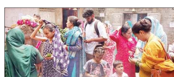
मंदिर में दर्शन के लिए लगी भक्तों की कतार।

इस दौरान लोगों को जलाभिषेक के लिए भी गर्भगृह के प्रवेश द्वार पर से ही पात्र लगाया गया जिससे लोगों की आस्था का भी सम्मान रहे और जलाभिषेक भी जल्द हो सके। वहीं इस दौरान मंदिर में पूजा अर्चना करने आए श्रद्धालुओं ने बताया कि छोटी काशी के लोग सदियों से पूरी श्रद्धा और आस्था के साथ सावन का माह मनाते आए हैं। इस साल भी सावन माह को लेकर सभी भक्तों में खासा उत्साह है। (अनंत ज्ञान)