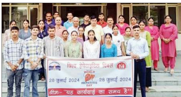
श्री मां संस्कृत कॉलेज ज्वालामुखी में हेपेटाइटिस दिवस मनाते शिक्षक और बच्चे।

थाना डमटाल के अंतर्गत आते गांव टिपरी में एक क्रशर उद्योग पर काम करने वाले एक व्यक्ति की मौत हो गई। इस संबंधी जानकारी दीते हुए थाना प्रभारी डमटाल ने बताया कि सुबह थाना में सूचना मिली की टिपरी के समीप खड्ड में एक व्यक्ति मृत पड़ा है, जिस पर