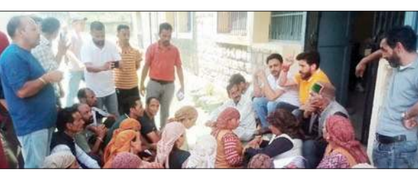
आनी के विधायक जनता के साथ आनी में निकाली राय रैली के दौरान।

मनाली। भाजपा मनाली मंडल के अध्यक्ष ठाकुर दास ने निजी अस्पतालों में हिमकेयर योजना का लाभ बंद किए जाने पर प्रदेश की सुक्यू सरकार पर हमला बोला है। सुक्यू सरकार ने रोगियों के दर्द को और बढ़ा दिया है। पूर्व भाजपा सरकार के कार्यकाल में 141 मुख्यमंत्री जयराम ठाकुर द्वारा पूरे निजी अस्पतालों में चलाई गई इस योजना को बंद करने से साफ हो गया है कि सुक्यू सरकार लगभग दो साल से प्रदेश में बदले की भावना से कार्य कर रही है। नीजि अस्पतालों में हिम केयर योजना को बंद किए जाने से सुक्यू सरकार की नाकामियों का पता चला है। सुक्यू सरकार अभी तक जनता को कोई भी लाभकारी योजना नहीं दे पाई है।