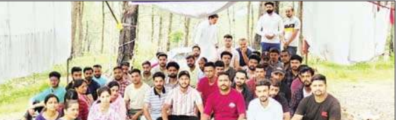
जेओए आईटी का परिणाम निकालने को लेकर 11वें दिन पहुंची भूख-हड़ताल।