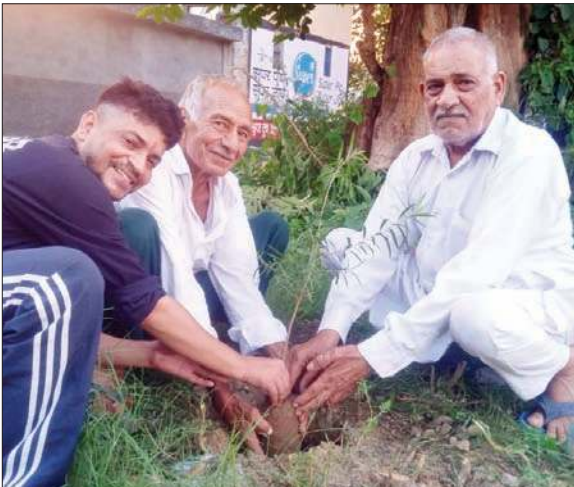
गोंदपुर बनेहड़ा में पौधा रोपते अभियान के सहयोगी।

इसकी और आमजन की बढ़ती रविवार को उस समय सामने आया जब गोंदपुर बनेहड़ा प्राचीन तालाब के किनारे 'एक पौधा संतो के नाम' पौधे रोपित करके प्रबुद्ध वर्ग ने योग दान दिया। ध्यान देने योग्य है कि एक गांव एक पौधा अभियान का लक्ष्य आमजन को एक पौधा स्वयं लगाने व उसके संरक्षण को