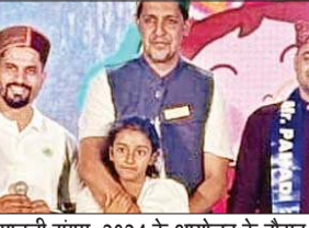
हिमाचली संगम-2024 के आयोजन के दौरान हिमाचल के लोग व मिस्टर व मिस खिताब के विजेता।

रूप में आमंत्रित किया था। हालांकि मुख्यमंत्री इस कार्यक्रम में नहीं जा पाए, लेकिन उन्होंने बंगलुरु में रह रहे सभी हिमाचलियों के लिए एक वीडियो संदेश साझा कर बधाई एवं शुभकामनाएं दीं। वहीं, बंगलुरु से पहाड़ी संस्कृति की छटा बिखेरी। वहीं, पहाड़ी खाना और गाना दोनों ने भी खूब रंग जमाया, जिसका हर किसी ने खूब लुफ्त उठवाया। कार्यक्रम के माध्यम से अपनी शुभकामनाएं साझा कीं और खुशी जाहिर करते हुए कहा कि ऐसे कार्यक्रमों से हिमाचल व बंगलुरु दोनों राज्यों की संस्कृति को जहां बढ़ावा मिलेगा। वहीं, आपसी प्यार भी बढ़ेगा।