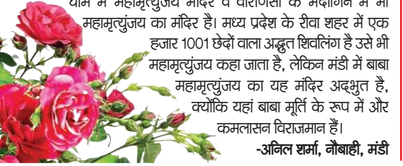
-अबिल धर्म, नौबाही, मंडी