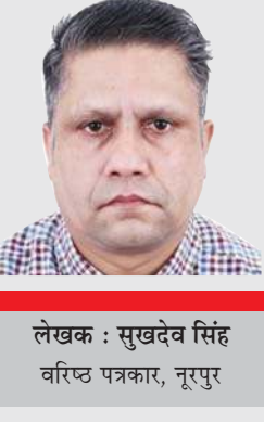
लेखक : सुखदेव सिंह वरिष्ठ पत्रकार, नूरपुर

को नशा मुक्त बनाने के लिए प्रयास करेंगे। क्यों कोई भी पंचायत ऐसे नशे व्यापारियों के खिलाफ लामबंद नहीं होती है। समाज को नशा मुक्त बनाने का काम सिर्फ पुलिस का ही नहीं, आम जनमानस को भी आगामी युवा पीढ़ी को बचाने के लिए आगे आना होगा। पंचायतों का सशक्तिकरण किए जाने को लेकर सरकारें हमेशा प्रयास करती नजर आती हैं, मगर बावजूद इसके कुछेक पंचायत प्रतिनिधि पंचायतीराज एक्ट से भी अवगत नहीं हो रहे हैं। पंचायत प्रतिनिधियों की जनता के प्रति क्या जिम्मेदारियां हैं, इसके बारे में उन्हें और जागरूक करने की जरूरत है।