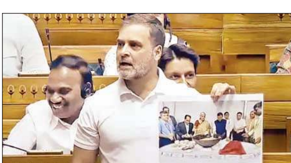
फोटो दिखाकर कहा- देश में 73 फीसदी पिछड़े-दलित, इन्हें कहीं जगह नहीं

उन्होंने केंद्रीय बजट पर चर्चा में भाग लेते हुए बजट की तुलना महाभारत के 'चक्रव्यूह' से की। उन्होंने कहा कि सत्तापक्ष 'चक्रव्यूह' बनाता है, लेकिन कांग्रेस पार्टी एवं विपक्ष 'चक्रव्यूह' तोड़ता है। हजारों साल पहले अभिमन्यु को 'चक्रव्यूह' में छह लोगों ने फंसा कर मारा था। 21वीं सदी में एक और 'चक्रव्यूह' तैयार किया गया है। 'चक्रव्यूह' का दूसरा नाम है 'पंचव्यूह', जो कमल के फूल के आकार का होता है। इसके अंदर डर और हिंसा होती है। आज 'चक्रव्यूह' के बीच में 6 लोग हैं। ये 6 लोग नरेंद्र मोदी, अमित शाह, मोहन भागवत, अजित