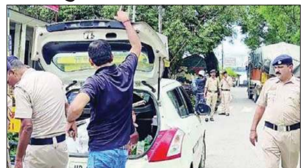
वाहनों की चेकिंग करती हुई पुलिस।

इन दोनों बैरियरों में बिना किसी चेकिंग के जिले में किसी वाहन को प्रवेश नहीं होने दिया