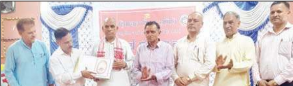
हस्तलिखित पत्रिका साधना का विमोचन करते हुए मुख्यातिथि व अन्य।