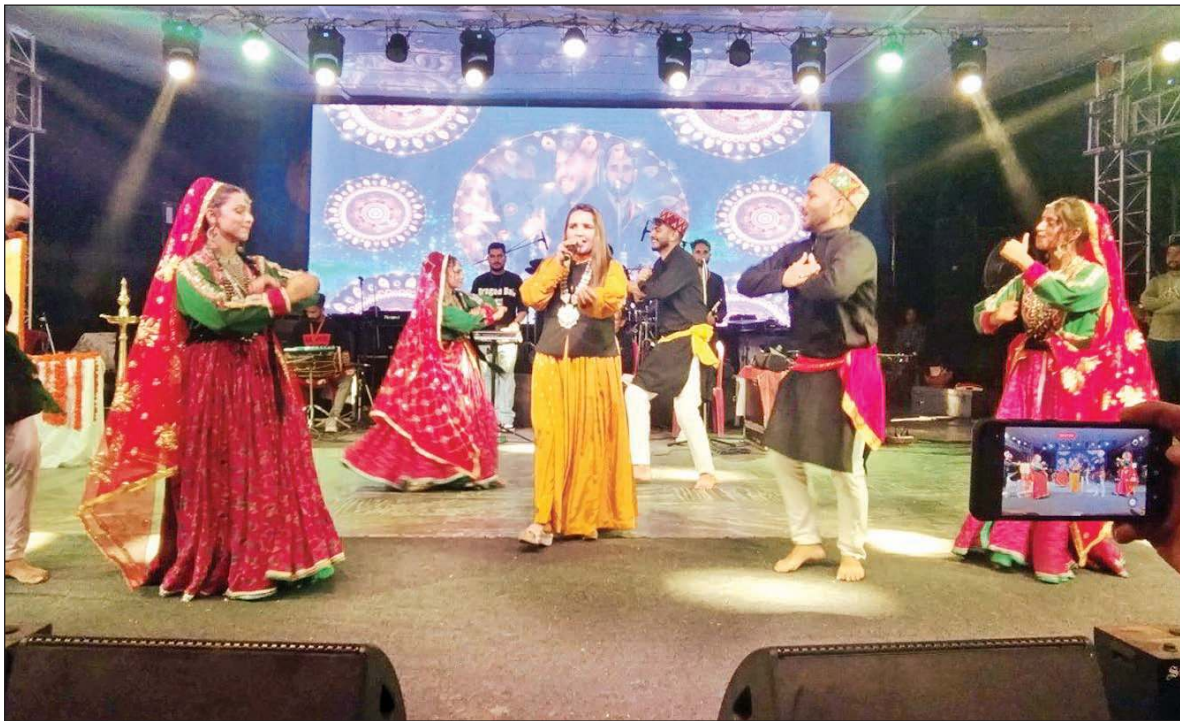
अंतरराष्ट्रीय मिंजर मेला 2024 की पहली सांस्कृतिक संध्या में प्रस्तुति देते कलाकार।