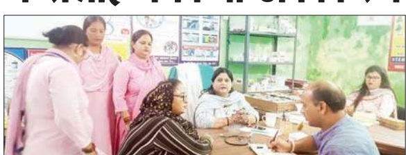
बीसीजी टीकाकरण अभियान के तहत टीकाकरण करती टीम।