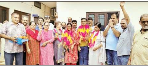
नवनिर्वाचित अध्यक्ष और उपाध्यक्ष के साथ गणमान्य व अन्य।

वहीं, मशीन में आई खराबी के बारे में उच्चाधिकारियों को भी अवगत करवा दिया गया है। हालांकि सूत्रों की मानें तो पिछले एक माह से हालात ऐसे