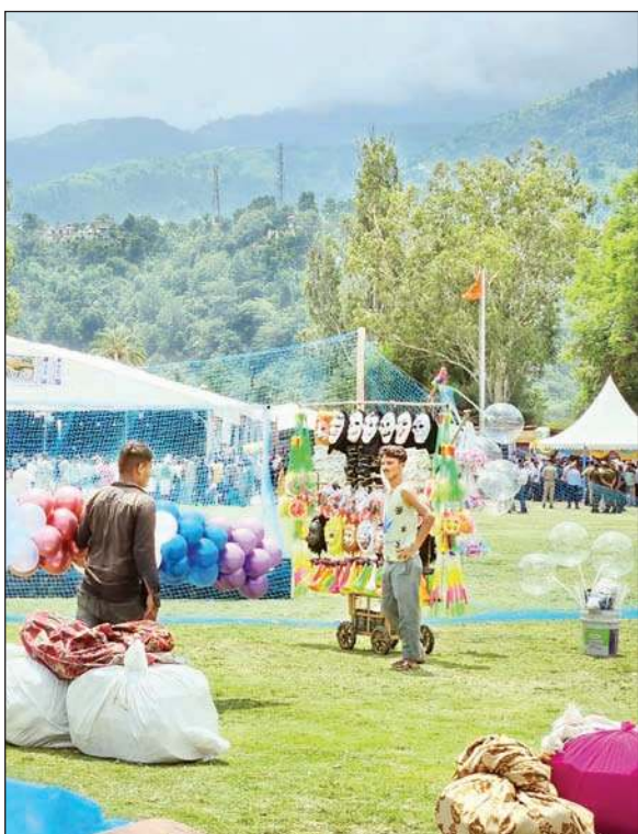
मिंजर मेले में खिलौने बेचना हुआ एक व्यक्ति।

शहर के हरेक एंटी प्वाइंट पर अस्थायी नाके लगाकर गहन जांच पड़ताल के बाद वाहन को गुजरने की इजाजत दी जा रही है। चौगान में सांस्कृतिक कार्यक्रम के दौरान हुड़दंगियों पर नजर रखने के लिए एंटी गुंडा स्कॉयड अलग से तैनात किया गया है।