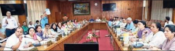
हाउस की बैठक में मौजूद पार्षद व अन्य।

शहर में मर्ज एरिया के पेयजल कनेक्शन अब डोमेस्टिक होंगे। शिमला में घरों में ही नेचुरल गैस मिलने वाली है। यह निर्णय नगर निगम की बैठक में लिया गया।