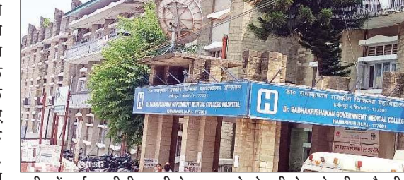
मशीन में आई तकनीकी खराबी से एक माह से परेशानी झेल रहे मरीज और तैमारवार।