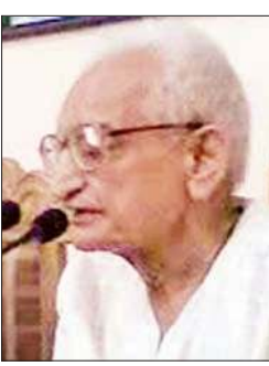
गोविंद चंद्र पांडे जन्म : 30 जुलाई, 1923 मृत्यु : 22 मई, 2011