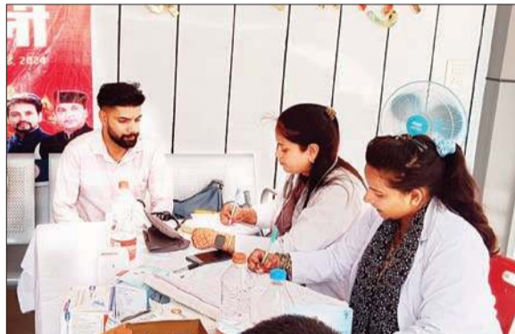
स्वास्थ्य शिविर में लोगों की जांच करते डॉक्टर।