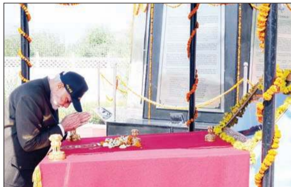
कारगिल विजय दिवस पर द्रास में शहीदों को श्रद्धांजलि अर्पित करते पीएम नरेंद्र मोदी।

प्रधानमंत्री ने कहा कि डिफेंस सेक्टर में रिफॉर्म के लिए भारतीय सेनाओं को सराहना करता हूँ। उन्होंने कई साहसी फैसले लिए। इसमें अग्निपथ योजना भी शामिल है। दशकों तक संसद में सैनिकों को युवा बनाने पर चर्चा होती रही है, लेकिन हमने इस पर काम किया। कुछ लोगों ने इसे राजनीति का विषय बना दिया। उन्होंने कहा कि देश के सैनिकों को ओर से दिया गया बलिदान अमर रहेगा।