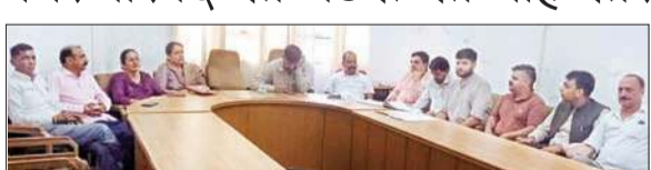
नगर परिषद हमीरपुर में आयोजित बैठक में उपस्थित पार्षद व अधिकारी।

हालांकि, नगर परिषद अध्यक्ष के साथ जो पार्षद वीरवार को उपायुक्त के पास गए थे, उनमें से दो पार्षद नगर परिषद की बैठक में नहीं आए, वहीं अविश्वास प्रस्ताव को निरस्त करने को लेकर जिन पार्षदों ने हस्ताक्षर किए थे उनमें से एक पार्षद शाम को मुकर गई, जबकि भाजपा समर्थित पार्षद भी अविश्वास प्रस्ताव को लेकर बैठक आयोजित कर चर्चा करने को लेकर उपायुक्त से मिले थे, क्योंकि अविश्वास प्रस्ताव पर एक