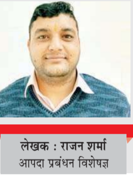
लेखक : राजन शर्मा आपदा प्रबंधन विशेषज्ञ

इसी के संदर्भ में भारत के उत्तर-पश्चिम हिमालय क्षेत्र में बसे हुए सुंदर हिमाचल प्रदेश में भी जलवायु परिवर्तन का असर देखने को मिल रहा है। जैसा कि हर वर्ष