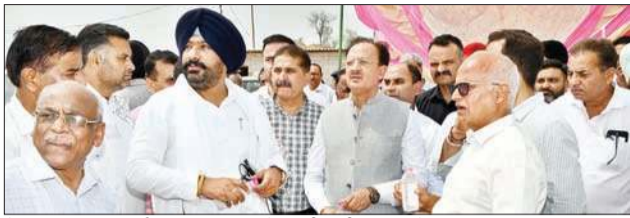
मेडिकल ड्रिवाइस पार्क नालागढ़ का उद्योग मंत्री निरीक्षण करते हुए।

नालागढ़ में मेडिकल ड्रिवाइस पार्क का उद्योग मंत्री हर्षवर्धन चौहान ने निरीक्षण किया। उद्योग मंत्री ने कहा कि नालागढ़ उपमंडल की ग्राम पंचायत मंडोली के घीड़ और तेलीवाल गांव में मेडिकल ड्रिवाइस पार्क लगभग 350 करोड़ रुपए की लागत से निर्मित किया जा रहा है। उन्होंने कहा कि लगभग 1623 बीघा भूमि पर निर्मित किया जा रहा यह पार्क बड़ी संख्या में युवाओं के लिए रोजगार व स्वरोजगार के अवसर सृजित करेगा।