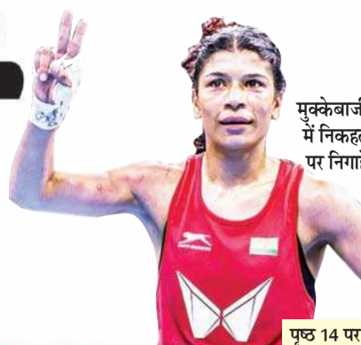
मुक्केबाजी में निकहत पर निगाहें