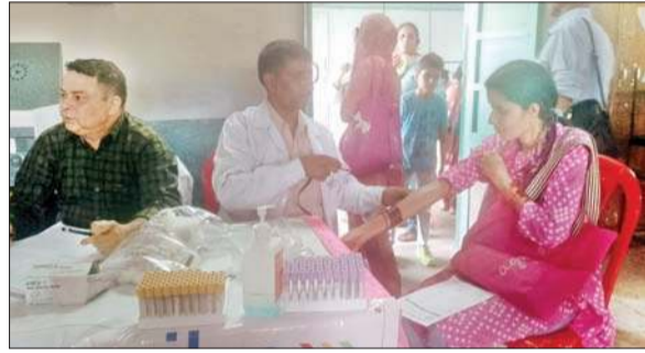
मेगा मेडिकल कैंप में एक लड़की का चेकअप करते डॉक्टर।