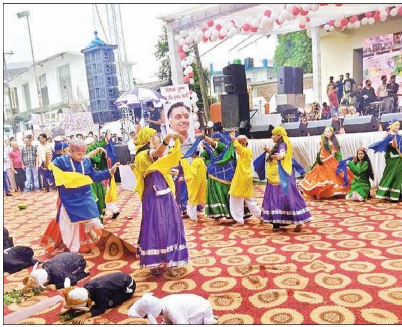
नगरोटा बगवां के गांधी ग्राउंड में सांस्कृतिक प्रस्तुति देती कलाकार।