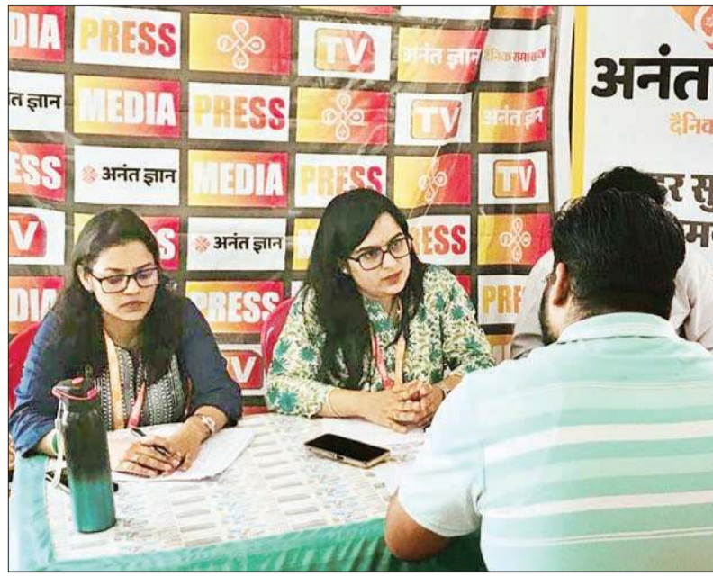
नगरोटा बगवां कॉलेज में आयोजित रोजगार मेले में अनंत ज्ञान दैनिक समाचार पत्र द्वारा लगाया गया स्टॉल।