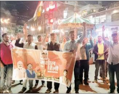
किन्नौर जिला के मुख्यालय में कारगिल विजय दिवस पर मशाल जुलूस निकालते हुए भाजयुमो किन्नौर के कार्यकर्ता।