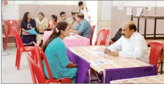
रोजगार मेले में एक अभ्यर्थी का साक्षात्कार लेते कंपनी के अधिकारी।

चेकअप किया गया। मेडिकल कैंप में निशुल्क दवाइयां तथा मेडिकल टेस्ट की सुविधा भी निशुल्क प्रदान की गई इसके साथ ही आंखों का चेक अप भी किया गया तथा लोगों को नजर की चर्च में तथा श्रवण यंत्र भी निशुल्क वितरित किए गए। इसके अलावा रोगियों के लिए खान पान भी व्यवस्था कैंप के दौरान की गई थी तथा दूरदराज के क्षेत्रों से लोगों को आने जाने के लिए परिवहन सुविधा भी उपलब्ध करवाई गई थी। मेडिकल कैंप का समापन 27 जुलाई को किया जाएगा।