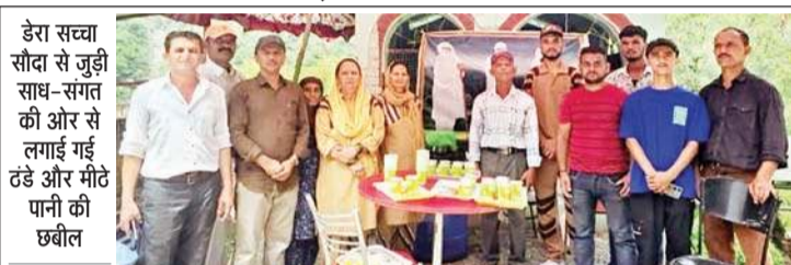
डेरा सच्चा सौदा से जुड़ी साध-संगत की ओर से लगाई गई ठंडे और मीठे पानी की छबीले

अनंत ज्ञान, चर्चिया नगरी। पंच्य गुरु संत डॉ. गुरमीत राम रहीम सिंह जी इन्सां को गुरु पूर्णिमा पर्व को बधाई दी। इसके हिमाचल प्रदेश के डेरा सच्चा सौदा से जुड़ी साध-संगत की ओर से पूरी श्रद्धा भावना, उल्लास और मानवता भलाई के कार्य कर मनाया गया। इस दौरान एमएसजी डेरा सच्चा सौदा व मानवता भलाई केंद्र परम पिता शाह सतनाम सचखंड धाम चर्चिया नगरी सहित हिमाचल प्रदेश के अलग-अलग ब्लॉकों में साध-संगत की ओर से विशेष नामचर्चा का आयोजन किया गया। नामचर्चाओं में साध-संगत ने बड़ी संख्या में भाग लिया। साध-संगत ने प्रभु भक्ति यानी नाम का सुमिरन कर और अरदास बोलकर