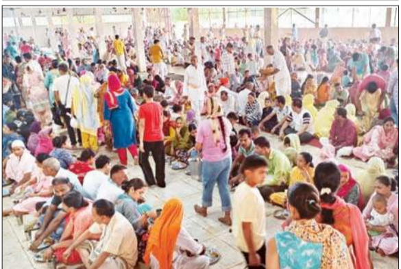
माथा टेकने पहुंचे श्रद्धालु प्रसाद ग्रहण करते हुए।

द्वारा पूजा-अर्चना करने के पश्चात आश्रम में स्थित पांच पिपलों के रूप में पांच ऋषियों की पूजा अर्चना की गई थी। पूरे विधि