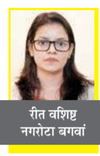
रित वशिष्ठ नगरवादी बगवा

आ ज हम बात करेंगे हमीरपुर जिले के सुजानपुर ब्लॉक की दाड़ला पंचायत की। यह पंचायत विकास के मामले में प्रदेशभर में नंबर वन है।