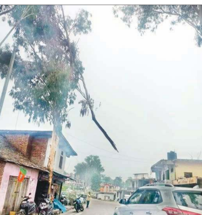
सड़क के ठीक मध्य में पेड़ से लटका टूटे पेड़ का हिस्सा।

किस्सा हमीरपुर-भोटा सड़क मार्ग पर डुग्गा बाजार का है। जहां