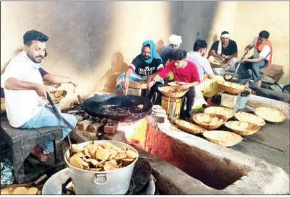
डेरा बाबा रुद्रानंद आश्रम में लंगर सेवा में लगे स्वयंसेवी।

द्वारा पूजा-अर्चना करने के पश्चात आश्रम में स्थित पांच पिपलों के रूप में पांच ऋषियों की पूजा अर्चना की गई थी। पूरे विधि