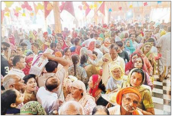
अखंड धूने पर माथा टेकने पहुंची श्रद्धालुओं की लगी भीड़।