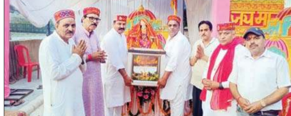
मां वैष्णो के जागरण से पूर्व लाई गई माता की ज्योति को स्थापित करते हुए।