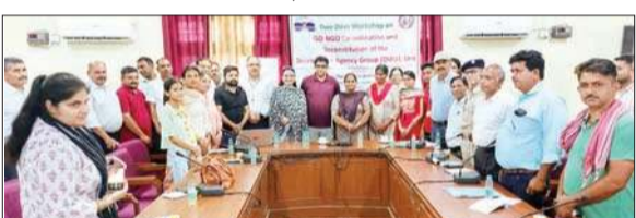
आपदा प्रबंधन को लेकर हुई कार्यशाला में हिस्सा लेने वाले प्रतिभागी और अधिकारी।