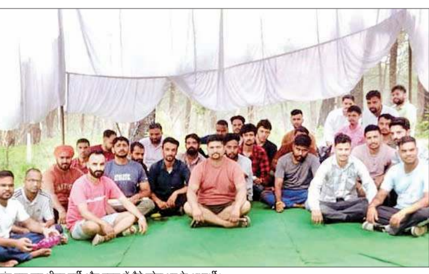
तंबू गाड़ कर भीतर गर्मी और उमस में बैठे प्रदेश भर के अभ्यर्थी।