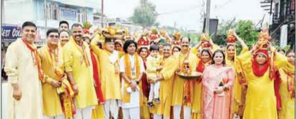
कलश यात्रा के दौरान सामूहिक चित्र में।