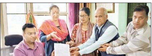
पानी की समस्या को लेकर एसडीएम बंजार के माध्यम से डीसी को ज्ञापन भेजते लोग।

इस मांग पत्र ज्ञापन के माध्यम से नगर वासियों द्वारा कहा गया कि नगर पंचायत बंजार के वार्ड नंबर दो और तीन में पिछले दो महीने से पानी की थोड़ी-थोड़ी किल्लत शुरू हो गई थी पर अब दिन प्रतिदिन पानी की किल्लत बढ़ रही है। मांगपत्र में कहा कि कई बार इस विषय को लेकर शिकायत भी की गई, लेकिन इसका कोई हल नहीं निकला। विभाग ने