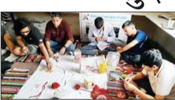
नवचेतना विशेष स्कूल और चार फाउंडेशन के सहयोग से राखी बनाते संस्था के विशेष बच्चे।

वीरवार को नवचेतना विशेष स्कूल सरवरी में विशेष छात्रों के द्वारा बनाई जा रही सुंदर-सुंदर राखी के उत्पाद बनाने का प्रशिक्षण देने के साथ-साथ आत्मनिर्भर बनने की दिशा में प्रोत्साहित किया गया। इस दौरान चार फाउंडेशन की वोकेशनल टीचर ने बताया कि रक्षाबंधन के त्योहार को देखते हुए स्कूल के विशेष बच्चों को सुंदर-सुंदर राखियां बनाने का प्रशिक्षण दिया जा रहा है। विशेष छात्रों के द्वारा बनाई गई