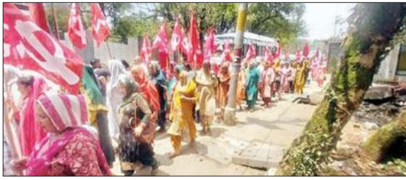
कांगड़ा जिला मुख्यालय धर्मशाला में प्रदर्शन करते मजदूर।

गौरतलब रहे कि केंद्र की मोदी सरकार ने अपने 100 दिन के एजेंडे में चार नए श्रम कोड लागू करने की बात कही है। वहीं सीटू के अनुसार ये कोड मजदूरों के लिए गुलामी का फंदा है और मजदूरों ने लंबी लड़ाई और कुर्बानी के बाद हासिल किए सुरक्षा के अधिकारों को खत्म करने की साजिश है। इन चार नए लेबर कोड को लागू करने से देश