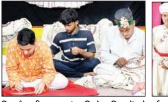
सिरमौर की समृद्ध संस्कृति के परिधानों को नई पहचान देते कलाकार।