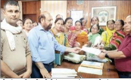
सीटू के पदाधिकारी एडीसी के माध्यम से प्रधानमंत्री को अपना मांग पत्र सौंपते हुए। (दाएं) केंद्र सरकार के खिलाफ प्रदर्शन करती महिलाएं।