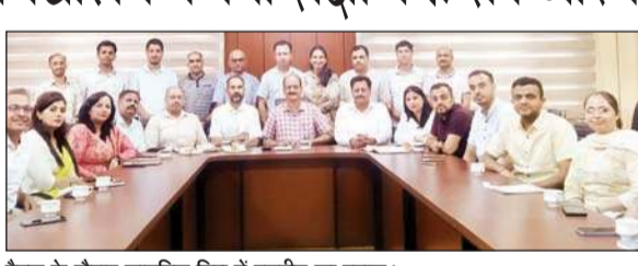
बैठक के दौरान सामूहिक चित्र में एस्पिपू का स्टाफ।