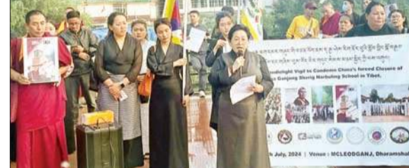
अंतरराष्ट्रीय न्याय दिवस पर चीन के खिलाफ प्रदर्शन करते तिब्बती लोग।

धर्मशाला स्थित आठ गैर-सरकारी संगठनों ने तिब्बत में चीनी कम्युनिस्ट पार्टी (सीसीपी) द्वारा मानवाधिकारों के व्यवस्थित उल्लंघन की गहरी चिंता और निंदा व्यक्त की है। तिब्बती कार्यकर्ताओं ने कहा कि तिब्बत में बीजिंग की नीतियों के कारण तिब्बती बच्चों के मौलिक अधिकारों और शिक्षा तक उनकी