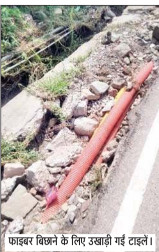
फाइबर बिछाने के लिए उखाड़ी गई टाइलें।

पहले यहां फाइबर केबल बिछाने के लिए सड़क के किनारे के भाग को टाइलों समेत उखाड़ा गया था, लेकिन करीब 4 माह गुजर जाने के बाद भी इसकी मरम्मत नहीं की गई। इससे कभी भी