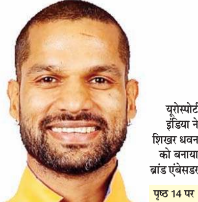
यूरोस्पॉर्ट इंडिया ने शिखर धवन को बनाया ब्रांड एंबेसडर