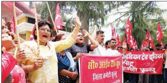
डीसी कार्यालय के आगे प्रदर्शन करते सीटू सदस्य एवं रेहड़ी-फड़ी कारोबारी।

वीरवार को डीसी कार्यालय के बाहर मनरेगा मजदूर, मिड-डे मील वर्कर्स, रेहड़ी-फड़ी मजदूर, हाइडल प्रोजेक्टों से संबंधित मजदूर यूनियनों से जुड़े सैकड़ों मजदूरों ने भाग लिया। इसके साथ बंजार में भी एसडीएम कार्यालय बंजार के बाहर आंगनवाडी एवं मिड-डे मील व निर्माण व मनरेगा के मजदूरों ने प्रदर्शन किया। आनी व सैंज में भी मजदूरों द्वारा