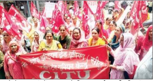
सीटू के पदाधिकारी एडीसी के माध्यम से प्रधानमंत्री को अपना मांग पत्र सौंपते हुए। (दाएं) केंद्र सरकार के खिलाफ प्रदर्शन करती महिलाएं।