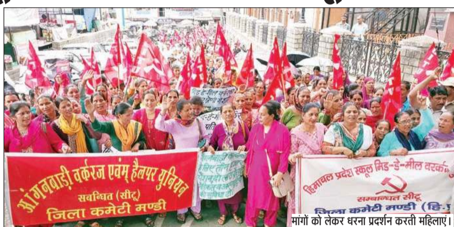
मांगों को लेकर धरना प्रदर्शन करती महिलाएं।