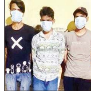
बड़सर पुलिस द्वारा पकड़े गए तीन युवक, जो वायरल वीडियो में दिखे थे।

बड़सर इलाके में नशे का इंजेक्शन लेने वाले तीन युवकों को बड़सर पुलिस ने खोज निकाला है। ये तीनों स्थानीय निवासी हैं। इनके साथ और कौन-कौन शामिल हैं, इसकी जांच-पड़ताल की जा रही है। अब उनके ब्लड सैंपल लैब में जांच के लिए भेजे जा रहे हैं। रिपोर्ट सही आई तो फिर उनके खिलाफ पुलिस अगली कार्रवाई अमल में लाएगी। यहां तीन युवक बड़सर ग्राम पंचायत के वार्ड नंबर 7 के एक बाथरूम नुमा कमरे में पिछले रोज नशे का इंजेक्शन लेते हुए पाए गए थे। उधर, नशा निवारण केंद्र बनी में हुए सड़र मामले में केंद्र के कर्ताधर्ता आज सुबह खुद पुलिस स्टेशन पहुंचे।