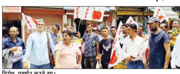
विरोध-प्रदर्शन करते हुए।

उन्होंने कहा कि प्रदेश में मनमंजरी से किराया वसूल जाने का आरोप लगाते हुए किराए को न्यायसंगत बनाए जाने की मांग की। जापन में मंडी मध्ययस्ता योजना -