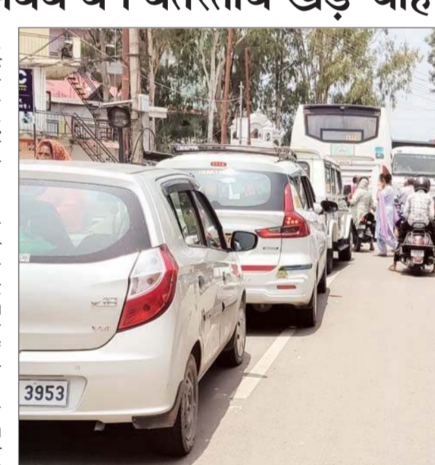
नादौन शहर में एसबीआई के पास नेशनल हाईवे पर लगा जाम।