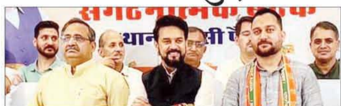
मंच पर मौजूद अनुराग ठाकुर के साथ अन्य

सांसद अनुराग ठाकुर ने अपने संबोधन के दौरान हमीरपुर की जनता से भाजपा के पक्ष में मतदान करने की अपील की थी और खुलकर कहा था कि प्रदेश की यह सरकार झूठ बोलने वाली