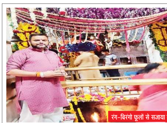
रंग-बिरंगे फूलों से सजाया गया ज्वालामुखी मंदिर का गर्भ गृह।

गुप्त नवरात्र अष्टमी की रात शनिवार को माता ज्वाला को 56 भोग लगाए गए। इसी के साथ देर रात्रि माता ज्वाला की विशेष पूजा अर्चना व विधिवत मंत्रोक्त पूजा अर्चना पुजारी वर्ग द्वारा की जाएगी। सोमवार को गुप्त नवरात्र नवमी मनाई जाएगी। सोमवार को ही गुप्त नवरात्र का समापन होगा और विशाल यज्ञ का आयोजन किया जाएगा। सोमवार को ही विशाल भंडारे का आयोजन किया