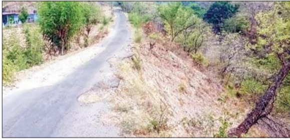
पंजैन के लिए लिंक रोड जहां डंगा प्रस्तावित है

उपमंडल बंगाणा के थाना कला के गांव पंजैन थाना में बने सबसे बड़े पहाड़िया मंदिर को जाने वाली सड़क मंदिर से करीब एक किलोमीटर की दूरी पर बीते वर्ष बरसात के दिनों में एक तरफ से सड़क क्षतिग्रस्त होने पर कोई बड़े हादसे को निमंत्रण दे रही है।