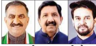
मुख्यमंत्री, उपमुख्यमंत्री और अनुराग के लिए थी चुनौती

हिमाचल प्रदेश में तीन विधानसभा सीटों की हुए उपचुनाव में भाजपा और कांग्रेस दोनों दलों के तीन सियासी कद्दावर नेताओं की प्रतिष्ठा दांव पर लगी हुई थी। इन नेताओं ने कहीं न कहीं अपनी प्रतिष्ठा को बचा लिया है।