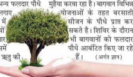
पौधों को आर्वाटिल किए जा रहे हैं। (अनंत ज्ञान)

पुष्पराज, मंडी बरसात के मौसम के दौरान 82727 फलदार पौधे उद्यान विभाग द्वारा किसानों और बागवानों को उपलब्ध करवाना शुरू कर दिया है। उद्यान विभाग ने विभिन्न उद्यान केंद्रों में पौधे उपलब्ध करवाने व हर ब्लॉक में आर्वाटिल करने की प्रक्रिया शुरू कर दी है। इसमें उद्यान विभाग के जहां विभिन्न योजनाओं के तहत निर्धारित दाम पर बागवानों को पौधे मुहैया करवाना शुरू कर दिया है, वहीं शिविर के माध्यम से सरकारी दरों से फलदार पौधे बागवानों को दिए जा रहे हैं ताकि बरसात के मौसम में लगाने वाले पौधों की खेप