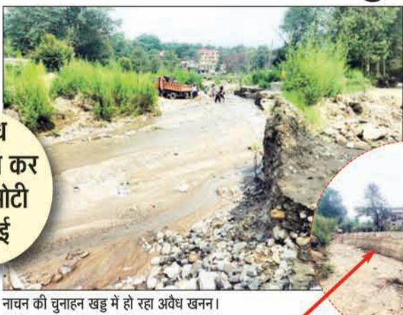
नाचन की चुनाहन खड्ड में हो रहा अवैध खनन।