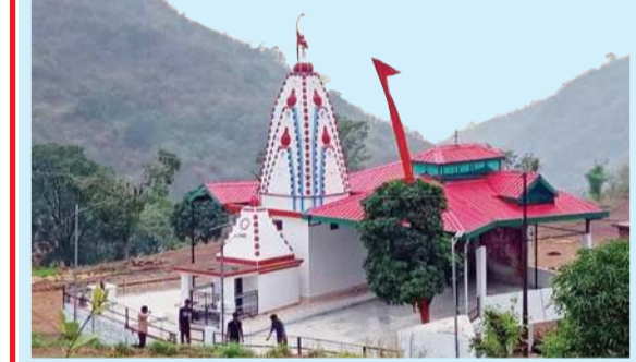
चाहा गांव में स्थित बोच देवी का मंदिर।