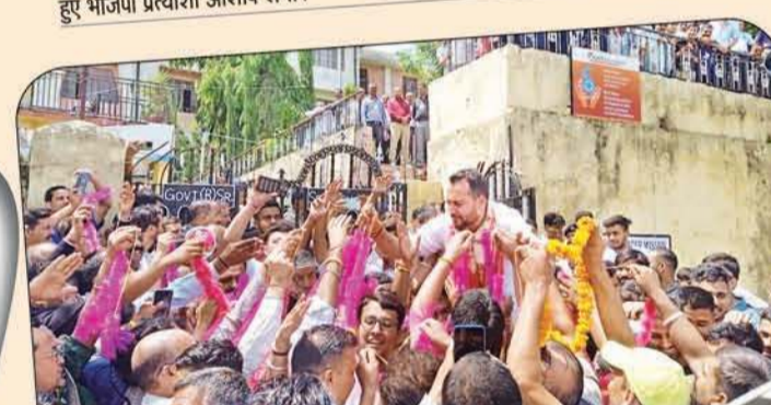
मतगणना केंद्र के बाहर उपचुनाव में जीत दर्ज करने के बाद समर्थक हार पहना कर स्वागत करते हुए।