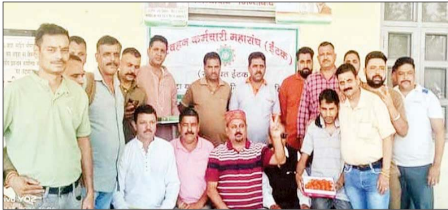
देहरा और नालागढ़ में कांग्रेस की जीत का जश्न मनाते इंटक की नगरोटा बगवां की इकाई के सदस्य।