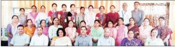
कार्यशाला में मौजूद विभिन्न स्कूलों के अध्यापक व गणमान्य।

डीएवी स्कूल आलमपुर में क्षेत्रीय प्रशिक्षण केंद्र द्वारा शिक्षकों को तीन दिवसीय 11 से 13 जुलाई तक क्षमता संवर्धन कार्यशाला का आयोजन किया गया।