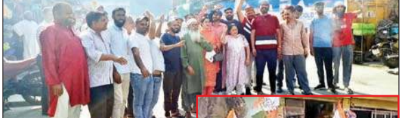
जीत का जश्न मनाते हुए कार्यकर्ता। आजम डार, तीसा