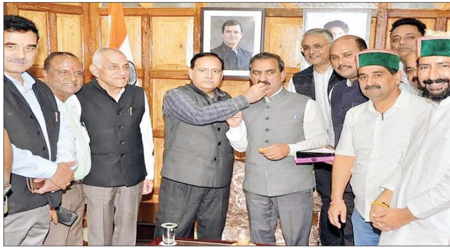
कांग्रेस प्रत्याशियों के जीतने पर मुख्यमंत्री का मुंह मीठा करवाते हुए।

पटानिया ने कहा 2022 के विधानसभा के चुनावों में जिला कांगड़ा की जनता ने कांग्रेस को भरपूर समर्थन दे कर 10 सीटों पर कांग्रेस प्रत्याशी जीताकर भेजे थे। इसी बीच में कांगड़ा से दो विधायकों के इस्तीफे के कारण कांग्रेस विधायकों की संख्या 9 रह गयी थी आज देहरा उपचुनाव में कांग्रेस प्रत्याशी के जीतने से कांग्रेस विधायकों की संख्या दस हो गयी है। उपचुनाव होने पर जिला कांगड़ा के जनता ने फिर से कांग्रेस पर