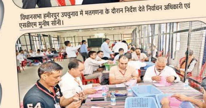
विधानसभा हमीरपुर उपचुनाव में पोस्टल बैलेट पेपरों की गणना करते हुए कर्मचारी।