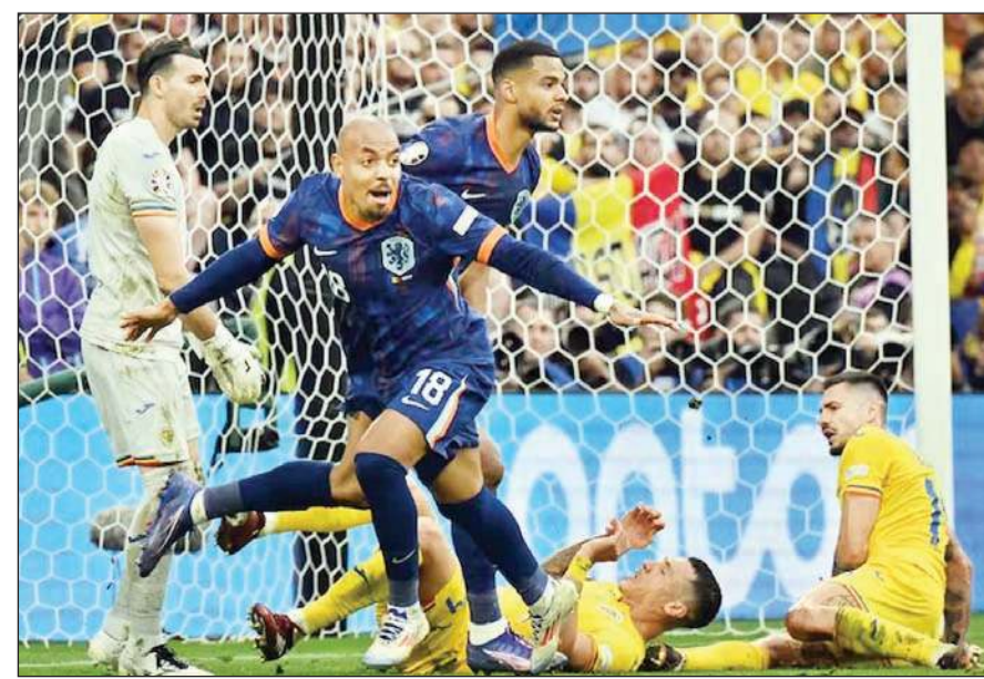
रोमानिया के खिलाफ प्री-क्वार्टर फाइनल मुकाबले में गोल करने के बाद खुशी व्यक्त करता नीदरलैंड का खिलाड़ी।