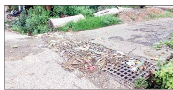
बीड बिलिंग में कूड़े-कचरे से भरी निकासी नालियां।