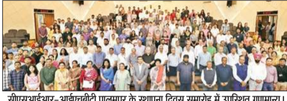
सीएसआईआर-आईएचबीटी पालमपुर के स्थापना दिवस समारोह में उपस्थित गणमान्य।