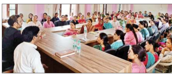
विकास खंड कुनिहार के स्वयं सहायता समूहों के साथ बैठकरते बीडीओ।

इस बैठक में अलग-अलग स्वयं सहायता समूहों की लगभग 100 महिलाओं ने भाग लिया। बीडीओ ने बताया कि बैठक का मुख्य उद्देश्य महिलाओं को एफपीओ (किसान उत्पादन संगठन) बारे जागरूक करना था कि इस संगठन से जुड़कर महिलाएं कैसे आर्थिक तौर पर अपना विकास कर सकती हैं। उन्होंने महिलाओं से इस संगठन के साथ जुड़ने व अन्य महिलाओं को भी