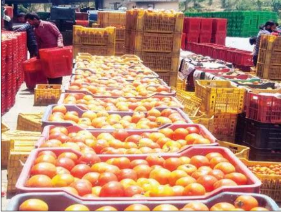
सोलन सब्जी मंडी में बिक्री को पहुंचा टमाटर।

टमाटर की मांग के चलते व्यापारी वातानुकूलित ट्रकों में टमाटर की खेप को गुजरात, कर्नाटक, मध्य प्रदेश, राजस्थान, नासिक पहुंच रहे हैं। इसी तरह हरियाणा