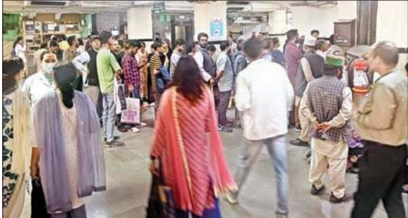
आईजीएमसी शिमला में जुटी मरीजों की भीड़।