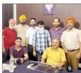
पंजाब विजिलेंस ब्यूरो की ओर से रिश्वत लेते हुए पकड़ा गया पटवारी।

उन्होंने आगे बताया कि शिकायतकर्ता ने वीबी से संपर्क किया है और अपनी शिकायत में आरोप लगाया है कि उक्त आरोपी ने उसकी पेटवुक जमीन के म्यूटेशन के लिए 4,000 रुपएकी मांग की थी। इस शिकायत की प्रारंभिक जांच के बाद वीबी टीम ने जाल बिछाया और आरोपी को दो