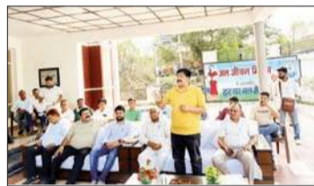
जल शक्ति विभाग के कर्मचारियों को संबोधित करते विधायक।

से पेयजल उपलब्ध करवाया जाए। उन्होंने कहा कि जलापूर्ति की जो योजनाएं जल स्रोतों के सूखने के कारण प्रभावित हुई हैं, उन क्षेत्रों में सुचारु पेयजल उपलब्ध करवाने के लिए अन्य योजनाओं से पानी उठाया जाए, ताकि उन क्षेत्रों में भी पर्याप्त जलापूर्ति की जा सके।