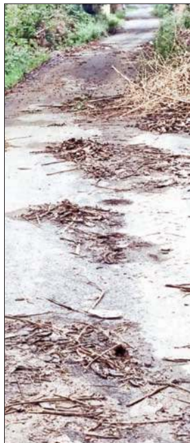
सड़क की दयनीय स्थिति का ब्यां करती तस्वीर।