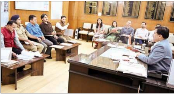
स्माइल योजना से संबंधित बैठक की अध्यक्षता करते हुए जिलाधीश अनुपम कश्यप।

ई-श्रम पोर्टल पर पंजीकृत जिन श्रमिकों के राशन कार्ड अभी तक नहीं बने हैं, उन्हें इस माह के अंत तक राशन कार्ड जारी किए जाएं, ताकि श्रमिकों को राष्ट्रीय खाद्य सुरक्षा अधिनियम 2013 के अंतर्गत प्रधानमंत्री गरीब कल्याण अन्न योजना के तहत राशन उपलब्ध करवाकर लाभान्वित किया जा सके। यह बात उपायुक्त शिमला अनुपम कश्यप ने जिला स्तरीय टास्क फोर्स समिति की बैठक की अध्यक्षता करते हुए कही। उन्होंने संबंधित अधिकारियों को इस कार्य को निर्धारित समय सीमा में पूरा करने के निर्देश दिए। अनुपम कश्यप ने कहा कि श्रमिकों को राशन कार्ड