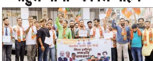
गंधी चौक हमीरपुर में प्रदर्शन करते हुए।