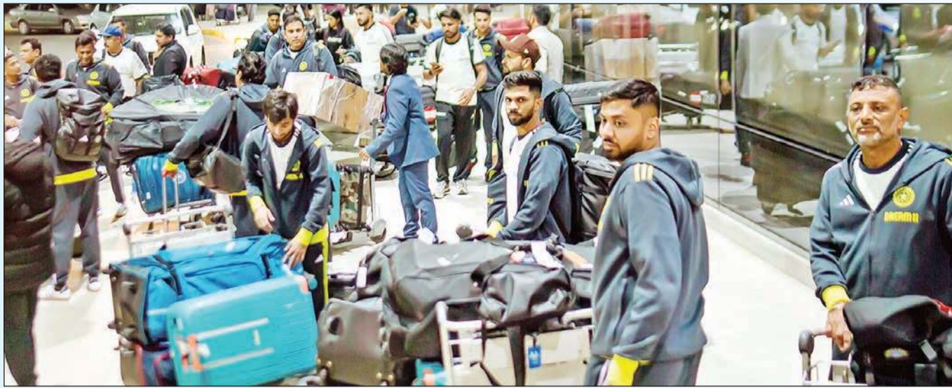
जिम्बाब्वे के साथ होने वाली पांच मैचों की अंतरराष्ट्रीय टी-20 सीरीज के लिए हवाई अड्डे से बाहर निकलते भारतीय क्रिकेट टीम के खिलाड़ी।

सीरीज के दौरान भारत के लिए पदार्पण करने वाले शीर्ष क्रम के युवा बल्लेबाज रियान पराग ने बीसीसीआई द्वारा पोस्ट किए गए एक वीडियो में कहा कि उनका बचपन से ही इस तरह (राष्ट्रीय टीम के साथ) यात्रा करने का सपना था। पराग ने कहा, "भारत की जर्सी पहनने और टीम के साथ यात्रा करने का अनुभव अलग होता है। अगम से