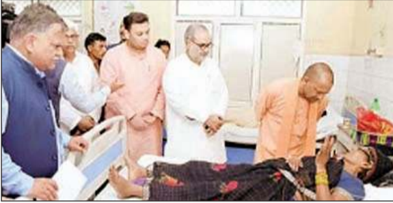
हाथरस भगदड़ में घायल हुई महिला से बात करते सीएम योगी आदित्यनाथ।

सत्संग भगदड़ हादसे के बाद हाथरस में हर जगह मातम का माहौल है। इस दर्दनाक हादसे में अब तक 121 लोगों की मौत की पुष्टि हो चुकी है। कई परिवार वाले अपने घर के लापता लोगों को तलाश रहे हैं। मृतकों की पोस्टमार्टम रिपोर्ट से मची भगदड़ खुलासा हुआ है कि ज्यादातर लोगों की मौत सीने और सिर पर चोट की वजह से हुई है।