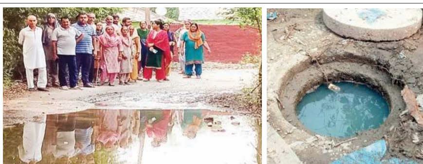
रास्ते में खड़ा पानी दिखाते ग्रामीण।

किनारों पर भी निकासी नालियां नहीं बनाई गई हैं। बारिश होने पर सारा पानी लोगों के घरों में घुस जाता है या रास्ता में तालाब का रूप धारण करके खड़ा हो जाता है। खड़े पानी से बदबू फैलती है तथा मच्छर पैदा होते हैं, जिससे संक्रमित बीमारी फैल सकती है। तालाब का रूप धारण किए हुए पानी से लोग