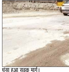
धसा हुआ सड़क मार्ग।

बावजूद इसके न तो जिला प्रशासन और न ही एन एच ए आई ने कोई सबक लिया। अब बरसात की आहट से चार मील के पास निर्माण कंपनी द्वारा निर्मित लाइवों का डंगा धंस गया है। वाहन चालक व आम लोग भयभीत हैं। यह डंगा कभी भी गिर सकता है। बरसात में डंगा गिर जाने से सड़क मार्ग फिर से बाधित हो सकता है। यह ऐसा प्वाइंट है कि यहां से वैकल्पिक सड़क मार्ग निकालना