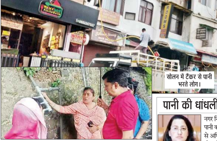
सोलन में सरकारी आवास के लिए जोई अवेध कनेक्शन।

शहर में पेयजल समस्या को लेकर जिला प्रशासन की तरफ से देर से ही सही संबंधित विभागों को दिए गए दिशा-निर्देश कारगर साबित होते नजर आ रहे हैं। डीसी सोलन मनमोहन शर्मा के निर्देश का असर जल शक्ति विभाग और नगर निगम पर देखने को मिला है। जल शक्ति विभाग को गिरि पेयजल योजना की लिफ्टिंग पाइप लाइन की लीकेज को ठीक करने की याद आई, तो नगर निगम के अधिकारियों ने फिल्ड में उतरकर पानी कनेक्शन की धांधलियों को उजागर कर दिया। इससे पानी की कालाबाजारी में संलिप्त लोगों के भी हाथ पांव फूल गए। नगर निगम टीम ने आईटीआई एरिया स्थित सरकारी आवासीय