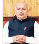
कि कभी मुझे भी चुनाव लड़ने का मौका मिलेगा, लेकिन आपने

रावत ने बताया कि यदि आपको देहरा के विकास की चिंता होती, तो आपने आज तक क्यों नहीं किया देहरा का विकास। आप मुख्यमंत्री की आड़ पर अपनी पत्नी