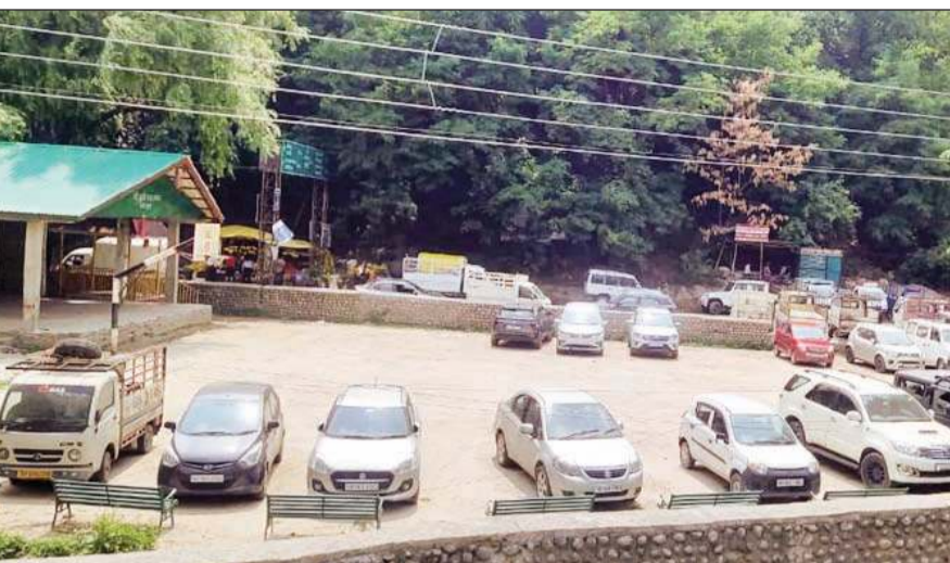
पतलीकूहल स्थित खेल मैदान में पार्क किए गए वाहन।

पतलीकूहल के पुराने बाजार को बचाने के लिए राजमार्ग को पतलीकूहल के बाहर से निकाला गया है, जिसके चलते लोग अब पतलीकूहल की पुरानी सड़कों पर गाड़ियों को पार्क कर रहे हैं, जिससे लोगों को असुविधा का सामना करना पड़ रहा है। लोगों ने पतलीकूहल में स्थित एकमात्र खेल मैदान को ही लंबे समय से पार्किंग का अड्डा बना रखा है। मैदान में पार्किंग के चलते स्थानीय बच्चे खेल नहीं पा रहे हैं। पार्किंग के चलते ही शाम को अभिभावक भी अपने बच्चों के साथ घूम नहीं पा रहे हैं। पंचायत द्वारा आराम के लिए लगाए यह