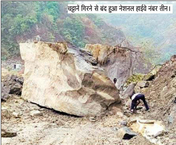
चट्टानें गिरने से बंद हुआ नेशनल हाईवे नंबर तीन।

गौरतलब है कि बीते शुक्रवार को जल शक्ति विभाग में कार्य