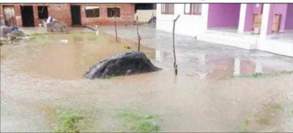
गगल में लोगों के घरों में घुसा बरसात का पानी।