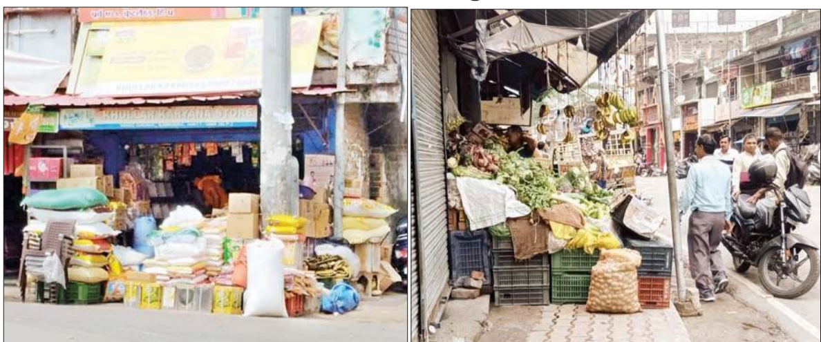
दुकान से बाहर सजाया गया सामान (दाएं) सज्जी विक्रेता ने फुटपाथ पर सजाई सज्जियां जो कि राहगीरों के लिए परेशाना का सबब बन रही हैं।