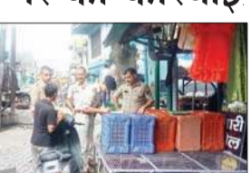
अतिक्रमण पर कार्रवाई करती पुलिस।