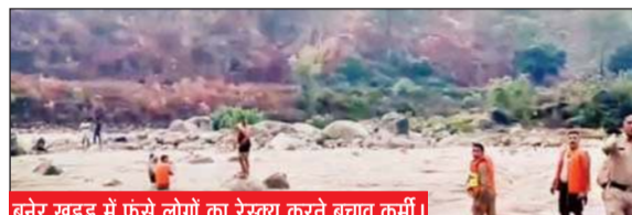
बनेर खड्ड में फंसे लोगों का रेस्क्यू करते बचाव कर्मी।