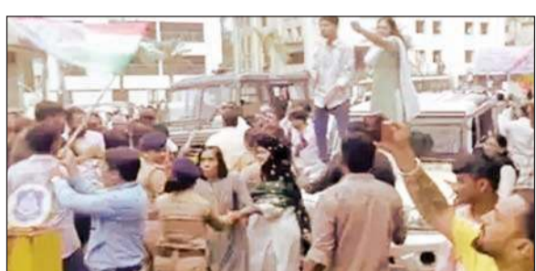
आपस में भिड़ते कांग्रेस और भाजपा के कार्यकर्ता।

लोकसभा में कांग्रेस नेता राहुल गांधी के हिंदुओं पर दिए गए बयान को लेकर गुजरात में बवाल बढ़ता रहा है। बजरंग दल के कार्यकर्ताओं द्वारा रात में दफतर पर धावा बोला गया था। इसके बाद कांग्रेस ने खुलकर सामने आकर हमला करने की चुनौती थी।