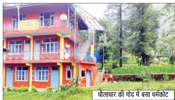
धौलाधार की गोद में बसा धर्मकोट

बताते चलें कि काफी संख्या में इसराइली सैलानियों की आमद के कारण इस शहर को तेल अवीव कहा जाता है। पर्यटन कारोबारियों के अनुसार यहां आने वाले करीब