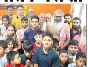
बाल संस्कार शिविर में अपना व्याख्यान देते हुए