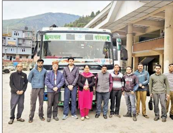
केलांग-जंस्कार रूट पर एचआरटीसी बस के ट्रायल को बस रवाना करते हुए आरएम केलांग सहित अन्य अधिकारी।

कारगिल विकास प्राधिकरण ने एचआरटीसी से बस के संचालन का आग्रह किया था। ऐसा पहली बार है, जब एचआरटीसी बस केलांग से दारचा और शिकुला दर्रे से जंस्कार घाटी होते हुए पददुम तक पहुंचेगी। लद्दाख हिमाचल के लाहौल-स्पीति जिले का सीमावर्ती क्षेत्र है। केलांग से शिकुला दर्रा होकर जंस्कार घाटी के लिए बीआरओ ने बड़े वाहनों के लिए सड़क तैयार की है। भारत का सीमावर्ती क्षेत्र होने के चलते निगम की बस सेवा शुरू होने से यहां तैनात सैनिकों को आवाजाही करने