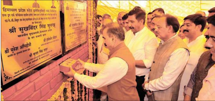
मुख्यमंत्री सुखविंद सिंह सुखू हरोली क्षेत्र में विकास योजनाओं का शिलान्यास करते हुए, उनके साथ उपमुख्यमंत्री मुकेश अग्निहोत्री, उद्योग मंत्री हर्षवर्धन चौहान, विधायक सुरेश्वर बबलू और विवेक शर्मा विवेकू आदि मौजूद रहे।

मुख्यमंत्री सुखविंद सिंह सुखू ने वीरवार को ऊना जिले के ऊना और हरोली विधानसभा क्षेत्रों के लिए 356.72 करोड़ रुपये की सात विकाससमक परियोजनाओं के लोकार्पण और शिलान्यास किए। इस अवसर पर उनके साथ उपमुख्यमंत्री मुकेश अग्निहोत्री और उद्योग मंत्री हर्ष वर्धन चौहान भी मौजूद थे।