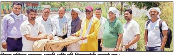
जिला परिषद सदस्य अपनी भूमि की निशानदेही कराते हुए।

ऊना जिला परिषद ने भंडोलियां खुर्द में अपनी भूमि की निशानदेही करवाई है, जो कि वर्षों से यह भूमि वीरान पड़ी थी। बुधवार को राजस्व विभाग के कानूनी, पटवारी व अन्य कर्मियों ने जिला परिषद सदस्यों की मौजूदगी में भूमि की निशानदेही की। अब जल्द जिला परिषद इस भूमि पर अपना कब्जा करेगा। इसके बाद उक्त भूमि का व्यावसायिक इस्तेमाल होगा। ऊना के एडीसी ने राजस्व विभाग को निशानदेही करने के निर्देश दिए हैं। जिला परिषद के