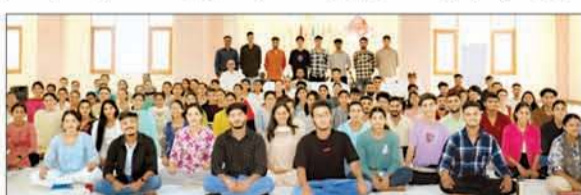
यूथ लीडरशिप ट्रेनिंग प्रोग्राम में भाग लेते प्रदेश भर के युवा।

बिलासपुर जिले की मार्केडेंड थ्रूपि भूमि मार्केड में इस शिक्वा का आयोजन किया गया। जिसमें हिमाचल प्रदेश के सभी जिलों तथा बिलासपुर के अलावा पड़ोसी राज्यों के युवाओं ने भी भाग लिया। इस प्रशिक्षण शिक्वा में कुल 121 युवा शामिल हुए, जिन्होंने न केवल जीवन जीने की कला सीखी बल्कि एक सशक्त नेतृत्व क्षमता कैसे विकसित की जाए इसके बारे में भी जानकारी ली। यह प्रोग्राम 12 जून से आरंभ होकर 19 जून तक चला। जिसमें