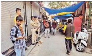
नाहन बाजार में तैनात पुलिसकर्मी।

उत्तर प्रदेश के शामली जिला से ताल्लुक रखने वाले कथित गोवंश हत्या के बाद स्टेट्स पर वीभत्स फोटो डालने वाले आरोपी पर शिकंजा टाइट हो चुका है। कथित गोवंश हत्या से जुड़ी फोटो वायरल करने वाला आरोपी सिरमौर का नाहन शहर में कपड़े का व्यवसाय करने वाला बताया गया है। आरोपी के द्वारा स्टेट्स पर डाली गई गोवंश हत्या की फोटो के बाद जिला सिरमौर में धार्मिक उन्माद फैल गया है। हिंदू वर्ग की धार्मिक भावनाएं आहत होने के बाद सिरमौर पुलिस भी एक्शन में आ चुकी है। लोगों की धार्मिक भावनाएं आहत होने को लेकर संवेदनशील हुए मामले में जांच को भी आगे बढ़ाया जा चुका है। सिरमौर पुलिस के द्वारा उत्तर प्रदेश के शामली जिला पुलिस से भी संपर्क साध लिया गया है। उत्तर प्रदेश पुलिस से मिली जानकारी के बाद पता चला है कि कथित आरोपी की लोकेशन भी ट्रेस कर ली गई है। सहरानपुर पुलिस के प्रमुख अधिकारी के द्वारा मिली जानकारी से पता चला है कि कथित आरोपी 16 तारीख से शामली जिला के जलालाबाद में लोकेट हुआ है।