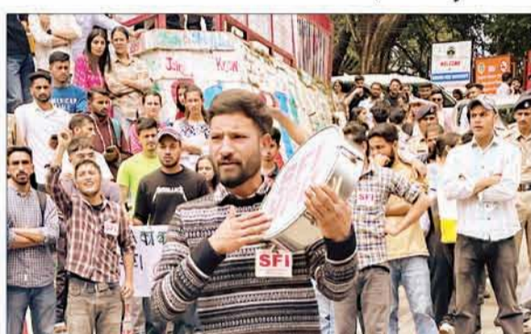
प्रदेश विश्वविद्यालय में धरना-प्रदर्शन करते हुए एसएफआई के कार्यकर्ता।

गौरलब है कि दोनों परीक्षाएं नेशनल टैरिंज एजेंसी एनटीए ने आयोजित की है। इस परीक्षा में 18 जून 2024 को 1205 परीक्षा केंद्रों पर 9 लाख से अधिक छात्र शामिल हुए हैं, लेकिन परीक्षा देने के बाद उनके पता चलता है कि इसमें भारी धांधली के चलते परीक्षा रद्द कर दी गई है। परीक्षा रद्द कराना देश के लाखों युवाओं के साथ न्याय नहीं है। एसएफआई ने कहा ऐसा लगता है कि मोदी सरकार में ये एनटीए