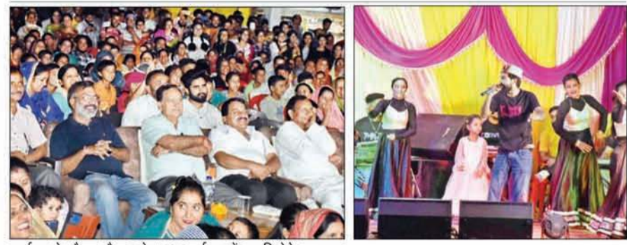
कार्यक्रम के दौरान मौजूद लोग तथा कार्यक्रम में प्रस्तुति देते कलाकार।