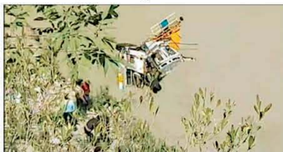
सुनी के चाचा के समीप हुए दुर्घटनाग्रस्त टुक को रोकू करते लोग।