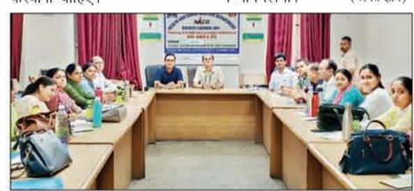
एकदिवसीय प्रशिक्षण के दौरान मौजूद अधिकारी व अन्य।