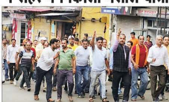
गोलीकांड के विरोध में प्रदर्शन करते भाजपा नेता व कार्यकर्ता।