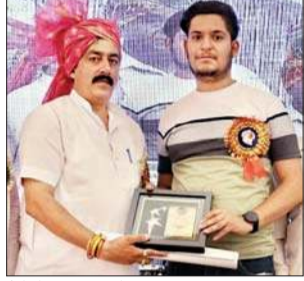
मेले में गणमान्य को सम्मानित किया गया।