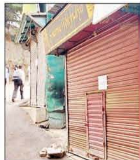
रिज में स्टॉल लगाने के विरोध में प्रदर्शन के दौरान मीडिया से बातचीत करते कारोबारी तथा (दाएं) लक्कड़ बाजार में बंद दुकानें।

दुकानें लगने से लक्कड़ बाजार के कारोबारियों की रोजी रोटी भी खतरे में पड़ गई। साथ ही इसके कारण रिज मैदान गंदगी का आलम है और रिज की सुरक्षा पर भी खतरा बढ़ गया है। पिछले साल भी कारोबारियों ने प्रशासन के समक्ष मुद्दा उठाया था