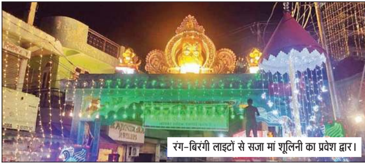
रंग-बिरंगी लाइटों से सजा मां शूलिनी का प्रवेश द्वार।

इस परंपरा को शोभायात्रा के रूप में मनाया जाता है। मान्यता है कि माता शूलिनी सच्ची श्रद्धा से मांगी गई मन्त पूरी होती है। इसी के चलते स्थानीय लोगों में मेले को लेकर खासा उत्साह है। पहले दिन मां शूलिनी देवी की भव्य शोभायात्रा निकलेगी, जिसमें एक लाख से अधिक श्रद्धालुओं के पहुंचने की संभावना है। मेले में सुरक्षा के