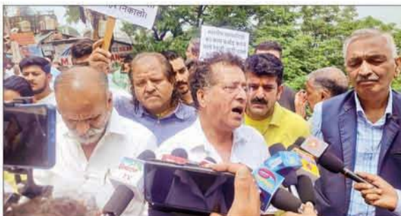
रिज में स्टॉल लगाने के विरोध में प्रदर्शन के दौरान मीडिया से बातचीत करते कारोबारी तथा (दाएं) लक्कड़ बाजार में बंद दुकानें।

कारोबारियों ने लक्कड़ बाजार बंद कर शिमला जिला प्रशासन के खिलाफ रोष रैली निकाली और रिज मैदान पर लगाए गए स्टॉल को तुरंत हटाने की मांग की। कारोबारियों का कहना है कि रिज मैदान एक ऐतिहासिक धरोहर है और देश विदेश से लोग यहां इसकी प्राकृतिक सुंदरता को निहारने के लिए पहुंचते हैं न कि रेहड़ी फड़ी और गंदगी देखने, ऐसे में रिज मैदान पर दुकानें नहीं लगनी चाहिए। शिमला लक्कड़ बाजार कारोबारी एसोसिएशन ने विरोध स्वरूप बाजार पुरे दिन के लिए बंद