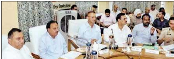
जिला स्तरीय शिकायत निवारण समिति बैठक की अध्यक्षता करते हर्षवर्धन चौहान।

उद्योग मंत्री ने जल शक्ति महकमे को चंदोल उपमंडल के अंतर्गत आने वाली सभी पंचायतों की पीसी बरिस्त्यों को उठाऊ पेयजल योजना का कार्य शीघ्र पूर्ण करने के निर्देश दिए। उन्होंने खाला क्याप में उठाऊ पेयजल एवं सिंचाई योजना को सुचारु करने व पंचायत कटाह शीतला को दुरुस्त करने के निर्देश दिए। उन्होंने नेरीपुल-पुलवाहन सड़क को ब्लैक स्मॉट में लेकर कार्य करने को कहा। उद्योग मंत्री ने कहा कि प्रदेश में शिकायत निवारण समिति सरकार और जनता की दूरी को कम करने में