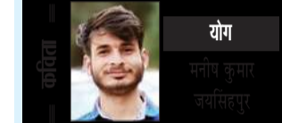
योग का महत्व है अनमोल है सच्ची आनंद की राह तन और मन को आपस में जोड़े जीवन में लाए एक नई चाह योग की प्राचीन धारा भारत की है यह उपहार पतंजलि के सूत्रों में सहजा ज्ञान अपार

हम रहे हैं सारी सुख सुविधाएं भोग जानते हुए भी कि 'योग रखे निरोग' भूल रहे हैं हम करना रोज योग आओ मिलकर संकल्प लें योग को जीवन में अपनाएं स्वस्थ और संतुलित शरीर, मानसिक तनाव को दूर करने के लिए प्रतिदिन योग दिवस मनाएं 'हर रोज योग' करने का संदेश फैलाएं।