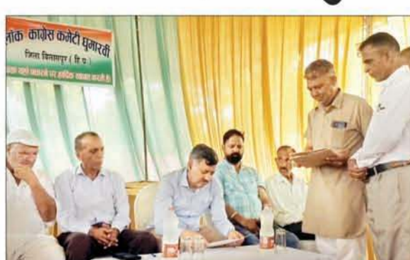
बैठक के दौरान लोगों की समस्याएं सुनते शिक्षा मंत्री राजेश धर्माने।

इस अवसर पर सभी बूथ लेवल के कार्यकर्ताओं ने भाग लिया तथा लोकसभा चुनावों के नतीजों को लेकर चर्चा की। साथ ही घुमारवीं विधानसभा क्षेत्र के विकास कार्यों को गति देने के लिए कार्यकर्ताओं को सुझाव देने के साथ उनसे सुझाव भी लिए गए। इस