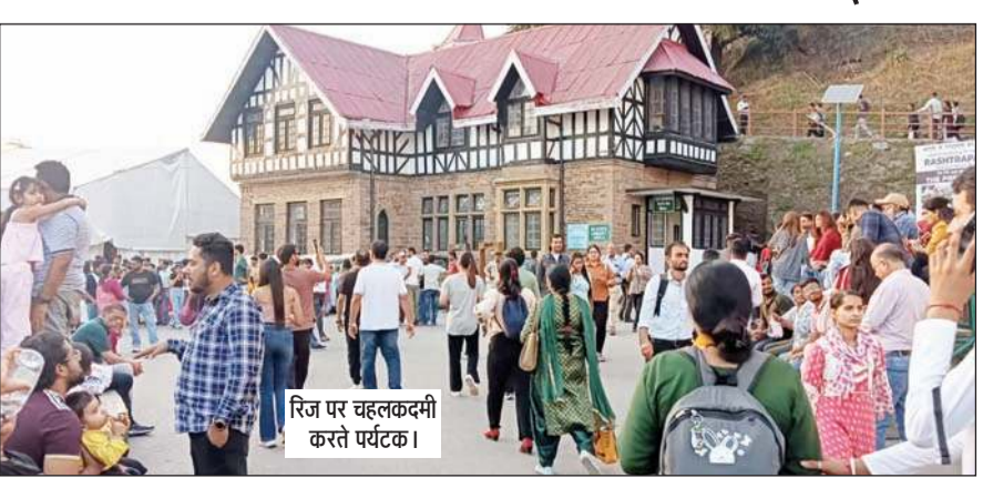
रिज पर चलकदमी करते पर्यटक।

ऊना में अधिकतम तापमान 43.5 डिग्री रहा, जबकि शिमला में 30.2 डिग्री रहा। यहां हल्की हवाएं चलने से तापमान में थोड़ी राहत मिली है। कांगड़ा, बिलासपुर, हमीरपुर, चंबा, धौलाकुआं, बरटी का तापमान 40 डिग्री पार रहा। मौसम विभाग ने