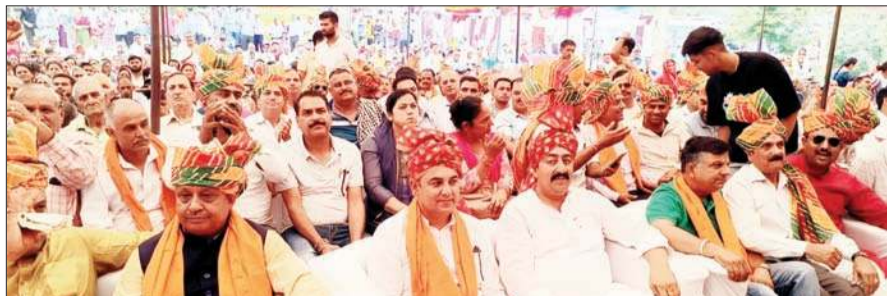
कुटलैहड़ के पिपलू मेले में आपसी प्रेम और भाईचारे का संदेश देती यह तस्वीर। सियासी मतभेदों को दूर रखकर पंडाल में एक साथ बैठकर रंगारंग सांस्कृतिक कार्यक्रम का आनंद उठाते कांग्रेस, भाजपा के नेता और कार्यकर्ता।