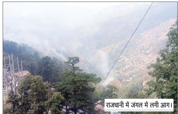
राजधानी में जंगल में लगी आग।

सूत्रों की मानें तो जंगलों में आग लगाने के गुनाहगार या तो नशेड़ी तत्व हैं या फिर कुछ लोग नई घास उगाने के चक्कर में आग लगा देते हैं, लेकिन सबसे बड़ा सवाल यह है कि आग लगाने से पहले लोगों ने यह नहीं सोचा कि