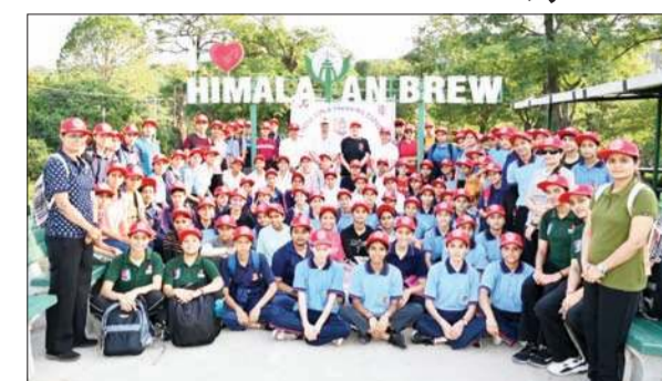
उत्तर भारत के गर्ल्स ट्रैकर एक साथ समूहिक चित्र में।