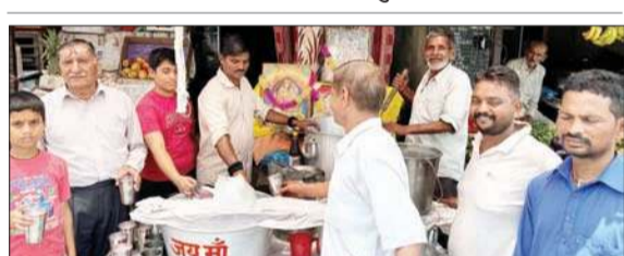
मुबारिकपुर बाजार में ठंडे पानी की छबील में जल ग्रहण करते लोग।