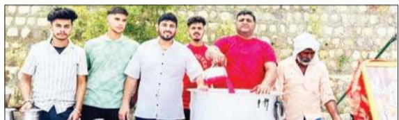
ऊना के बाबा बेदी परिसर में छबील में सेवा करते युवक।