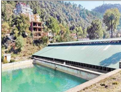
सोलन के फॉरेस्ट रोड में बना निगम का वाटर टैंक।

मुख्य टैंकों में पानी की मात्रा कम होने की स्थिति में शहर के दूरवर्ती क्षेत्रों में पानी का प्रेशर नहीं पहुंच पाता। इसके चलते लोगों की घरों में लगी टैंकियों में पानी नहीं पहुंच पाता। सलोगाड़, खुडीधार, चंबाघाट, हार्दिसंग कॉलोनी, कथेड़ और शामति क्षेत्रों में यह समस्या अधिक है। प्रेशर की कमी के चलते लोगों को मांग अनुसार पानी नहीं मिलता, जिससे लोग वाटर टैंकर का पानी खरीदने को मजबूर हैं।