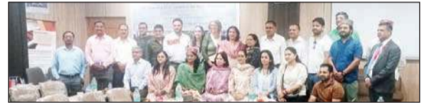
जर्मन कॉर्पोरेशन के सहयोग से आयोजित किसान तकनीकी मेले में भाग लेते किसान।