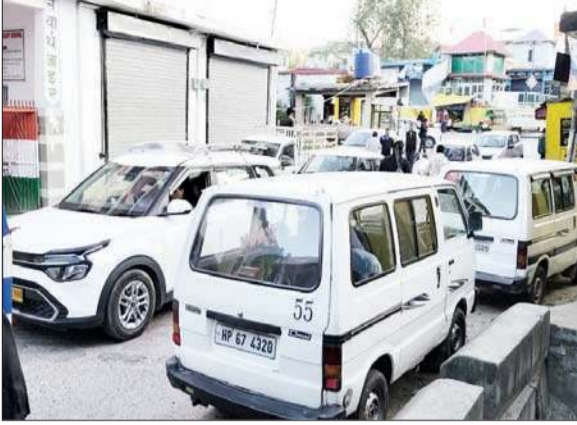
कस्बा बड़ा में लगा ट्रैफिक जाम।

उपमंडल नादौन के कस्बा बड़ा में वर्तमान समय में ट्रैफिक का प्रतिदिन जाम लगना आम बात हो गई है। यहां पर ट्रैफिक जाम कई बार इतना लंबा लग जाता है कि उसे बहाल होने में आधे घंटे से भी ज्यादा समय लग जाता है, जिससे न केवल वाहन चालकों को बल्कि राहगीरों को भी काफी परेशानी का सामना करना पड़ता है। कस्बा बड़ा में जाम लगने का मुख्य कारण कस्बा बड़ा के चौक पर सड़क का तंग होना और उस सड़क से धौलासिद्ध विद्युत परियोजना के लिए बड़ी गाड़ियों द्वारा हेवी मशीनों लेकर जाना है। गौर हो कि कस्बा बड़ा में आए दिन लग रहे