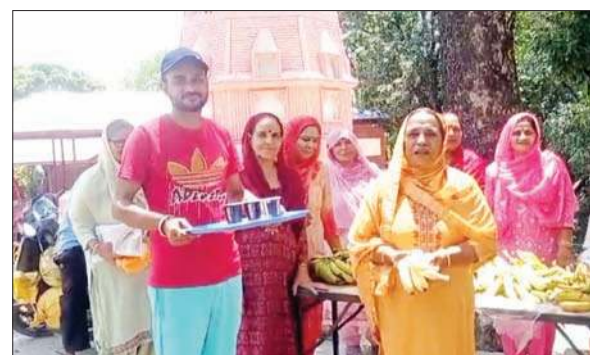
निर्जला एकादशी पर लगाई गई टंडे-मीठे पानी की छबील।