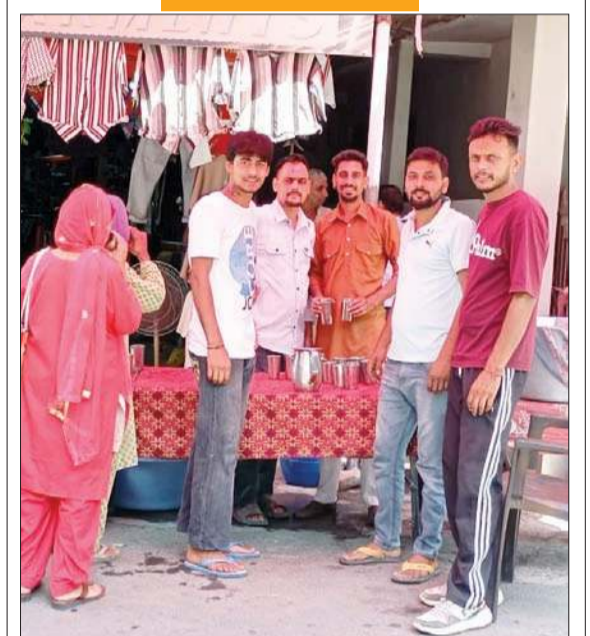
बिलासपुर शहर की गांधी मार्केट में स्थानीय दुकानदारों द्वारा लगाई गई टंडे-मीठे पानी की छबील।