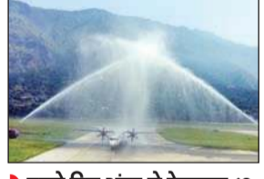
पहले दिन भुंतर से देहरादून 13 व देहरादून से भुंतर पहुंचे 46 यात्री

हवाई उड़ान फ्लाइट शुरू होने पर कुल्लू के भुंतर एयरपोर्ट पर विमान को वाटर केनन सेल्फ्ट दिया गया। भुंतर हवाई अड्डे पर विमान के उड़ान भरने से पहले दोनों तरफ से पानी की बौछारों से इसका स्वागत किया गया। पहली उड़ान में कुल्लू से देहरादून के लिए 13 यात्रियों और देहरादून से कुल्लू के लिए 46 लोगों ने यात्रा की। बुधवार को भुंतर से देहरादून के लिए 30, जबकि देहरादून से भुंतर के बीच