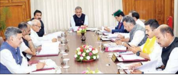
मंत्रिमंडल बैठक की अध्यक्षता करते मुख्यमंत्री सुखविंद सिंह सुक्खू।

कांस्टेबल के 1226 पद भरे जाएंगे और दो पद सरकारी शिक्षा विभाग में 6630 से अधिक पद भरे जाएंगे। स्वास्थ्य एवं परिवार कल्याण विभाग में चिकित्सा अधिकारियों के 200 पद और चिकित्सा महाविद्यालयों में प्रोफेसर, एसोसिएट प्रोफेसर व सहायक प्रोफेसर के 22 पद भरने को मंजूरी दी। डॉ. यशवंत सिंह परमार राजकीय चिकित्सा महाविद्यालय नाहन में प्रोफेसर के तीन, एसोसिएट प्रोफेसर के दो पद, श्रीलाल बहादुर शास्त्री राजकीय