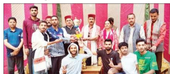
विजेता टीम को ट्रॉफी देकर सम्मानित करते मुख्यातिथि।