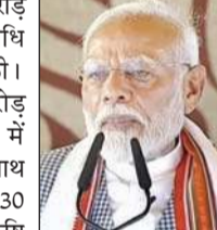
बोले- मेरा सपना दुनिया की हर डाइनिंग टेबल

मोदी ने कहा कि मेरा सपना है दुनिया की हर डाइनिंग टेबल पर भारत