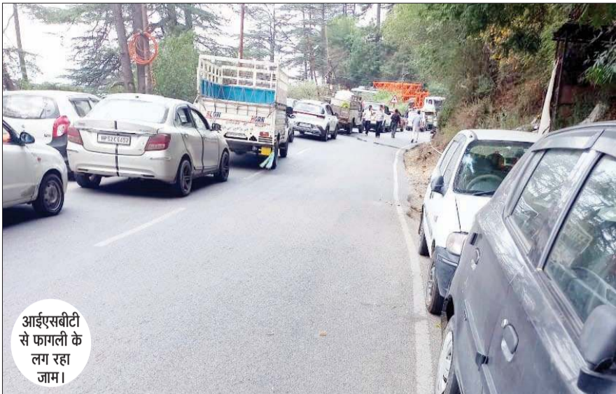
आईएसबीटी से फागली के लग रहा जाम।

वहीं, स्कूली बच्चों की हालत भी ऐसी ही बनी हुई है। इन दिनों शिमला में समर फेस्टिवल चला है, ऐसे में वाहनों की संख्या भी