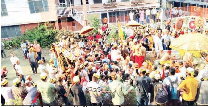
भगवान रघुनाथ जी के मंदिर में जल विहार पर्व के मौके पर परंपराओं का निर्वहन करते हुए।

कुल्लू के अधिष्ठाता देवता भगवान रघुनाथ के सुल्तानपुर (रघुनाथपुर) स्थित देवालय में मंगलवार को जल विहार पर्व धूमधाम से मनाया गया। इस मौके पर रघुनाथ जी की पूजा-अर्चना के अलावा दिनभर भजन-कीर्तन का दौर भी जारी रहा। देवालय में बड़ी संख्या में श्रद्धालु उमड़े। इस दौरान मंदिर के समीप जलाशय में भगवान रघुनाथ की जल क्रीड़ा की झलक पाकर श्रद्धालुओं ने पुण्य कमाया। जल क्रीडा के दौरान पुरोहितों ने जलाशय का पवित्र जल श्रद्धालुओं पर भी छिड़का। इस मौके पर भगवान रघुनाथ के मुख्य छडीबरदार महेश्वर सिंह विशेष रूप से मौजूद रहे। भगवान रघुनाथ के अलावा हनुमान शालीग्राम और नरसिंह भगवान सहित सभी मूर्तियों के स्नान के बाद शृंगार किया गया। खास यह रहा कि मणिकर्ण घाटी के देवता काली नाग