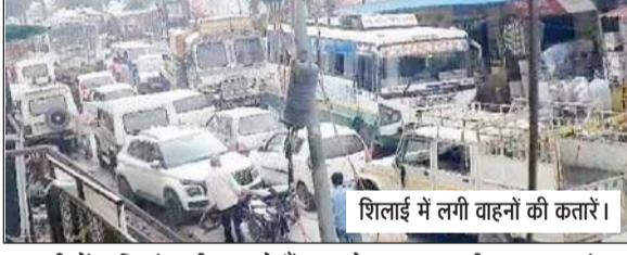
शिलाई में लगी वाहनों की कतारें।