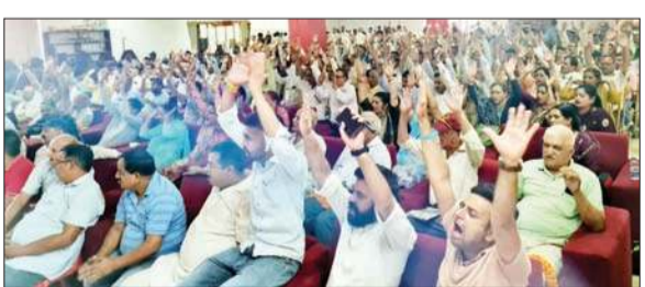
कांग्रेस के कार्यक्रम में मौजूद कार्यकर्ता।