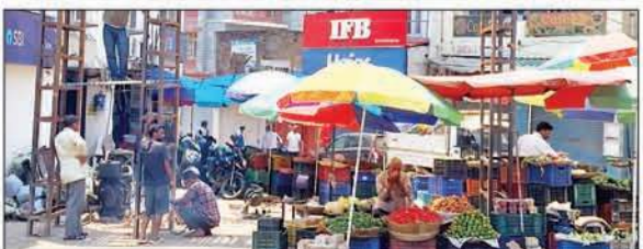
नगर निगम के मुख्य द्वार को अंतिम रूप देने के लिए कार्य करते वर्कर।

बता दें कि एसबीआई बैंक की इमारत के साथ गेट को बनाया गया है जो लगभग 5 लाख की लागत और साढ़े छह मीटर ऊंचा