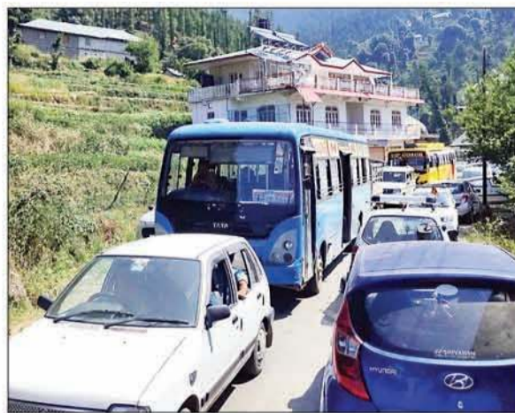
देव कमरूनाग के मंदिर में लगे सरानाहुली मेले के लिए जाते वाहन, लगी लंबी कतारें।

वहीं मामले पर डीएसपी सुंदरनगर भारत भूषण ने बताया कि देव कमरूनाग मंदिर में आयोजित मेले के बाद श्रद्धालु वापस लौट रहे हैं। इस कारण सड़क मार्ग पर जाम लग रहा है। उन्होंने बताया कि संबंधित पुलिस को क्षेत्र में ट्रैफिक व्यवस्था को सुचारु करने के आदेश दिए गए हैं।