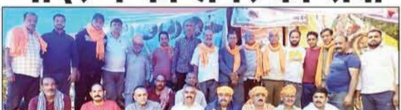
युवा शक्ति संघ जाहू के सभी सेवादार सामूहिक चित्र में।