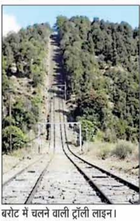
बरोट में चलने वाली ट्रैली लाइन।

अभिषेक, जोगिंदरनगर जोगिंदरनगर से करीब 39 किलोमीटर दूर बरोट घाटी में पर्यटकों की आमद बढ़ने से कारोबार को फिर से पंख लग गए हैं। उतर भारत में गर्मी बढ़ते ही पंजाब, हरियाणा, दिल्ली और राजस्थान के पर्यटकों की चहलकदमी बढ़ी है, पर जाम के कारण पर्यटकों को जाम का सामना करना पड़ रहा है। इससे यहां के होटल, रेस्तरां और काफ़्ट शैली के होम स्टे संचालकों की भी आमदनी में इजाफा हुआ है। रविवार को मंडी-कांगड़ा सीमा से बरोट वैली