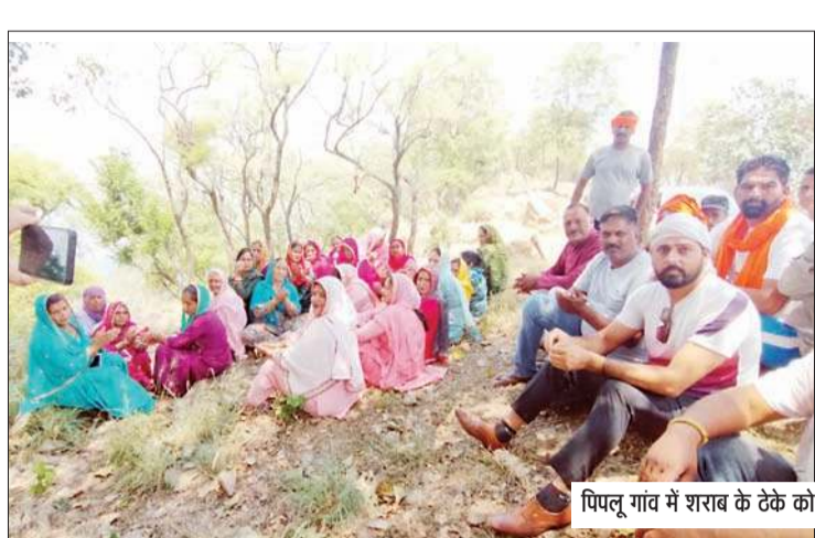
पिपलू गांव में शराब के ठेके को खोलने के विरोध में प्रदर्शन करते गांववासी।

जात रहे बाबा पहाड़िया और बाबा बालक नाथ जी का छत्र जब रक्षा बंधन के दिन मंदिर से निकलता