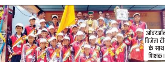
ओवरऑल विजेता टीम के साथ शिक्षक।

इस प्रतियोगिता में 25 स्कूलों के लगभग 350 छात्रों ने भाग लिया, जिसमें खरगा स्कूल ओवरऑल चैंपियन रहा। वॉलीबाल में खरगा प्रथम व निरमंड द्वितीय, कबड्डी में शाइनिंग स्टार स्कूल जगातखना प्रथम व कशौली द्वितीय, जबकि खो-खो में खरगा प्रथम व देवभूमि मॉडल पब्लिक स्कूल जगातखाना द्वितीय