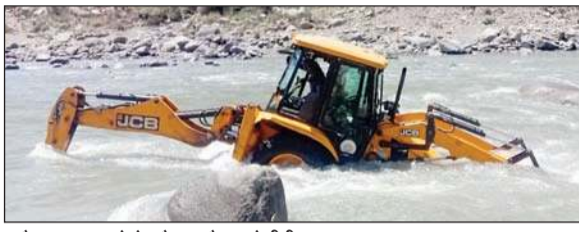
अवैध खनन करने के दौरान मौजूद जेसीबी चालक।

जिंदगियों को देखते हैं। मगर आज दिन तक किसी अधिकारी द्वारा इस विषय में आवाज बुलंद करना गवारा नहीं समझा गया है। वहीं रावी नदी में गत वर्ष आए भयंकर उफान की बात करें तो वह मंजर याद कर कई के रंगते आएं आ भी खड़े हो जाते हैं। 1995 में रावी नदी ने खड़ामुख से लेकर राजनगर तक तबाही ही तबाही मचाई। नदी के संवेदनशील तटों में से एक