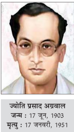
ज्योति प्रसाद अग्रवाल जन्म : 17 जून, 1903 मृत्यु : 17 जनवरी, 1951

असम के तेजपुर के प्रसिद्ध साहित्यकार, स्वतंत्रता सेनानी और फिल्म निर्माता ज्योति प्रसाद अग्रवाल बहुआयामी और विलक्षण प्रतिभा के धनी थे। उनका शुभ आगमन ऐसे समय में हुआ, जब असमिया संस्कृति अपने मूल रूप से विछिन होती जा रही थी। अग्रवाल एक नाटककार, कथाकार, गीतकार, पत्र संपादक, संगीतकार तथा गायक सभी कुछ थे। मात्र 14 वर्ष की उम्र में ही उन्होंने 'शोणित कुंवरी' नाटक की रचना कर असमिया साहित्य को समृद्ध कर दिया था। इनका परिवार वर्ष 1811 ई. में राजस्थान के मारवाड़ से असम में आकर बस गया था। इन्होंने अपनी शिक्षा असम तथा कोलकाता में पाई थी। ज्योति प्रसाद ने वर्ष 1921 में मैट्रिक की परीक्षा उत्तीर्ण की थी। यद्यपि इस दौरान असहयोग आंदोलन प्रारंभ हो जाने पर उन्होंने पढ़ाई छोड़ दी थी, लेकिन आंदोलन रुक जाने पर कोलकाता के 'नेशनल कॉलेज' में प्रवेश ले लिया था। इसके बाद वे 1926 में इकोनॉमिक्स के अध्ययन के लिए इंग्लैंड चले गए और फिर शिक्षा पूर्ण कर 1930 में स्वदेश लौट आए। इसके बाद ज्योति प्रसाद अग्रवाल कुछ समय के लिए जर्मनी चले गए थे, जहां उनका संपर्क हिमांशु राय से हुआ। राय से उन्हें सिनेमा निर्माण की कला सीखने का अवसर मिला। 1930 में भारत आते ही ज्योति प्रसाद फिर असहयोग आंदोलन में सम्मिलित हो गए और उन्हें 15 महीने की कैद की सजा मिली। उन्होंने वर्ष 1935 में असमिया साहित्यकार लक्ष्मीकांत बेजबरूआ के ऐतिहासिक नाटक 'ज्योमति कुंवारी' को आधार मानकर प्रथम असमिया फिल्म बनाई।