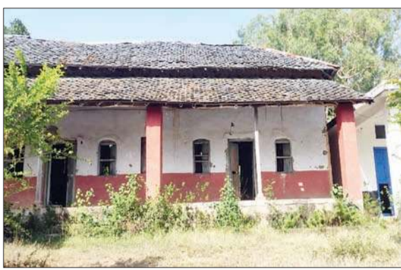
बंद पड़े प्राथमिक विद्यालय तरकेड़ी के टूटे हुए दरवाजे।

विद्यालयों को बंद किया जा रहा है। बता दें कि हिमाचल सरकार द्वारा बच्चों को शिक्षित करने हेतु भव्य भवनों का निर्माण किया गया है, परंतु विद्यालयों के बंद होने के उपरांत उन सभी भवनों का सदुपयोग नहीं हो पा रहा है, जिससे भवन जर्जर अवस्था को प्राप्त हो रहे हैं। इसी क्रम में तरकेड़ी गांव का प्राथमिक विद्यालय भी विगत दो वर्षों से बंद पड़ा है, जिससे यह भवन लगातार जर्जर अवस्था को प्राप्त हो रहा है और सुरक्षा व्यवस्था के अभाव में नशेड़ियों का अड्डा बनता जा रहा है।