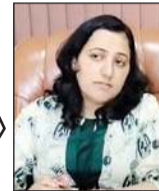
दिन के अंदर जमा करवाना होगा।

प्रॉपर्टी टैक्स निर्धारित करने के लिए निगम ने भवनों का सर्वेक्षण किया पर इसमें आठ महीने का समय लग गया। पिछले वित्तीय वर्ष 2023-24 में निगम पुरानी दर से चार अगस्त 2023 तक 125 दिन यानी चार महीने का टैक्स वसूल कर चुकी है। यह व्यवस्था इसलिए की गई है क्योंकि सरकार ने 4 अगस्त 2023 से नए प्रॉपर्टी टैक्स को लागू करने की अधिसूचना जारी की थी। अब सर्वेक्षण का कार्य पूरा हो चुका है। पिछले वित्तीय वर्ष के आठ महीने मिलाकर वित्तीय वर्ष 2024-25 का भी प्रॉपर्टी टैक्स लंबित है, जिसे अब वसूल किया जाएगा।