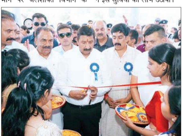
आयुर्वेदिक अस्पताल का शुभारंभ करते उप मुख्यमंत्री मुकेश अग्निहोत्री।

अधिकारियों को संस्थान में पानी की समुचित व्यवस्था सुनिश्चित बनाने को कहा। मुकेश अग्निहोत्री ने अस्पताल में आयोजित स्वास्थ्य जांच शिविर का भी शुभारंभ किया। इस शिविर में आयुर्वेदिक कॉलेज एवं अस्पताल पुरपोला के वरिष्ठ चिकित्सकों ने लोगों की स्वास्थ्य जांच की। क्षेत्र के करीब 500 लोगों ने इस सुविधा का लाभ उठाया।