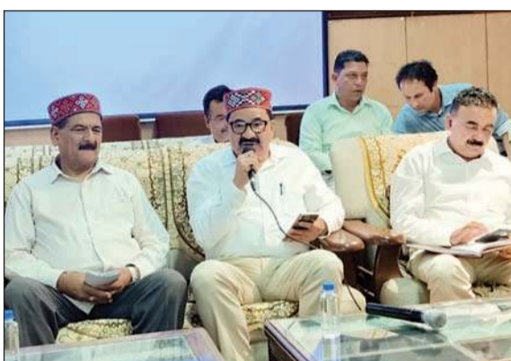
देवसदन में आयोजित जिला भाजपा की समीक्षा बैठक के दौरान भाजपा पदाधिकारी।

बैठक में हर विषय पर विस्तार से चर्चा की गई। बैठक में उपस्थित पदाधिकारियों ने समीक्षा बैठक में बहुमूल्य सुझाव दिए। सभी सुझावों पर व्यापक चर्चा की गई। बैठक में मंडी संसदीय क्षेत्र से भाजपा प्रत्याशी कंगना रनौत की जीत को सभी कार्यकर्ताओं की मेहनत का परिणाम बताया। इस संसदीय क्षेत्र के चुनाव में कुल्लू, मनाली सहित बंजार विधानसभा क्षेत्र से भाजपा प्रत्याशी को अच्छी बढ़त मिली है। बैठक में सभी