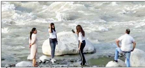
रावी के तट पर जान को खतरे में डालते हुए पर्यटक।

गौर हो कि वार-त्यौहार के दिनों में अधिकारियों द्वारा छापाकारी कर चेतावनी अथवा चालान प्रक्रिया के बाद कई-कई माह ऐसे लोगों को नजरअंदाज कर दिया जाता है। जिसकी वजह से महंगाई के दौर में बेरोजगारी के आलम से गुजर रहे लोग व बंजारे नदी तटों पर बार-बार जिंदगी जोखिम पर लगाने से भी गुरेज नहीं कर रहे हैं। हैरानी की बात है कि रावी नदी तट से हाईवे मार्ग के सटे होने के चलते कई अधिकारी रोजाना आवागमन कर इन तटों पर जोखिम में डली