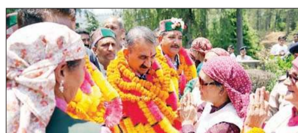
मुख्यमंत्री सुखवंद सिंह सुक्खू का स्वागत करती महिलाएं।

मुख्यमंत्री सुखवंद सुक्खू ने रविवार को शिमला जिले के टियोग विधानसभा क्षेत्र के नारकंडा का दौरा कर लोगों की जनसमस्याएं सुनीं। मुख्यमंत्री ने कहा कि ऊपरी शिमला विशेषकर कुफरी, फागू, टियोग और नारकंडा के लोगों