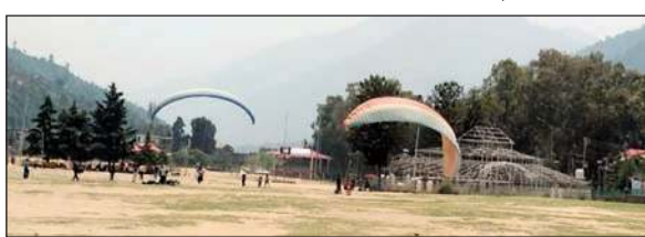
रिविवा को ढालपुर मैदान में पैराग्लाइडिंग का लुफ्त उड़ते हुए पर्यटक।

इस संदर्भ में जिला पर्यटन विभाग कुल्लू को मिली शिकायत पर जांच करने पर पाया गया कि पैराग्लाइडरों ने अपनी मनमानी की थी। इस पर कार्रवाई करते हुए विभाग ने पीज