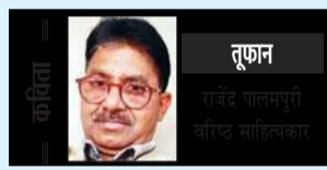
आज फिर तुफान का इमकान है।

कुवैत में एक लेबर कैंप में लगी आग भी उसका बहुत बड़ा उदाहरण है। नियमों को ताक पर रखकर बनाए गए कैंप में करीब 195 मजदूरों को भेड़-बकरियों की तरह रखा गया था। सोशल मीडिया में वायरल आगजनी की फोटो देखकर अंदाजा लगाया जा सकता है कि सुरक्षा प्रबंधन के बराबर थे। लेबर कैंपों में किचन सबसे नीचे वाले फ्लोर पर रहता है। कुल मिलाकर कुवैत में लेबर कैंपों में लगी आग जैसी घटनाओं की पुनरावृत्ति रोकने के लिए सभी को सुरक्षा नियमों का पालन करना चाहिए। (ये लेखक के निजी विचार हैं)