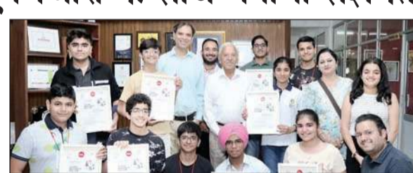
शुल्गिनी यूनिवर्सिटी में समर पेंटेंट स्कूल टीम आइडियाज दैट मैटर कार्यक्रम में हिस्सा लेते बच्चे।

2021 में शुरूआत के बाद से समर पेंटेंट स्कूल के छह सफल समूह देखे गए और हाल ही में इसका सातवां समूह संपन्न हुआ, जिसमें पूरे भारत से 200 से अधिक छात्र शामिल हुए। समर पेंटेंट स्कूल टीम आइडियाज दैट मैटर और