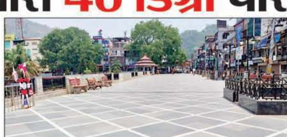
प्रचंड गर्मी के कारण शहर में सन्नाटा।

गर्मी का प्रचंड प्रकोप इतना बढ़ गया है कि शहर में दोपहर के समय बिल्कुल सन्नाटा नजर आ रहा है। शनिवार से ही मंडी शहर में तापमान 40 डिग्री को पार कर गया है। शनिवार को तापमान 41 डिग्री तक पहुंच गया था और रविवार को भी तापमान 41 डिग्री पहुंच गया। मंडी शहर में जहां रविवार को भी लोगों की चहल पहल रहती थी वहीं दोपहर में हीट वेव शुरू हो जाती है और गर्म हवा ही चारों ओर चलती है। गर्मी से राहत पाने के लिए लोग ठंडे इलाकों का रुख कर रहे हैं जहां मंडी जिला के पर्यटन स्थल शिकारी देवी, पराशर झील, कमरूनाग झील की ओर भारी मात्रा में जा रहे हैं। शहर में