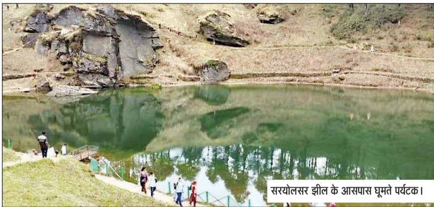
सरयोलसर झील के आसपास घूमते पर्यटक।

ऐसा ही एक पर्यटन व धार्मिक स्थल है सरयोलसर, जहां पर इन दिनों देशभर के पर्यटकों का खूब तांता लगा हुआ है। सनद रहे कि देशभर के मैदानी इलाके गर्मी की तपिश से तप रहे हैं। ऐसे में गर्मी से राहत पाने के लिए सैलानी इन दिनों ठंडे स्थलों का रुख कर रहे हैं। कुल्लू के आनी उपमंडल में एनएच-305 सड़क मार्ग के मध्य लगभग 10 हजार फुट की ऊंचाई पर स्थित जलोढ़ी दर्रा और दर्रे से तीन किलोमीटर आगे स्थित प्राकृतिक सरयोलसर झील सैलानियों के लिए पर्यटकीय सैरगाह बनी हुई है। आनी क्षेत्र में पर्यटन की आपार संभावनाएं हैं। पर्यटकों के लिए यह स्थान स्वर्ग से कम नहीं है। जलोढ़ी दर्रे से सरयोलसर