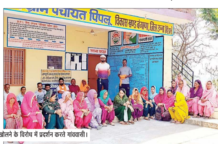
पिपलू गांव में शराब के ठेके को खोलने के विरोध में प्रदर्शन करते गांववासी।