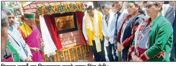
विकास कार्यों का शिलान्यास करते जगत सिंह नेगी।