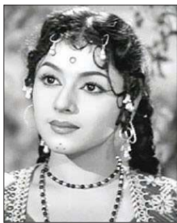
पद्मिनी जन्म- 12 जून, 1932 मृत्यु- 24 सितंबर, 2006

पद्मिनी का जन्म तिरुवनंतपुरम में हुआ था। पद्मिनी साउथ फिल्म इंडस्ट्री की बेहतरीन एक्ट्रेस थीं जिसने राज कपूर की 'मेरा नाम जोकर', 'जिस देश में गंगा बहती है' और 'आशिक' जैसी फिल्मों में काम किया। भरतनाट्यम और कथकली में पारंगत एक्ट्रेस के लिए कहते हैं कि यह पहली साउथ एक्ट्रेस थीं, जिसने हिंदी सिनेमा में काम किया। आज जिस तरह से हिंदी फिल्म इंडस्ट्री बनाम साउथ फिल्म इंडस्ट्री को लेकर तकरार छिड़ी हुई है, ऐसे में इन कलाकारों के योगदान को याद करने की जरूरत है, जिन्होंने भाषा-इलाका से ऊपर उठ कर सिर्फ कला को महत्व दिया। करीब 275 फिल्मों में काम कर चुकीं पद्मिनी ने सिर्फ तमिल, तेलुगु, मलयालम, हिंदी ही नहीं बल्कि रशियन फिल्म में भी काम किया था। पद्मिनी की