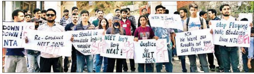
नीट परीक्षा में हुए भ्रष्टाचार और कुप्रबंधन के खिलाफ प्रदर्शन करती एसएफआई विश्वविद्यालय की इकाई।

परिणामस्वरूप यह एक बार फिर साबित हो गया है कि एक केंद्रीकृत संस्था एनटीए नीट जैसी प्रवेश परीक्षा आयोजित करवाने में अयोग्य है। एमबीबीएस-बीडीएस स्नातक स्तरीय प्रवेश परीक्षा में कुल अंक 720 होते हैं। प्रत्येक सही उत्तर के लिए 4 अंक दिए जाते हैं,