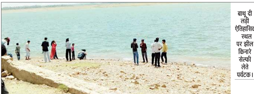
बाथू दी लड़ी ऐतिहासिक स्थल पर झील किनारे सेल्फी लेते पर्यटक।

पाँग झील के मध्य स्थित बाथू दी लड़ी ऐतिहासिक स्थल पर पर्यटकों की झील के पानी के साथ अठखेलियां महंगी पड़ सकती हैं। पाँग झील के गहरे पानी के किनारे पर पर्यटक खड़े होकर सेल्फी ले रहे हैं जबकि उनको इस बात का जरा भी ध्यान नहीं है कि एक पैर आगे धरने से मौत हो सकती है। झील का पानी इतना गहरा है कि किसी को भी इसका इल्म नहीं है। रोजाना सैकड़ों पर्यटक यहां आकर पानी के किनारे बैठकर सेल्फियां लेते हैं और जर्जर हो चुकी मीनार के ऊपर चढ़कर सेल्फियां लेते हैं, लेकिन प्रशासन बेखबर बैठा है।