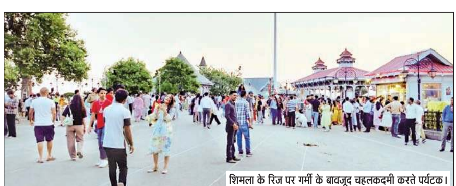
शिमला के रिज पर गर्मी के बावजूद घलकदमी करते पर्यटक।

इससे तापमान में दो से तीन डिग्री की बढ़ोतरी होगी। 13 जून को कुल्लू और कांगड़ा जिलों के कुछ इलाकों में लू चल सकती है। चिंता की बात यह है कि एक सप्ताह तक बारिश और ग्री-मानसून की कोई संभावना नहीं है। हालांकि, 17 से 18 जून तक प्रदेश में ग्री-मानसून आने की संभावना है। इसके बाद हीटवेव से राहत मिलने की संभावना है। मौसम विज्ञान केंद्र