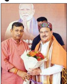
नड्डा को सम्मानित करते हुए गणमन्य।