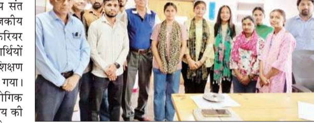
बीटन कॉलेज में करियर काउंसलिंग कार्यक्रम में हिस्सा लेने वाले प्रतिभागी।