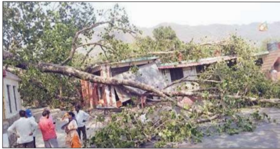
गरीब विधवा के मकान पर गिरा पेड़, जिस कारण उसे काफी नुकसान हुआ।