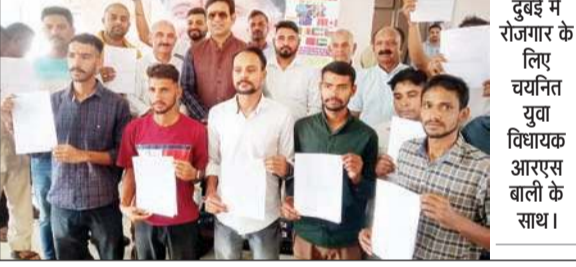
दुबई में रोजगार के लिए चयनित युवा विधायक आरएस बाली के साथ।

विधानसभा क्षेत्र के चयनित 11 युवाओं की ट्रेनिंग का खर्चा आरएस बाली ने उठवाया। ट्रेनिंग पूरी करने के बाद मंगलवार को उन्हें दुबई जाने के लिए नियुक्ति पत्र वितरित किए गए। इस अवसर पर इस रोजगार में सरकार का सहयोग कर रही कंपनी इंटेलेक्ट ग्लोबल रिसर्च