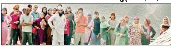
घटना के दौरान मौजूद लोग।

राजकीय उच्च विद्यालय नैला में एसएमसी कमेटी के गठन को लेकर विवाद खड़ा हो गया। जब कमेटी गठन के तहत वोटिंग के दौरान बराबरी हो गई तो एक पक्ष ने दूसरे पक्ष पर हमला बोल दिया। इस झड़प में एक स्थानीय बुजुर्ग दंपती बुरी तरह से घायल हो गए हैं। जिन्हें नार्मल अस्पताल तीसा में भर्ती करवाया गया है। बुजुर्ग दंपती को मारने के बाद उक्त दंपती के घर पर दूसरे पक्ष ने जमकर