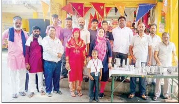
डांगडा बाजार में लगाई छबील में पानी पीते लोग।