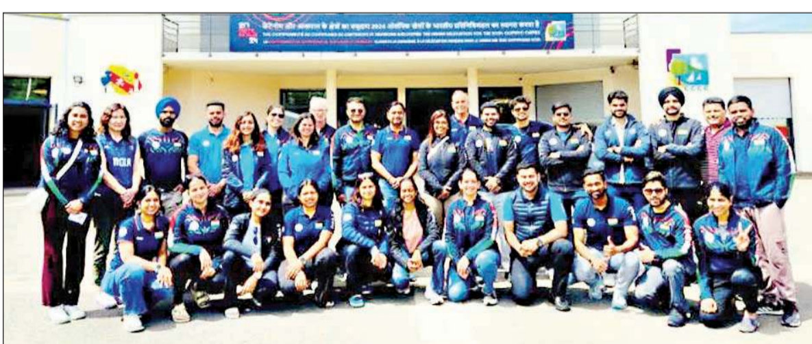
पेरिस ओलंपिक के लिए 15 सदस्यीय राइफल और पिस्टल टीम की घोषणा हो गई है। टीम के खिलाड़ी सामूहिक चित्र में।

प्रत्येक देश अधिकतम चार कोटा हासिल कर सकता है। फ्रांस के पास मेजबान देश के तौर पर एक कोटा स्थान आरक्षित था, ताकि अगर उनका कोई भी खिलाड़ी रैंकिंग के जरिए ओलंपिक में सीधे स्थान हासिल न कर पाए तो उसे यह स्थान मिल सके, लेकिन चूँकि फ्रांस ने अपनी रैंकिंग के जरिए सभी चार पुरुष एकल कोटा हासिल कर लिए थे।