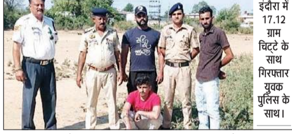
इंदौरा में 17.12 ग्राम चिट्टे के साथ गिरफ्तार युवक पुलिस के साथ।

जिला अमृतसर के कब्जे से 17.12 ग्राम चिट्टा बरामद करने में सफलता प्राप्त की है। जिस पर उपरोक्त आरोपी को गिरफ्तार करके उसके खिलाफ थाना डमटाल में अभियोग नशेयन धारा 21,