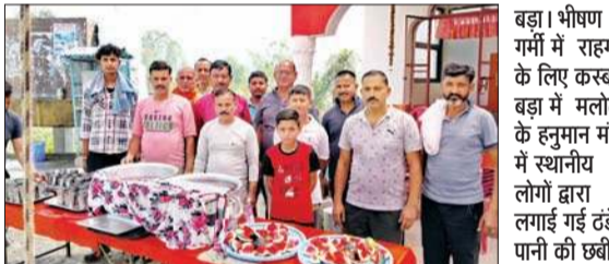
बड़ा। भीषण गर्मी में राहगीरों के लिए कस्बा बड़ा में मलोटी के हनुमान मंदिर में स्थानीय लोगों द्वारा लगाई गई ठंडे पानी की छबील।

पर अग्निशमन विभाग ने एडवाइजरी भी जारी की है। इसमें आग से सुरक्षा संबंधित गश्त के दौरान पाया गया कि भवनों के आसपास सूखी झाड़ियां, पत्तियां इत्यादी ज्वलनशील पदार्थों का भंडारण व इधर-उधर बिखरे होने के कारण गर्मियों के दिनों में बढ़ते तापमान के साथ-साथ आग के अधिक फैलने का खतरा बना हुआ है। कई स्थानों पर तो भवनों की छतों पर चीड़ की सूखी पत्तियां इत्यादी ज्वलनशील पदार्थ पाए गए। अग्निशमन विभाग ने जिलावासियों से अपील की है कि भवनों के आसपास ज्वलनशील पदार्थों का भंडारण न करें और इन्हें यहां से हटा दें।