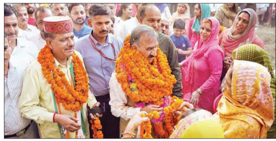
सुजानपुर में जनसभा के दौरान लोगों का अभिवादन स्वीकार करते सीएम सुखू।

मुख्यमंत्री सुखविंद सिंह सुखू ने कहा है कि राजेंद्र राणा ने अपना इमान बेचा इसलिए सुजानपुर विधानसभा क्षेत्र में उपचुनाव हो रहा है। बिकाऊ राजेंद्र राणा कमल खरीद उम्मीदवार हैं। उनसे जनता को पूछना चाहिए कि 14 महीने बाद क्यों दोबारा चुनाव की जरूरत पड़ गई। अब आकर जनता में रो रहे हैं और कह रहे कि सम्मान नहीं मिला, काम नहीं हुए, मैं बलता हूँ सुजानपुर में बड़े काम हुए और बिकाऊ विधायक को सम्मान नहीं, भाजपा के सामान से भरा ब्रीफकेस चाहिए था।