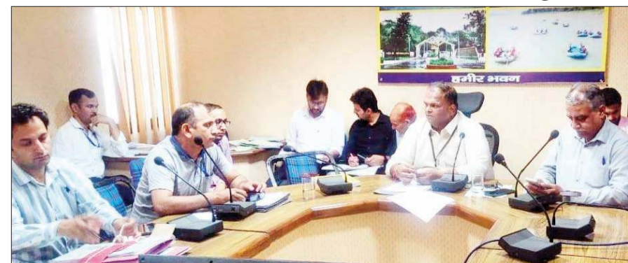
प्रत्याशियों के व्यय रजिस्ट्ररों के तृतीय निरीक्षण के दौरान डॉ. कुंदन यादव अधिकारियों से बातचीत करते हुए।

संसदीय क्षेत्र 3-हमीरपुर के अंतर्गत आने वाले 17 विधानसभा क्षेत्रों के लिए भारत निर्वाचन आयोग द्वारा व्यय पर्यवेक्षक के रूप में तैनात डॉ. कुंदन यादव ने सभी प्रत्याशियों को अपने चुनावी खर्च का अंतिम ब्यौरा 30 जून तक तैयार करने तथा व्यय रजिस्ट्ररों को अपडेट रखने के निर्देश दिए हैं।