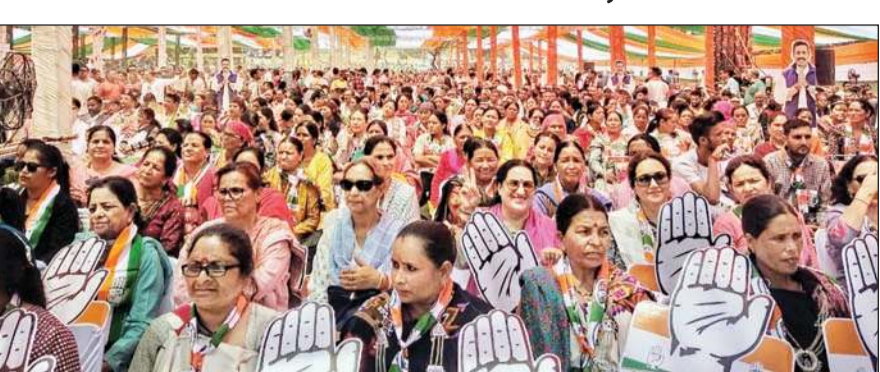
बालपुर मैदान में आयोजित कांग्रेस पार्टी की जनसभा में प्रियंका गांधी को सुनने के लिए आई जनता एवं पार्टी कार्यकर्ता।

कहा- भाजपा कार्यकाल में खरबपति मित्रों को दिया जा रहा फायदा, आपदा में भाजपा नेता लोगों का दुख-दर्द तक जानने नहीं आए