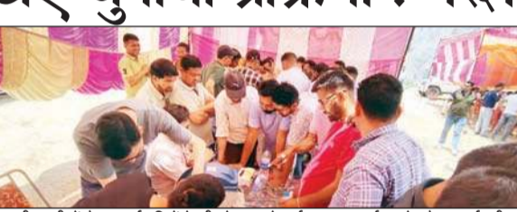
चुनावी ड्यूटी में तैनात कर्मचारियों के तीसरे चरण के पूर्व अभ्यास कार्यक्रम के दौरान कर्मचारी।

चुनाव लोकतंत्र का आधार है, इसलिए पारदर्शी चुनाव अति महत्वपूर्ण हैं। पारदर्शी चुनाव को चुनावी ड्यूटी में तैनात अधिकारियों और कर्मचारियों द्वारा सुनिश्चित किया जाना है।