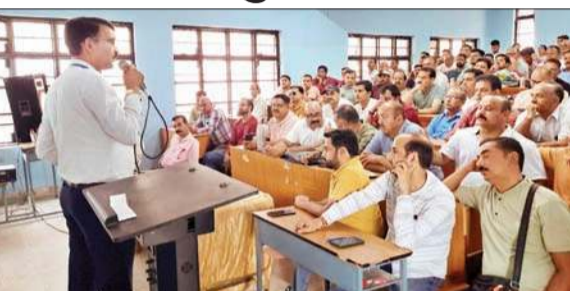
चुनावी रिहर्सल में मौजूद कर्मचारियों को संबोधित करते सहायक निर्वाचन अधिकारी।