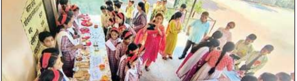
स्कूली छात्रों की तरफ से लगाई गई हिमाचली व्यंजनों की प्रदर्शनी।

इस कार्यक्रम के तहत प्रतिभागियों ने दोनों राज्यों के अलग-अलग व्यंजन बनाए। कुछ स्टूडेंट्स ने केरल के व्यंजन में इडली, डोसा, सांभर, केले के चिप्स और नारियल की चटनी बनाई और हिमाचल की