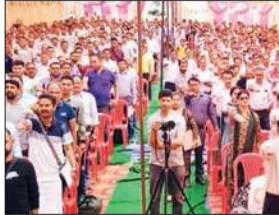
पोलिंग टीमों निष्पक्ष व पारदर्शी चुनाव करवाने के लिए शपथ लेती हुई।