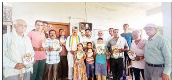
ग्राम पंचायत बठरा में भाजपा छोड़ कांग्रेस में शामिल हुए लोग।