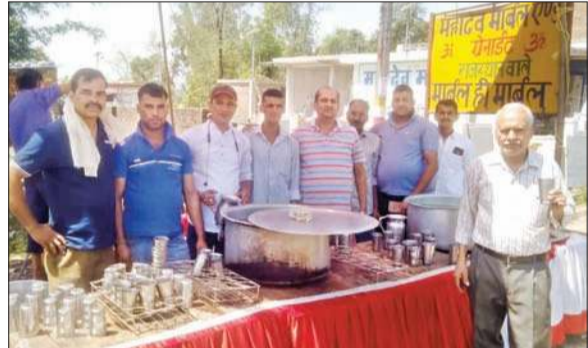
पीर बाबा टैक्सी स्टैंड के ड्राइवर राहगीरों को पानी पिलाते हुए।