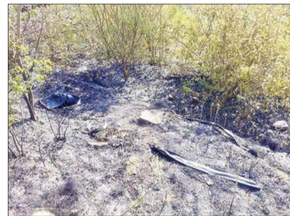
आग से जलकर राख हुए सेब व नींबू के पौधे।

उपमंडल भोरंज के तहत टकौता भट्टा में आगजनी से 100 नींबू के पौधे तथा 25 सेब के पौधों के साथ सिंचाई स्प्रेकलर पाइप भी जलकर राख हो गई है। इससे बागवान को लाखों का नुकसान हुआ है।