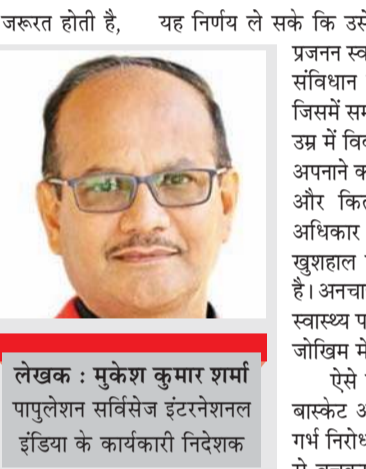
लेखक : मुकेश कुमार शर्मा

इसी सोच को परवान चढ़ाने के लिए हर साल महिला स्वास्थ्य के लिए अंतरराष्ट्रीय कार्रवाई दिवस के रूप में