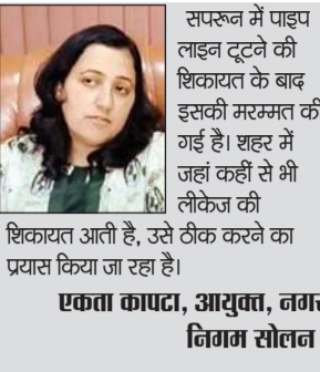
एकटा कापटा, आयुक्त, नगर निगम सोलन।

दरअसल सपरून में एक मोबाइल कंपनी की लापरवाही से पेयजल आपूर्ति की पाइप लाइन टूट जाने के बाद दिनभर पानी व्यर्थ बहता रहा। हेरानी की बात है कि नगर निगम ने सूचना के बावजूद समय रहते पाइप लाइन को मरम्मत नहीं की न ही पानी की सफाई को रोका, जिससे हजारों लीटर पानी व्यर्थ में बह गया। ऐसे में कार्यप्रणाली में सवाल उठना स्वाभाविक है। (अनंत ज्ञान)