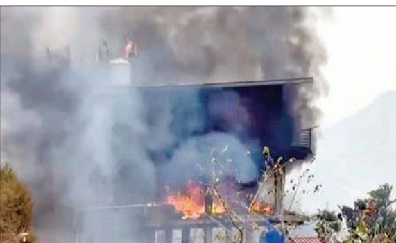
सोलन के धर्मपुर में मकान और दुकान में लगी आग।

जंगलों में भड़की आग अब रिहायशी क्षेत्रों तक पहुंचने लगी है। इससे लगातार जानमाल के नुकसान का खतरा बना हुआ है। जिला सोलन के धर्मपुर, कसौली, कुटाड़, सुबाथू सहित अब सोलन के जंगल भी धू-धू कर जल रहे हैं। बुधवार को धर्मपुर के जंगलों में लगी आग की लपटों ने एक घर और दुकान को अपनी चपेट में ले लिया, जिससे लाखों रुपए की संपत्ति का नुकसान हो गया। हाईवे होने के चलते आग और धुएं के गुब्बार से ट्रैफिक भी बाधित हो गया। मौके पर पहुंची फायर ब्रिगेड, पुलिस, होम गार्ड और स्थानीय लोगों ने जैसे-तैसे कई घंटों की मशक्कत के बाद आग पर काबू पाया। जानकारी के अनुसार सुबह करीब साढ़े 11 बजे जंगल में लगी आग ने सबसे पहले घर को अपनी चपेट में लिया, जिसके