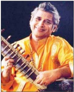
पंडित देवब्रत चौधरी जन्म : 30 मई, 1935 मृत्यु : 1 मई, 2021

पंडित देवब्रत चौधरी का जन्म आजादी से पूर्व म्येनसिंह (अब बांग्लादेश) में हुआ था। उन्होंने देबू चौधरी के नाम से अधिक जाना जाता है। उन्हें युद्धोत्तर युग का एक प्रमुख सितार वादक माना जाता है। वह मुस्ताक अली खान के शगिर्द थे। वह एक शिक्षक भी थे। वह छह पुस्तकों के लेखक, आठ नए रागों के संगीतकार और कई संगीत रचनाओं के रचयिता थे। उन्होंने कई रेडियो प्रसारणों में काम किया है। वह दिल्ली विश्वविद्यालय के संगीत संकाय के पूर्व डीन और प्रमुख थे। उन्होंने चार साल की उम्र से ही सितार बजाना शुरू कर दिया था। उनका पहला प्रसारण 1953 में अठारह साल की उम्र में ऑल इंडिया रेडियो पर हुआ था। भारत सरकार ने 1992 में कला के क्षेत्र में शानदार योगदान के लिए उन्हें 'पद्म भूषण' से सम्मानित किया था। उन्हें पद्मश्री पुरस्कार से भी सम्मानित किया गया था। उन्होंने सेनिया संगीत घराना के पंचू गोपाल दत्ता और संगीत आचार्य उस्ताद मुस्ताक अली खान से संगीत की शिक्षा ली थी। देबू चौधरी का नाम उस्ताद विलायत खान, पंडित रविशंकर और पंडित निखिल बनर्जी जैसे भारत के प्रख्यात सितार वादकों में गिना जाता है। वह जयपुर के सेनिया संगीत घराने से थे, जिसे तानसेन परिवार के वंशजों ने शुरू किया था और जिन्हें रागों की शुद्धता को संरक्षित रखने के लिए जाना जाता है।