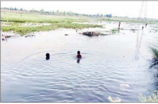
भयंकर गर्मी से बचने के लिए गगरेट क्षेत्र की खड्ड में नहाते गरीब परिवारों के बच्चे, (मध्य) भयंकर गर्मी से बचने के लिए एक खड्ड में पानी के बीच बैठा जानवर (दाएं) पानी की तलाश में खड्ड के किनारे बच्चे के साथ घोड़े।