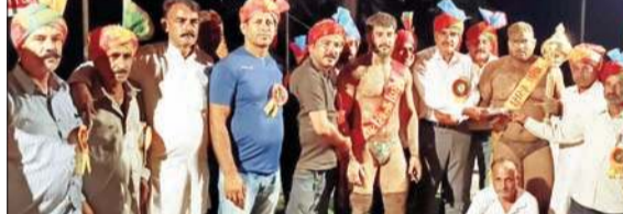
दंगल के विजेताओं के साथ आयोजक व अन्य गणमान्य सामूहिक चित्र में।