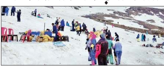
विश्व प्रसिद्ध पर्यटन स्थल रोहतांग में बर्फ के बीच पर्यटक मस्ती करते हुए।

पर्यटन नगरी मनाली में आज से पर्यटन कारोबार रफ्तार पकड़ेगा। गत सप्ताह वीरवार, शुक्रवार व शनिवार को आठ हजार पर्यटक वाहन मनाली पहुंचे थे। गत सप्ताहांत मनाली जाम हो गई थी। पर्यटकों को कमरे के लिए भटकना पड़ रहा था।