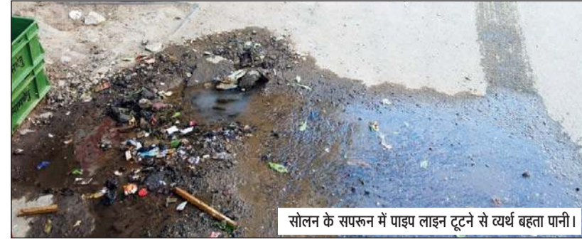
सोलन के सपरून में पाइप लाइन टूटने से व्यर्थ बहता पानी।