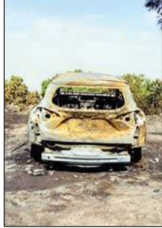
नयनादेवी में आग से जलीं कारें ।

उन्होंने कहा कि मरीजों को परेशानी न हो, इसलिए निगम की टैक्सियां भी चल रही है। सड़क का काम पूरा होने के बाद ही बस सेवा शुरू हो सकेगी। अस्पताल प्रशासन ने भी अतिरिक्त टैक्सियां चलाने की मांग सरकार को भेजी