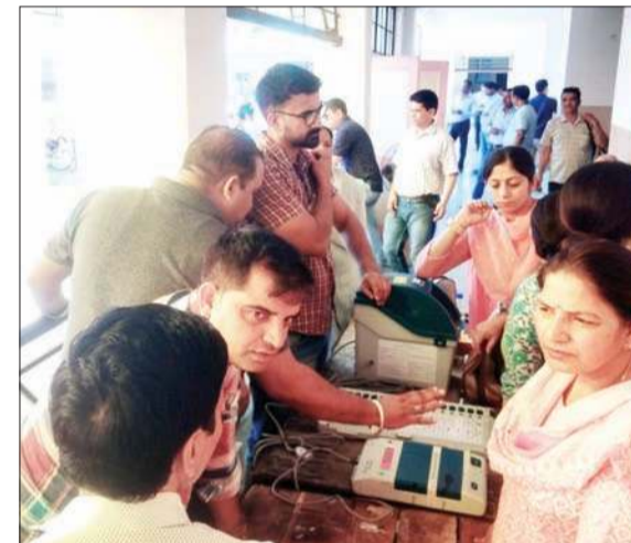
अटल बिहारी वाजपेयी राजकीय महाविद्यालय नौरा में सुलह विधानसभा क्षेत्र-14 के अंतर्गत तीसरी व अंतिम चुनावी रिहर्सल के दौरान चुनाव अधिकारी व कर्मचारी।

उन्होंने बताया कि पहली जून को होने वाले मतदान के लिए आयोजित इस तीसरी और अंतिम चुनावी रिहर्सल में 618 से अधिक चुनाव अधिकारियों एवं कर्मचारियों ने भाग लिया। उन्होंने कहा कि 30 मई को पोलिंग पार्टियां अपने-अपने मतदान केंद्रों