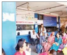
नगरोटा बगवां और बैजनाथ बस स्टैंड में पंखे न चलने से गर्मी से बेहाल यात्री।

हो रहे हैं। बस स्टैंड पर यात्रियों को गर्मी से राहत देने के लिए हवा के पर्याप्त इंतजाम नहीं हैं। भीषण गर्मी में बस के इंतजार में यहां बैठे यात्रियों को जरा भी सुकून नहीं मिलता है। बस स्टैंड परिसर में यात्रियों को उमस व गर्मी से