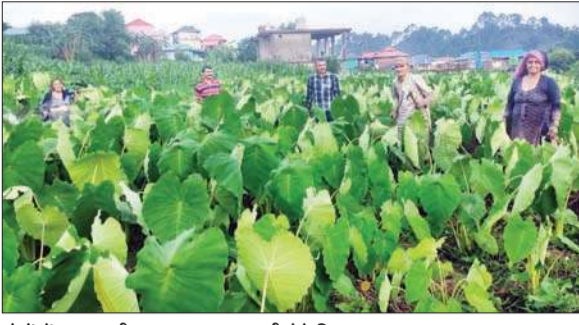
खेतों में कचालू की फसल तथा जानकारी देते किसान।

धर्मपुर विधानसभा क्षेत्र की ग्राम पंचायत व गांव बिंगा में पिछले सौ साल से उगाए जा रहे कचालू (गंढयाली) की किस्म एक विशेष प्रकार की है जो दूसरे किसी स्थान पर नहीं है, जिसके चलते इस गांव के साठ से अधिक परिवार हर साल आठ से दस टन कचालू की पैदावार करते हैं और दस लाख से भी अधिक की गंढयाली बिक्री करते हैं। अपने उपभोग के लिए भी इसे इस्तेमाल करते हैं।