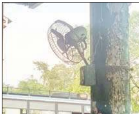
नगरोटा बगवां और बैजनाथ बस स्टैंड में पंखे न चलने से गर्मी से बेहाल यात्री।

यहां छह-सात पंखे लगे हुए हैं, लेकिन उनमें से एक-दो ही चल रहे हैं, बाकी सब बंद पड़े हैं। ऐसे में यात्रियों को परेशानी झेलनी पड़ रही है। यात्री पसीने से तरबतर