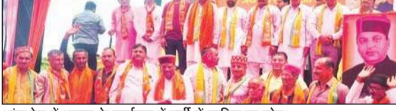
आंजभोज में भाजपा के कार्यक्रम में पार्टी में शामिल हुए लोग।

इस कार्यक्रम में पूर्व मुख्यमंत्री जयराम ने बतौरतिथि पहुंचना था, लेकिन उनके चॉपर में आई तकनीकी खराबी के कारण उनका दौरा रद्द हो गया, जिसके बाद उन्होंने जय श्री राम के उद्घोष के साथ फोन से ही संबोधन शुरू किया। पंडाल जय श्री राम और जयराम के नारों से गुंज उठा। इस दौरान भैला के लोगों को मोबाइल के माध्यम से संबोधित किया। जय राम ने लोगों से माफ़ी मांगी की तकनीकी