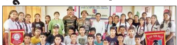
एनसीसी ऑफिसर, स्कूल प्रधानाचार्य, स्कूली छात्र व छात्राएं सामूहिक चित्र में।