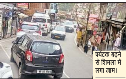
पर्यटक बढ़ने से शिमला में लगा जाम।

शहर में पर्यटकों की संख्या बढ़ने के साथ-साथ वाहनों की संख्या भी बढ़ चुकी है। ऐसे में शहर में जाम की समस्या भी विकराल हो चुकी है। लोगों को मिनटों का सफर घंटों में तय करना पड़ रहा है। इस बार प्रशासन भी जाम से निजात दिलाने के लिए कुछ सख्त कदम उठते नजर नहीं आ रहा है।