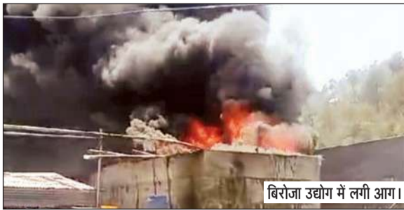
बिरोजा उद्योग में लगी आग।

रविवार दोपहर करीब 12 के आसपास फैक्टरी में अचानक आग लग गई और देखते ही देखते आग ने फैक्टरी के एक हिस्से में बने बेस्ट टैंक को पूरी तरह से अपनी चपेट में ले लिया और स्थानीय लोगों की ओर से खुद ही आग को बुझाने की कोशिश की और साथ में दमकल विभाग नालागढ़ को भी आग की घटना को लेकर सूचित किया गया। नालागढ़ से घटनास्थल की दूरी 25 किलोमीटर से अधिक है, ऐसे में