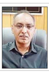
31 मई और एक जून को विज्ञापनों के प्रकाशन के लिए 2 दिन पहले करवाना होगा प्रमाणन

विज्ञापन प्रसारित करने के लिए जिला स्तरीय मीडिया प्रमाणन एवं निगरानी समिति (एमसीएमसी) की पूर्व अनुमति एवं प्रमाणन अनिवार्य है। हालांकि, प्रिंट मीडिया में राजनीतिक विज्ञापनों के प्रकाशन के लिए पूर्व अनुमति एवं प्रमाणन की आवश्यकता नहीं है, लेकिन मतदान से एक दिन पहले या मतदान के दिन प्रिंट मीडिया में विज्ञापन प्रकाशित करने के लिए भी एमसीएमसी से अनुमति लेनी होगी तथा उस विज्ञापन को प्रमाणित करवाना होगा। इन विज्ञापनों के प्रमाणन के लिए प्रकाशन से कम से कम दो दिन पहले आवेदन करना होगा। इसलिए, यदि कोई उम्मीदवार मतदान के दिन एक जून को या एक दिन पहले 31 मई को प्रिंट मीडिया में विज्ञापन प्रकाशित करने का इच्छुक हो तो वह इसे दो दिन पहले प्रमाणित करवा ले। निर्धारित अवधि के बाद जिला स्तरीय एमसीएमसी कोई भी विज्ञापन प्रमाणित नहीं करेगी।