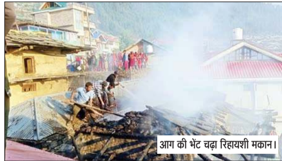
आग की भेंट चढ़ा रिहायशी मकान।

पहली घटना कुल्लू के साथ लगते ढालपुर स्थित कलाकेंद्र के समीप रस्टिक बूड रेस्तरां में पेश आई। आग लगने से वहां पर अफरा-तफरी का मोहल बना। रेस्तरां में आग इस तरह भड़क गई थी कि रेस्तरां के अंदर एक युवती की दम घुटने से मौत हो गई। जानकारी के मुताबिक रस्टिक बूड रेस्तरां के किचन के साथ स्टोर में जहां पर सोफा रिपेयर का कार्य चला हुआ था। इस दौरान सोफा रिपेयरिंग के लिए लगाए जाने वाले केमिकल ने आग पकड़ लगी तथा यह आग पूरे रेस्तरां में फैल गई। इस दौरान रेस्तरां स्टाफ की तीन लड़कियां व एक लड़का धुएँ की