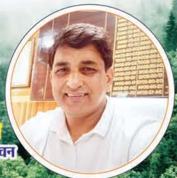
एसएस.कश्यप वन मंडल अधिकारी नाचन जिला मंडी हि.प्र.

के सफल आयोजन पर सभी क्षेत्रवासियों को हार्दिक बधाई