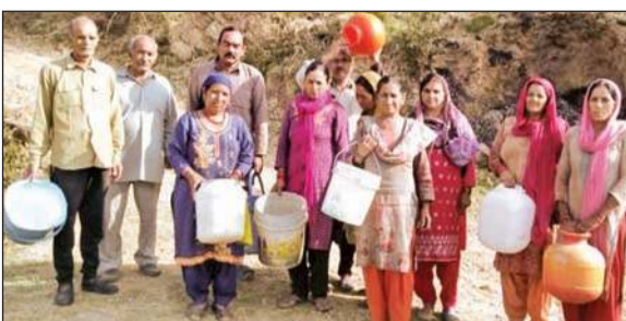
खाली बर्तन लेकर पानी की तलाश में जाते सेरली बताही के लोग।

गांव से जल स्रोत भी लगभग आधा किलोमीटर से भी दूर है। लोगों को कड़की घूप में सर पर पानी लाना पड़ रहा है। स्थानीय लोगों का पुरा दिन पानी लाने में व्यर्थ जा रहा है। जिससे अपने-अपने घोषणापत्र को पैसे देकर गाड़ियों में कलखर और रिवाल्सर से पानी लाना पड़ रहा है। लोगों ने जल शक्ति विभाग से मांग की है कि हमें पानी के टैंकर से पानी उपलब्ध करवाया जाए।