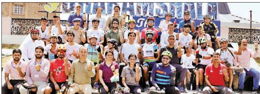
मतदाता जागरूकता के लिए रविवार को आयोजित साइक्लोथॉन के दौरान प्रतिभागी सामूहिक चित्र में।

यहां बताते चले कि प्रदेशभर में इस साल आग तक दवानल के सबसे ज्यादा मामले कांगड़ा जिला में सामने आए हैं। वहीं धर्मशाला वन मंडल में ये मामले सबसे