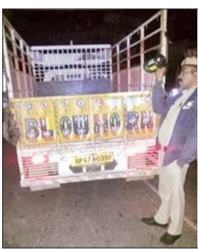
जगह-जगह नाके लगाकर गाड़ियों की चेकिंग कर रही है। इस चेकिंग के दौरान 45 बोतलें अंग्रेजी शराब, 24 कैन बीयर, 18 बोतलें बीयर की बरामद की हैं।