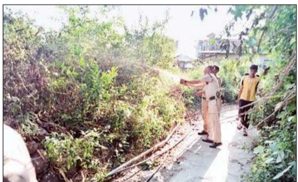
बांस के झुंड में लगी आग को बुझाते अग्निशमन विभाग के कर्मचारी।