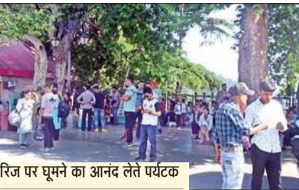
रिज पर घूमने का आनंद लेते पर्यटक

घुमंतू गुज्जर अपने परिवार व मवेशियों के साथ मैदानी क्षेत्रों में चले जाते हैं और गर्मियों के दौरान ऊंचाई वाले क्षेत्रों में पहुंच जाते हैं। सबसे अहम बात यह है कि इस समुदाय के लोगों को बेघर होने का कोई ख़ास मालाल नहीं है। आधुनिकता की चकाचौंध से कोसों दूर घुमंतू गुज्जर वर्ष भर भैंस के