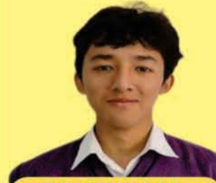
PRATHAM WARPA 98.0%tile