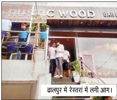
ढालपुर में रेस्तरां में लगी आग।

भवन में रस्टिक बूड रेस्तरां चला रहे हैं। दमकल विभाग कुल्लू को जैसे ही आग लगने की सूचना मिली, तो विभाग की गाड़ी मौके के लिए रवाना हो गई तथा मौके पर पहुंचकर आग पर काबू पा लिया। इस आगजनी की घटना में एक युवती की मौत हो गई है तथा रेस्तरां का 50 हजार रुपए का नुकसान हुआ है, जबकि 50 लाख की संपत्ति को आग की भेंट चढ़ने से बचाया गया। मामले की पुष्टि करते हुए पुलिस अधीक्षक कुल्लू डॉ.