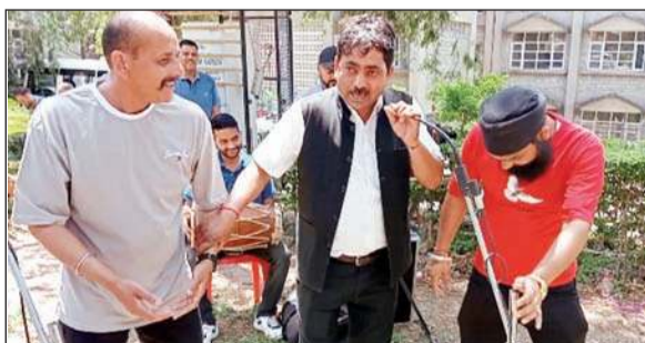
धर्मशाला में गीत-संगीत के माध्यम से लोगों को जागरूक करते कलाकार।

सूचना एवं जनसंपर्क विभाग के कलाकारों ने रविवार को उपायुक्त के तहत लोकसभा चुनाव तथा विधानसभा उपचुनाव में अधिक से अधिक संख्या में मतदान करने के लिए आम लोगों को प्रेरित किया और मतदान के महत्व के बारे में बताया। नाटक के माध्यम से वोट को बिना किसी प्रलोभन अपने देश के हित में मतदान कर सशक्त लोकतंत्र के निर्माण में अपनी भागीदारी सुनिश्चित करने की अपील की। इस दौरान मतदाता जागरूकता से संबंधित पोस्टर बैनर प्रदर्शित किए गए। सहायक नोडल