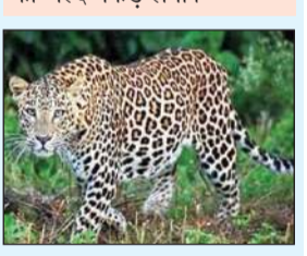
क्या कहते हैं खंड वन्य अधिकारी

बिझड़। बड़सर उपमंडल की ग्राम पंचायत महारल तथा आसपास के क्षेत्र में तेंदुए का भय लोगों को सता रहा है। पिछले लगभग 20-25 दिनों से महारल जंगली, बागी, नोभण, सठवीं गांव के नजदीक तेंदुआ घूम रहा है, यहां तक कि वह तेंदुआ गांव के चार कुत्तों को भी अपना निवाला बना चुका है। तेंदुए के डर के कारण स्थानीय लोग अब खेतों में जाने से भी डर रहे हैं। हालांकि वन विभाग द्वारा महारल के पास पिंजरा लगा रखा है, लेकिन तेंदुआ अभी तक पकड़ में नहीं आया है। उन्होंने कहा कि विभाग ने एक-दो दिन उक्त स्थान पर ब्लास्टिंग भी करवाई थी, परंतु तेंदुआ कहां है पता नहीं चला। विभाग ने एक टीम क्षेत्र में भेज रखी है जो तेंदुए को जल्द पकड़ लेगी।