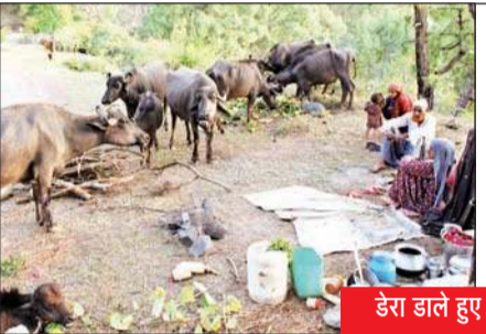
डेरा डाले हुए घुमंतू गुज्जर

अनंत ज्ञान, जुग्ना ( शिमला ) मैदानी इलाकों में पारा बढ़ने के साथ ही घुमंतू गुज्जरो ने पहाड़ी क्षेत्रों का रुख कर दिया है। इस समुदाय का कोई स्थाई ठिकाना नहीं है फिर भी यह समुदाय अपने व्यवसाय से प्रसन्न हैं।