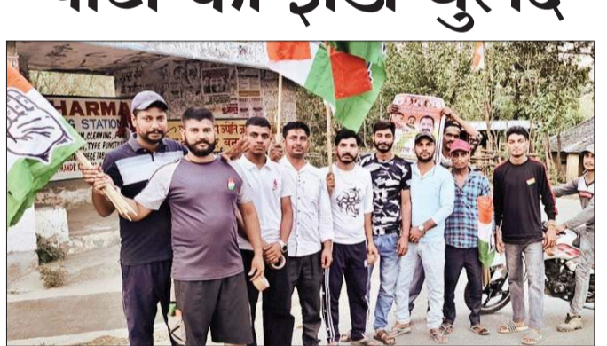
युवा वर्ग कांग्रेस का झंडा उड़ाए भाजपा के खिलाफ प्रचार करते हुए।