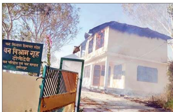
टौणीदेवी स्थित फॉरेस्ट रेस्ट हाउस में लगी आग।

अनंत ज्ञान, टौणीदेवी कहते हैं जरा-सी लापरवाही से कितना भारी नुकसान हो सकता है, इस बात का खुलासा आज कुछ समय में ही हो गया। चील के पेड़ों से धिरे फॉरेस्ट रेस्ट हाउस के आसपास आग से बचने के कोई उपाय नहीं किए गए थे और न ही भवन में आग बुझाने के लिए पानी या यंत्र था जिसकी वजह से रेस्ट हाउस में आग से भारी नुकसान हो गया। रेस्ट हाउस में महंगी लकड़ी और उसमें रखा सारा सामान जलकर राख हो गया है।