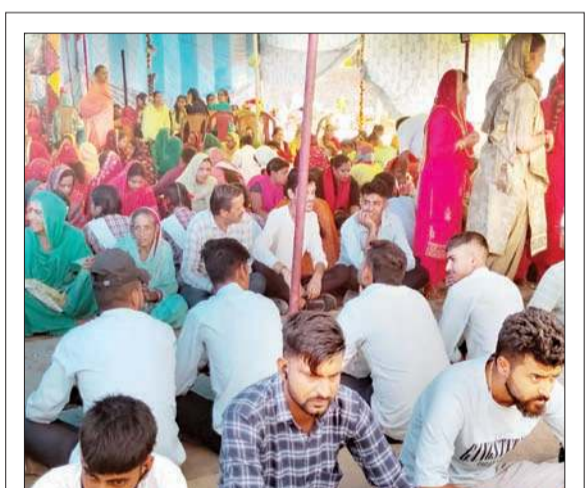
कस्बा बढ़ा के फस्टे में भंडारे में प्रसाद ग्रहण करते लोग।