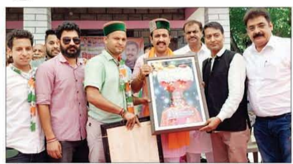
जोगिंद्रनगर में विक्रमादित्य को देव पशाकोट का चित्र भेंट करते कार्यकर्ता।