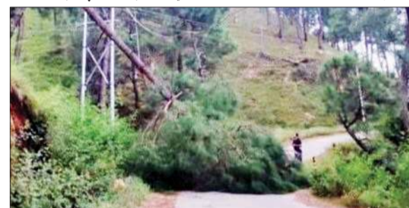
आनी के बराड़ में सड़क पर गिरा पेड़।

इस बारे वन मंडल अधिकारी चमन राय ने बताया कि बराड़ में खतरा बने पेड़ों को कटवाने को लेकर, प्रशासन द्वारा जो भी निर्देश जारी होंगे, उसके बाद ही आगामी कार्यवाही अमल में लाई जाएगी।