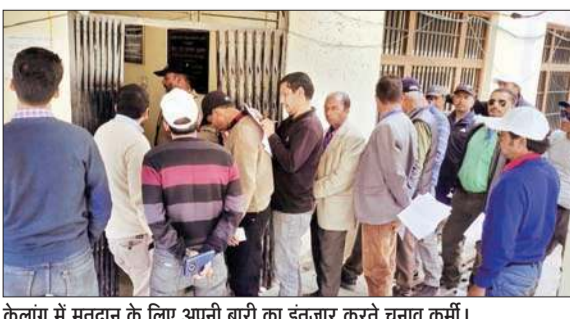
केलांग में मतदान के लिए अपनी बारी का इंतजार करते चुनाव कर्मी।

इस दौरान चुनाव कर्मियों को ईवीएम पीपीटी के माध्यम से मास्टर ट्रेनर द्वारा मतदान प्रक्रिया की बारीकियां समझाई गई और मतदान करवाने के लिए चुनाव आयोग के दिशा-निर्देशों व गाइडलाइंस बारे