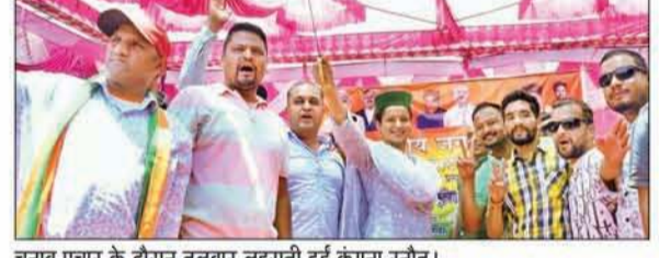
मुंबई लौटने के दौरान तलवार लहराती हुई कंगना रनौत।