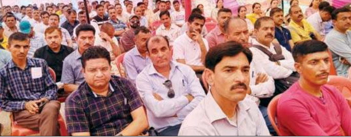
सराहां में चुनाव ड्यूटी के लिए पूर्वाभ्यास में हिस्सा लेते पोलिंग अधिकारी।