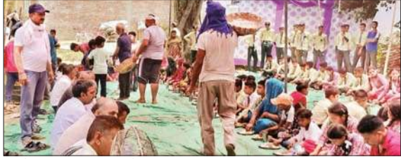
भंडारे का प्रसाद ग्रहण करते श्रद्धालु।