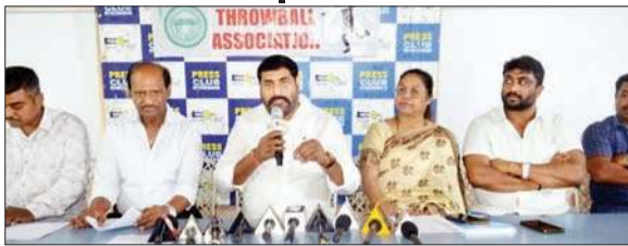
सीनियर नेशनल थ्रो बाल प्रतियोगिता की जानकारी देते गणमान्य।