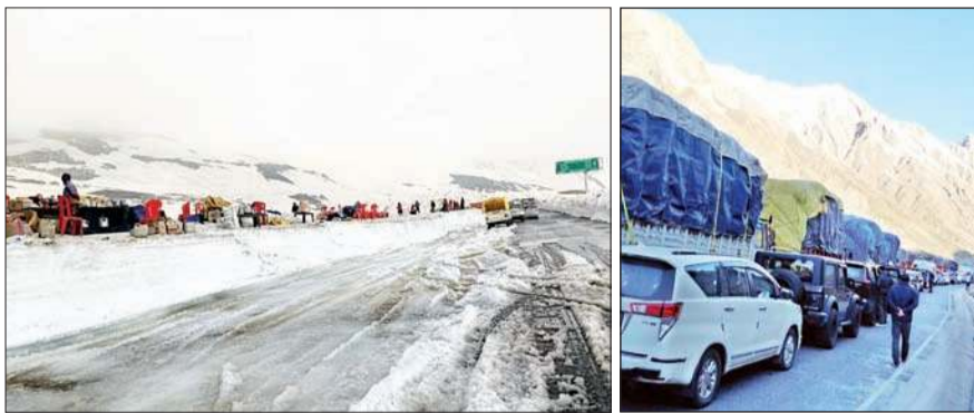
विश्व प्रसिद्ध पर्यटन स्थल रोहतांग में बर्फ के बीच पहुंचे पर्यटक तथा मनाली-तेह सड़क मार्ग पर दारचा के पास खड़े वाहन।

पर्यटकों की बढ़ती आमद के चलते रोहतांग के लिए 1200 पर्यटक कम पड़ने लगे हैं। सप्ताहांत के चलते बाहरी राज्यों से आने वाली लाजरी बसों में भारी बढ़ती हुई है। शनिवार को डेढ़ सौ से अधिक लजरी बसें मनाली