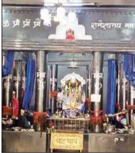
जीवन में अच्छाई एवं नेकी के मार्ग का अनुसरण करें। इस मौके पर जिला के दूर-दराज क्षेत्रों से दिनभर भक्तों का आने-जाने का सिलसिला देर शाम भगवान शनिदेव की आरती तक चलता रहा।

हरदासपुरा वाई में स्थित शनिदेव मंदिर में शनिवार को सैकड़ों भक्तों ने शीश नवाज शनिदेव दर्शन किए। जबकि मंदिर पुजारी ने शनि भक्तों को शनि महिमा पाठ प्रवचनों से रू-ब-रू करवाया। शनि महिमा पाठ प्रवचनों से अवगत करवाते हुए पुजारी ने बताया कि सत्य, अहिंसा व नेकी की राह पर चलने वाले भक्तों पर सदैव शनिदेव की रहम दृष्टि बनी रहती है। जबकि लोभी व हिंसा के शिकार मनुष्य शनि प्रकोप दृष्टि का शिकार होते हैं। इसलिए हे भक्तों शनिदेव महिमा पाठ में बताए गए घटनाओं से सबक लेते हुए अपने