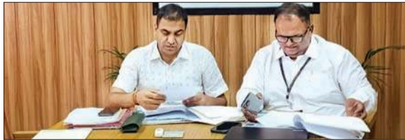
निर्वाचन आयोग को जानकारी उपलब्ध करवाते पर्यवेक्षक।