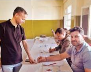
मतदान करते हुए कर्मि।