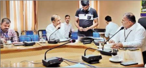
व्यय रजिस्टरों को चेक करते हुए अधिकारी।

उम्मीदवारों के व्यय रजिस्टरों का निरीक्षण किया। व्यय रजिस्टरों का यह दूसरा निरीक्षण था। इससे पहले 21 मई को प्रथम निरीक्षण किया गया था। डॉ. कुंदन यादव ने बताया कि उम्मीदवारों के व्यय रजिस्टरों का तीसरा निरीक्षण 29 मई को होगा। उन्होंने सभी उम्मीदवारों और उनके प्रतिनिधियों से कहा कि वे प्रतिदिन चुनाव के सभी खर्चों को व्यय रजिस्टर में अवश्य दर्ज करें। किसी भी खर्च की एंट्री छूटनी नहीं चाहिए। अगर किसी दैनिक खर्च की पेमेंट बाद में की जानी है तो भी उसे रजिस्टर में दर्ज कर लें। इससे एक-एक खर्च का ब्यौरा