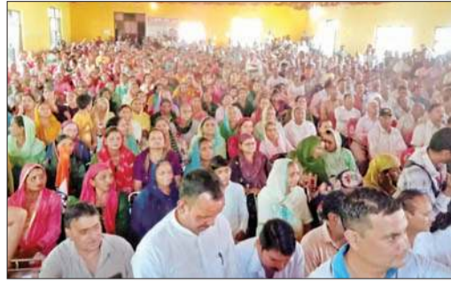
जवाली में जनसभा में उपस्थित लोग तथा मंच पर बैठे मुख्यमंत्री सुखविंद सिंह सुक्खू, साथ ही कांगड़ा-चंबा के प्रत्याशी आनंद शर्मा।

हालांकि वन विभाग के कर्मचारी जंगलों को आग से बचाने के लिए पूरी मुस्तेदी से काम कर रहे हैं लेकिन वो भी हर जगह नहीं पहुंच पाते। क्षेत्र के मकौल, मल्ली, घरचिंडी आदि इलाकों के जंगलों के साथ साथ घासनियां भी