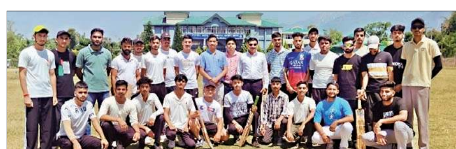
राजकीय उत्कृष्ट महाविद्यालय नगरोंटा बगवां में क्रिकेट प्रतियोगिता के दौरान खिलाड़ी सामूहिक चित्र में।