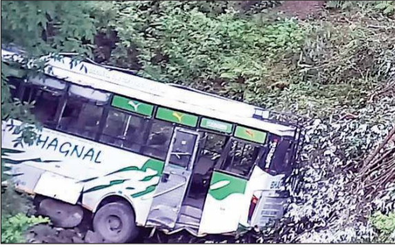
नाले में गिरी दुर्घटनाग्रस्त निजी बस।