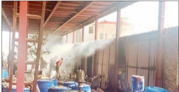
फैक्टरी में लगी हुई आग, जिससे काफी ज्यादा नुकसान हुआ।