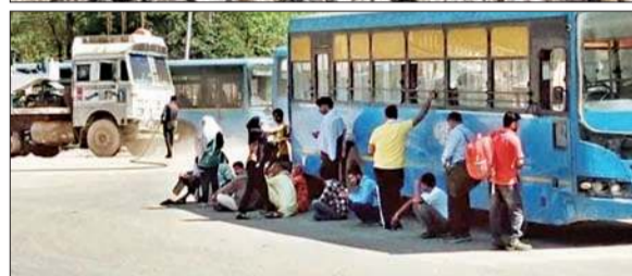
त्रिलोकपुर में पहाड़ी दरकने से लगा जाम।

निर्माणाधीन कंपनी अगर सही मापदंडों के तहत कार्य करती तो ऐसा हादसा न होता। उन्होंने कहा