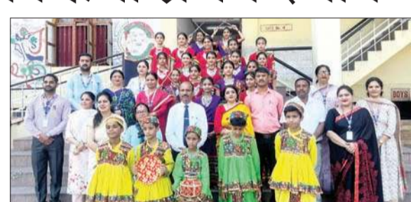
जीएवी पब्लिक स्कूल कांगड़ा के होनहार अध्यापकों के साथ।

डांस कंपटीशन के लिए चारों हाउस मास्टर को एक माह पूर्व ही पर्ची डालकर बता दिया गया था। जुपिटर हाउस को गुजराती डांस मिला और उसने प्रथम स्थान