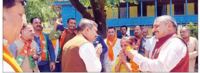
कसुमट्टी में चुनावी जनसंपर्क अभियान के दौरान सुरेश कश्यप समर्थकों के साथ।

अनंत ज्ञान ब्यूरो, शिमला भारतीय जनता पार्टी के लोकसभा सांसद और प्रत्याशी सुरेश कश्यप ने कसुमट्टी विधानसभा क्षेत्र में चुनावी जनसंपर्क अभियान के दौरान कहा कि पांच चरणों के चुनावों में भाजपा बहुमत के आंकड़ों को पार कर चुकी है और आज छठे चरण का चुनाव हो गया है। हिमाचल प्रदेश इस बार 4-0 से हट्टिक बनाने जा रहा है। उनका मानना है कि 4 तारीख को भाजपा 400 से अधिक सीटें हासिल करेगी। कश्यप ने हिमाचल की जनता से अपील की कि वे केंद्र में भाजपा की सरकार बनाने के लिए प्रधानमंत्री मोदी का समर्थन करें ताकि भाजपा के प्रत्याशी भारी बहुमत से जीत हासिल करें। कश्यप ने भाजपा के पालमपुर में हुए कार्यसमिति की बैठक का भी उल्लेख किया, जिसमें अयोध्या में राम मंदिर निर्माण का संकल्प लिया गया था। उन्होंने इसे हिमाचल प्रदेश के लिए एक ऐतिहासिक क्षण बताया और कहा कि इस संकल्प के पूरा होने से 500 साल का इंतजार और संघर्ष समाप्त हुआ। उन्होंने इस समर्थन करती है और देश को विकसित नहीं होने देना चाहती। कश्यप ने कांग्रेस पर महिला विरोधी होने का आरोप लगाया और कहा कि आज दुनिया 21वीं सदी में जा रही है, जबकि कांग्रेस 21वीं सदी में नहीं आ पाई है। देश आज आगे बढ़ रहा है और कांग्रेस विपरीत दिशा में चल रही है। उन्होंने कहा कि कांग्रेस हिमाचल प्रदेश को बर्बादी के रास्ते पर ले जा रही है, उन्होंने जनता से अपील की कि वे कांग्रेस को रोककर देश और प्रदेश को विकसित भारत के संकल्प को पूरा करने में प्रधानमंत्री का सहयोग करें।