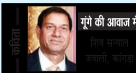
गुरी की आवाज में

आरुणआई संदं संख्या-HPHIN01099 ई-मेल : anantgyaanmedia@gmail.com फोन नंबर : 01892-299098