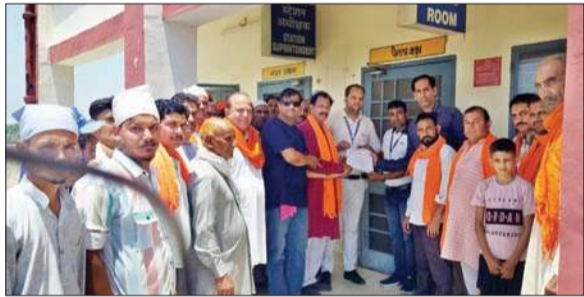
कुनेरन रेलवे स्टेशन पर रेलगाड़ियों को रोकने को लेकर मांग पत्र सौंपा गया।

कुनेरन रेलवे स्टेशन पर रेलगाड़ियां रोकने को लेकर लोगों ने सौंपा मांग पत्र सौंपा है। गौर हो कि कहने को तो ऊना जिले के लिए ट्रेनों की संख्या बढ़ाना किसी उपलब्धि से कम नहीं है। इससे लोगों को सुविधा बढ़ी है। वहीं, अगर रेलवे स्टेशनों की बात करें तो यात्रियों को सुविधाओं से लैस रेलवे स्टेशन उपलब्ध कराने का प्रयास भी रेल मंत्रालय द्वारा किया गया है, लेकिन लाखों-करोड़ों रुपए खर्च के बाद यात्रियों की सुविधा के लिए रेलगाड़ियां रोकने को परेशानी का सामना करना पड़ रहा है।