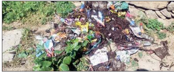
कोठी गांव में लगे कूड़े के ढेर।