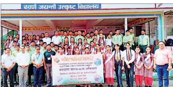
मांगल स्कूल में मतदान को लेकर जागरूकता संदेश देते छात्र, साथ खड़े हैं अध्यापक।