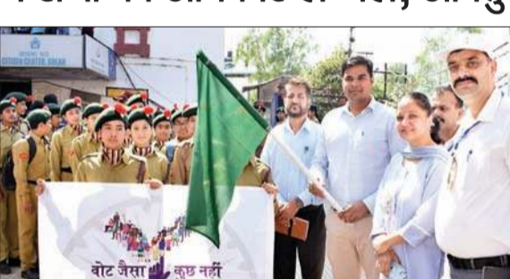
मतदाता जागरूकता रैली को हरी झंडी दिखाकर रवाना करते अतिरिक्त उपायुक्त।