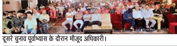
दूसरे चुनाव पूर्वाभ्यास के दौरान मौजूद अधिकारी।

दूसरे चुनाव पूर्वाभ्यास का आयोजन मिलेनियम बहुतकनीकी संस्थान चंबा सभागार में किया गया। पूर्वाभ्यास के दौरान सहायक निर्वाचन अधिकारी एवं एसडीएम चंबा अरुण शर्मा विशेष रूप से उपस्थित रहे। इस अवसर पर सहायक निर्वाचन अधिकारी एवं एसडीएम चंबा अरुण शर्मा ने उपस्थित अधिकारियों को आगामी लोक सभा चुनाव के सफल एवं सुगम संचालन हेतु आवश्यक निर्देश