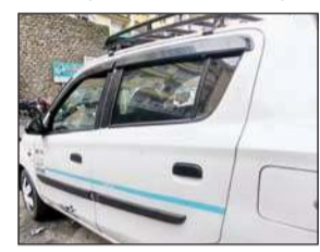
सफाई में अधिकारी समय समय पर वाहनों की जांच का हवाला दे अपनी जिम्मेदारी से कनी काट रहे हैं। जबकि जमीनी हकीकत में पुलिस व आरटीओ विभाग के चालान बुकों अग्निशमन यंत्र अभाव का खाना भरने की बजाय खाली अधिक है। (अनंत ज्ञान)

गौर हो कि वाहनों में आग लगने की कई घटनों के चलते सर्वोच्च न्यायालय द्वारा यातायात अधिनियम में संशोधन करते हुए टेक्सी से लेकर निजी वाहनों में आग निरोधक यंत्र स्थापित करने के निर्देश दिए थे। अदेशों के प्रारंभिक में तेज अभियान विभिन्न राज्यों के संबंधी विभागों ने चलाने के बाद इस दिशा में मंदगति की रफ्तार पड़ने सहित कई राज्यों ने वाहनों में अग्निशमन यंत्र लगाना छोड़ दिया। जिसमें हिमाचल राज्य का जिला चंबा के संबंधी विभाग एक है।