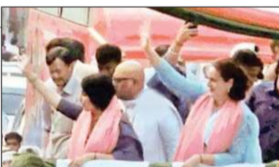
रोड शो दौरान प्रियंका गांधी व डिंपल यादव।