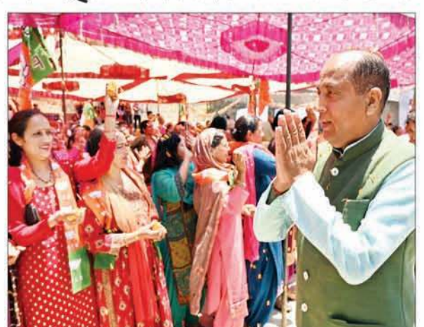
लोगों का अभिवादन स्वीकार करते हुए जयराम ठाकुर।

अनंत ज्ञान ब्यूरो, मंडी नेता प्रतिपक्ष जयराम ठाकुर ने कहा कि मंडी के विभिन्न क्षेत्रों को जनसभाओं को संबोधित करते हुए प्रधानमंत्री नरेंद्र मोदी को हिमाचल में मिले अपार जनसमर्थन से कांग्रेस सक्तने में हैं। कांग्रेस ने प्रधानमंत्री के लिए निर्धारित पड्डल मैदान को बुक करवा लिया और कहा कि बहुत बड़ी रैली करने वाली है, क्योंकि उन्हें लगा की प्रधानमंत्री अंतिम दौर में आएंगे। इसके लिए 27 से 29 मई के लिए पड्डल मैदान बुक करवा लिया, जिससे नरेंद्र मोदी की रैली ही न हो पाए, लेकिन उनसे 23-24 मई को बुकिंग रह गई। जिस दिन मोदी की ऐतिहासिक रैली हुई, उसे देखकर अब कांग्रेसी को पड्डल में रैली करने की हिम्मत ही नहीं हो रही है। कांग्रेस