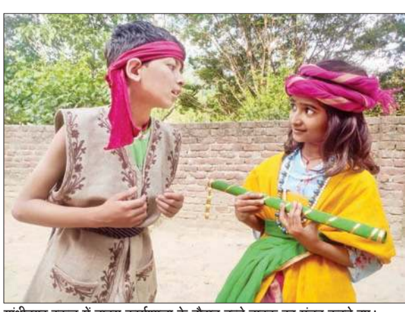
गांधीनगर स्कूल में नाट्य कार्यशाला के दौरान बच्चे नाटक का मंचन करते हुए।

नाटक 'नादान भक्त' विजयवादन देथा द्वारा लिखित कहानी 'विश्वास की बात' पर आधारित है और दिखाता है कि भगवान केवल उनके ही नहीं होते