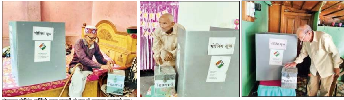
मोबाइल पोलिंग पार्टियों द्वारा बुजुर्गों से घर में मतदान कराते हुए।