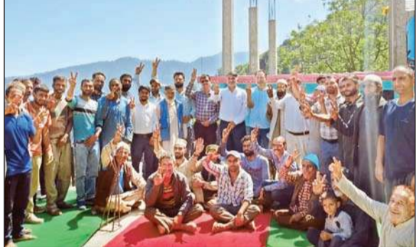
लोगों से वोट मांगने के दौरान मौजूद कार्यकर्ता व अन्य।