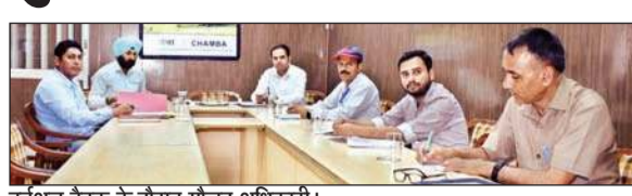
वर्चुअल बैठक के दौरान मौजूद अधिकारी।