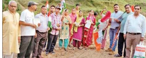
कांग्रेस प्रत्याशी आनंद शर्मा के पक्ष में प्रचार करते कांग्रेस कार्यकर्ता।

प्रदेश में लोकसभा चुनावों को कुछ दिन ही शेष है। अपने-अपने उम्मीदवार की जीत सुनिश्चित करने के लिए कांग्रेस और भाजपा के कार्यकर्ताओं ने अपना चुनाव प्रचार तेज कर दिया है। दोनों पार्टियों के प्रत्याशी विधानसभाओं में अपने चुनावी दौरे में जनसभाएं कर चुके हैं तथा चुनाव प्रचार की जिम्मेदारी कार्यकर्ताओं पर छोड़ दी है। विधानसभा जयसिंहपुर में भी कांग्रेस के सभी जनों के