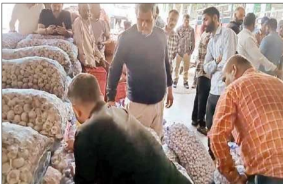
सोलन सब्जी मंडी में लहसुन की खरीददारी करते आइती।

औषधीय गुणों से युक्त सोलन और सिरमौर के लहसुन की बाहरी राज्यों में बढ़ गई है। सोलन सब्जी मंडी में लहसुन की आमद बढ़ने के साथ तमिलनाडु, कर्नाटक और असम के कारोबारी हाथोंहाथ माल लेने को तैयार हैं। सब्जी मंडी से रोज 20 से 22 टन लहसुन सप्लाई हो रहा है। वहीं, किसानों को भी लहसुन की फसल के अच्छे दाम मिल रहे हैं। बेस्ट क्वालिटी लहसुन के दाम इन दिनों 165 से 170 प्रति किलो तक पहुंच गए। हालांकि हल्दी क्वालिटी का लहसुन 80 रुपए के आसपास चल रहा है।