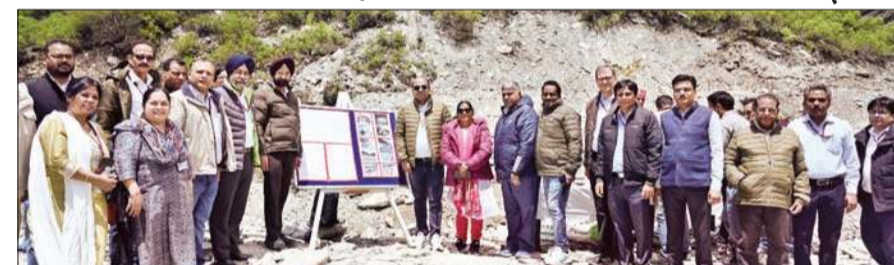
पार्वती जल विद्युत परियोजना चरण-2 नगवाई में एनएचपीसी लिमिटेड के स्वतंत्र निदेशकों की टीम के साथ अन्य अधिकारी।