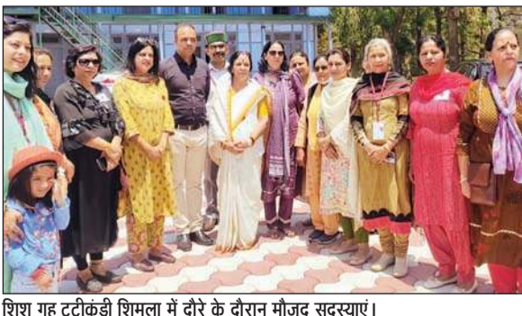
शिशु गृह टूटीकंडी शिमला में दौर के दौरान मौजूद सदस्य।