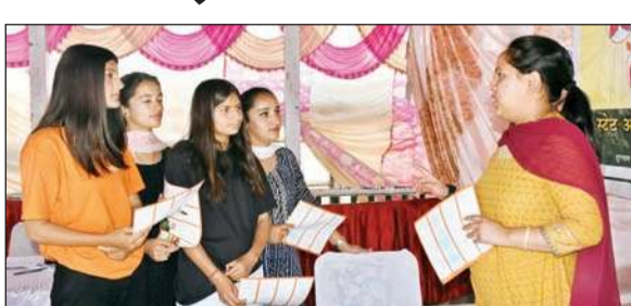
रिज मैदान पर अंगदान के लिए जागरूक करते हुए।

व्यक्ति को ब्रेन डेथ की पुष्टि होने के बाद, डॉक्टर उसके घरवालों को इच्छा से शरीर से अंग निकाल पाते हैं। इससे पहले सभी कानूनी प्रक्रियाएं पूरी की जाती हैं। इस प्रक्रिया को एक निश्चित समय के भीतर पूरा करना होता है। ज्यादा समय होने पर अंग खराब होने शुरू हो जाते हैं। देश में प्रतिदिन प्रत्येक 17 मिनट में एक मरीज ट्रांसप्लांट का इंतजार करते हुए जिंदगी से हाथ धो बैठता है। एक व्यक्ति जिसकी उम्र कम से कम 18 वर्ष की स्वैच्छिक रूप से अपने करीबी रिश्तेदारों को देश के कानून व नियमों के दायरे में रहकर अंगदान कर सकता है। अंगदान एक महान कार्य है जो हमें मृत्यु के बाद कई