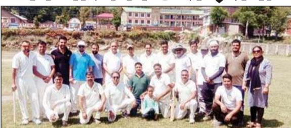
बार और एसडीएम इलेवन के मैच की विजयी टीम सामूहिक चित्र में।