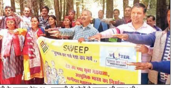
मंडी के मतदान केंद्र 78- चुरासनी में लोगों ने मतदान की शपथ ली।