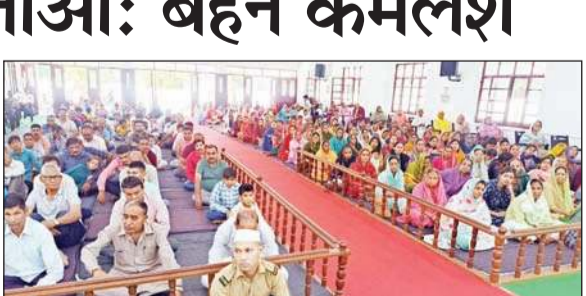
संत निरंकारी भवन घुरकड़ी में सत्संग के दौरान मौजूद संगत।