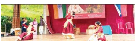
अंतरराष्ट्रीय रौरिक मेमोरियल ट्रस्ट नगर में सांस्कृतिक कार्यक्रम पेश करते कलाकार।