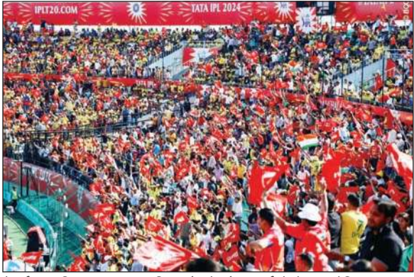
चेन्नई सुपर किंग्स बनाम पंजाब किंग्स मैच के दौरान दर्शकों से भरा स्टेडियम।