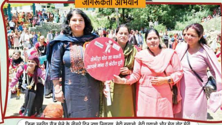
जिला स्तरीय सेंज मेले के तीसरे दिन नशा निवारण, बेटी बचाओ, बेटी पढ़ाओ और मेरा वोट मेरी ताकत थीम पर आयोजित महानदी के दौरान मतदाताओं को जागरूक करती डीसी कुल्लू।