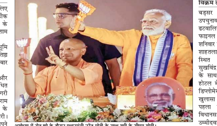
अयोध्या में रोड शो के दौरान प्रधानमंत्री नरेंद्र मोदी के साथ यूपी के सीएम योगी।

इस साल जनवरी में राम जन्मभूमि मंदिर में भगवान रामलला के प्राण प्रतिष्ठा समारोह के बाद पीएम मोदी ने पहली बार अयोध्या का दौरा किया। प्रधानमंत्री नरेंद्र मोदी इटावा और धौरहरा में चुनावी सभाओं को संबोधित करने के बाद रविवार सायं रामनगरी अयोध्या पहुंचे। पीएम मोदी ने श्रीराम जन्मभूमि पहुंच कर प्रभु श्रीरामलला के दर्शन कर भगवान की आरती उतारी। उन्होंने सोशल मीडिया एक्स पर अपने संदेश में लिखा कि अयोध्या में श्रीराम लला के दर्शन और पूजन कर भावविभोर हूँ। रोड शो के दौरान पीएम मोदी की एक झलक पाने के लिए जनता बेताब थी। लोग सड़कों पर जुटे थे और जोश के साथ नारे