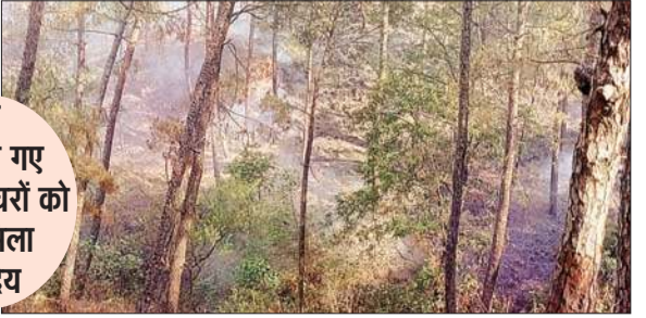
घटनाओं को कम किया जा सके। इसके अलावा वन विभाग ने 62 फायर वाचर की तैनात कर दिए हैं। यह फायर वाचर आग की घटनाओं को जानकारी वन विभाग को देंगे,

अनिल कुमार, हमीरपुर। गर्मियों का सीजन शुरू हो चुका है, ऐसे में उपायुक्त ने भी वन विभाग को आग से होने वाले नुकसान पर अंकुश लगाने को लेकर विशेष प्रबंध करने के निर्देश दिए हैं। वन विभाग ने भी आदेशों का पालन करते हुए जिला में उन स्थानों की मैपिंग की है जहां पर पिछले पांच वर्षों से आग की घटनाएं बहुत ज्यादा हुई हैं। अब वन विभाग इन चिन्हित स्थानों पर अपना फोकस रखेगा, जिससे आग की