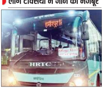
लोग टैक्सियों में जाने को मजबूर

लिए करीब 12 से 15 बसों रूट पर चलती थी, लेकिन जब से फोर लाइन से बस सुविधा शुरू हुई है, तब से लेकर आज तक भोटा से ऊना जाने वाले लोगों को काफी दिक्कतों का सामना करना पड़ रहा है और मजबूरन बस स्टैंड से रेलवे स्टेशन जाने के लिए टैक्सी का सहारा लेना पड़ता है। स्थानीय लोगों ने बताया कि हमीरपुर से हरिद्वार बस शाम 5.10 पर चलती है उसके बाद कोई बस सेवा ऊना या चंडीगढ़ के लिए नहीं है। लोगों ने एचआरटीसी प्रबंधन से गुहार लगाई है कि शाम के समय हमीरपुर से ऊना के लिए बस सेवा शुरू की जाए, ताकि लोगों को आवाजाही में सुविधा मिल सके। (अनंत ज्ञान)