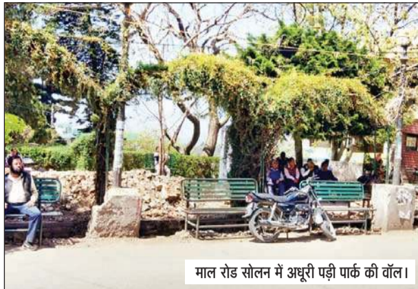
माल रोड सोलन में अधूरी पड़ी पार्क की वॉल।

विकास कार्य शुरू नहीं होने का सीधा असर आगामी लोकसभा चुनाव में देखने को भी मिल सकता है। शहर के लोगों को उम्मीद थी कि चुनाव से पहले अधूरे विकास कार्य पूरे हो जाएंगे, लेकिन ठेकेदारों व पार्षदों की कार्यप्रणाली इसमें आड़े आ गई।