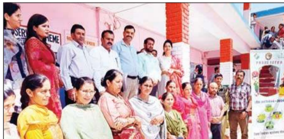
ओच्छाट स्कूल में स्वीप कार्यक्रम के तहत जागरूकता कार्यक्रम में हिस्सा लेते लोग।