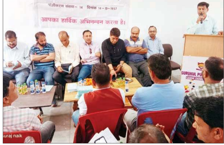
बैठक को संबोधित करते हुए संगठन के नेता।

142 खंड प्रधानों को भी राज्य कार्यकारिणी में शामिल किया गया। बैठक में 26 अप्रैल 2010 से पूर्व में लगे टीजीटी अध्यापकों को हेड मास्टर पद पर प्रमोशन की छूट देने और ट्रांसफर पॉलिसी में 30 किलोमीटर की दूरी के स्थान पर पुरानी पॉलिसी को ही अमल जामा पहनाने का प्रस्ताव पारित किया गया। यात्रा भत्ता 30 किलोमीटर की शर्त से हटाकर 8 किलोमीटर करने की भी मांग की गई। मेडिकल भत्ते के स्थान पर कैशलेस हेल्थ स्कीम लागू की जाए। कॉन्ट्रैक्ट कर्मचारियों और शिक्षकों को रेगुलर करने के लिए अवधि में वर्ष में दो बार करने का सुझाव भी रखा गया।