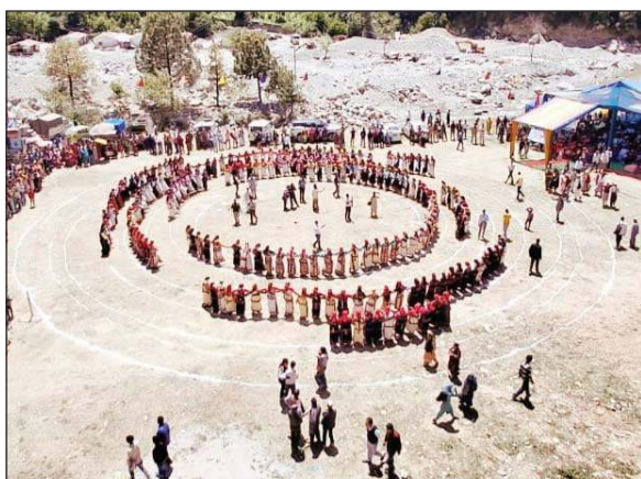
सैंज मेले के तीसरे दिन पारंपरिक कुल्लवी वेशभूषा में नाटी पर थिरकती महिलाएं।