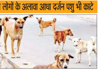
पांच लोगों के अलावा आधा दर्जन पशु भी काटे