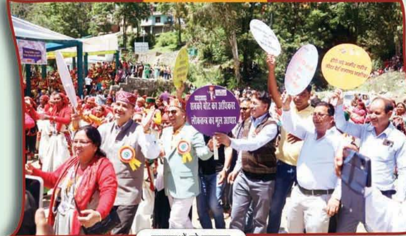
मतदाताओं को जागरूक करती स्वीप टीम।