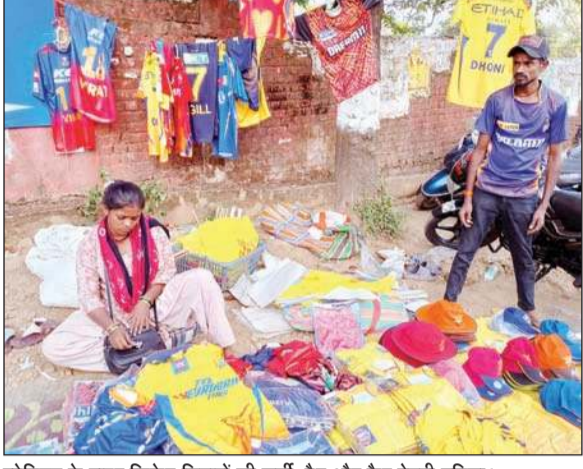
स्टेडियम के बाहर क्रिकेट सितारों की जर्सी, हैट और कैप बेचती महिला।