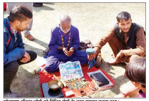
झोलाछाप डॉक्टर लोगों को विभिन्न रोगों के तहत गुमराह करता हुआ।

गौर हो कि झोलाछाप डॉक्टरों ने अपनी ओपन क्लीनिक चंबा चिकित्सालय समक्ष तक लगाने से गुरेज नहीं करते हैं। वहीं विभाग इस दिशा कार्रवाई की बजाय चुपचाप साधे रहता है। झोलाछाप डॉक्टरों के पास ऐसा कोई रोग नहीं था जिसका वह उपचार शत-प्रतिशत ठीक होने का दावा न करते हो, जिसमें जोड़ों का दर्द, कमर का दर्द, गठिया, हड्डी के टूटने या ठीक आकार में न जुड़ने,