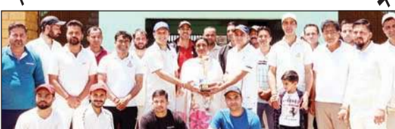
दोनों टीमों को सम्मानित करती हुई मंडलायुक्त मंडी रखी काहली।

अंतिम ओवर में एसपी इलेवन की टीम को जीत के लिए 13 रनों