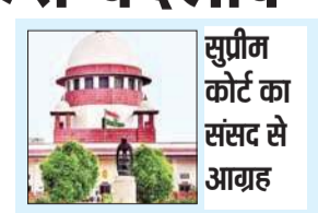
सुप्रीम कोर्ट का संसद से आग्रह