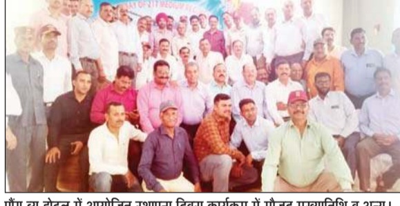
पौंग ब्यू होटल में आयोजित स्थापना दिवस कार्यक्रम में मौजूद मुख्यातिथि व अन्य।

सांस्कृतिक कार्यक्रमों का आयोजन भी किया गया जिसमें देशभक्ति गीतों, नृत्यों और नाटकों का प्रदर्शन किया गया। समारोह का समापन पुरस्कार वितरण समारोह के साथ हुआ। इसमें उत्कृष्ट प्रदर्शन करने वाले जवानों को सम्मानित किया गया। इस अवसर पर वेटरंस डे बिग गन कार्यक्रम के आयोजक