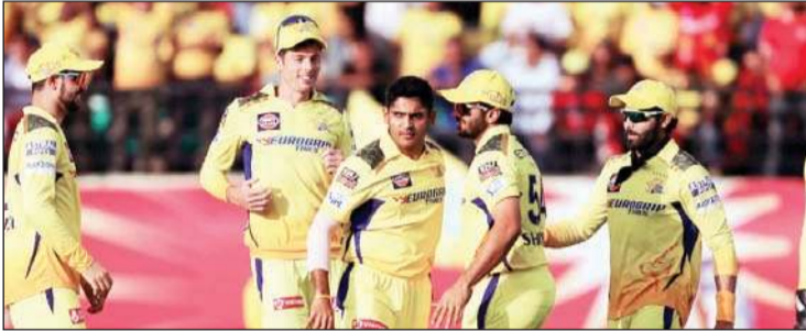
धर्मशाला में पंजाब किंग्स के खिलाड़ी को आउट करने के बाद जश्न मनाते चेन्नई सुपर किंग्स के प्लेयर

बिना खाता खोले पवेलियन लौटे। इस सीजन में पहली बार वह गोल्डन डक पर आउट हुए। लक्ष्य का पीछे करने उतरी पंजाब किंग्स