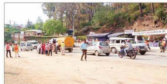
राधा स्वामी डेरा परौर में बस स्टॉप के पास मौजूद संगत।

इस दौरान पंडाल में मौजूद लाखों की संगत ने उनके प्रवचन सुने। सत्संग शुरू होने से पहले पूरा पंडाल 'दीन दयाल भरोसे तेरे' से गूँज उठा। राधा स्वामी सत्संग परिसर परौर में रविवार को डेरा ब्यास प्रमुख गुरिंद्र सिंह ढिल्लों महाराज की एक झलक पाने के लिए आस्था का सैलाब उमड़ पड़ा। डेरा प्रमुख ने भी