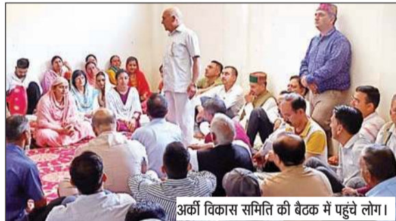
अर्की विकास समिति की बैठक में पहुंचे लोग।