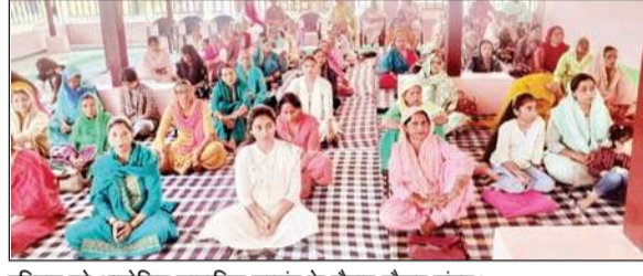
रविवार को आयोजित साप्ताहिक सत्संग के दौरान मौजूद संगत।

से वह कोसों दूर है। गुरु शिष्य की छोटी से छोटी सेवा से भी अत्यंत प्रसन्न हो जाते हैं। गुरु को दान करने से हमारा धन पवित्र होता है। गुरु का ध्यान करने से हमारा मन पवित्र होता है और गुरु की सेवा करने से हमारा तन पवित्र होता है।