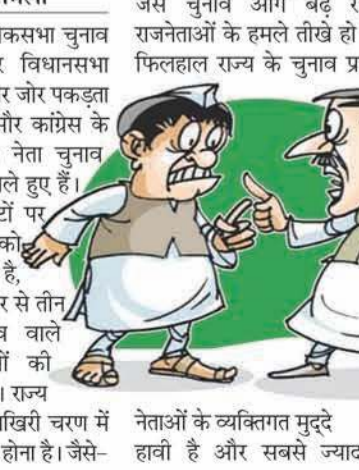
नेताओं के व्यक्तिगत मुद्दे हावी हैं और सबसे ज्यादा गूंज

हिमाचल प्रदेश में लोकसभा चुनाव और छह सीटों पर विधानसभा उपचुनाव के लिए प्रचार जोर पकड़ता जा रहा है। भाजपा और कांग्रेस के प्रदेश स्तरीय वरिष्ठ नेता चुनाव प्रचार को कमान संभाले हुए हैं। भाजपा सभी सीटों पर अपने प्रत्याशियों को मैदान में उतर चुकी है, जबकि कांग्रेस को ओर से तीन विधानसभा उपचुनाव वाले सीटों पर प्रत्याशियों को घोषणा होना बाकी है। राज्य की सभी सीटों पर आखिरी चरण में पहली जून को मतदान होगा। जैसे-