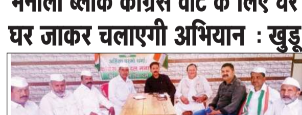
कांग्रेस सेवादल की बैठक के दौरान कांग्रेस व सेवादल के पदाधिकारी।

अनंत ज्ञान, पतलीकूहल जिला कुल्लू के कटराई स्थित शुभम मनाली ब्लॉक कांग्रेस के सभी सेवा दल की बैठक का आयोजन किया गया। इस बैठक में मनाली ब्लॉक के पदाधिकारियों ने भाग लिया।