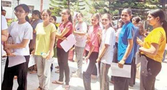
नीट की परीक्षा देने आए स्टूडेंट्स।