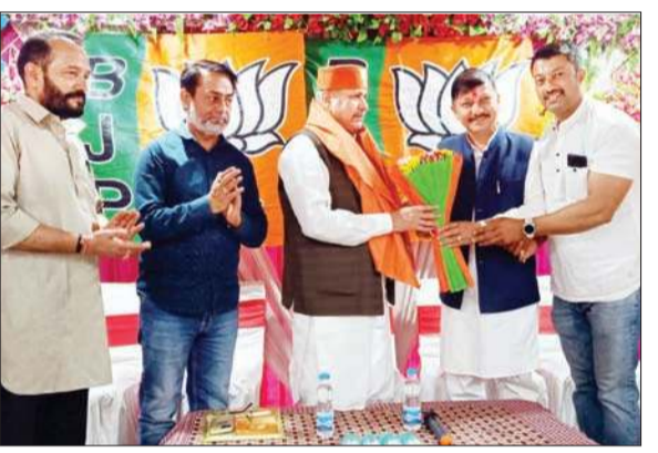
भाजपा राष्ट्रीय उपाध्यक्ष सौदान सिंह का स्वागत करते राजेंद्र राणा व अन्य।

अनंत ज्ञान, सुजानपुर। प्रधानमंत्री नरेंद्र मोदी विकसित भारत को लेकर आगे बढ़ रहे हैं। उसके साथ देश का हर भाजपा का कार्यकर्ता विकसित भारत बनाने के लिए आगे रहा है। भाजपा का लक्ष्य एनडीए 400 पार है, इसलिए प्रत्येक कार्यकर्ता को भाजपा के उम्मीदवारों को जीत दिलवानी है। यह बात भाजपा राष्ट्रीय उपाध्यक्ष सौदान सिंह ने सुजानपुर में आयोजित भाजपा मंडल सुजानपुर संगठन की बैठक को संबोधित करते हुए कही। उन्होंने कहा कि हमीरपुर संसदीय क्षेत्र से भाजपा ने अनुराग ठाकुर को पांचवीं बार चुनाव मैदान में उतारा है और सुजानपुर