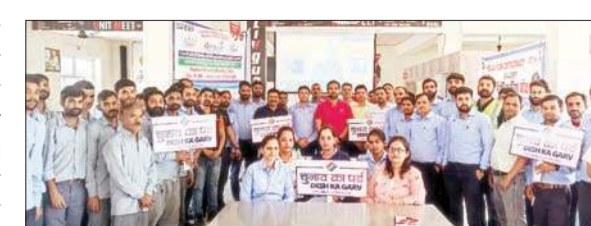
लिवागर्ड उद्योग में मतदाताओं को जागरूक करते अधिकारी

बेशक लोग पहचान गूँथ गए हैं, लेकिन मतदान को लेकर ज्यादातर लोग अभी भी जागरूक नहीं हैं। अभी भी कई लोगों में यह भ्रांति है कि उनके मतदान करने से क्या हो जाएगा। उन्होंने कहा कि अगर बिना भय व लोभ लालच मतदान किया जाए तो एक-एक मत इस देश को श्रेष्ठ बनाने के काम आता है। उन्होंने कहा कि जो मतदाता 85 वर्ष या इससे अधिक आयु के हैं या फिर जो मतदाता चालीस प्रतिशत से अधिक दिव्यांग हैं वह घर बैठे भी मतदान प्रक्रिया में भाग ले सकते हैं।