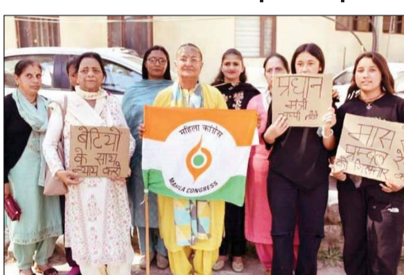
कुल्लू महिला कांग्रेस के सदस्य यौन उत्पीड़न के आरोपी प्रज्वल रेवन्ना के खिलाफ धरना-प्रदर्शन कर रोष प्रकट करते हुए।