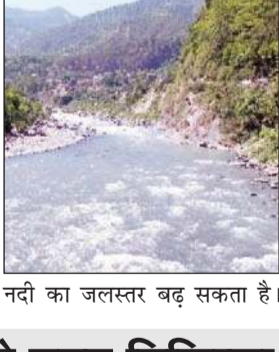
नदी का जलस्तर बढ़ सकता है।

एनएचपीसी प्रबंधन ने लोगों से आह्वान किया है कि वह उक्त समय में किसी भी परिस्थिति में नदी के किनारे न तो स्वयं जाएं और न ही अपने मवेशियों को नदी के किनारे जाने दें। जिसके कारण जान जोखिम में अथवा अनहोनी के शिकार से लोगों को गुजरना पड़े। इसके साथ प्रबंधन ने शहर में पहुंच रहे प्रयटकों को चेतावनी देते हुए कहा कि रावि न उतरे, जिससे उनकी जान को खतरा हो सकता है।