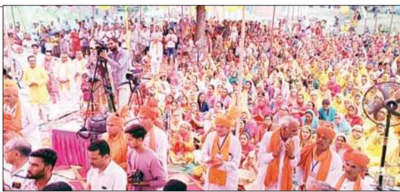
डेरा बाबा रुद्रानंद मंडल बंगाल में आयोजित धार्मिक समागम में उमड़ा जनसैलाब