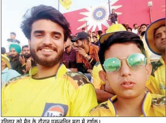
रविवार को मैच के दौरान प्रसन्नचित मुद्रा में दर्शक।