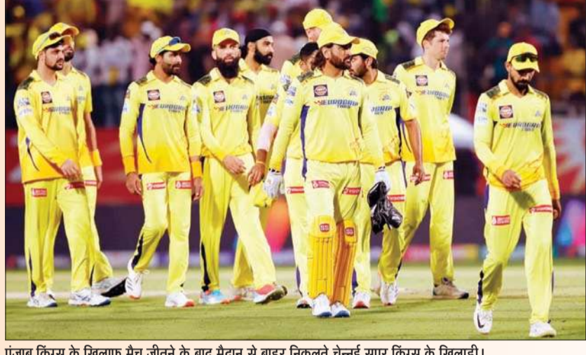
पंजाब किंग्स के खिलाफ मैच जीतने के बाद मैदान से बाहर निकलते चेन्नई सुपर किंग्स के खिलाड़ी।

168 रन का पीछा करते हुए पंजाब किंग्स की टीम 9 विकेट पर 139 रन बना सकी। इस जीत से चेन्नई सुपर किंग्स की टीम 11 मैचों में 12 अंकों के साथ अंक तालिका में टॉप-3 पर पहुंच गई है। इस जीत से चेन्नई ने प्लेऑफ की उम्मीदों को मजबूत किया है। पंजाब की टीम के 11 मैचों के बाद इस हार के बाद 8 मात्र है।