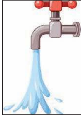
ग्रामीणों का आरोप है कि चनौता रोड नैहरनपुरखर आदि तमाम इलाकों