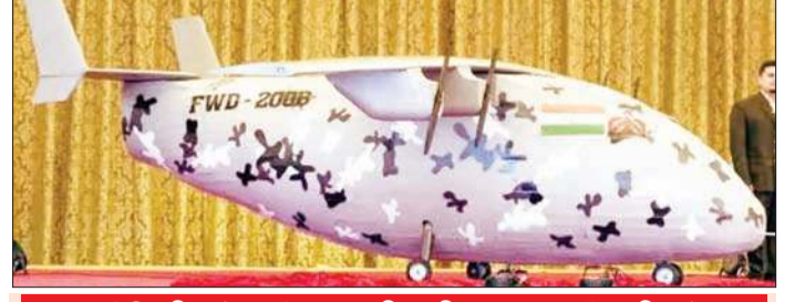
अमेरिकी ड्रोन से 10 फीसदी सस्ता स्वदेशी ड्रोन

एसेंसी, नई दिल्ली भारत को अब एयर स्ट्राइक करने के लिए अपने विमानों को दुश्मन के इलाके में भेजने की जरूरत नहीं है। भारत में तैयार बमवर्षक ड्रोन दुश्मन को उनके इलाके में चुसकर नेस्तानाबूद कर देगा। भारत ने रक्षा क्षेत्र में बड़ी उपलब्धि हासिल की है।