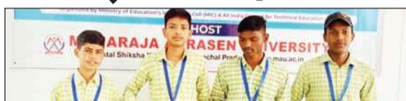
पांच दिवसीय बूट कैंप में हिस्सा लेकर लौटे धर्मपुर के छात्र।

समिति कुनिहार के अध्यक्ष, उपाध्यक्ष सहित सात प्रधानों ने बिना किसी शर्त के अपना समर्थन देने की बात कही। बैठक में समिति के करीब 500 सदस्य मौजूद रहे। बैठक में गंगा पुत्र के जयकारों के बीच मां गंगा की