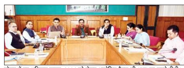
सोलन में वन अधिकार कानून, 2006 को लेकर आयोजित बैठक की अध्यक्षता करते डीसी।

इस अवसर पर उपायुक्त ने कहा कि अनुसूचित जनजाति और अन्य परंपरागत वन निवासी (वन अधिकारों की मान्यता) अधिनियम, 2006 व नियम, 2008 व संशोधित नियम, 2012 को संक्षिप्त में वन