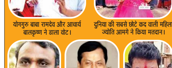
दक्षिण चेन्नई से भाजपा उम्मीदवार तमिलसाई सौंदराराजन ने डाला वोट।