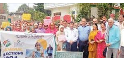
वृथ नंबर 70 जोल में मतदाता जागरूकता कार्यक्रम में ग्रामीण।