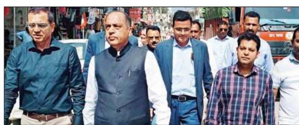
एक समारोह में शामिल होने जाते हुए पूर्व मुख्यमंत्री जयराम ठाकुर।

इसके बाद यूपीए की दस वर्षों तक केंद्र में सरकार रही तो हिमाचल को छोटा राज्य बोलकर न केवल विकास में भेदभाव हुआ बल्कि प्रदेश में कांग्रेस की सरकार होने के बावजूद यहां के प्रमुख