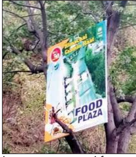
पेड़ पर लगाया गया साइन बोर्ड।

पाती है। ऐसा करने से पेड़ सूख जाता है। उन्होंने इसे अमानवीय और गैरकानूनी करार दिया। यह कृत्य वन विभाग के लिए चिंतनीय है। उन्होंने ऐसे होटल व रेस्टोरेंट मालिकों को खुद जल्द ही बोर्ड स्वयं हटाने की अपील की है। उन्होंने चेतावनी भी दी है कि ऐसा न करने पर विभाग खुद ये बोर्ड उतारेगा और उस संस्थान के खिलाफ कार्रवाई भी की जाएगी। उन्होंने कहा कि पंडोह डैम के पास एक पेड़ पर बड़ा बोर्ड लगाया गया था, ऐसा करने के