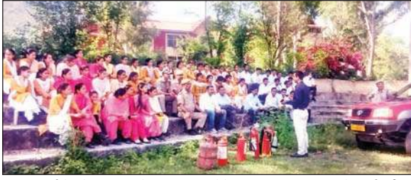
प्रशिक्षणार्थियों को आग बुझाने का प्रशिक्षण देते हुए अग्निशमन विभाग के कर्मचारी।