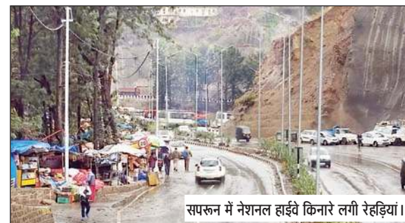
सपरून में नेशनल हाईवे किनारे लगी रेहड़ियां।