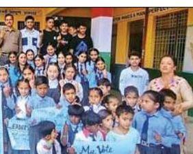
मतदाता जागरूकता कार्यक्रम में प्रस्तुति देते बच्चे कलाकार।