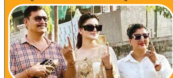
बॉलीवुड अभिनेत्री उर्वशी शौतेला ने उत्तराखंड के कोटद्वार में डाला वोट।