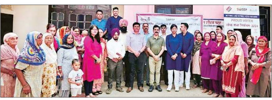
मतदान प्रतिशतता बढ़ाने को लेकर आयोजित जागरूकता शिविर में ग्रामीण तथा आयोजक।

इसी कड़ी में व्यवस्थित मतदाता शिक्षा और चुनावी भागीदारी कार्यक्रम (स्वीप) के तहत आज शुक्रवार को हरोली विधानसभा क्षेत्र की पंचायत गोंदपुर बुल्ला और भडियारां में मतदान प्रतिशतता को बढ़ाने के मकसद से प्रथम आईआरबीएन बगढ़ के एकलव्य कलामंच ने गांववासियों को नुकड़ नाटक व गीत-संगीत के जरिए वोट के महत्व बारे जागरूक किया और