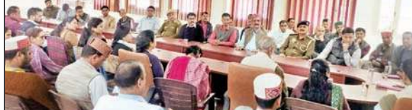
मेले के सफल आयोजन को लेकर बैठक करते एसडीएम बंजार सहित मेला समिति सदस्य।

पांच कोठी के आराध्य देवता श्री श्रृंगा ऋषि के सम्मान में जिला स्तरीय मेला बंजार के सफल आयोजन को लेकर बैठक की गई।