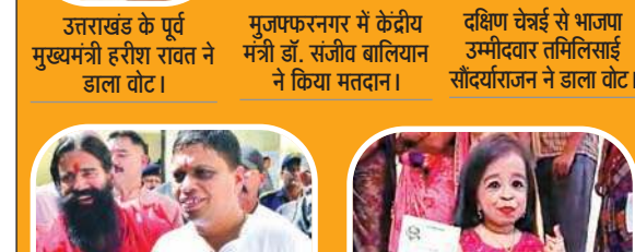
मुजफ्फरनगर में केंद्रीय मंत्री डॉ. संजीव बालियान ने किया मतदान।