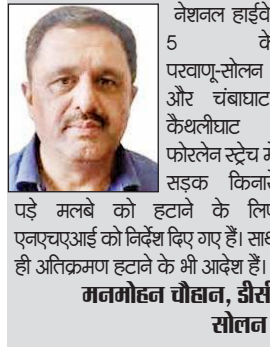
नेशनल हाईवे-5 के परवाणू-सोलन और चंबाघाट-कैथलीघाट फोरलेन स्ट्रैच में सड़क किनारे पड़े मलबे को हटाने के लिए एनएचआई को निर्देश दिए गए हैं। साथ ही अतिक्रमण हटाने के भी आदेश हैं।

मानसून विवाद हुए लंबा वक्त गुजर जाने के बावजूद परवाणू-सोलन, चंबाघाट-कैथलीघाट फोरलेन में मलबा पड़ा होने के चलते अभी भी सिंगल लेन के सहारे ही वाहनों की आवाजाही हो रही है। इससे वाहन दुर्घटनाओं का खतरा बना हुआ है। फोरलेन पर अब भी कई जगह पर एनएचआई डबललेन सड़क को नहीं खोल पाया है, जबकि अब मानसून को विवाद हुए नौ महीने का समय बीत चुका है। परवाणू से सोलन तक भी कई जगह सिंगल लेन ही चल रही है। इन जगहों पर सड़क हादसों का खतरा तो बना ही है साथ ही चालकों को परेशानी का सामना करना पड़ रहा है।