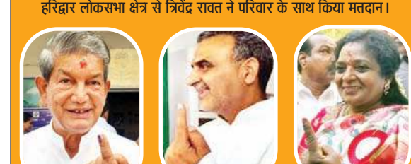
उत्तराखंड के पूर्व मुख्यमंत्री हरीश रावत ने डाला वोट।