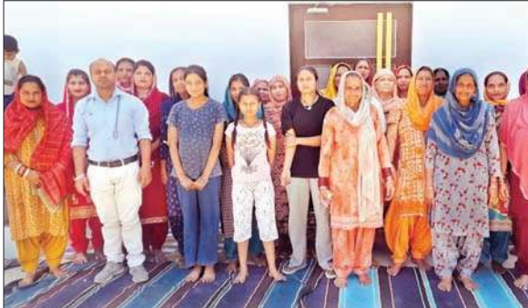
स्वास्थ्य शिविर में लाभ लेने वाले लोग टीम के सदस्यों के साथ।