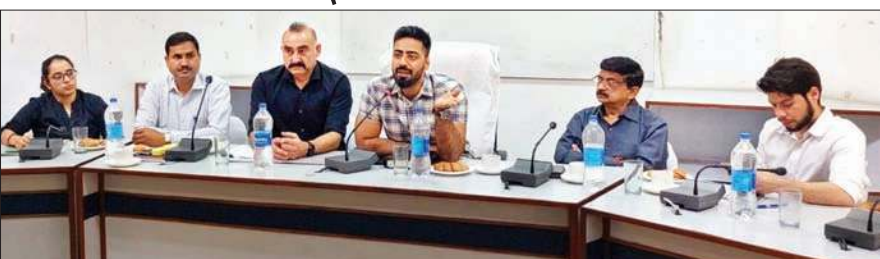
उपायुक्त राष्ट्रीय नाकों समन्वय पोर्टल (एनकोर्ड) के तहत बनी जिलास्तरीय समन्वय समिति की बैठक में अन्य सदस्यों के साथ।

नारकोटिक ड्रग्स एंड साइकोट्रोपिक सब्सटेंस (एनडीपीएस) अधिनियम के तहत अपराधियों की गिरफ्तारियों समेत इससे जुड़े विविध पहलुओं पर विस्तृत चर्चा की गई। युवाओं के लिए एनडीपीएस कार्यक्रम का योजना बनाने के निर्देश दिए। पंचायतों में हों खेल गतिविधियां : उपायुक्त ने कहा कि युवाओं को नशे से दूर रखने