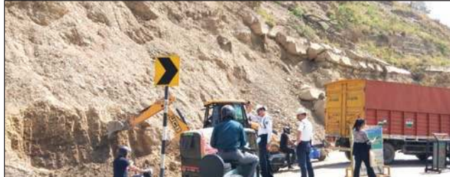
सोलन के सपरून में सुबाथू चौक पर गिरे मलबे को हटाने हुए।