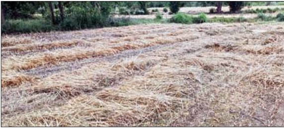
बारिश से कारण खेतों में खराब हो रही किसानों की कटाई गई गेहूं की फसल।

ऊना, हरोली बंगाणा, दौलतपुर चौक और गगरेट क्षेत्र में तो कई गांवों में फसल की कटाई तक शुरू हो चुकी है। वहां, खेतों में कटाई गई फसल पर हल्की बारिश होने से फसल गीली हो चुकी है और अब उसे दोबारा सुखाना होगा। हालांकि मौसम फिर बिगड़ चुका है। जानकारी के अनुसार जिले में गेहूं की कटाई अप्रैल के अंतिम सप्ताह तक पूरी कर ली जाती है। वीरवार से ही आसमान पर बादल