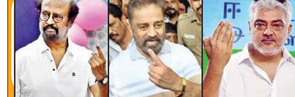
साउथ के सुपर स्टार रजनीकांत, कमल हासन व अजित कुमार ने किया मतदान।