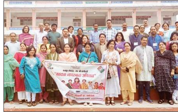
मतदाता जागरूकता कार्यक्रम के दौरान अधिकारी, कर्मचारी व अन्य।