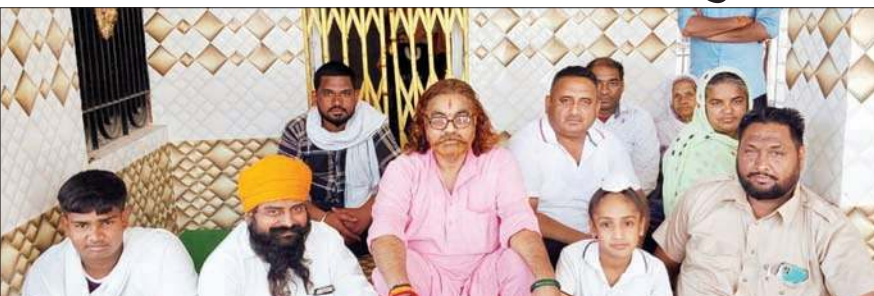
मंदिर कमेटी के सदस्य बैठक करते हुए।