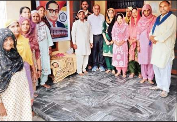
डॉ. भीमराव अंबेडकर के महापरिनिर्वाण पर आयोजित कार्यक्रम में मौजूद ग्रामीण।