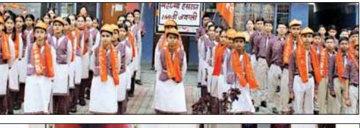
महात्मा हंसराज जयंती पर आयोजित कार्यक्रम में उपस्थित स्टूडेंट्स व शिक्षक।

डीएवी विद्यालय आलमपुर के स्टूडेंट्स ने डीएवी विद्यालय के प्रथम मुख्याध्यापक महात्मा हंसराज की 160वीं जयंती मनाई। इस अवसर पर आयोजित गतिविधि में स्टूडेंट्स ने महात्मा हंसराज की जीवनी से संबंधित भाषण प्रतियोगिता, लेखन प्रतियोगिता व नारा लेखन में भाग लिया। साथ ही भव्य रैली का भी आयोजन किया गया।