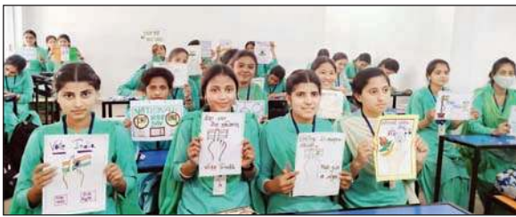
शरण कॉलेज घुरकड़ी की छात्राएं पोस्टर दिखाती हुईं।