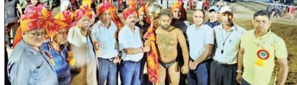
विजेता पहलवान को सम्मानित करते हुए आयोजक।