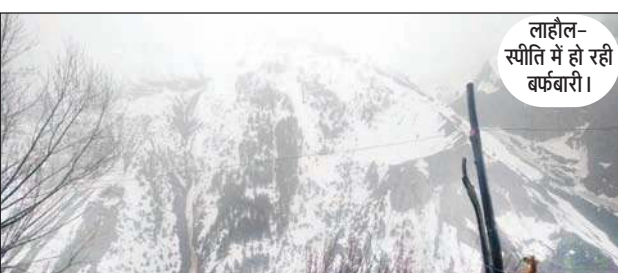
लाहौल-स्पीति में हो रही बर्फबारी।

दोनों जिले की ऊंची चोटियों पर जहां एक बार फिर से बर्फबारी हुई है। वहीं, निचले क्षेत्रों में हल्की बारिश होने से पर्यटन नगरी मनाली सहित कुल्लू में मौसम सुहावना होने के साथ-साथ कूल-कूल हो गया है। उधर, बर्फ के दीवार बनने लाहौल के पर्यटन स्थल अटल टनल व कोकसर गए पर्यटक आसमान से गिरे बर्फ के फाहों को देखकर झुम उठे। पर्यटकों ने बर्फ के फाहों को कैमरे में कैद किया। पर्यटन स्थलों में दोपहर बाद बर्फ के फाहों का दौर रुक-रुक कर जारी रहा। दूसरी ओर रोहतांग, शिकुला, बारालाचा व कुंजम दर्रे में भी बर्फबारी हुई है। मनाली के पर्यटन स्थल तुलाचा सहित राहनीनाला, व्यासनाला, सागू फाल, मढ़ी,