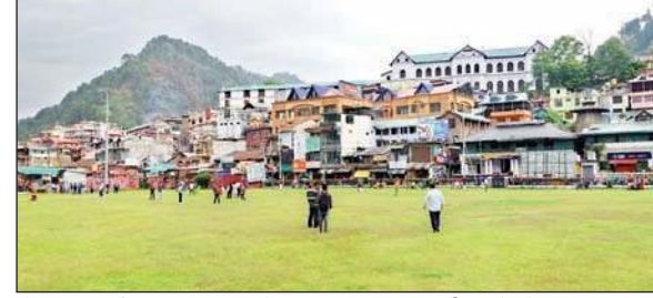
ऐतिहासिक चौगान चंबा का मनमोहक दृश्य एवं चहलकदमी करते लोग।

ऐतिहासिक चौगान को नवंबर के दूसरे सप्ताह में बंद कर दिया जाता है, जिससे चौगान के जीर्णोद्धार का कार्य किया जा सके। पांच महीने तक चौगान में आम जनमानस की