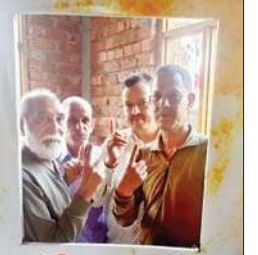
सेल्फी प्लाइट पर फोटो खिंचवाते पुरुष मतदाता। बता दें कि ग्राम पंचायत दलेइ, पीहड़ बेहडलू, ऊटपुर में सेल्फी प्लाइट स्थापित किए हैं।