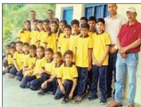
अधिकांश बच्चों को नई वर्दी मिल चुकी है।