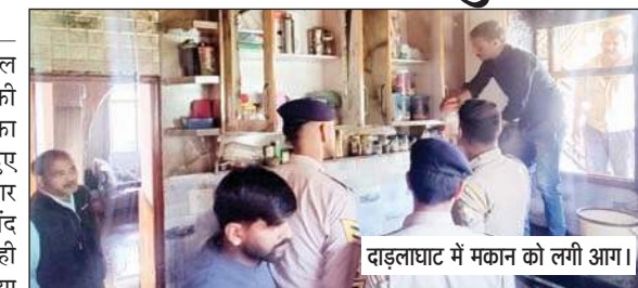
दाइलाघाट में मकान को लगी आग।

पहुंचे तो देखा कि उनकी दुकान में रखा कपड़ा जल रहा है तभी आस-पास के लोगों ने अग्निशमन केंद्र में फोन कर दिया व आग पर काबू पा लिया गया व आज सुबह स्थानीय विधायक सीपीएस संजय अवस्थी भी मौके पर पहुंचे और नुकसान का जायजा लिया व कहा कि इनकी जो भी मदद होगी की जाएगी।