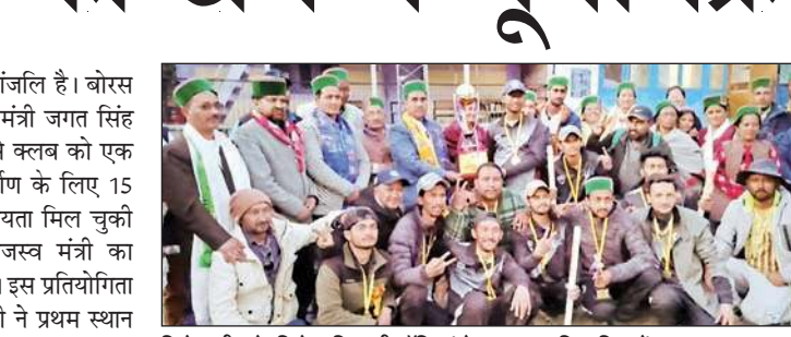
क्रिकेट टीम के विजेता खिलाड़ी ट्रॉफियों के साथ सामूहिक चित्र में।