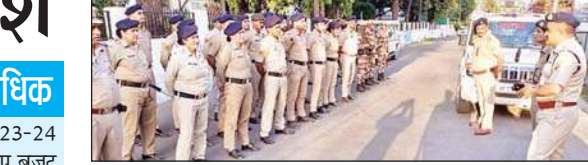
कानून व्यवस्था व मतदान जागरूकता के लिए पुलिस मार्च निकालते हुए।