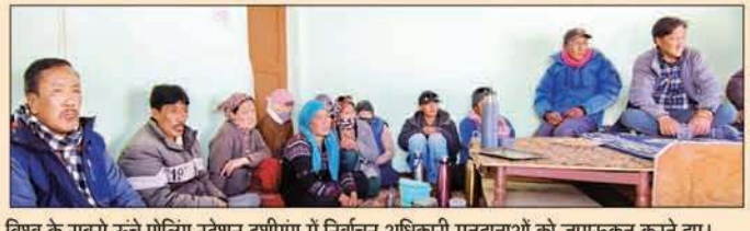
विश्व के सबसे ऊंचे पॉलिग स्टेशन टशीगंग में निर्वाचन अधिकारी मतदाताओं को जागरूक करते हुए।

हिमाचल में 1985 के बाद बदला सत्ता बदलने का ट्रेंड, कभी बीजेपी तो कभी कांग्रेस रही बरकरार