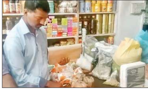
घुमारवीं। दुकानों में छापेमारी के दौरान एक दुकान में सैपल भरता हुआ फूड सेफ्टी विभाग का कर्मी।

इस बात की आशंका पहले ही जताई गई थी इतने दिनों तक विभाग द्वारा कार्रवाई न करने के कारण दुकानदारों को मिलावटी खाद्य पदार्थ को ठिकाना लगाने का मौका मिल जाएगा और आखिर में वहीं हुआ की विभाग ने छापेमारी तो की लेकिन उन्हें वह खाद्य पदार्थ दुकान में मिला ही नहीं। जबकि गुमारवीं पुलिस द्वारा इस मामले में गंभीरता को देखते हुए तत्काल कार्रवाई करते हुए बाजार से ऐसे ही चावलों की एक बोरी अपने कब्जे में ले ली थी।