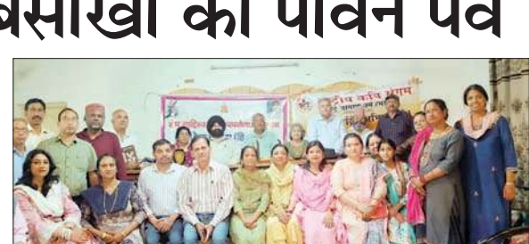
अरनी विश्वविद्यालय में बैसाखी पर आयोजित कार्यक्रम के दौरान मौजूद स्टाफ व अन्य।