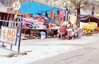
सड़क किनारे रेहड़ियों से सामान खरीदते हुए लोग।

अवैध रूप से दुकानें सजाने वालों पर कड़ी कार्रवाई की जाएगी। यदि अस्पताल गेट के सामने सड़क किनारे फेरिस्टों के दुकानदारों के पर नियामतुत्तर कार्रवाई की जाएगी।