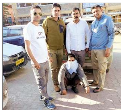
गिरफ्तार आरोपी पीओ स्टाफ के साथ।