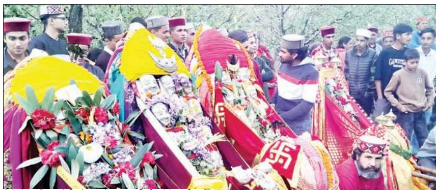
मेले में उपस्थित देवी-देवताओं का आशीर्वाद लेते ग्रामीण