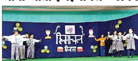
हिमाचल दिवस पर प्रस्तुति पेश करते बच्चे।