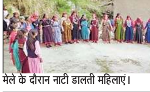
मेले के दौरान नाटी डालती महिलाएं।

बखुबी से निभाया गया। तीन माह बाद घाटी के देवी-देवताओं द्वारा दिए गए दर्शन से लोगों में काफी उत्साह देखने को मिला। रंग-बिरंगे फूलों से सजे देवस्थों को देख कर हर लोगों को अपनी ओर आकर्षित किया। ग्रामीण महिलाओं ने पारंपरिक तरीके से देवी-देवताओं की पूजा अर्चना कर रस्म को निभाया है। गौर हो कि मणिकर्ण घाटी के उड़ई गांव में देवता सुन नाचयण, माता कैलाशना और देवता मकाल राजा तथा धारला में माता रूपसना, बुहाड़ में देवता कालीनाग, सिसु तथा जंजी में नमोनाचयण के सम्मान में विरशू मेलों का आयोजन किया। विरशू मेला घाटी का प्रमुख त्योहार है और शनिवार को घाटी में विरशू को देव परंपरा अनुसर मनाया गया।