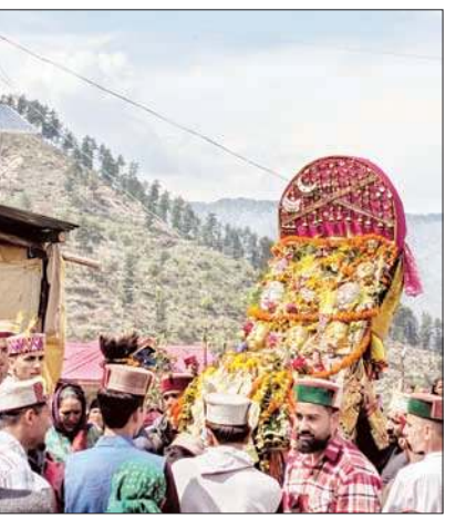
बैसाख संक्रांति पर विरशू मेले के आगाज पर बिजली महादेव के रथ को नीचे उतारते श्रद्धालु।

में लेकर गुप्त स्थानों में छिप गए। देवों के देव बिजली महादेव ने सभी बच्चों को अपनी दिव्यदृष्टि से तुरंत ढूँढ निकाला। इस स्थान पर बच्चे छिपे हुए होते हैं उस स्थान की ओर बिजली महादेव का रथ दौड़ पड़ा है और बच्चों को ढूँढ निकाला है। जिया के शिव मंदिर पहुंचते ही देवता की पूजा-अर्चना