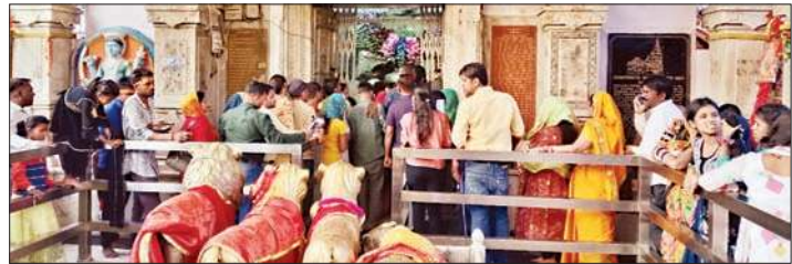
श्री बजेश्वरी देवी मंदिर कांगड़ा में कतार में लगे श्रद्धालु।