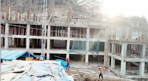
सोलन के कथेड़ में निर्माणाधीन अस्पताल जिसके बनने का लोग इंतजार कर रहे हैं।

तेजी से विकसित होते सोलन शहर में गंभीर बीमारियों के उपचार के लिए आज तक सुपर स्पेशलिस्ट डॉक्टरों की सेवाएं नहीं मिल पाई हैं, ऐसे में लोगों को बीमारियों का उपचार करवाने के लिए आईजीएमसी शिमला और पीजीआई चंडीगढ़ का रुख करना पड़ता है। तीन जिलों का केंद्र बिंदु होने के चलते यहां सोलन समेत शिमला व सिरमौर के सीमावर्ती क्षेत्र के लोगों को बीमारियों का उपचार करवाना आसान रहता है। स्थानीय लोगों की मांग पर सरकार शहर के नजदीक नेशनल हाईवे से सटे न्यू कथेड़ में सुपर स्पेशियलिटी अस्पताल का निर्माण तो करवा रही है, पर धन की कमी के कारण इस कार्य के तेजी नहीं आ रही है। इस कारण लोगों को शहर में बेहतर सुविधाएं मिलने का इंतजार करना पड़ता है। क्षेत्रीय अस्पताल में नहीं रहेगा दबाव : शहर के नजदीक हाईवे पर