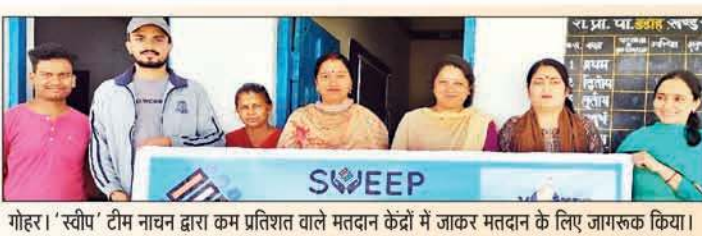
गोहर। 'स्वीप' टीम नाचन द्वारा कम प्रतिशत वाले मतदान केंद्रों में जाकर मतदान के लिए जागरूक किया।

विधानसभा चुनाव-2022 के दौरान प्रदेश में 75.60 प्रतिशत वोटिंग हुई थी। सबसे ज्यादा मतदान सिरमौर जिले (79.91 प्रतिशत) में हुआ था।