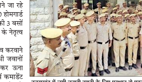
उत्तराखंड में लगी चुनावी ड्यूटी के लिए प्रस्थान से पहले होमगार्ड जवान।