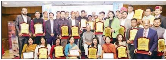
'काँफी टेबल बुकलेट' का विमोचन करते हुए राज्यपाल व अन्य।

'हिमाचल प्रदेश के हाई फ्लायर्स 2024' उस मानवीय क्षमता का प्रमाण है जो हमारे राज्य को आगे बढ़ाता है। यह भावी पीढ़ियों के लिए प्रेरणा का स्रोत है। उन्होंने कहा कि ये समाज के लिए रोल मॉडल भी हैं। उन्होंने कहा कि आज सोशल मीडिया का दौर है, लेकिन प्रिंट का स्थायी भाव है और यहीं अंतर पाठकों को समाचार पत्र से जोड़े रखता है। उन्होंने आयोजकों को बधाई देते हुए कहा कि समाज में उत्कृष्ट योगदान दे रहे व्यक्तियों को एक मंच पर लाकर उन्हीं 'संयुक्त परिवार' बनाने का कार्य किया है।