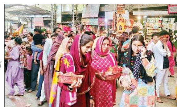
माता ज्वालाजी के दरबार में माता रानी के दर्शनों के लिए आए श्रद्धालु।