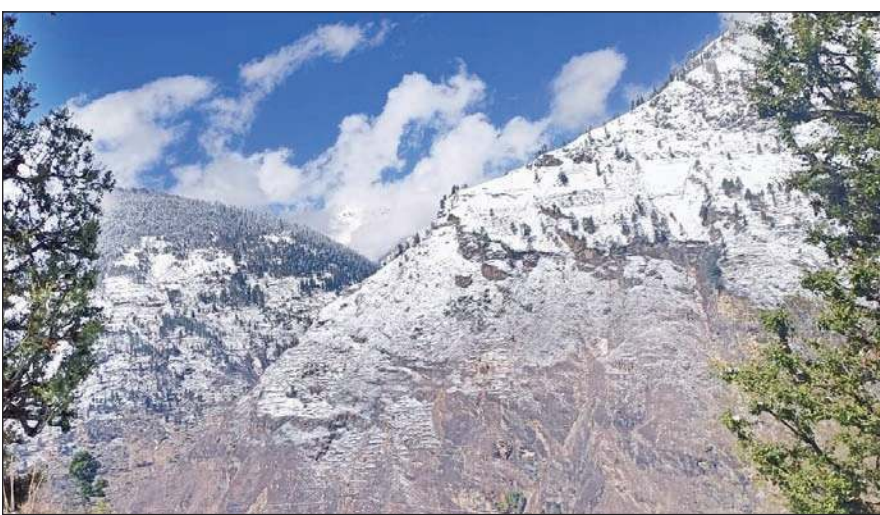
चांशल घाटी में हुए ताजा हिमपात का मनमोहक नजारा।