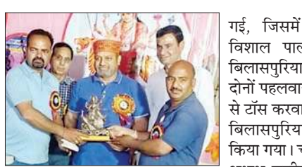
मुख्यातिथि को सम्मानित करते आयोजक।

इस दौरान कब्बडी का फाइनल मुकाबला फ्रेड-7 सुलह व भुआणा के बीच खेला गया, जिसमें भुआणा की टीम विजेता रही। मेला कमेटी की ओर से विजेता टीम को 5100 रुपए और उपविजेता को 3100 रुपए व ट्रॉफी भेंट की गई। मेले में 10 छोटी व 8 बड़ी कुशियां करवाई