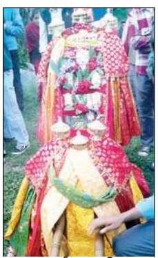
माता कटासनी का सुसजित रथ।