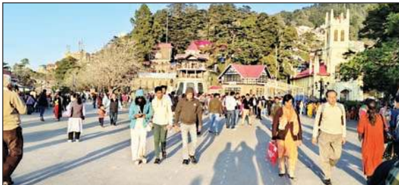
रिज ग्राउंड पर घूमते हुए पर्यटक।