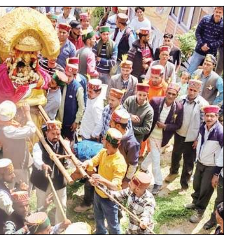
रस्सी से देव रथ को खींचते हुए लोग।

साथ मंदिर से बाहर निकाला और देव खेल का निर्वाह कर देव हारियानों ने देवता के स्वर्ण रथ को रस्सी से खींच कर साथ लगते गांव कछेनी में देवी भगवती के मंदिर पहुंचाया। कछियानी मंदिर में ऋषि ब्रह्म व भगवती महामाई का भव्य मिलन हुआ और दर्शन के लिए आए हुए सैकड़ों लोगों ने माता भगवती महामाई का आशीर्वाद लिया। इस देव प्रक्रिया को देखने के लिए कनौन गांव में सैकड़ों श्रद्धालु पहुंचे। देव प्रक्रिया संपन्न होने के पश्चात होने के बाद देव हारियानों ने कुल्लू नाटी का आयोजन किया।