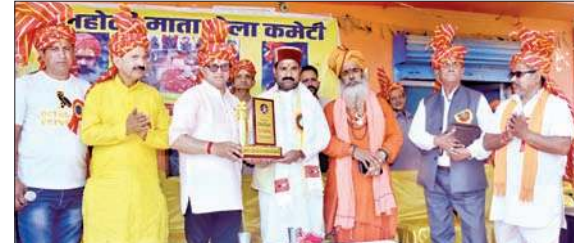
मेले के शुभारंभ पर मुख्यातिथि को सम्मानित करते आयोजक।

इस दौरान मेले के शुभारंभ पर गांव के लोगों और आस पास के क्षेत्रों से आए हुए सदस्यों का मेला कमेटी ने धन्यवाद किया। तीन दिन तक चलने वाले इस मेले में थलकूद प्रतियोगिता जैसे, रस्सा कस्सी, मटका फोड़, कुर्सी रस और युवाओं द्वारा बॉलीबाल, कब्बडी और कुश्ती जैसे अनेकों खेल करवाए जाएंगे। इस बीच आज शिव मंदिर में पूजा-अर्चना के साथ धरेद से