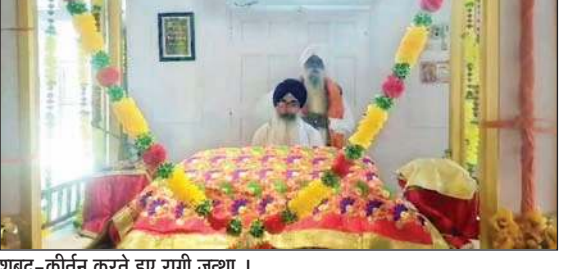
शबद-कीर्तन करते हुए रागी जत्था।

बैसाखी के पावन अवसर पर गुरु सिंह सभा सदर बाजार डलहौजी द्वारा बैसाखी व खालसा साजना पर्व धूमधाम से मनाया गया। बैसाखी पर्व पर कीर्तन दरबार सजाया जिसमें रागी जस्थों ने शबद-कीर्तन कर संगत को निहाल किया, गुरु का अटूट लंगर बरताया गया। इस दौरान लोगों ने प्रसाद ग्रहण किया। सभी ने एक-दूसरे को बैसाखी की शुभकामनाएं दीं। इस मौके पर विभिन्न समुदाय के लोगों ने गुरुद्वारा में मत्था टेकने के साथ गुरु का अटूट लंगर भी छका। इस दौरान कांग्रेस की पूर्ण