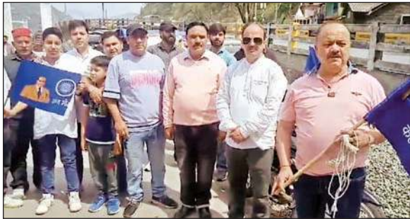
बाइक रैली के दौरान मौजूद प्रतिभागी एवं गणमान्य लोग।

कहा कि विश्व रत्न, ज्ञान के प्रतीक महान निर्माता, शिल्पकार व संविधान रचता डॉ. भीमराव क जयंती भारत एवं पूरा विश्व जहां मना रहा है। इसी कड़ी में चंबा में भी अंबेडकर मिशन सोसायटी द्वारा विभिन्न कार्यक्रमों का आयोजन उनकी यादगार के रूप में किया जा रहा है। जिसमें सर्वप्रथम मिशन द्वारा बाइकों के माध्यम से एक जागरूकता रैली आयोजित कर आपसी भाईचारे का संदेश दिया गया। वहीं अंबेडकर सोसायटी धड़ोस