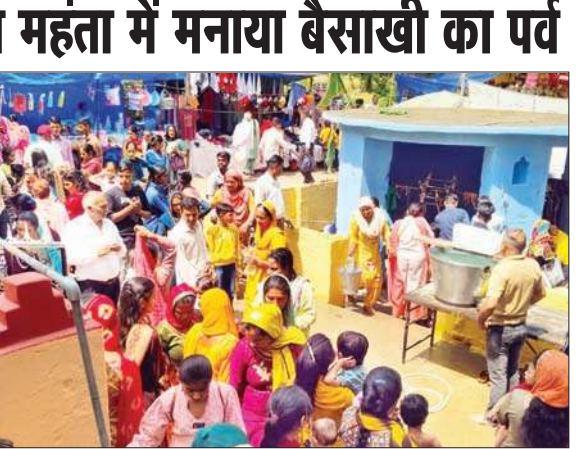
दौलतपुर चौक के नजदीक बेई में खरीददारी करते लोग।