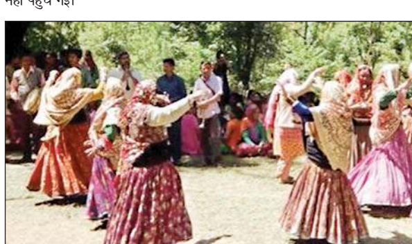
मेले के दौरान महिलाएं नृत्य करती हुई।