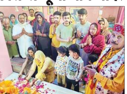
नाग मंदिर में मौजूद श्रद्धालु।

यहां नाग मंदिर में शिवलिंग के साथ अनामक करीब 5 फुट लंबे नागराज प्रकट होकर वहां मौजूद भक्तों को दर्शन देने लगे। बाहर से भी श्रद्धालु मौके पर पहुंच गए और नागराज के जयकारों से पूरा दरबार गूंज उठा। (अनंत ज्ञान)