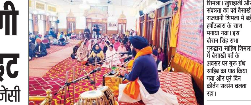
शिमला। सुशहली और संपन्नता का पर्व बैसाखी राजधानी शिमला में बड़े हर्षोउल्लास के साथ मनाया गया। इस दौरान सिंह सभा गुरुद्वारा साहिब शिमला में बैसाखी पर्व के अवसर पर गुरु ग्रंथ साहिब का पाठ किया गया और पूरे दिन कीर्तन सस्त्रंग चलता रहा।

शिमला। राष्ट्रपति द्रौपदी मुर्मू गर्मियों के दौरान में शिमला दौरे पर आएंगी। उनका यह दौरा 30 अप्रैल से पांच मई तक का बन रहा है। इस लिए अधिकारियों ने लोकल प्रशासन के साथ मिलकर द्रौपदी मुर्मू के दौरे को लेकर जरूरी दिशा-निर्देश दिए। इसमें जिला बोर्ड, स्वास्थ्य, जल शक्ति, पुलिस इत्यादि विभागों के अधिकारी मौजूद रहे। इन्हें राष्ट्रपति के दौरे को देखते हुए सभी तैयारियां 15 अप्रैल तक पूरी करने के निर्देश दिए।