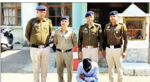
पुलिस की गिरफ्त में एक लाख की घड़ी चोरी का आरोपी।