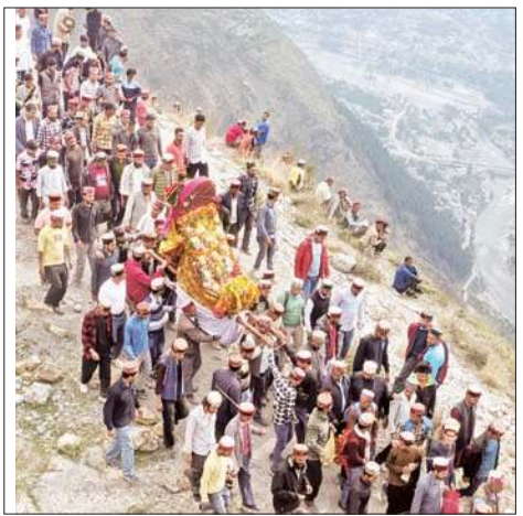
बैसाख संक्रांति पर विरशू मेले के आगाज पर बिजली महादेव के रथ को नीचे उतारते श्रद्धालु।

अनंत ज्ञान ब्यूरो, भुंजर जिला में बैसाख संक्रांति शुरू होते ही कई गांवों में विरशू मेले का आगाज हो गया है। इसी कड़ी में कुल्लू के आराध्य देवता देवों के देव बिजली महादेव लाव-लशकर के साथ शनिवार को सौ की पहाड़ी से नीचे उतरकर जिया गांव पहुंचे। पहाड़ी में सीधी उतराई और उबड़ खाबड़ रास्ता होने के कारण यहां पर चलना भी मुश्किल होता है। इसलिए देवता को रस्से के सहारे जिया गांव तक लाया गया। जिया गांव में बिजली महादेव के पहुंचते ही तीन दिवसीय विरशू मेले का आगाज हो गया है। देवता के कार करिंदों, देवतुओं व श्रद्धालुओं ने बड़े-बड़े रस्सों के साथ पहाड़ी से बिजली महादेव के रथ को नीचे उतारा। जिया में पहुंचने पर पुरानी देव परंपरा का निर्वहन करते हुए गांव के बच्चों और महादेव के बीच लुका-छुपी का खेल शुरू हुआ। बिजली महादेव के आने से पहले ही गांव के बच्चे लकड़ी की तलवारों हाथ