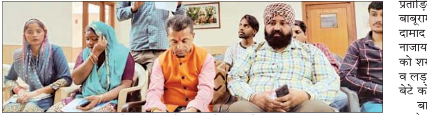
पांवटा साहिब में लोन के नाम पर टगी के मामले में पीड़ित जिनकी जमा-पूंजी पर डाका डल गया है।