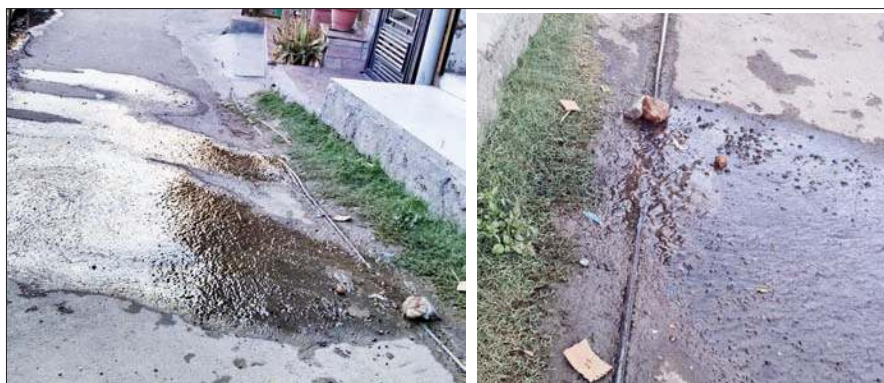
बिलासपुर शहर के कोसरियां वार्ड में जगह-जगह पर टूटी हैं पाइपें, जिससे लोगों को हो रही पानी की किल्लत।