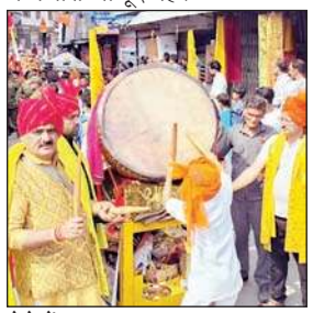
मेलों में टमक बजाता एक बच्चा।