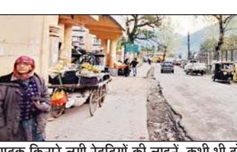
सड़क किनारे लगी रेहड़ियों की लाइन, कभी भी हो सकता है बड़ा हादसा।

सामने यहां पर फुटपाथ और गेट के सामने सड़क किनारे वाहन और रेहड़ी-फड़ी वाले दिन भर कब्जा कर क्यों बैठ जाते हैं। क्यों इन पर कार्रवाई नहीं की जा रही है। लोगों की सुविधा के लिए अस्पताल का यह गेट बिलकुल खाली होना चाहिए। यहां पर मरीजों को रेहड़ी-फड़ी और वाहनों के बीच से होकर गुजरना पड़ता है। वाहन और रेहड़ी-फड़ी वाले बिना अनुमति के यहां पर डेरा डाले होते हैं। हालांकि अस्पताल प्रबंधन ने नगर परिषद कुल्लू को पत्र के माध्यम से रेहड़ी फड़ियों को उठाने का आग्रह किया है। अस्पताल प्रबंधन की माने तो अगर सड़क किनारे लगी रेहड़ी फड़ियां हटाई जाती हैं तो यहां पर एंबुलेंस को आने जाने में आसानी तो होगी। अस्पताल प्रबंधन के मांग पत्र के आधार पर नगर परिषद ने कार्रवाई करते हुए अस्पताल के सामने लगी अवैध दुकानों को हटा दिया था। लेकिन अब यहां पर फिर से अवैध दुकानें सजाई गईं। छह से अधिक रेहड़ी वालों ने यहां पर फिर से अपनी दुकानें सजाई हैं।