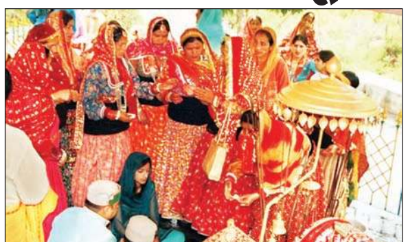
मेले के अंतिम दिन पूजा-अर्चना करते शहरवासी।