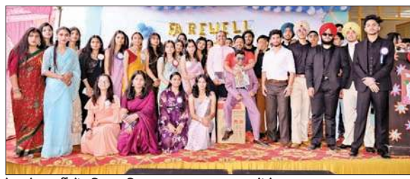
फेयरवेल पार्टी में वशिष्ट पब्लिक स्कूल का स्टाफ छात्रों के साथ।