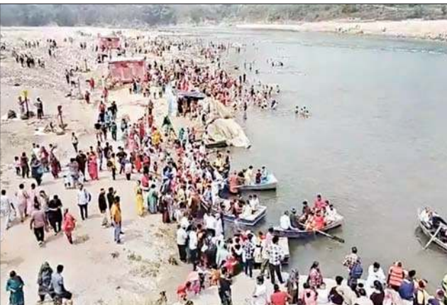
प्रवित्र स्नान सरोवर पजतीर्थ में लगा श्रद्धालुओं का जमघट।

कालेश्वर महादेव में चलने वाले राज्य स्तरीय बैसाखी मेला शनिवार को पूरे यौवन पर रहा। इस दौरान मेला स्थल स्थित ब्यास नदी व प्रवित्र स्नान सरोवर पजतीर्थ में करीब 80 हजार श्रद्धालुओं ने आस्था की डूबकी लगाई। इस दौरान यहां रिकॉर्ड तोड़ भीड़ देखी गई और श्रद्धालुओं की सुख्खा के लिए एनडीआरएफ की गोताखोर टीम और सुरक्षा कर्मी भी तैनात रहे। मेला स्थल में