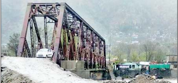
पतलीकूहल-नगर रोड, जोकि बाढ़ के कारण क्षतिग्रस्त हुआ है।