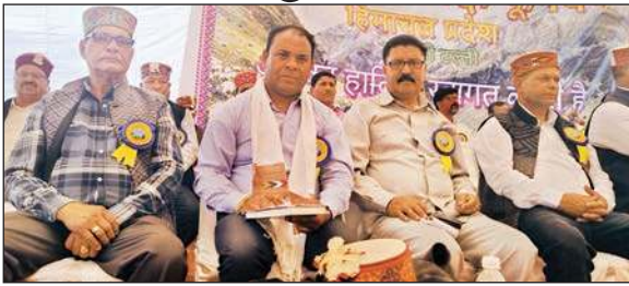
कार्यक्रम के दौरान मौजूद यूनियन के पदाधिकारी और सदस्य।

यूनियन की मांग को बार-बार अनसुना कर दिया है। उन्होंने ऐलान किया कि इस बार उपजातियों से उम्मीदवार विधानसभा के उपचुनावों में उतरने के लिए तैयार हैं।