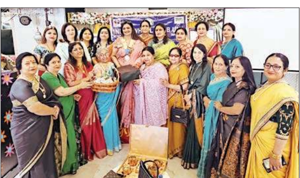
कार्यक्रम के दौरान इन्टर व्हील क्लब ऊना की सदस्य।

इन्टर व्हील क्लब विश्व स्तर पर पीड़ित मानवता की सेवा में जुटा हुआ