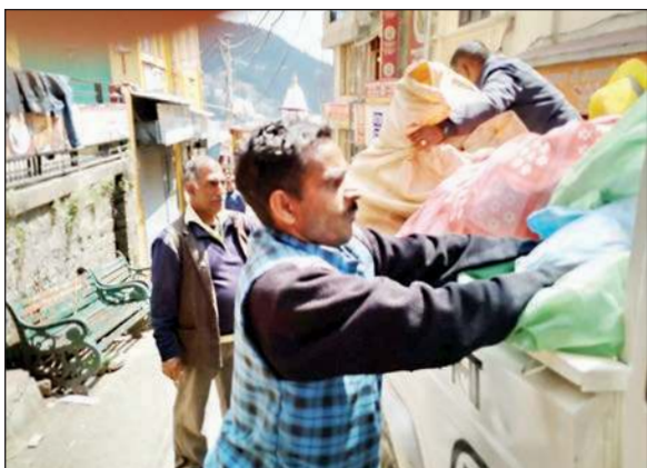
नगर निगम शिमला की टीम तहबाजारियों का सामान जब्त कर गाड़ी में डालते हुए।

राष्ट्रपति दौरे को लेकर तैयारियों जोरों पर