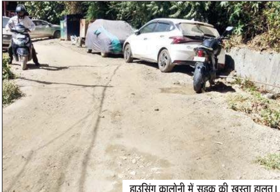
हाउसिंग कालोनी में सड़क की खस्ता हालत।

कालोनी में अक्सर बाहरी वाहन घरों के गेट के सामने पार्क किए जाने से मकान मालिकों को अपने वाहन गैराज से बाहर निकलना मुश्किल हो गए हैं। इससे लोगों के आपसी विवाद भी बढ़ रहे हैं। रोड साइड पार्किंग से कालोनी में किसी भी आपात स्थिति में एंबुलेंस, फायरब्रिगडे और कूड़ा वाहन निकलना मुश्किल हो गया है। कालोनी के कई हिस्सों में लंबे समय से सड़क किनारे निर्माण सामग्री गिरा रखी है, जबकि यहां