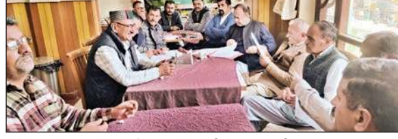
मेले के आयोजन को लेकर बैठक करते कमेटी के पदाधिकारी।