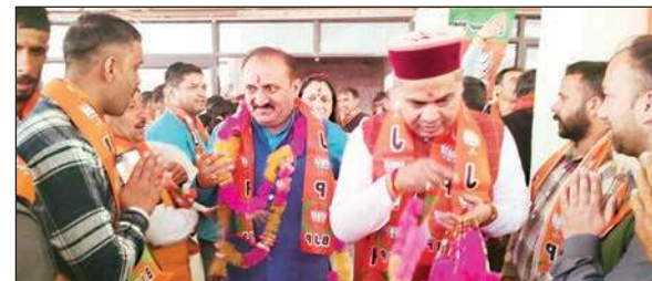
शिलाई पहुंचने पर भाजपा के हिमाचल लोकसभा चुनाव प्रभारी श्रीकांत का स्वागत करते कार्यकर्ता।

बैठक में आगामी लोकसभा चुनाव से संबंधित विशेष रूप रेखा तैयार की गई। बैठक में प्रदेश प्रभारी श्रीकांत शर्मा ने प्रदेश, जिला, मंडल के सभी कार्यकर्ताओं से आह्वान किया कि आगामी लोकसभा चुनाव के लिए जुट जाएं और मोदी सरकार की ओर से चलाई गई विभिन्न योजनाओं से लाभार्थियों से मिलकर उससे भाजपा के पक्ष मतदान करने