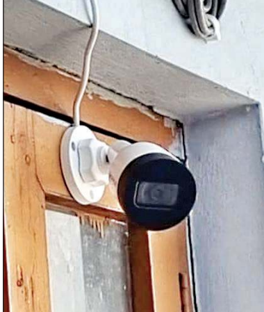
श्री माता बज्रेश्वरी देवी मंदिर कांगड़ा में सुरक्षा की दृष्टि से पिछले द्वार पर लगाया गया सीसीटीवी कैमरा।

इसके बाद जिला आपदा प्रबंधन प्राधिकरण कांगड़ा ने पांच अप्रैल को एसडीआरएफ कांगड़ा को लापता व्यक्ति के लिए खोज अभियान शुरू करने के लिए सूचित किया। एसडीआरएफ कांगड़ा की 16 सदस्यों के साथ पुलिस के तीन जवानों तथा स्थानीय पांच गाइड की टीम के साथ सदस्य इसके बाद