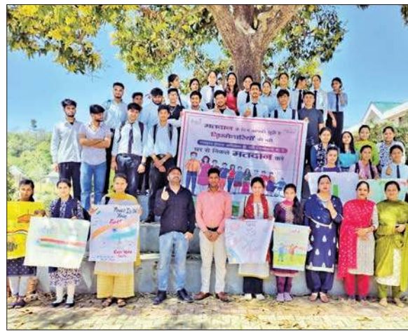
मतदाता जागरूकता अभियान में शामिल छात्र-छात्राएं।