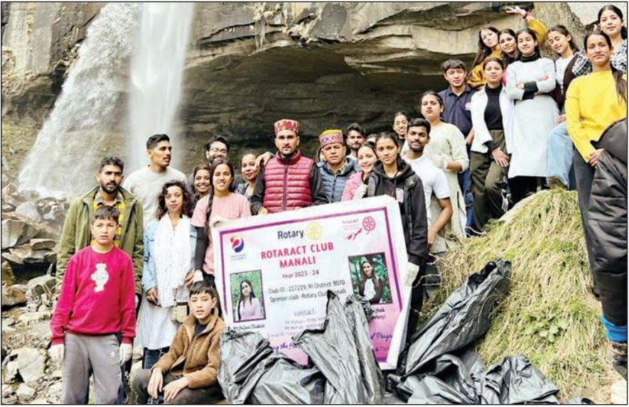
स्वच्छता अभियान के दौरान जोगणी वाटरफाल के पास सभी युवा व अन्य लोग।

रोटेक्ट क्लब मनाली व राष्ट्रीय सेवा योजना हरिपुर कॉलेज के 35 युवाओं ने मनाली के प्रसिद्ध स्थान वशिष्ठ गांव से जोगणी वाटरफाल तक स्वच्छता अभियान चलाया, बता दें कि इससे पहले इन सभी युवाओं ने मनाली क्षेत्र में 3000 किलो से अधिक कूड़ा एकत्रित कर मिसाल कायम की थी, जिस की क्षेत्र वासियों व अधिकारियों ने सहराना की थी।