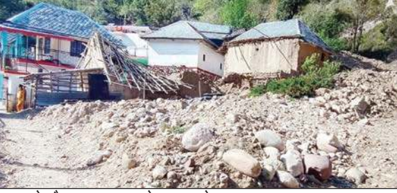
बरसात के दौरान हुए भूस्खलन के कारण टूटे मकान