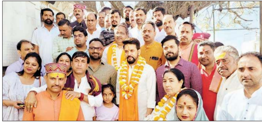
नयनादेवी मंदिर में भाजपा कार्यकर्ताओं के साथ केंद्रीय मंत्री अनुराग ठाकुर।

मौके पर अनुराग ठाकुर ने कहा की हिमाचल प्रदेश में तो बीजेपी चारों सीट जीतेगी। लेकिन पंजाब में भी भाजपा इस बार बढ़िया प्रदर्शन करने वाली है क्योंकि वहां पर आम आदमी पार्टी का पलायन लगातार जारी है। उन्होंने कहा कि बड़े-बड़े मंत्रियों को वह चुनाव में उतरना चाहिए रहे हैं लेकिन जिस तरह से आम आदमी पार्टी पर भ्रष्टाचार के आरोप लगे हैं उसे निश्चित तौर पर पंजाब में भी भाजपा इस बार अच्छा प्रदर्शन करेगी। इसके अलावा उन्होंने जहां पर केंद्र की नरेंद्र मोदी सरकार के गुणगान किया। वहीं, उन्होंने कहा कि भाजपा की केंद्र सरकार के नेतृत्व में हर गरीब हर किसान हर वर्ग का फायदा हुआ है और फिर से देश में कमल का फूल खिलने वाला है।