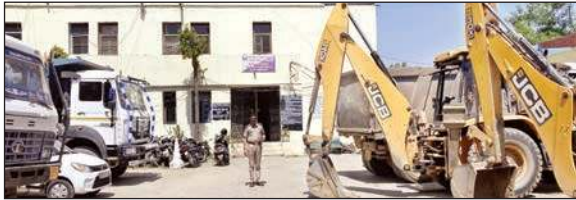
नालागढ़ पुलिस स्टेशन में खड़े जल अवैध माइनिंग करती मशीन व टिप्पर।