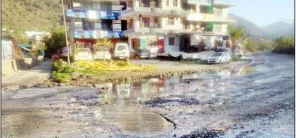
राष्ट्रीय राजमार्ग पतलीकूहल-कटराई के बीच सड़क में पड़े गड्ढे।

राष्ट्रीय राजमार्ग पतलीकूहल और कटराई के बीच सड़क की हालत खस्ता है।