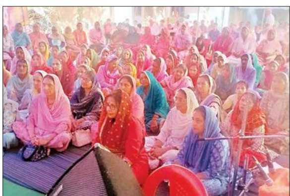
बागड़ महादेव में श्रीमद्भागवत कथा के दौरान मौजूद श्रद्धालु।