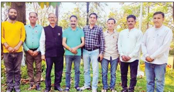
परिधि गृह बिलासपुर में आपात बैठक करते जना पत्रकार संघ के सदस्य।

इसे किसी भी लिहाज से जांच नहीं उठराया जा सकता। उन्होंने कहा कि आनी के पत्रकार अपना काम कर रहे थे, लेकिन पोल खुलने के डर से पुलिस ने पत्रकारों को पहले धमकाया और फिर डराया था। लेकिन जब पत्रकार अपनी बात पर अड़े रहे तो पुलिस ने बल का प्रयोग किया। उन्होंने कहा कि पत्रकारों के शरीर पर जख्मों के निशान खुद बयान कर रहे हैं कि पुलिस ने उन्हें पेशेवर मुजरिम की तरह पीटा है। उन्हें कहा कि सभ्य समाज में इस घटना की जितनी निंदा की जाए कम है।