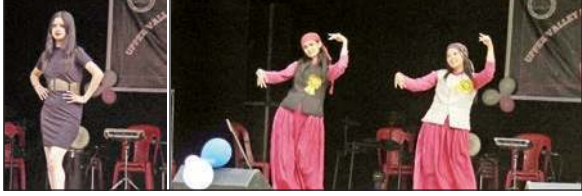
अपर वैली छात्र संघ के वार्षिक समारोह के दौरान प्रस्तुति देती कॉलेज की छात्राएं।