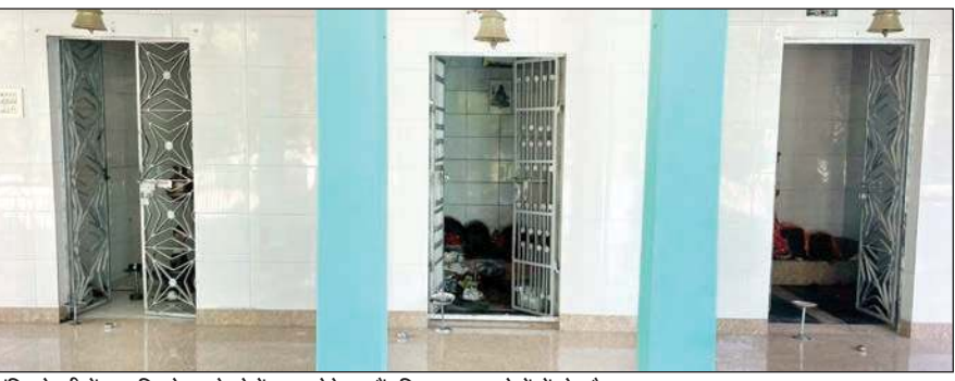
मंदिर के तीनों द्वार जिनके ताले चोरों द्वारा तोड़े गए हैं, जिस कारण लोगों में रोष है।

पहुंचकर जांच शुरू कर दी। वहीं साथ लगती पंचायत में स्थित देव के मंदिर में भी चोरों ने ताले तोड़कर वहां से नकदी पर हाथ साफ कर लिया।