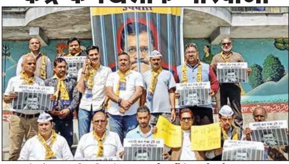
उपवास के दौरान सामूहिक चित्र में आम आदमी पार्टी के कार्यकर्ता।