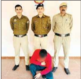
कटराई में रिहायशी मकान से 10 लीटर अवैध शराब बरामद

पुलिस थाना भुंतर व कुल्लू में मादक पदार्थ अधिनियम के तहत दो मामले दर्ज हुए हैं, जिनमें पहले मामले में पुलिस थाना भुंतर की टीम ने बगीचे में गश्त के दौरान गुप्त सूचना के आधार पर एक दुकान की नियमानुसार तलाशी ली।