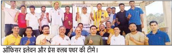
ऑफिसर इलेवन और प्रेस क्लब पधर की टीमें।