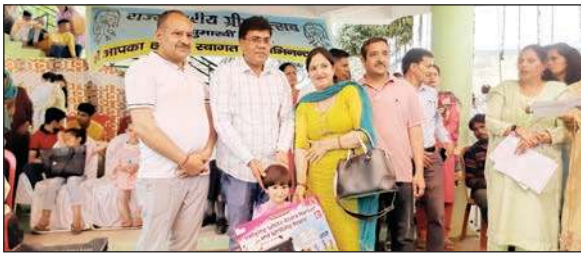
बेबी शो के विजेता बच्चों को सम्मानित करते मेला कमेटी के सदस्य।