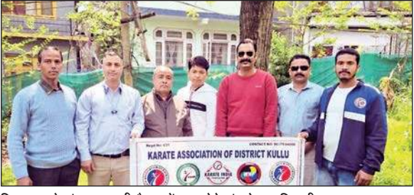
जिला कराटे संघ कुल्लू की बैठक में भाग लेने संघ के पदाधिकारी।