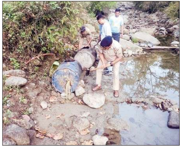
ब्यास गांव के साथ लगते नाले में कच्ची शराब नष्ट करती पुलिस।