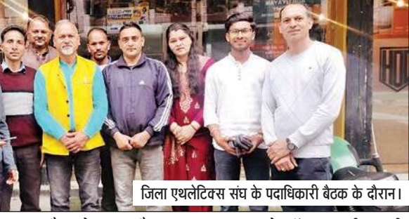
जिला एथलेटिक्स संघ के पदाधिकारी बैठक के दौरान।