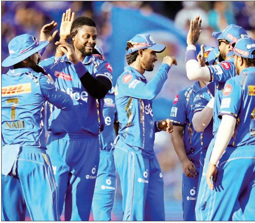
डेविड वार्नर का विकेट लेने के बाद रोमारियो शेफर्ड को बधाई देते मुंबई इंडियंस के खिलाड़ी।

दिल्ली के लिए पृथ्वी शां और अभिषेक पोयल ने दूसरे विकेट के लिए 88 रन की साझेदारी करके दिल्ली को शुरुआती झटके से उबार। ट्रिस्टन स्टुब्स ने 27 गेंद पर तीन चौकों और सात छक्कों की मदद से 71 रन की तूफानी पारी खेली, लेकिन बड़े लक्ष्य के दबाव में अन्य बल्लेबाज नहीं चल पाए।