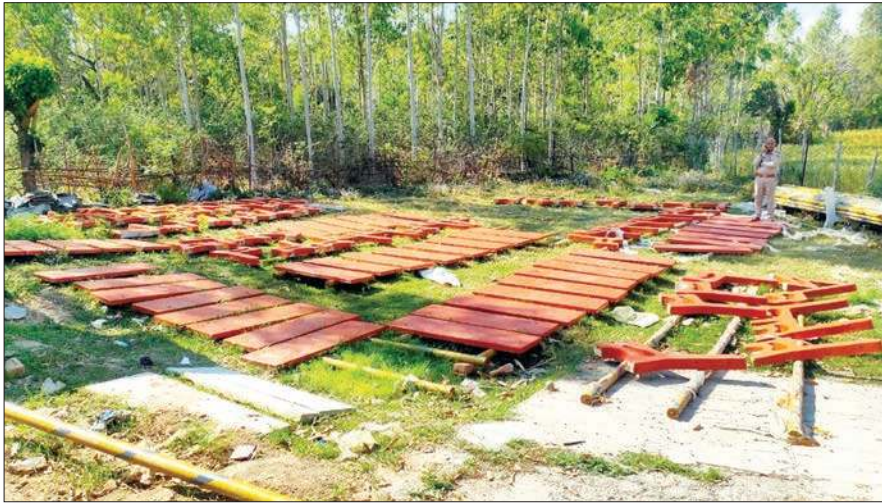
आचार संहिता के उल्लंघन की शिकायत पर कैलाश नगर से सोलर लाइट पोल व जप्त किया गया अन्य सामान।

चुनाव आयोग को निरंतर यह शिकायतें मिल रही थीं कि विधानसभा क्षेत्र गगरेट में आदर्श चुनाव आचार संहिता की धजियां