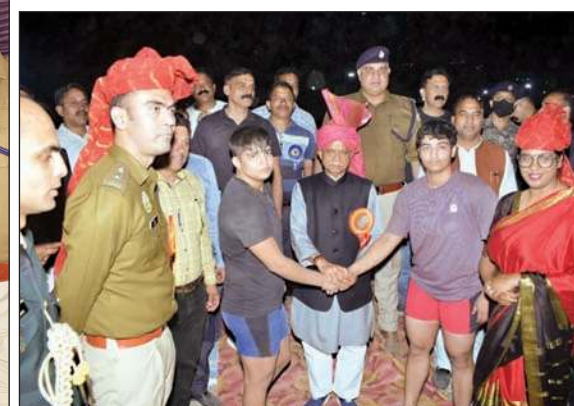
मैदान में छिज की शुरुआत कराते हुए राज्यपाल व अन्य।