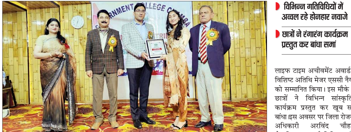
चंबा कॉलेज में वार्षिक समारोह के दौरान एक छात्र को सम्मानित करते मुख्यातिथि उपायुक्त मुकेश रेपसवाल।

राजकीय महाविद्यालय चंबा में शनिवार को 66वें वार्षिक पारितोषिक वितरण समारोह भाग 2 का आयोजन किया गया। इसमें बतौर मुख्यातिथि उपायुक्त चंबा मुकेश रेपसवाल ने शिरकत की। इस अवसर पर मुख्यातिथि ने साल भर के शैक्षणिक, खेलकूद एवं सांस्कृतिक गतिविधियों में उत्कृष्ट प्रदर्शन करने वाले छात्रों को पुरस्कृत किया। मुख्यातिथि ने कहा कि कॉलेज के यह जो 3 साल है यह आपके जीवन के सबसे महत्वपूर्ण हैं। इसी में आपके जीवन की आगली रूपरेखा तय होती है। यदि इस समय का सदुपयोग किया जाए तो आप किसी भी लक्ष्य तक पहुंच सकते हैं। अपने जीवन को सफल बनाने के लिए आपको पूर्ण लगन से कार्य करना। आज सफल होने के लिए बहुत सारे क्षेत्र हैं