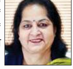
उषा शर्मा, मेयर, नगर निगम सोलन।

निगम पुनरी दर से 4 अगस्त 2023 तक 125 दिन यानी 4 महीने का टैक्स वसूल कर चुकी है। यह व्यवस्था इसलिए की गई है, क्योंकि सरकार ने 4 अगस्त से 2023 से नए प्रॉपर्टी टैक्स को लागू करने की अधिसूचना जारी की थी। निगम के मुताबिक शहर में 30 से 40 फीसदी से अधिक भवन ऐसे हैं, जिसमें एनओसी के बाद निर्माण किया गया है, लेकिन इस का टैक्स जमा नहीं किया जा रहा है। नगर निगम ने प्रस्ताव पारित कर अगस्त 2023 नई दरों के मुताबिक प्रॉपर्टी टैक्स निर्धारण का निर्णय लिया है। इसके लिए भवनों की ड्रोन तकनीक से मैपिंग की गई है। इसके बाद नक्शे से अधिक या अतिरिक्त कर बने भवनों की मैनुअल मैपिंग के बाद नई दरों से भवनों का प्रॉपर्टी टैक्स निर्धारित किया जाएगा।