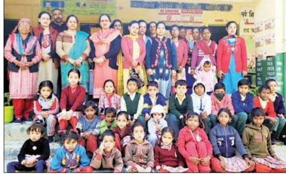
प्रार्थमिक स्कूल पावर हाउस में आयोजित निगुण मेले में हिस्सा लेते बच्चे।