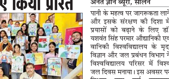
शूलिनी विवि में विश्व जल दिवस पर आयोजित कार्यक्रम में हिस्सा लेते छात्र।