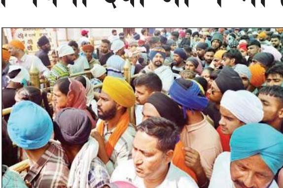
माता श्री नयना देवी जी के दर्शन के लिए लाइन में खड़े श्रद्धालु।

पंजाब के श्री आनंदपुर साहिब में शुरू हुए होला मोहल्ला मेले के दौरान शक्तिपीठ श्री नयना देवी जी में भी काफी संख्या में श्रद्धालु पहुंच रहे हैं। मेले के दौरान मंदिर में भी भारी संख्या में भीड़ देखी जा रही है। जिसके चलते मंदिर प्रशासन और पुलिस प्रशासन की ओर से व्यवस्थाओं को लेकर काफी प्रबंध किए हुए हैं। जानकारी के अनुसार अभी तक होला मोहल्ला 3 दिन तक आयोजित किया जाएगा। पंजाब, हरियाणा, दिल्ली से काफी संख्या में सिख