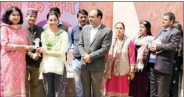
विजेताओं को सम्मानित करते हुए डीसी कुल्लू।