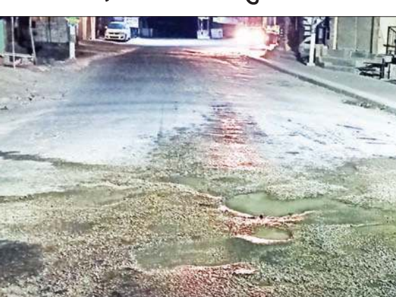
पानी की पाइपलाइन की लीकेज से सड़क पर बने गड्ढे।

विडंबना यह है पिछले तकरीबन एक साल से न ही नेशनल हाईवे अथॉरिटी ने इनकी मरम्मत की कोई जहमत उठाई और न ही जिस जल शक्ति विभाग को इन पाइपलाइन को दुरुस्त करने की सूची है। सड़क पर अचानक जब गड्ढा आ जाता है, तो वाहन को काबू करना इतना आसान भी नहीं रहता। यही स्थिति