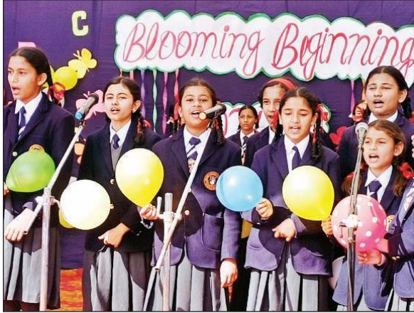
कार्यक्रम के दौरान माउंट कॉर्मल स्कूल में अपनी प्रस्तुतियां देते छात्र