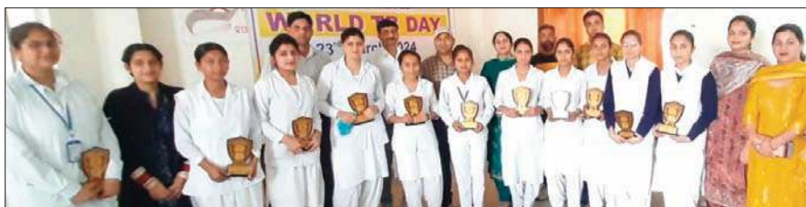
विश्व टीबी रोग दिवस के उपलक्ष्य पर जिला स्तरीय कार्यक्रम में हिस्सा लेने वाले प्रतिभागी।