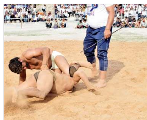
छिज मुकाबले के दौरान जोर अजमाइस करते पहलवान।