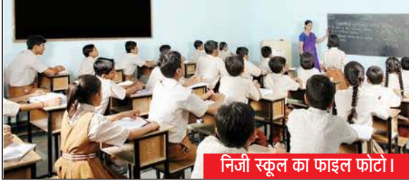
निजी स्कूल का फाइल फोटो।

रहा है। जबकि विभाग व प्रशासन मुकदशक बना हुआ है। हालांकि नियमानुसार कोई भी निजी स्कूल संचालक स्कूलों में किताबें-कॉपियां-टाई-बेल्ट-बैज नहीं बेच सकता है, परंतु निजी स्कूल संचालक स्प्रेआम बेच रहे हैं। स्कूल संचालकों द्वारा बोर्ड की किताबें लगाने की बजाए मोटी कमीशन के चक्कर में निजी पब्लिशर की किताबें बच्चों को लगाई जा रही हैं। अधिकतर निजी स्कूल संचालकों द्वारा प्राइवेट वाहन हायर करके बच्चों की सुरक्षा को रामभरोसे छोड़कर स्कूल लाने में प्रयोग किया जा रहा है। बुद्धिजीवियों ने कहा कि आखिरकार स्कूल संचालक नियमों को दरकिनार क्यों कर रहे हैं। इन