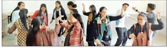
ग्रीन हिल्स इंजीनियरिंग कॉलेज में होली के रंगों में रंगे छात्र नाटी डालते हुए।