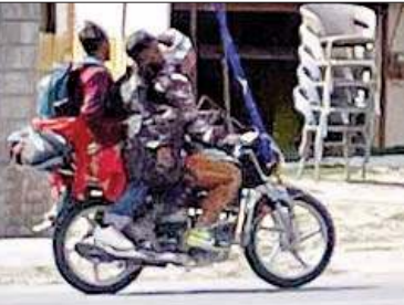
बाइक पर ट्रिपलिंग करते बाहरी क्षेत्रों से आ रहे पर्यटक।

मैदानी क्षेत्रों में गर्मियों के चलते लोग टंड की तलाश में मनाली का रुख कर रहे हैं। इन लोगों में बहुत से लोग मोटर साइकिल पर कुल्लू-मनाली का रुख कर रहे हैं। मोटरसाइकिल पर मनाली आने वाले अधिकतर पर्यटक पंजाब के होते हैं।