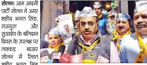
सोलन में शहीदों को श्रद्धांजलि देने के बाद 'आप' के नेता।