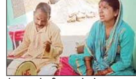
चैत्र मास के गीत सुनाते लोग।