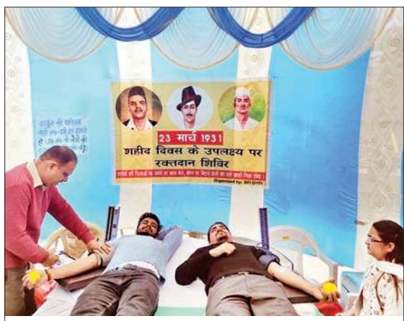
भारत की जनवादी नौजवान सभा, स्टूडेंट्स फेडरेशन ऑफ इंडिया ने रक्तदान शिविर आयोजित किया गया।

सोलन । भारत की जनवादी नौजवान सभा, स्टूडेंट्स फेडरेशन ऑफ इंडिया अरिखल भारतीय जनवादी महिला समिति और अरिखल भारतीय अरिखल युवियन के द्वारा साड़ा तौर पर पुराना जिलाधीश कार्यालय सोलन के प्रांगण में रक्तदान शिविर का आयोजन करवाया गया। इस रक्तदान शिविर का आयोजन 23 मार्च, 1931 को देश की आजादी के लिए अपनी जान कुर्बान करने वाले शहीद-ए-आजम भगत सिंह, सुखदेव व राजगुरु की याद में उनके शहीदी दिवस के उपलक्ष्य पर आयोजित करवाया गया। इस रक्तदान शिविर के माध्यम से नौजवानों से यह अपील की गई कि वे इन अमर शहीदों के सपनों का दूर होकर देश में मानवता व सांप्रदायिकता को बढ़ाने के लिए एकजुटता दिखाते हुए एक बेहतर देश व समाज बनाने में अपना योगदान दें। इस रक्तदान शिविर में लोगों ने बड़-चढ़कर भाग लिया व रक्तदान किया। इस मौके पर लगभग 50 यूनिट रक्त इकट्ठा किया गया।