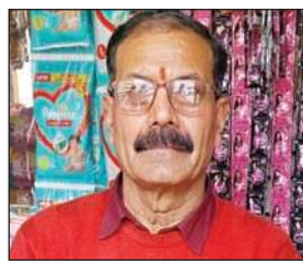
शहर के एक पान विक्रेता।