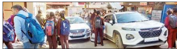
सड़क पर खड़े वाहनों के कारण परेशान होते स्कूली छात्र।

स्कूली बच्चों के साथ सड़क हादसा होने का खतरा बना रहता है। ऑकलैंड स्कूल के पास रोजाना गाड़ियां सड़क किनारे लगी होती हैं, यहां पहले ही सिगल रोड है ऐसे में वाहनों का निकल मुश्किल होता है