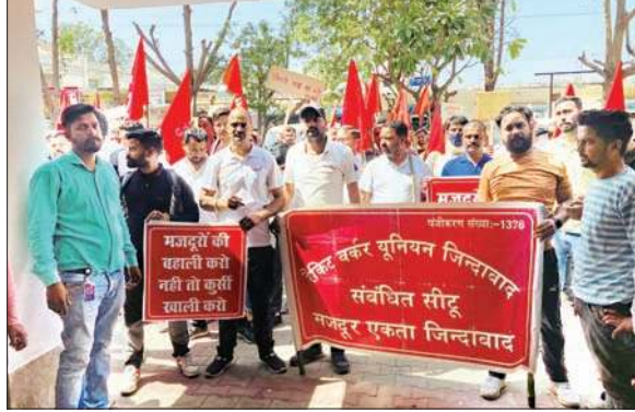
शनिवार को एसडीएम कार्यालय के बाहर धरना-प्रदर्शन करते कामगार व अन्य।