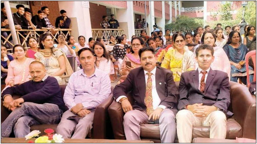
कार्यक्रम के दौरान छात्रों की प्रस्तुतियों का आनंद उठाते मुख्यातिथि व अन्य गणमान्य।