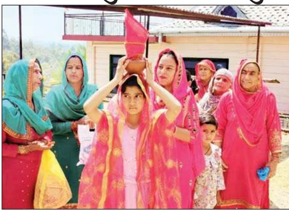
कलशा यात्रा में भाग लेती महिलाएं।