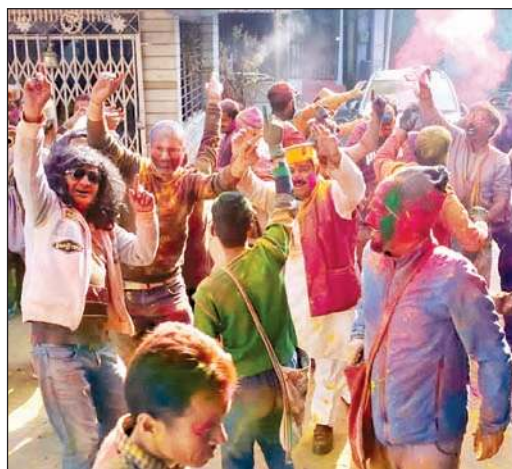
लोगों को होली की बधाई देने के साथ एक दूसरे को होली लगाते हैं और साथ में होली के पारंपरिक गीत गाकर खूब मस्ती करते हैं। उन्होंने बताया कि इसी कड़ी में शनिवार को पहले दिन उन्होंने शहर के कुछ क्षेत्रों में जाकर छोटी होली का आनंद लिया और अब रविवार को बड़ी होली भी धूमधाम से मनाएंगे।