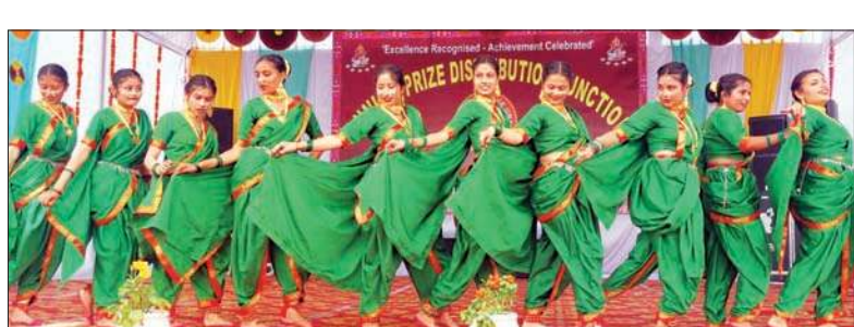
रंगारंग सांस्कृतिक कार्यक्रम प्रस्तुत करती छात्राएं।