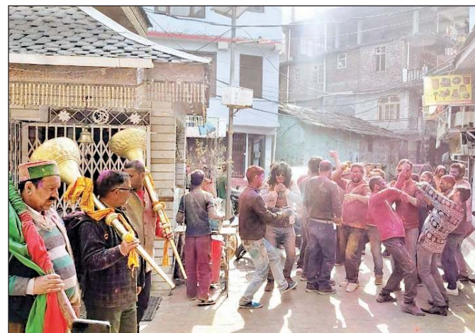
रघुनाथजी की नगरी कुल्लू में दो दिन पूर्व ही छोटी होली के मौके पर गुलाल उड़ाकर होली गीतों और वाद्ययंत्रों की धुन पर झूमते लोग