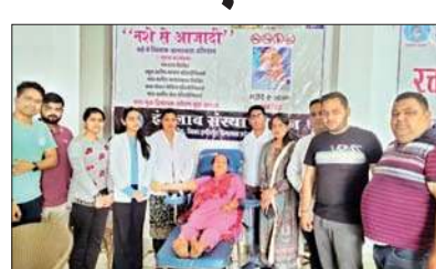
रक्तदान शिविर में रक्तदान करते रक्तदाता।