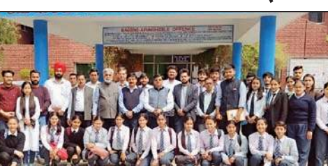
विशेष व्याख्यान के दौरान मौजूद विद्यार्थी व अन्य।