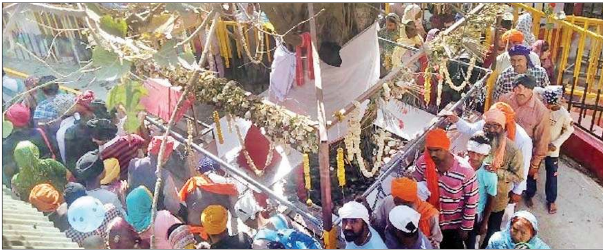
बाबा बड़भाग सिंह मैड़ी के होली मेला के दौरान चरणगंगा में स्थित धुने पर माथा टेकने के लिए कतारों में अपनी बारी का इंतजार करते श्रद्धालु।

चरणगंगा के वारे में मान्यता है कि किसी भी प्रकार की शारीरिक व्याधि का जादू-टोना या भूत-प्रेत से पीड़ित व्यक्ति यहां के पवित्र जल में स्नान कर ले तो उसे छुटकारा मिल जाता है। यहां पर वीर नाहर सिंह का वास माना गया है, जो कि आई हुई संगत की मन्नतें पूरा करते हैं। वीर नाहर सिंहका अर्खंड धूना भी श्रद्धालुओं की आस्था का केंद्र है। लोग चरण गंगा का पवित्र जल अपने घरों को लेकर जाते हैं। इस जल में धूने की विभूति मिलाकर अपने घरों में छिड़काव करते हैं, ताकि उनके घर