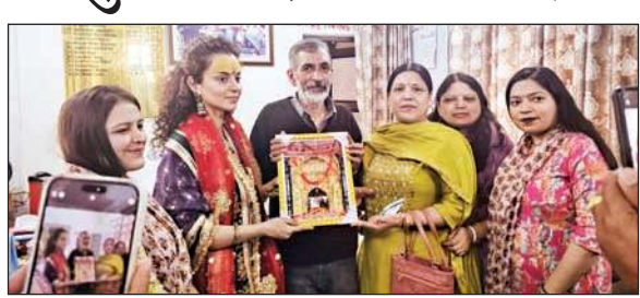
ज्वालामुखी मंदिर में अभिनेत्री कंगना रनौत को सम्मानित करते हुए।