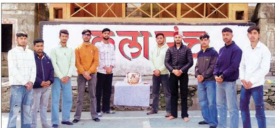
शहीदी दिवस पर शहीदों को श्रद्धांजलि अर्पित करते अखिल भारतीय विद्यार्थी परिषद के कार्यकर्ता।

23 मार्च को देश के लिए लड़ते हुए अपने प्राणों को हंसते-हंसते न्योछावर करने वाले तीन वीर सपूतों की याद में शहीदी दिवस मनाया जाता है। यह दिवस न केवल देश के प्रति सम्मान और हिंदुस्तानी होने का गौरव अनुभव