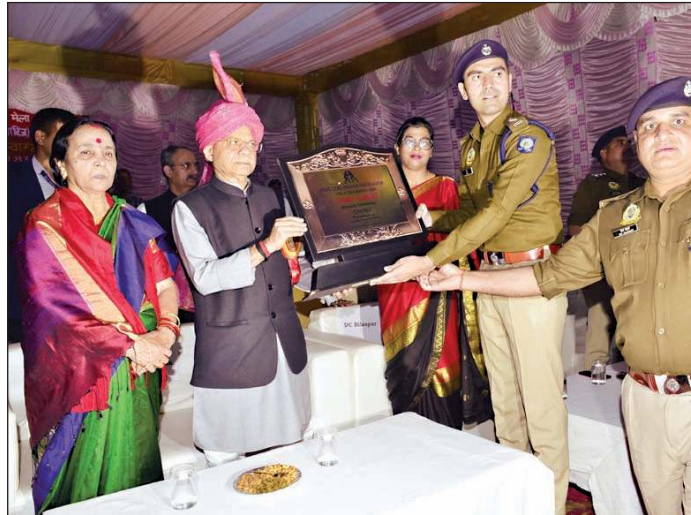
राज्यपाल शिव प्रताप शुक्ल को सम्मानित करते प्रशासनिक व पुलिस अधिकारी।

नलवाड़ी मेले में कई राज्यों से पहलवान बिलासपुर पहुंचे हुए थे, प्रशासन के अनुसार बिलासपुर का नलवाड़ी मेला बेशक पशुओं की खरीद फरोख को लेकर काफी मशहूर है, लेकिन इस बार मेले में खेलों को भी काफी प्रमोट किया गया है। मेले में महिला एवं बाल विकास विभाग द्वारा विभिन्न प्रतियोगिताओं का आयोजन किया गया। इसके तहत रंगोली, मेहंदी, लंगड़ी टांग, रस्सा कस्सी, मटका फोड़ व म्युजिकल चेर आदि प्रतियोगिताएं शामिल रहीं। इस कार्यक्रम में महिला मंडलों, आंगनवाड़ी केंद्रों, स्वयं सहायता समूहों की करीब 100 महिलाओं ने भाग लिया।