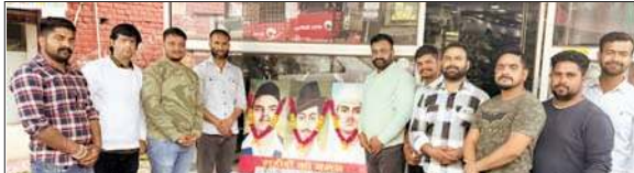
शहीदों को श्रद्धांजलि देते युवा।