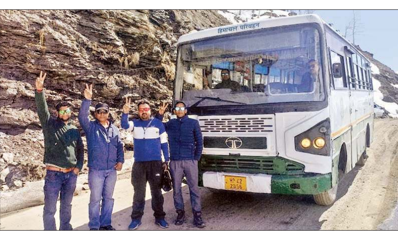
कुल्लू केलांग रूट पर बस ट्रायल के लिए निकली बस का ट्रायल सफल होने पर खुशी जाहिर करते हुए।

अनंत ज्ञान ब्यूरो, केलांग आखिर 54 दिनों के बाद कुल्लू से लाहुल घाटी के लिए बस सेवा फिर शुरू हो जाएगी। 30 जनवरी से बर्फबारी के कारण बंद हुए इस रूट पर शनिवार को निगम की बस सेवा का ट्रायल किया गया जोकि सफल रहा है, जिसके चलते अब रविवार से इस रूट पर अब बस दौड़ेगी। गौर रहे कि हिमाचल पथ परिवहन निगम के केलांग क्षेत्र द्वारा वर्ष 2019 में रोहतांग अटल टनल निर्माण के उपरान्त पहली बार मार्च माह में जनजातीय क्षेत्र लाहौल स्पीति के मुख्यालय केलांग के लिए बस सेवा की शुरुआत शनिवार को ट्रायल के बाद रविवार से कर दी जाएगी। इस मार्ग पर पहले भी लगातार दो दिन से ट्रायल किया गया था जो सफल नहीं रहा।