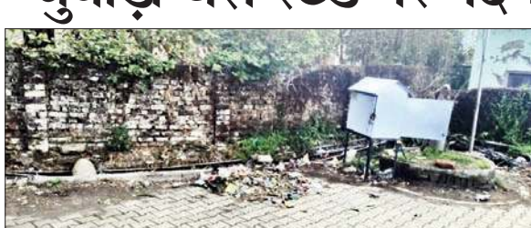
चुवाड़ी बस स्टैंड पर लगा गंदगी का ढेर, इससे लोगों को परेशानी हो रही है।

पड़ी है। उधर बस अड्डे पर नियुक्त सफाई कर्मचारियों से बात की तो उन्होंने अपना पक्ष झाड़ते हुए कहा कि हम सफाई करते हैं।