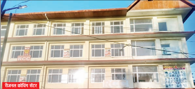
रीजनल कोचिंग सेंटर

मार्च 1995 में धर्मशाला में रीजनल कोचिंग सेंटर (आरसीसी) की शुरुआत