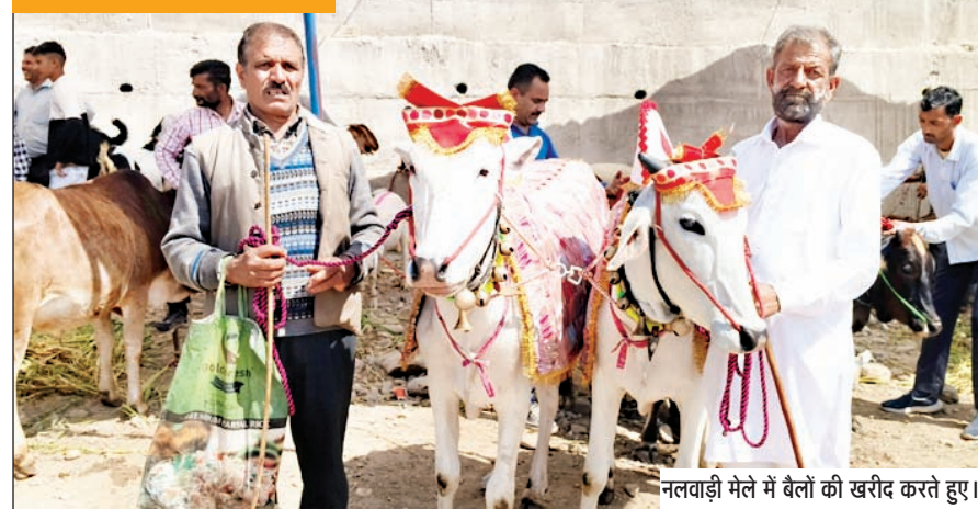
नलवाड़ी मेले में बैलों की खरीद करते हुए।