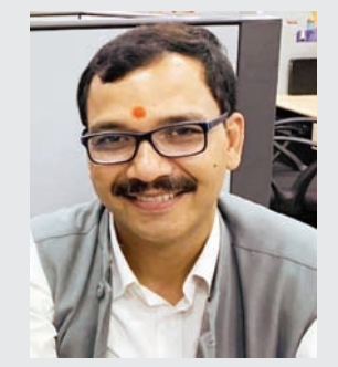
लेखक : डॉ. मयंक चतुर्वेदी हिंदुस्थान समाचार

करती है कि बंधुत्व भाव से युक्त, कर्तव्यनिष्ठ, मूल्याधारित और सामाजिक न्याय की सुनिश्चितता करने वाले समर्थ भारत का निर्माण करें। इस संपूर्ण प्रस्ताव का जो निष्कर्ष निकलता है, वह है भारत में सभी वर्ग, समुदायों, मत, पंथ, विचारधाराओं के बीच के परस्पर वैमनस्य और भेदों को समाप्त करते हुए समरसता से युक्त पुरुषार्थी समाज खड़ा कर देना, ताकि भविष्य का भारत, श्रीराम के आदर्शों की स्थापित करते हुए विश्व कल्याण को धरातल पर उतार पाए। अब आप ही