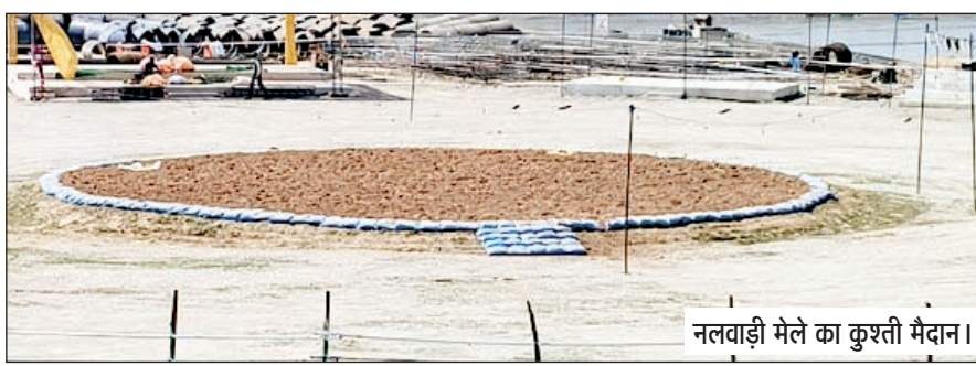
नलवाड़ी मेले का कुश्ती मैदान।

प्रतिदिन कुश्ती का आयोजन शाम 5:30 तक किया जाएगा। वहीं, मेले के समापन पर 23 मार्च को मेले की अंतिम कुश्ती आयोजित की जाएगी, जिसमें प्रथम विजेता को एक लाख एक हजार रुपए नकद व गुर्ज इनाम