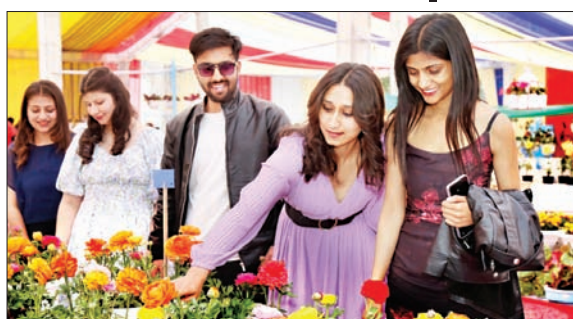
शूलिनी विवि में पलावर फेस्ट का आयोजन किया गया।