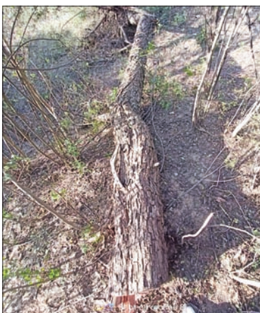
वन काटुओं द्वारा जंगल में काटा गया पेड़

जानकारी के अनुसार गगरेट के जंगल इन दिनों वन काटुओं के निशाने पर हैं। सरकारी भूमि पर लगे खैर के पेड़ों की शिनाख्त कर वन काटू इसे रात के अंदरे में काट ले जा रहे हैं। रविवार रात्रि अंबोटा बीट के वन रक्षक इलाके में गश्त पर थे तो उन्हें एक स्थान पर वन काटुओं के होने