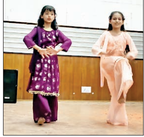
ऑडिशन देते कलाकार।

हमीरपुर। राष्ट्र स्तरीय होली उत्सव सुजानपुर में 23 मार्च से शुरू होने जा रहा है।