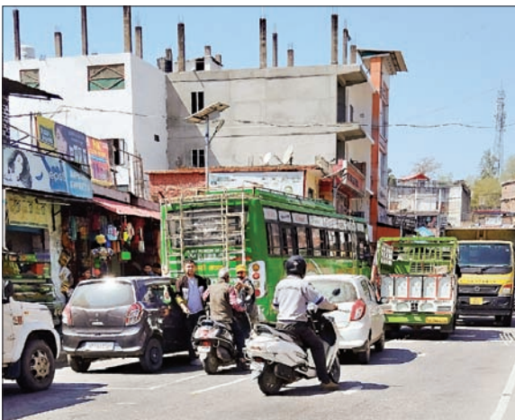
बंगाणा में यातायात जाम में फंसे वाहन।

बंगाणा बाजार में जाम का एक और मुख्य कारण है एक स्थायी बस अड्डा न होना। जब भी बड़ा जाम लगता है तो इन्हीं बसों के कारण लगता है, क्योंकि बसों के खड़े होने का उचित स्थान नहीं है और जो स्थान निर्धारित किया है उस जगह बसों अधिकतर बीच सड़क में ही खड़ी हो जाती हैं और समय से पूर्व खड़ी होकर जाम की मुख्य वजह बनती हैं। चैत्र मास के मेले शुरू