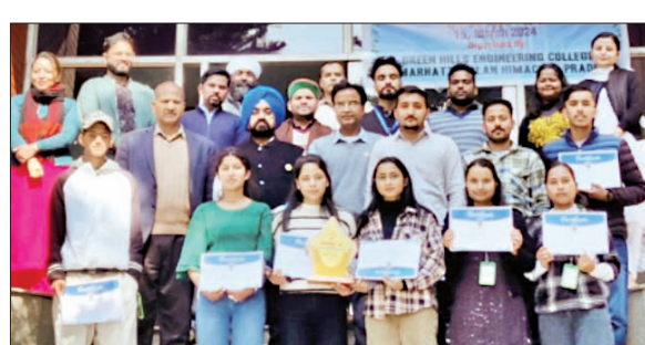
नाटी प्रतियोगिता में रनरअप रहे ग्रीन हिल्स इंजीनियरिंग कॉलेज के छात्र।