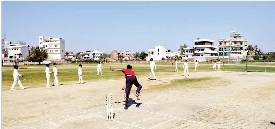
ऊना के इंदिरा स्टेडियम में ट्रायल देते खिलाड़ी