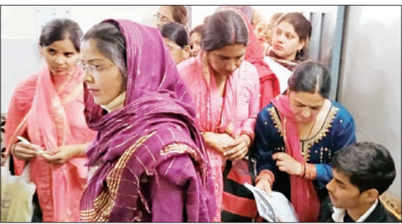
तहसील कल्याण विभाग में फॉर्म जमा करवाने के लिए जुटी महिलाओं की भीड़।

फायदा अभी महिलाओं को मिलता नहीं दिख रहा है, क्योंकि सरकार द्वारा इस योजना के लिए बजट जारी नहीं किया गया है और न ही आने वाले दो महीनों में इस योजना के लिए कुछ जारी किया जा सकेगा। गौर रहे कि इस योजना के तहत हमीरपुर जिला में अभी तक 3685 फॉर्म महिलाओं ने जमा करवा दिए हैं। फॉर्म में पहले पूर्व प्रधानमंत्री स्व. इंदिरा गांधी और मुख्यमंत्री सुखदेव सिंह सुखू का चित्र छपा हुआ था। जिसका विरोध किया जा रहा था। 16 मार्च को इस योजना का फॉर्म भी बदल दिया गया व नया फॉर्म ही तहसील वेलफेयर कार्यालय में लिया जा रहा है। सोमवार को भी जिला