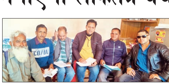
जोगिंद्रनगर में बैठक के दौरान मौजूद किसान सभा के सदस्य।

ने भी भाग लिया। बैठक के दौरान फैसला लिया गया कि संयुक्त किसान मोर्चा के अखिल भारतीय आह्वान पर किसान सभा अन्य जन संगठनों के साथ मिलकर जोगिंद्रनगर में 23 मार्च को भगत सिंह-राजगुरु-सुखदेव शहादत दिवस को धन और बाहुबल के खतरे से लोकतंत्र बचाओ दिवस के रूप में मनाएगी तथा उसके बाद गांव-गांव जन अभियान भी चलाएगी। 20 अप्रैल को भूमि अधिग्रहण के मुद्दे पर मंडी में होने वाली किसान कन्वेंशन में जोगिंद्रनगर के थैना पलौन प्रोजेक्ट के प्रभावित और संभावित फोरलेन