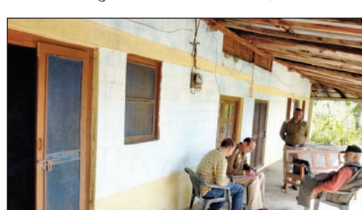
झंडूता के बड़ागांव में पुलिस की टीम मौके पर पहुंच जांच करती हुई।

है, तो पुलिस कैमरों की मदद से आरोपी तक पहुंच सकती है। वहीं, पुलिस का कहना है कि मेले में दर्जनों पुलिस कर्मचारियों की तैनाती गई है, जो समय-समय पर गश्त के रूप में रहेंगे।