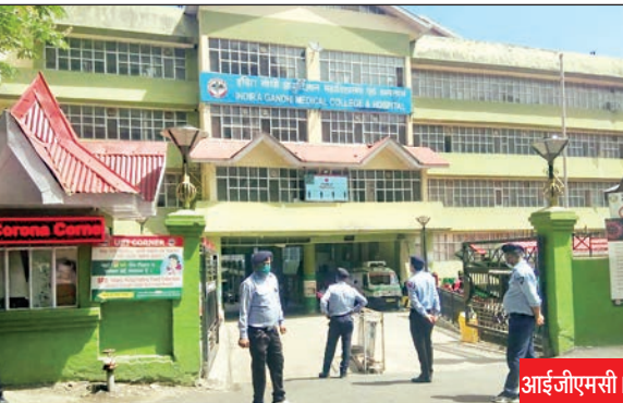
आईजीएमसी में मरीजों को टेस्ट पहले और हिमकेयर का कार्ड बाद में एक्टिवेट हो रहा है।

इन दिनों स्थिति ऐसी बन चुकी है कि जब किसी मरीज को आपातकालीन स्थिति में आपातकालीन वार्ड पहुंचाया जाता है, तो वहां पर सबसे पहले डॉक्टरों द्वारा टेस्ट करवाए जाते हैं। इस दौरान आधे से ज्यादा मरीजों के सैंपल निजी लैब में भेजे जाते हैं। निजी लैब में मंहगे दामों पर टेस्ट होते हैं। अगर हिमकेयर का कार्ड समय से एक्टिवेट होता, तो सारे टेस्ट भी निशुल्क होने थे। प्रशासन ने यह तय किया है कि जब