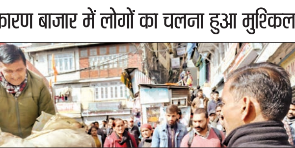
नगर निगम प्रशासन तहबाजारियों का सामान जब्त करते हुए।

मंडल ने आयुक्त को ज्ञापन सौंपा था और इनके खिलाफ कार्रवाई करने की मांग की थी, इसके बाद से हर रविवार को नगर निगम प्रशासन की ओर से इनके खिलाफ कार्रवाई अमल में लाई जाती है। बाजार में कई जगह दुकानदार जरूरत से अधिक बाहर सामान फैला देते हैं और वहीं ओवर हैंगिंग भी करते हैं। कई जगह तहबाजारी सामान की पोतली खोलकर दुकान के आगे बंधे रहते हैं। व्यापारियों और दुकानदारों के ऐसा करने से बाजार की सड़क और तंग हो जाती हैं।