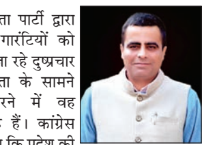
बजट में कारगर योजनाओं को शामिल किया गया है। सरकार ने पशुपालकों व बागवानों की आय बढ़ाने के लिए भी अपनी गारंटियों पर अमल कर देश में पहली बार दूध का समर्थन मूल्य तय किया है, वहीं इस