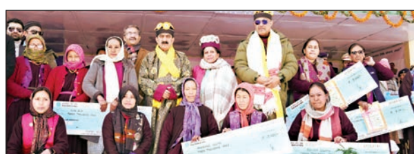
महिलाओं को चेक भेंट कर इंदिरा गांधी सम्मान निधि योजना का शुभारंभ करते सीएम सुक्खू।

सीएम ने केलांग में लाहौल-स्पीति जिले की 18 वर्ष से अधिक आयु की 1123 लाभार्थियों को सम्मान निधि योजना प्रदान की। सीएम ने कहा कि हम जो कहते हैं, वह करते हैं। लाहौल के गेम्पू गांव की छेरिंग डोलमा इंदिरा गांधी महिला सम्मान निधि योजना का लाभ पाने वाली हिमाचल की पहली लाभार्थी बनीं।