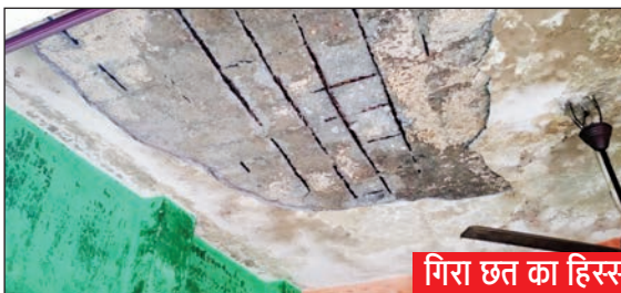
गिरा छत का हिस्सा