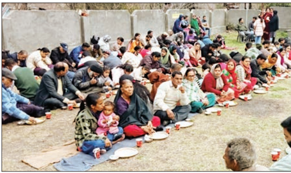
मैहला में आयोजित लंगर में प्रसाद ग्रहण करते श्रद्धालु।

इन्होंने नाम बिना नहीं जीवेया जाए, ऐसी लाल तुड़ बिन कौन करे, तोहि-मोहि मोहि- तोहि अंतर कैसा, बहुत जनम बिछुरे थे माधव, एह जनम तुम्हारे लेखे आदि शब्द गाकर माहौल को भक्तिमय कर दिया। प्रातः आसा दी वार से कार्यक्रम का शुभारंभ हुआ। उसके उपरांत गुरु जस कीर्तन, पाठ का भोग, आरती व अरदास के साथ माहौल भक्तिमय हो गया। गुरु रविदास सभा लकड़ोलू मैहला के प्रधान व कार्यकारिणी सदस्यों ने सभी विशेष अतिथियों को शिरोपा