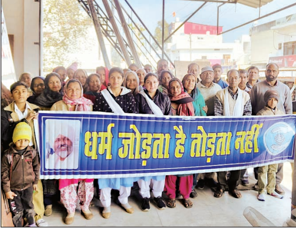
संत निरंकारी संगत पंजावर बाजार में स्वच्छता जागरूकता रैली निकालती हुई।

संत निरंकारी संगत ने बाजार में साफ सफाई की। बाजार में निकलकर लोगों को स्वच्छता का संदेश दिया गया। बता दें कि रविवार को प्रोजेक्ट अमृत के तहत