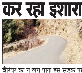
बैरियर का न लग पाना इस सड़क पर हदसों की ओर इशारा करती है। एक वर्ष पूर्व प्रदेश तथा परिवहन निगम से लेकर तांगणू जो पर्यटन की दृष्टि से प्रदेश में महत्वपूर्ण स्थान रखती है उनको जोड़ती है।

युवा विकास मंच पेखा की बैठक पेखा में विधिवत रूप से रविवार को संपन्न हुई, जिसमें सभी सदस्यों ने भाग लिया। बैठक में विशेष मुद्दा सड़क पर कैश बैरियर्स का न लगना रहा। यह सड़क 15 किलोमीटर तक टिककरी से लेकर तांगणू जो पर्यटन की दृष्टि से प्रदेश में महत्वपूर्ण स्थान रखती है उनको जोड़ती है।