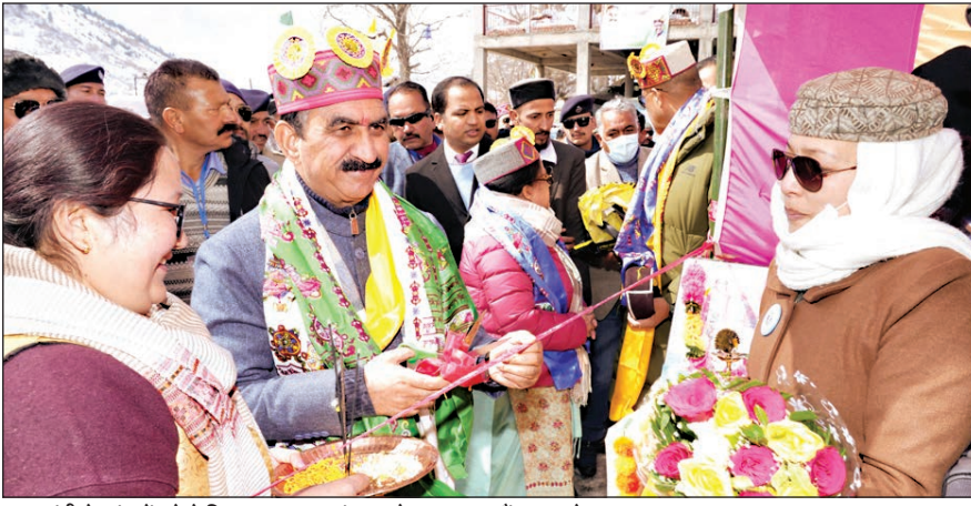
मुख्यमंत्री केलांग में स्नो फेस्टिवल का शुभारंभ करते हुए व साथ ही अन्य लोग।

उन्होंने अपनत्व भरे आतिथ्य सत्कार और आने वाली पीढ़ियों तक सांस्कृतिक विरासत को संरक्षित करने की प्रतिबद्धता के लिए लाहौल-स्पीति के लोगों की सराहना की। आगामी वित्त वर्ष में