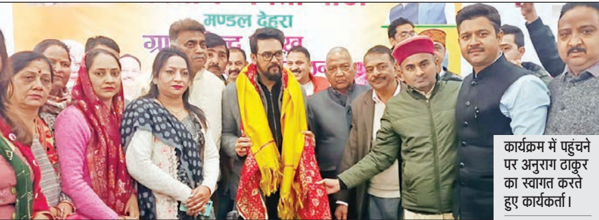
कार्यक्रम में पहुंचने पर अनुराग ठाकुर का स्वागत करते हुए कार्यकर्ता।

अनुराग ठाकुर ने दिल्ली के मुख्यमंत्री अरविंद केजरीवाल पर भी निशाना साधा। उन्होंने कहा कि केजरीवाल का जन्म भ्रष्टाचार का खुलासा करके हुआ है और उन्होंने कभी राजनीति में नहीं आने का संकल्प लिया था। उन्होंने कहा कि केजरीवाल ने कांग्रेस से हाथ नहीं मिलाने की बात कही थी, लेकिन आज वे गले मिल रहे हैं। उन्होंने कहा कि केजरीवाल और कांग्रेस का गठबंधन दिखाता है कि चोर चोर मोसेरे भाई।