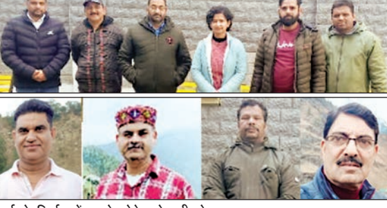
पार्क के निर्माण में सहयोग देने वाले सभी लोग।