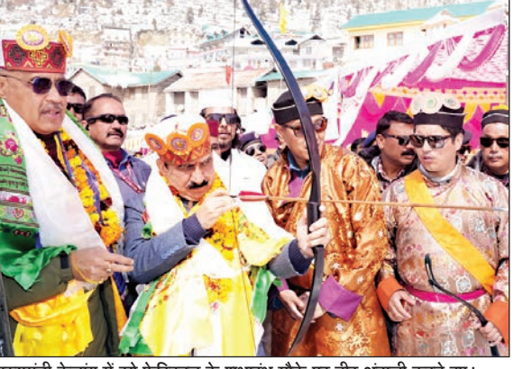
मुख्यमंत्री केलांग में स्नो फेस्टिवल के शुभारंभ मौके पर तीर अंदाजी करते हुए।

करने की घोषणा की। इस प्रकार प्रति माह 1500 रुपए की पेंशन प्राप्त प्रदेश की 2.42 लाख महिलाओं को होगी।