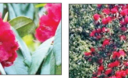
पेड़ पर लगे बुरांश के फूल।

मार्च और अप्रैल के महीनों में पहाड़ इसके फूलों के रंग से सगवोर हो जाते हैं। बुरांश एक सदाबहार पेड़ है जो समुद्र तल से 1500-3600 मीटर की ऊंचाई पर उगता है, यह 20 मीटर तक ऊंचा होता है। गौरतलब है कि बुरांश भूटान, नेपाल, चीन, भारत, श्रीलंका, पाकिस्तान, म्यांमार और थाइलैंड में पाया जाता है। रोडोडेंड्रोन आर्बोरियम उत्तरखंड का राज्य वृक्ष, नागालैंड का राज्य फूल और नेपाल का राष्ट्रीय फूल है।