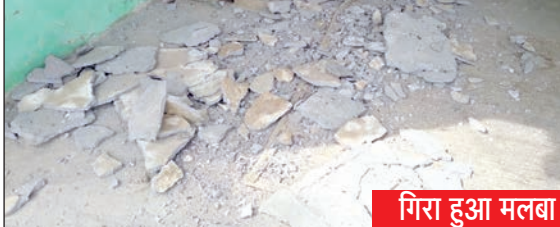
गिरा हुआ मलबा