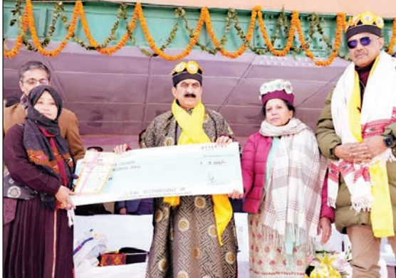
कार्यक्रम के दौरान मुख्यमंत्री सुखविंदर सिंह महिला को चेक भेंट करते हुए।

अनंत ज्ञान ब्यूरो, केलांग मुख्यमंत्री सुखविंदर सिंह सुक्खू ने कहा है कि प्रदेश सरकार चरणबद्ध तरीके से अपनी सभी गारंटियों को पूरा कर रही है। रविवार को केलांग में स्नो फेस्टिवल के शुभारंभ मौके पर मुख्यातिथि पहुंचे मुख्यमंत्री ने कहा कि हालांकि पूर्व जयराम सरकार ने उन्हें खाली खजाना दिया था। लेकिन इसके बावजूद पिछले एक वर्ष में वर्तमान सरकार ने इस व्यवस्था को सुधारने के लिए प्रयास किए। सरकार ने पहले बजट में आत्मनिर्भर हिमाचल की नींव रखी क्योंकि कर्ज पर निर्भर नहीं रहा जा सकता और राजस्व में वृद्धि के उपाय तलाशे। सरकार का प्रयास अंतिम व्यक्ति तक पहुंचने का है इसलिए अनाथ बच्चों को 'चिल्ड्रन ऑफ द स्टेट' का दर्जा देने के लिए कानून बनाने वाला हिमाचल प्रदेश देश का पहला राज्य बना। अपनी गारंटी को पूरा करते हुए प्रदेश सरकार ने केंद्र सरकार के कई प्रतिबंध लगने के बावजूद पुरानी पेंशन को बहाल किया है, ताकि वह बुढ़ापा सम्मानपूर्वक गुजार सकें। वहीं, राजस्थान में भाजपा की सरकार बनते ही उन्होंने कांग्रेस सरकार के कार्यकाल में शुरू की गई पुरानी पेंशन स्कीम को वापस ले लिया है। वहीं, उन्होंने कहा कि हिमाचल प्रदेश ने इतिहास की सबसे बड़ी आपदा का सामना किया, जिसमें 525 लोगों की मौत हुई तथा 16000 घरों को नुकसान हुआ। केंद्र सरकार से कोई भी मदद न मिलने के बावजूद राज्य सरकार ने 4500 करोड़ रुपए का पैकेज आपदा प्रभावितों को दिया है। जिला लाहौल-स्पीति में इंद्रिया गांधी प्यारी बहना सम्मान निधि योजना शुरू करने के साथ-साथ प्रदेश में 1100 रुपये पेंशन प्राप्त करने वाली 2.37 लाख महिलाओं को भी एक फरवरी 2024 से 1500 रुपए प्रदान