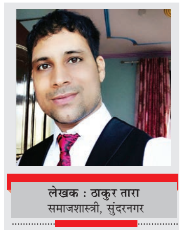
लेखक : डाक्टर तारा समाजशास्त्री, सुंदरनगर

इस कारण पाश्चात्य जोड़े एक साल दो साल, दस साल या पच्चीस साल तक अगर यह शादी का बंधन कायम रहे, खुशी से झूमकर मनाते थे। इस संस्कृति के