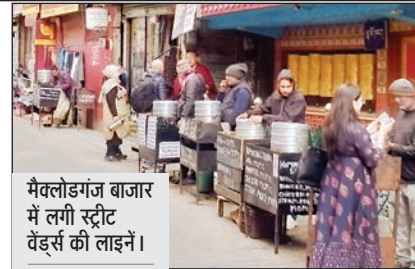
मैक्लोडगंज बाजार में लगी स्ट्रीट वेंडर्स की लाइन।