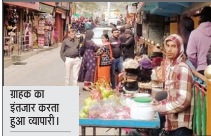
ग्राहक का इंतजार करता हुआ व्यापारी।

निगम कमिशनर से उठाई है। उनका कहना है कि सड़क किनारे कब्जे होने से वाहनों की आवाजाही प्रभावित हो रही है तथा दुर्घटनाओं का भी अंदेशा बना रहता है। शहर में बन रही स्मार्ट दीवार से पर्यटकों में अच्छा संदेश जाएगा, लेकिन अवैध कब्जों को हटाया जाना जरूरी है। वहीं, होटल एंड रेस्टोरेंट एसोसिएशन स्मार्ट सिटी धर्मशाला, इंडो तिब्बतियन फ्रेंडशिप एसोसिएशन, टैक्सी व ऑटो यूनियन व व्यापार मंडल मैक्लोडगंज ने कहा कि इससे आवाजाही हो रही प्रभावित। उन्होंने जल्द इस समस्या का समाधान मांगा है।