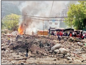
आग को बुझाने में जुटे स्थानीय लोग।