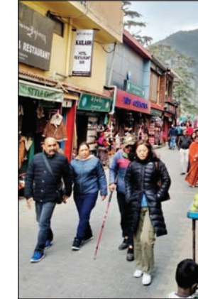
मैक्लोडगंज बाजार में घूमते पर्यटक।