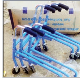
अलेमको कंपनी द्वारा बांटे गए सहायता दिव्यांग उपकरणों की कालिटी पर भी लोगों द्वारा सवालिया निशान लगाए गए हैं। कई व्हील चेयरों को भी मौके पर ही टूटते देखा गया, जिससे कंपनी की कार्यप्रणाली भी संदेह के घेरे में आ गई है।

उपकरण बांटे गए, जबकि इस पंचायत के दर्जनों ऐसे विकलांग और दिव्यांग लोग हैं, जिन्हें सहायता उपकरणों की सख्त आवश्यकता है। वहीं, लोगों द्वारा शिविर में इस बात की मांग की जा