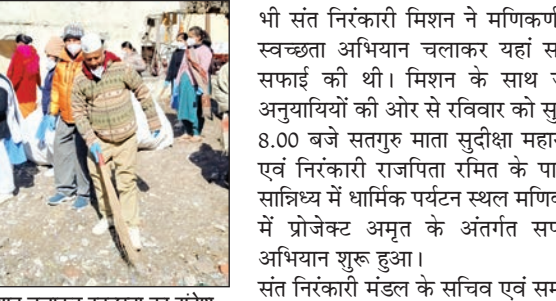
सफाई अभियान चलाकर स्वच्छता का संदेश देते हुए मिशन से जुड़े अनुयायी।