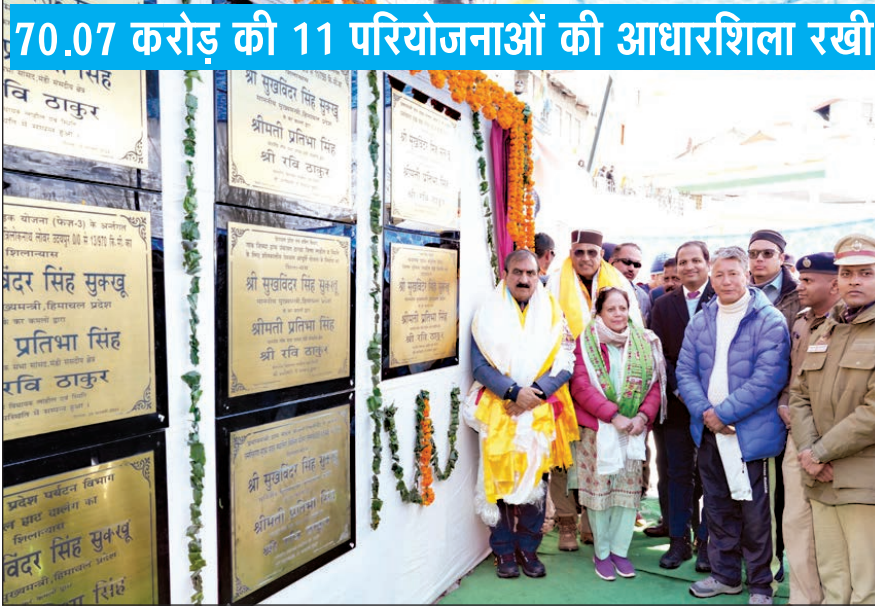
70.07 करोड़ की 11 परियोजनाओं की आधारशिला रखी

लाहौल-स्पीति पुलिस के कमांड और कंट्रोल सेंटर का किया लोकार्पण लाहौल-स्पीति जिले के एकदिवसीय दौर के दौरान मुख्यमंत्री ने 70.07 करोड़ रुपए की 11 विकास परियोजनाओं की आधारशिला रखी। इन परियोजनाओं में 9.97 करोड़ रुपए की लागत से मुख्य सड़क रीतल, 4.58 करोड़ रुपए से मुख्य सड़क रूआलिंग थॉलिंग मेलिंग, 6.41 करोड़ रुपए से मुख्य सड़क मार्बल, 6.80 करोड़ रुपए से मुख्य सड़क चौखाम-नेनागाहर, 13.88 करोड़ रुपए से मुख्य सड़क विहाली-त्रिलोकनाथ-लोबर-उदयपुर, 10.41 करोड़ रुपए से मुख्य सड़क यांगरा और 6.18 करोड़ रुपए से मुख्य सड़क शिति नाला-मेह बोग के उन्नयन का कार्य शामिल है। उन्होंने 1.68 करोड़ रुपए की लागत की साइफन के माध्यम से एफआरएस बॉलिंग के सुधार कार्य, ग्राम जिसमा में 3.91 करोड़ रुपए की लागत से निर्मित होने वाली शीतकालीन जल आपूर्ति योजना और पांच करोड़ रुपए से निर्मित होने वाले लाहौल हाट डालंग की आधारशिला रखी। मुख्यमंत्री ने 1.25 करोड़ रुपए की लागत से निर्मित जिला पुलिस लाहौल-स्पीति के कमांड और कंट्रोल सेंटर (अनिमेष-नेत्रम) का लोकार्पण किया। केंद्र ने जिले के अन्य लोकप्रिय पर्यटन स्थलों के साथ-साथ सुमले, शिकुला और सरकु सहित सीमावर्ती क्षेत्रों में अपने सीसीटीवी कनेक्शन का विस्तार किया है, जिसे स्कॉच मेरिट ऑफ ऑर्डर पुरस्कार भी मिला है। इस परियोजना के तहत कुल 639 कैमरे स्थापित किए गए हैं, जिनमें से 182 पिछले वर्ष स्थापित किए गए थे।