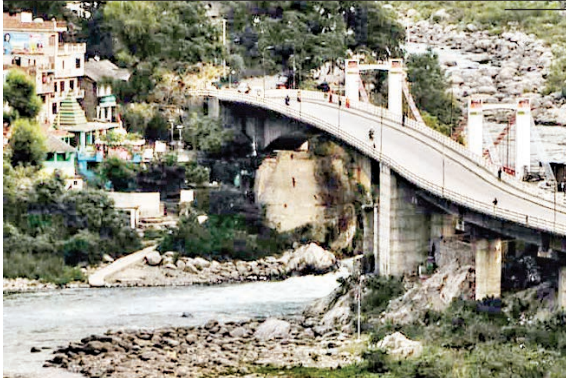
चंबा मुख्यालय सहित विभिन्न स्थलों से होकर गुजरती रावी नदी।

मौजूदा समय में रावी पर मुख्य तौर से जल विद्युत उत्पादन सहित विभिन्न व्यवसाय फलफूल रहे हैं, जिनमें मत्स्य उत्पादन भी एक मुख्य व्यवसाय है। कहीं चंबा बांध के नाम पर तो कहीं थीन बांध के नाम पर रावी का देहन हो रहा है। रावी के जल का सिंचाई के लिए उपयोग संपूर्ण प्रवाह क्षेत्र में किया जाता है। भारतीय पंजाब के उत्तरी छोर पर माधोपुर में प्रारंभिक बिंदु वाली ऊपरी नदी (बा ब्यास, री-रावी) दोआब नहर 1878-1879 में बनकर तैयार हुई थी।