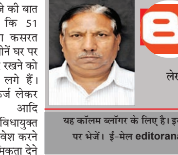
यह कॉलम ब्लॉगर के लिए है। इस ब्लाट्सएप नंबर 9882400808 पर भेजें। ई-मेल editorananantgyaan@gmail.com

एक समय था, जब लोग बचत को ही प्राथमिकता देते थे। अब लोगों की प्राथमिकता में स्वास्थ्य पहले पायदान पर आ गया है। इसमें ही खासतौर से मानसिक स्वास्थ्य और एक्ससाइज को लेकर लोग अधिक गंभीर होने लगे हैं। लोगों में वर्कआउट के प्रति रझान बढ़ा है, जबकि एक समय था, जब वर्कआउट के लिए जिम जाने को स्टेटस सिंबल माना