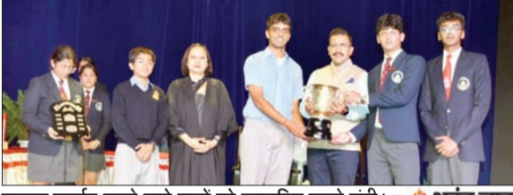
उत्कृष्ट प्रदर्शन करने वाले छात्रों को सम्मानित करते मंत्री।