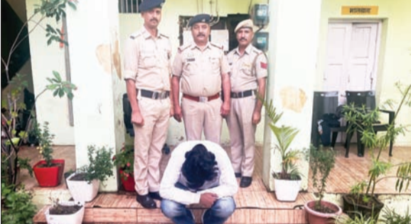
आरोपी पुलिस के गिरफ्त में।

सोलन। पुलिस थाना सदर, सोलन से सूचना प्राप्त हुई कि काली माता मंदिर क्षेत्र में हुए हिंसक झगड़े में घायल व्यक्तियों को उपचार हेतु अस्पताल लाया गया है। सूचना मिलते ही पुलिस टीम मौके पर पहुंची तथा मामले की जांच प्रारम्भ की गई। प्रारम्भिक जांच में सामने आया कि काली माता मंदिर, शामती-राजगढ़ मार्ग पर दो वाहनों के बीच हुई मामूली टक्कर के बाद विवाद उत्पन्न हुआ। शिकायतकर्ता के अनुसार, बाद में आरोपी पक्ष द्वारा खुण्डीघर क्षेत्र में शिकायतकर्ता पक्ष के व्यक्तियों के साथ गाली-गलौज, धमकी एवं मारपीट की गई। इसके उपरांत शूलिनी माता मंदिर के समीप आरोपियों ने शिकायतकर्ता पक्ष के वाहन को रोककर उस पर हमला किया तथा लोहे की रॉड, गंडासे एवं अन्य हथियारों से हमला कर व्यक्तियों