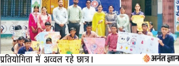
प्रतियोगिता में अखिल रहे छात्र।