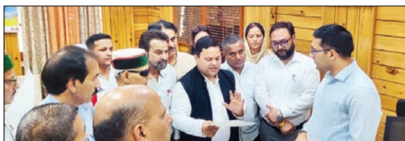
मामले की उच्चस्तरीय और निष्पक्ष जांच की मांग की।