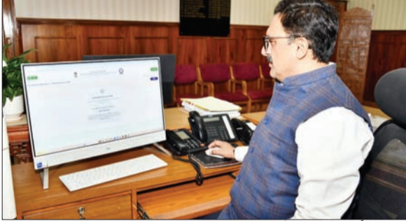
सोलन में स्व गणना अभियान को लेकर जागरूकता तेज।