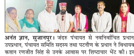
अनंत ज्ञान, सुजानपुर। जंदरु पंचायत से नवनिर्वाचित प्रधान, उपप्रधान, पंचायत समिति सदस्य तथा पटनौण के प्रधान ने विधायक कसान रणजीत सिंह से उनके आवास पर शिष्टाचार भेंट की। इस अवसर पर विधायक ने सभी जनप्रतिनिधियों का शॉल व पारंपरिक टोपी पहनाकर सम्मान किया तथा उन्हें जनसेवा में सफल कार्यकाल के लिए शुभकामनाएं दीं। विधायक ने कहा कि लोकतंत्र में जनता का विश्वास प्राप्त कर चुने गए प्रतिनिधियों की जिम्मेदारी और बढ़ जाती है। उन्होंने आशा व्यक्त की कि सभी जनप्रतिनिधि विकास कार्यों और जनकल्याण योजनाओं को प्राथमिकता देंगे।