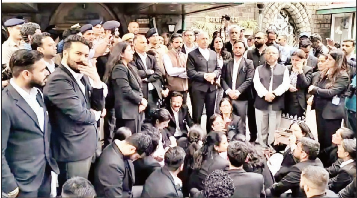
सचिवालय के बाहर सील्ड रोड परमिट शुल्क वृद्धि के विरोध में प्रदर्शन करते अधिवक्ता।