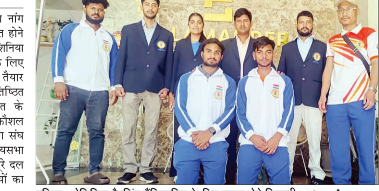
एशिया-ओशिनिया ग्रेपलिंग चैंपियनशिप के लिए रवाना होते खिलाड़ी।