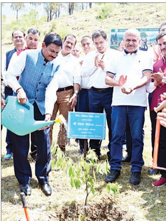
'नो योर टीए मेला' अभियान का महत्वपूर्ण हिस्सा अधिकारियों ने बताया कि यह अभियान 'नो योर टीए मेला' पहल का महत्वपूर्ण हिस्सा है। इसके माध्यम से प्रादेशिक सेना की इकोलॉजिकल टास्क फोर्स इकाइयों द्वारा पर्यावरण संरक्षण और सतत विकास के लिए किए जा रहे प्रयासों को नई गति मिलेगी। आने वाले दिनों में प्रदेश के विभिन्न क्षेत्रों में बड़े पैमाने पर पौधारोपण कर हरित हिमाचल के संकल्प को साकार किया जाएगा।

पशुपालकों को इस योजना के प्रति जागरूक करें तथा उन्हें डेयरी सहकारी समितियों से जुड़ने के लिए प्रेरित करें, ताकि दुग्ध संग्रहण और विपणन की व्यवस्था अधिक प्रभावी बन सके। बता दें कि प्रदेश सरकार पहले ही दुग्ध उत्पादकों के हित में कई प्रोत्साहन योजनाएं लागू कर चुकी हैं। इन योजनाओं का उद्देश्य किसानों को बेहतर मूल्य उपलब्ध करवाना, दुग्ध उत्पादन में वृद्धि करना तथा पशुपालन को लाभकारी व्यवसाय के रूप में विकसित करना है। सरकार का मानना है कि सहकारी ढांचे के माध्यम से गांव स्तर पर संगठित दुग्ध उत्पादन को बढ़ावा मिलेगा और ग्रामीण परिवारों का आर्थिक स्थिति में सुधार आएगा। विभागीय अधिकारियों ने पंचायतों से कहा है कि यदि उनकी पंचायत में नई डेयरी सहकारी समिति स्थापित करने की सहमति है तो पंचायत प्रधान, पंचायत सचिव तथा सभी सदस्यों के हस्ताक्षरों सहित प्रस्ताव की प्रति शीघ्र विभाग को उपलब्ध करवाई जाए। वहीं यदि किसी कारणवश पंचायत नई समिति के गठन के पक्ष में नहीं है तो उसके संबंध में भी स्पष्ट प्रस्ताव विभाग को भेजना होगा।