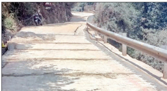
करमू मोड़ के पास बिछाई गई टाइल्स।

करमू मोड़ के पास सड़क खराब होने के चलते वाहन चालकों को परेशानी होती थी। कई बार तो पर्यटक वाहन इस तरह से फंस जाते थे कि घंटों जाम की स्थिति बनी रहती थी। पर्यटकों द्वारा इस तरह की शिकायतें होटल उद्यमियों से की गई थीं। इस पर होटल एसोसिएशन ने खड़ा डंडा मार्ग पर जगह-जगह