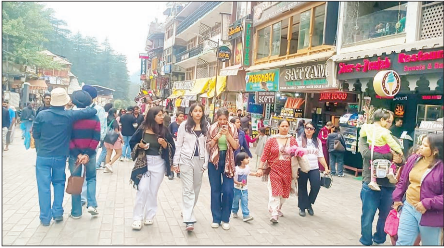
पर्यटन नगरी मनाली के मालरोड पर उमड़ा पर्यटकों का सैलाब।

गर्मी से राहत पाने के लिए भारी संख्या में दूसरे राज्यों से पहुंच रहे पर्यटक