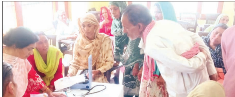
तहसील बसोहली के हट क्षेत्र में नि:शुल्क चिकित्सा शिविर का आयोजन किया।