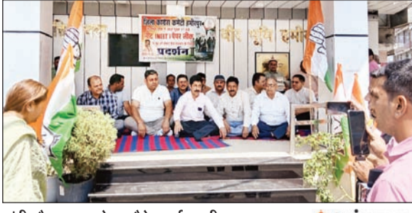
गांधी चौक पर धरने पर बैठे प्रदर्शनकारी।

अनंत ज्ञान हमीरपुर। कांग्रेस पार्टी द्वारा प्रदेशभर में आज नीट पेपर लीक मामले में सम्मिलित देशों के खिलाफ सख्त कार्रवाई करने की मांग को लेकर धरना-प्रदर्शन किया जा रहे हैं। मंगलवार को हमीरपुर के गांधी चौक पर जिला कांग्रेस कमेटी ने धरना-प्रदर्शन किया और केंद्र सरकार पर युवाओं के भविष्य के साथ खिलवाड़ करने के आरोप लगाए।