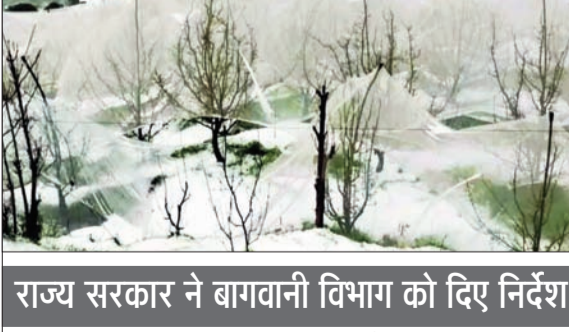
राज्य सरकार ने बागवानी विभाग को दिए निर्देश

अनंत ज्ञान सत्यदेव भारद्वाज, शिमला। हिमाचल प्रदेश के ऊंचे इलाकों में अप्रैल के पहले और दूसरे सप्ताह में हुई बर्फबारी ने सेब बागवानों को एक बार फिर भारी नुकसान पहुंचाया है, लेकिन अब सरकार इस नुकसान को भरपाई के लिए बड़ा कदम उठाने की तैयारी में है। सेब बागानों को बर्फबारी से होने वाले नुकसान को फसल बीमा योजना के तहत एड-ऑन कवर में शामिल करने की प्रक्रिया शुरू कर दी गई है, जिससे बागवानों को आर्थिक राहत मिलने की उम्मीद जगी है। जलकारी के अनुसार प्रदेश में कई जाह बर्फबारी के कारण सेब के बगीचों के साथ एंटी-हेल नेट, बांस और पौधों को व्यापक क्षति हुई है। इससे बागवानों को लाखों रुपये का नुकसान उठाना पड़ा है। मौजूदा व्यवस्था में बर्फबारी से होने वाला नुकसान