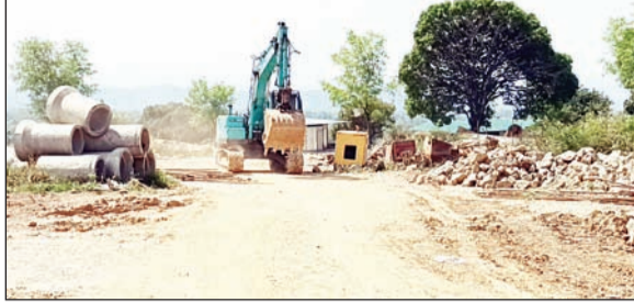
सकोह में निर्माणाधीन आइस स्केटिंग व रोलर स्केटिंग रिक।

अनंत ज्ञान ब्यूरो, धर्मशाला। प्रदेश की दूसरी राजधानी धर्मशाला के समीप स्थित सकोह को इंटरनेशनल पहचान मिलने वाली है। नगर निगम धर्मशाला के सकोह वार्ड में बन रहा आइस स्केटिंग व रोलर स्केटिंग रिक अगले वर्ष तैयार होगा। एबीडी के सहयोग से पर्यटन विकास निगम के सहयोग से इसका निर्माण करीब 34 करोड़ से किया जा रहा है। यही नहीं जिस भूमि पर यह प्रोजेक्ट बन रहा है, वहां पर स्थित समाधियों