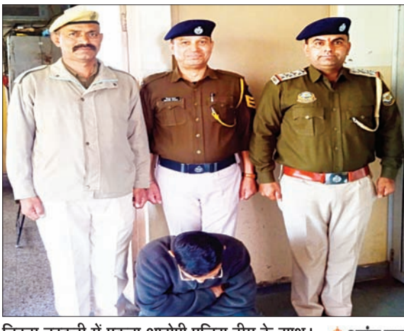
चिट्टा तस्करी में पकड़ा आरोपी पुलिस टीम के साथ।

अनंत ज्ञान ब्यूरो, शिमला। शिमला जिले के टियोग क्षेत्र में चिट्टा तस्करी के खिलाफ चल रही मुहिम के बीच पुलिस को बड़ी सफलता हाथ लगी है। मामले की जांच में फॉरवर्ड लिंकेज के आधार पर जेएमएफसी कोर्ट टियोग में कार्यरत एक चपरासी को गिरफ्तार किया गया है। इस कार्रवाई ने नशे के नेटवर्क को गहराई और उसके फैलाव को उजागर कर दिया है, जिससे साफ है कि तस्करी का जाल समाज के कई स्तरों तक पहुंच चुका है।