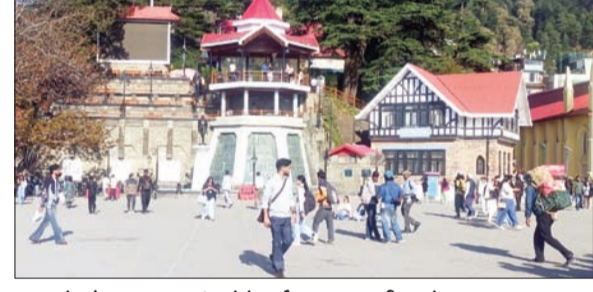
सुहावने मौसम का आनंद लेते पर्यटक व स्थानीय लोग।

अनंत ज्ञान ब्यूरो, शिमला। हिमाचल प्रदेश में मौसम खुलने से गर्मी का असर तेजी से बढ़ने लगा है। राजधानी शिमला में शनिवार को इस सीजन का अब तक का सबसे गर्म दिन दर्ज किया गया, जहां अधिकतम तापमान 27 डिग्री सेल्सियस से ऊपर पहुंच गया। यह सामान्य से 5.5 डिग्री अधिक रहा। मौसम विभाग के अनुसार पिछले 24 घंटों के दौरान राज्य के अधिकतम तापमान में औसतन करीब 4 डिग्री सेल्सियस की बढ़ोतरी दर्ज की गई है, जिससे लोगों को दिन के समय तेज गर्मी महसूस होने लगी है। राज्य के कई मैदानी और मध्य पर्वतीय क्षेत्रों में तापमान सामान्य से ज्यादा रिकॉर्ड किया गया। बिलासपुर जिले का बरठौं प्रदेश का सबसे गर्म स्थान रहा, जहां अधिकतम तापमान 36.7 डिग्री सेल्सियस दर्ज किया गया। इसके अलावा ऊना में 35.7 डिग्री, नाहन में 34.3 डिग्री, मंडी में 34.2 डिग्री, सुंदरनगर में 33.6 डिग्री और कांगड़ा में 33.2 डिग्री तापमान दर्ज किया गया। वहीं पर्वत स्थल मनाली में अधिकतम तापमान 21.8