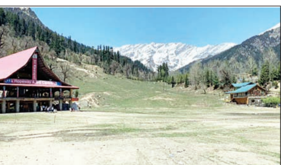
सोलंगनाला में पर्यटकों के बिना पसरा सन्नाटा। अनंत ज्ञान

एम बोकटापा, मनाली। 'पहाड़ों की रानी' मनाली में इस वीकेंड पर्यटन कारोबार को बड़ा झटका लगा है। पिछले कुछ हफ्तों से सैलानियों की भारी भीड़ से गुलजार रहने वाली मनाली की सड़कों और पर्यटन स्थल इस रविवार को सूने नजर आए। शाम के समय पर्यटकों से खचाखच भरे रहने वाले मॉल रोड पर भी इस बार चहल-पहल काफी कम रही। पर्यटकों की संख्या में आई इस अचानक गिरावट ने स्थानीय होटल कारोबारियों, टैक्सि ऑपरेटर्स और छोटे व्यापारियों के माथे पर चिंता की लकीरें खींच दी हैं। पर्यटकों की कमी के कारण एडवेंचर स्पॉर्ट्स संस्थानकों की कमाई में भारी गिरावट आई है। होटल एसोसिएशन के सदस्यों के अनुसार, पिछले वीकेंड के मुकाबले इस बार आम्बूपेंसी में भारी गिरावट दर्ज की गई है। कई होटलों में कमरे खाली