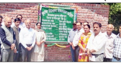
किसानों ने भी साझा किए अपने विचार।