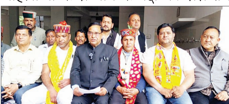
बैठक के दौरान जिला कांग्रेस पदाधिकारी। अनंत ज्ञान