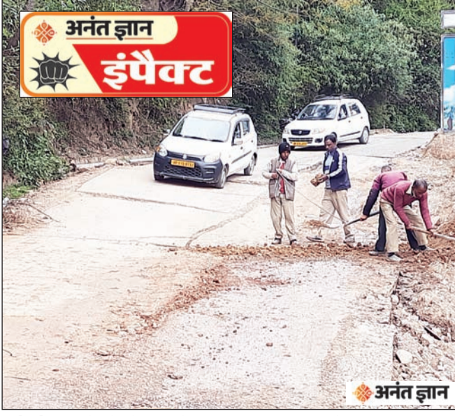
पानी की वजह से डंगो को पहुंच रहे नुकसान का समाधान करते श्रमिक।