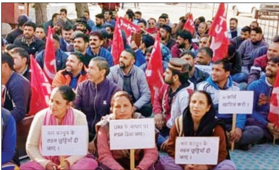
मांगें मजदूरी के लिए बुधवार को धरना-प्रदर्शन करते मजदूर।

बताते चलें कि एनएचपीसी क्षेत्रीय कार्यालय बनीखेत के ठेका मजदूर एवं बैरास्थूल के ठेका मजदूरों ने एनएचपीसी प्रबंधन व सरकार की मजदूर विरोधी ठेका प्रथा, आउटसोर्स नीति के खिलाफ जमकर नारेबाजी की। लंबे समय से ठेका मजदूर पत्राचार के माध्यम से एनएचपीसी प्रबंधन को अपनी मांगों के बारे में चेतना आए हैं, लेकिन प्रशासन ने कोई कार्रवाई नहीं की तथा बुधवार को मजदूर प्रदर्शन करना पड़ा। वर्कर्स यूनिन