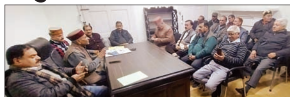
बैठक के दौरान मौजूद भारतीय राज्य पेंशनर्स महासंघ चंबा इकाई के सदस्य।