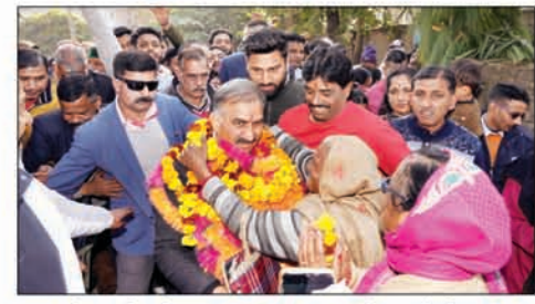
मुख्यमंत्री सुखविंद सिंह सुखू का स्वागत करती बुजुर्ग महिला।