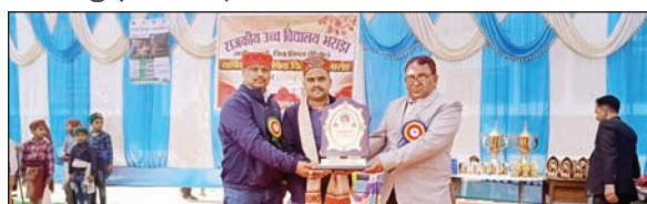
भराड़ा में मुख्यातिथि को सम्मानित करते स्कूल प्रबंधन के पदाधिकारी।