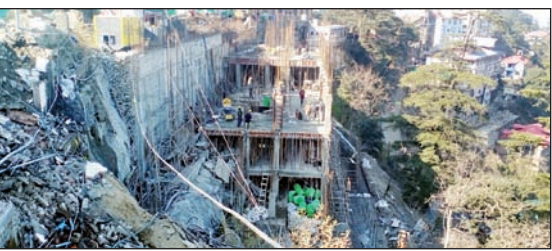
रिज मैदान के स्टेबलाइजेशन का चला हुआ कार्य।

इसको लेकर मजबूती का सबसे ज्यादा ध्यान रखा जा रहा है। यहां पर डंगे लगाने का डिजाइन आईआईटी ने तैयार किया है, बता दें कि यहां पर निगम ने प्रपोजल दिया था कि इस डंगे में पदमवेक कॉलेक्स की तर्ज पर कार्यालयों का निर्माण किया जाए, लेकिन अभी तक इस प्रस्ताव को मंजूरी तो नहीं मिली है, लेकिन डिजाइन को उसी हिसाब से तैयार कर कार्य किया जा रहा है। कार्य लगभग 80 प्रतिशत