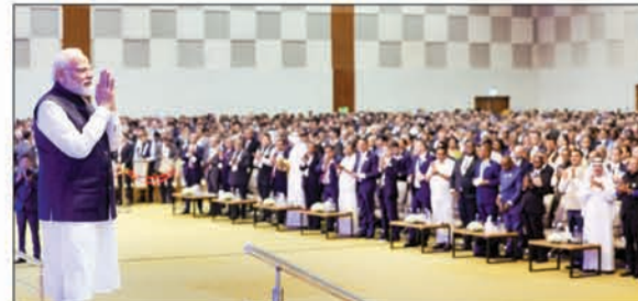
10वें संस्करण के उद्घाटन पर मेहमानों का हाथ जोड़कर स्वागत करते पीएम मोदी।

एजेंसी, नई दिल्ली प्रधानमंत्री नरेंद्र मोदी ने कहा कि तेजी से बदलती विश्व व्यवस्था में भारत विश्व मित्र के रूप में आगे बढ़ रहा है। दुनिया भारत को स्थिरता के एक महत्वपूर्ण स्तंभ और वैश्विक अर्थव्यवस्था में विकास के विश्व मित्र के रूप में देखती है। यह बात पीएम मोदी ने गांधीनगर के महात्मा मंदिर में 10 से 12 जनवरी तक आयोजित होने वाले वाइब्रेंट गुजरात ग्लोबल समिट-2024 के 10वें संस्करण के उद्घाटन सत्र को संबोधित करते हुए कही। उन्होंने कहा कि हमने एक नई किरण बनकर उभरा है। उन्होंने कहा कि भारत विश्वमित्र की भूमिका में आगे बढ़ रहा है। आज भारत ने विश्व को यह भरोसा दिया है कि हम साझा लक्ष्य तय कर सकते हैं, अपने लक्ष्य प्राप्त कर सकते हैं। विश्व कल्याण के लिए भारत की प्रतिबद्धता, निष्ठा, प्रयास और भारत का परिश्रम आज की दुनिया को ज्यादा सुरक्षित और समृद्ध बना रहा है। उन्होंने कहा कि वाइब्रेंट गुजरात समिट आर्थिक विकास और निवेश का एक वैश्विक मंच बन गया है। उन्होंने कहा कि भारत-यूएई संबंधों में आई प्रगाढ़ता का श्रेय संयुक्त अरब अमीरात (यूएई) के राष्ट्रपति शेख मोहम्मद बिन जायद अल नाहयान को दिया। पीएम ने यूएई राष्ट्रपति को धाई बताया।