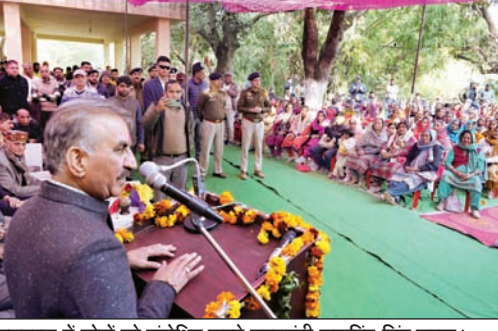
बलबूझक में लोगों को संबोधित करते मुख्यमंत्री सुखविंद सिंह सुखू।