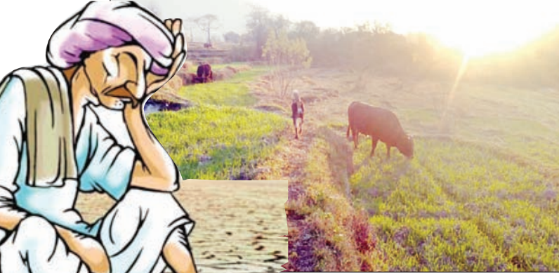
लोगों की फसलों को चट करते आवारा पशु।

फसलों को बचाने के लिए ग्रामीण अब रात भर बारी-बारी पहरा दे रहे हैं, लेकिन बावजूद इसके ग्रामीण किसानों के हाथ कुछ नहीं लग रहा। ऐसे में