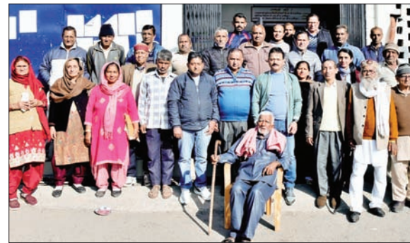
कॉलेज के नाम भूमि दान करने वाले लोग सामूहिक चित्र में।