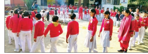
घड़ोह स्कूल में लोहड़ी पर्व मनाते हुए बच्चे व अध्यापक।