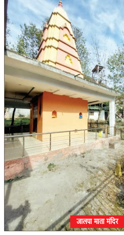
जालपा माता मंदिर