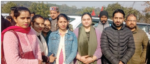
मांगों को लेकर मुख्यमंत्री से मिलने पहुंचे जेबीटी प्रशिक्षु सामूहिक चित्र में।

जेबीटी प्रशिक्षुओं ने बुधवार को नादौन में मुख्यमंत्री सुखविंद सिंह सुक्खू से मिलकर उन्हें एक ज्ञान सौंपा। प्रतिनिधिमंडल ने मुख्यमंत्री से आग्रह किया की जेबीटी बैच वाइज भारती का रिजल्ट जल्दी घोषित किया जाए। उनका कहना था कि बैचवाइज भर्ती नवंबर 2023 में हुई थी और इसका रिजल्ट भी तैयार हो चुका है परंतु कोर्ट के मामलों की वजह से हाई