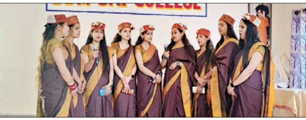
डीडीएम साई कॉलेज में कार्यक्रम प्रस्तुत करती छात्राएं।