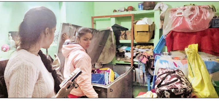
कठुआ के पटेल चौक में घर में चोरी होने के बाद बिखरे सामान को देखती महिलाएं।