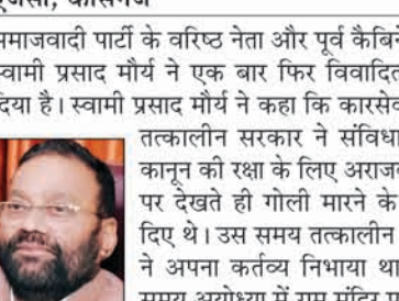
स्वामी प्रसाद मौर्य

एजेंसी, कासगंज समाजवादी पार्टी के वरिष्ठ नेता और पूर्व कैबिनेट मंत्री स्वामी प्रसाद मौर्य ने एक बार फिर विवादित बयान दिया है। स्वामी प्रसाद मौर्य ने कहा कि कारसेवकों पर तत्कालीन सरकार ने संविधान और कानून की रक्षा के लिए अराजक तत्वों पर देखते ही गोली मारने के आदेश दिए थे। उस समय तत्कालीन सरकार ने अपना कर्तव्य निभाया था। जिस समय अयोध्या में राम मंदिर पर घटना घटी थी, वहां पर बिना किसी न्यायपालिका और प्रशासनिक के आदेश के बड़े पैमाने पर अराजकतक तत्वों ने तोड़फोड़ कर दी थी। 33 साल पहले सन् 1990 में अयोध्या के हनुमान गढ़ी जा रहे कारसेवकों पर ताबडुतोड़ गोलियां चलाई गई थीं। उस समय उत्तर प्रदेश में समाजवादी पार्टी की सरकार थी, मुलायम सिंह यादव यूपी के मुख्यमंत्री थे।