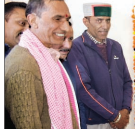
नवनिर्मित उपकोषागार कार्यालय सिहुंता के भव्य भवन का उद्घाटन करते विधानसभा अध्यक्ष।

विधानसभा अध्यक्ष कुलदीप सिंह पटानिया ने बुधवार को टुंडी-धरं संपर्क मार्ग के उन्नयन कार्य का भूमि पूजन किया। उन्होंने कहा कि टुंडी-धरं संपर्क मार्ग के उन्नयन कार्य पर 6 करोड़ 85 लाख की धनराशि व्यय होगी। उन्होंने कहा कि इस संपर्क मार्ग के निर्माण कार्य को समयबद्ध सीमा के भीतर पूर्ण कर लोगों को बेहतर सड़क सुविधा उपलब्ध करवाई जाएगी। कुलदीप सिंह पटानिया ने इससे पहले 72 लाख की राशि से नवनिर्मित उपकोषागार कार्यालय सिहुंता के भव्य भवन का लोकार्पण भी किया। उन्होंने बताया कि कार्यालय भवन में आवास सुविधा का प्रावधान भी रखा गया है। जिससे यहां कार्यरत अधिकारियों एवं कर्मचारियों को बेहतर आवास की सुविधा भी उपलब्ध होगी। इस अवसर पर अधीक्षण अभियंता लोक निर्माण विभाग दिवाकर