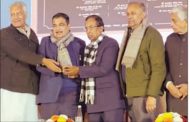
4 लेन और जालंधर-मक्खू रोड पर तीन पुल शामिल हैं। फोरलेन निर्माण से फनवाड़ा होशियारपुर के मध्य 100 किलोमीटर प्रति घंटा हाई स्पीड कनेक्टिविटी प्रदान होगी और यात्रा समय एक घंटे से घटकर 30 मिनट का रह

एजेंसी, नई दिल्ली केंद्रीय परिवहन मंत्री नितिन गडकरी ने पंजाब के लोगों को सौंगात देते हुए होशियारपुर में 29 प्रोजेक्टों का शिलान्यास व लोकार्पण किया। इन पर करीब चार हजार करोड़ रुपए खर्च किए जाएंगे और होशियारपुर, जालंधर और आसपास के इलाकों के लोगों को इन प्रोजेक्टों से काफी लाभ होगा। केंद्र सरकार देश में हाईवे और एक्सप्रेस वे का लगातार जाल बिछा रही है। हर राज्य में बेहतर रोड इंफ्रा खड़ा करने की दिशा में अब पंजाब में 4000 करोड़ की लागत से 29 नेशनल हाईवे प्रोजेक्ट्स का निर्माण किया जाएगा। केंद्रीय सड़क परिवहन मंत्री नितिन गडकरी ने बुधवार को राज्य में 4,000 करोड़ रुपए की 29 राष्ट्रीय राजमार्ग परियोजनाओं का उद्घाटन और शिलान्यास किया। इन परियोजनाओं में लुधियाना में लाधोवाल बाईपास, लुधियाना में 6-लेन फ्लाईओवर और 2-लेन रोड ओवर ब्रिज, जालंधर-कपूरथला सेक्शन में