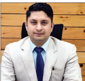
सुबह 11 बजे से 12 बजे और दोपहर तीन से शाम पांच बजे तक रहेगा प्रतिबंध।

स्पष्ट किया है कि आपातकालीन वाहनों और आवश्यक आपूर्ति वाहनों को चलाने की अनुमति रहेगी और उक्त सड़क पर काम के दौरान जनहित के मामलों में कोई बाधा नहीं होगी। आदेश की अनुपालना सुनिश्चित बनाने के लिए पुलिस अधीक्षक चंबा व उपमंडल अधिकारी नागरिक भरमौर तथा संबंधित विभागों के अधिकारियों को भी निर्देशित किया है।