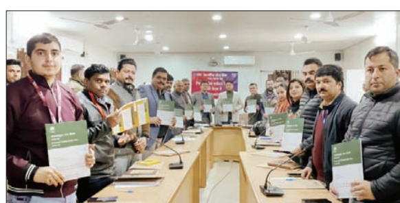
जिला स्तरीय बैंक समिति एवं राजस्व अधिकारियों की बैठक में उपस्थित उपायुक्त चंबा अपूर्व देवगन व अन्य।

अनंत ज्ञान ब्यूरो, चंबा जिला स्तरीय बैंक समिति एवं राजस्व अधिकारियों की बैठक उपायुक्त चंबा अपूर्व देवगन की अध्यक्षता में आयोजित की गई। बैठक में जिला की समस्त तहसील उपतहसीलों में बैंक प्रभार सृजन मामलों पर विस्तृत चर्चा की गई। उपायुक्त अपूर्व देवगन ने बताया कि नवंबर व दिसंबर माह 2023 के दौरान जिला में कुल 596 बैंक