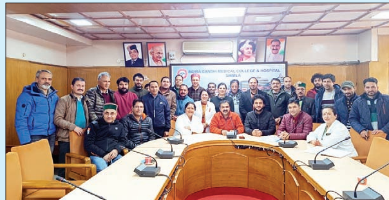
महासंघ अस्पतालों में क्रस्ना लैब की ओर से सेवाएं प्रदान न करने को लेकर सवाल उठाते हुए।

मरीजों को किसी प्रकार की परेशानी न हो इसके लिए आईजीएमसी के एमएस की ओर से बैठक आयोजित की गई, जिसमें सरकारी लैब में टेस्ट करने के निर्देश दिए गए। इस बैठक में विभाग अध्यक्ष, पैथोलॉजी, माइक्रोबायोलॉजी तथा बायकेमिस्ट्री के अध्यक्षों ने भाग लिया। आईजीएमसी अस्पताल में क्रस्ना डायग्नोस्टिक की ओर से अचानक काम ठप करने के कारण व्याप्त परेशानी को देखते हुए सभी मरीजों को अस्पताल में टेस्ट करने के लिए अस्पताल की ही लैब में टेस्ट करवाने के निर्देश दिए। आईजीएमसी अस्पताल के कर्मचारियों ने क्रस्ना डायग्नोस्टिक के कार्यभार को सुचारु रूप से बनाए रखने के लिए प्रयास किया। वहीं, दूसरी ओर क्रस्ना लैब की कार्य प्रणाली को लेकर भी प्रश्न उठाए गए। इसमें कर्मचारियों ने भारी रोश दिखाया है। कर्मचारियों का कहना है कि जिस