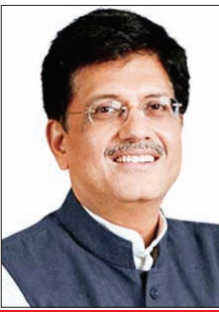
पीयूष गोयल (लेखक, केंद्रीय वाणिज्य एवं उद्योग, उपभोक्ता मामले, खाद्य एवं सार्वजनिक वितरण मंत्री हैं।)

प्रधानमंत्री ने इस बात पर जोर दिया है कि एक लाभदायक बाजार तभी कायम रह सकता है जब उत्पादकों और उपभोक्ताओं के हितों में संतुलन हो। इस रणनीति का एक प्रमुख घटक गुणवत्ता नियंत्रण आदेश (व्यूसीओ) पर जोर देना है। इसके जरिये व्यूसीओ यह सुनिश्चित करता है कि सभी उत्पाद भारतीय मानक ब्यूरो के निर्धारित मानदंडों के अनुरूप हों। यह उन उपभोक्ताओं के लिए एक वरदान है, जिससे उपभोक्ताओं को उत्पादों तथा व्यवसायों के संबंध में विश्वसनीय, सुरक्षित और उच्च गुणवत्ता का भरोसा प्राप्त होता है। इसके जरिये घरेलू और अंतरराष्ट्रीय बाजारों में बढ़ती मांग व उपभोक्ताओं की आकांक्षाओं को पूरा करने में मदद मिलती है। प्रधानमंत्री नरेंद्र मोदी की डिजिटल इंडिया पहल ने 140 करोड़ भारतीयों के परिवार को दुनिया से जुड़ने और सर्वोत्तम उत्पादों व व्यवहारों के बारे में जानने में मदद की है। वे किसी उत्पाद को खरीदने से पहले नियमित रूप से प्रदर्शन, स्थायित्व और निर्भरता के लिए ग्राहक समीक्षाओं की जांच करते हैं। यदि वे उत्पाद से असंतुष्ट हैं, तो वे सार्वजनिक रूप से कर्मियों को उजागर करते हैं। इसलिए, उत्पाद की गुणवत्ता, कीमत और नवीनता के बीच संतुलन बनाना समय की मांग है।