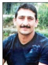
जवानों को वेतन नहीं मिलने का दुःख।