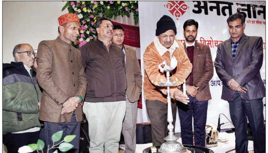
दैनिक अनंत ज्ञान के विमोचन एवं सम्मान समारोह में दीप प्रज्वलन करते अन्य अतिथि।