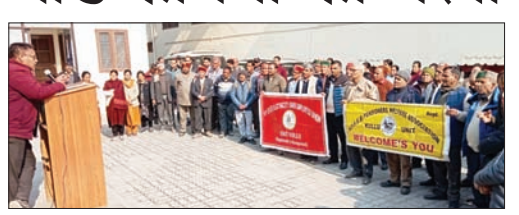
बिजली बोर्ड कार्यालय के बाहर धरना-प्रदर्शन करते हुए कर्मचारी।