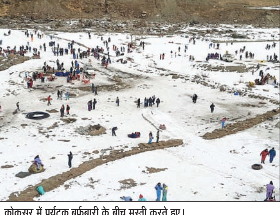
कोकसर में पर्यटक बर्फबारी के बीच मस्ती करते हुए।

रोहतांग दर्रा सहित लाहौल-स्पीति की सभी ऊंची चोटियों पर बर्फबारी का दौर शुरू हो गया है। काफी लंबे अरसे के बाद यहां झड़ स्पेल टूट गया है। ऐसे में रोहतांग पास सहित बारालाचा व शिंकुला दर्रा में बर्फबारी का क्रम शुरू हो गया है। ऐसे में अब लाहौल के निचले इलाकों व मनाली में भी बर्फबारी की उम्मीद बढ़ गई है, जबकि निचले क्षेत्रों में दिनभर बादल छाए रहे। उधर, सोमवार को सुबह से बर्फ के दीदार को पर्यटक लाहुल के कोकसर पहुंचे।