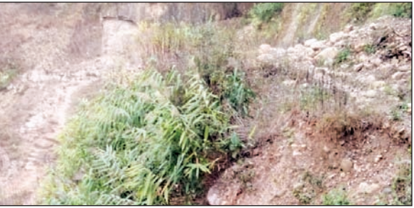
भारी बरसात में लैंड स्लाइडिंग होने से टूटी संपर्क सड़क।