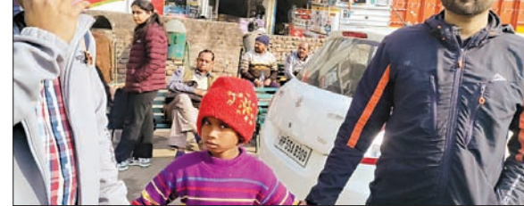
मंटली रिटायर्ड बच्चे परिजनों के साथ।