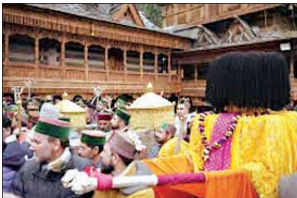
रोहड़ू के गवास गांव शांत महायज्ञ के दूसरे दिन पहुंचे सैकड़ों श्रद्धालु।

तीन दिन तक चलने वाले इस ऐतिहासिक महायज्ञ का मुख्यमंत्री सुखविंद सिंह सुक्खू ने शुभारंभ किया था। इस समारोह में 12 से अधिक देवी-देवता और 20 हजार से अधिक देवल एवं खूंद पहुंचे हैं। परंपरा के मुताबिक इस ऐतिहासिक देव अनुष्ठान के सफल आयोजन से क्षेत्र में सुख-समृद्धि की कामना की गई। दैविक कार एवं आदेशों