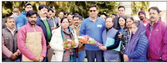
कार्यक्रम के दौरान आरएस बाली का स्वागत करते कांग्रेस कार्यकर्ता।

यह योजना राज्य के अक्षय ऊर्जा लक्ष्यों को हासिल करने में मौल पथर साबित होगी। यह योजना 21 से 45 वर्ष की आयु के युवाओं को उद्यमशीलता के अवसर प्रदान करने के साथ-साथ कौशल विकास को प्रोत्साहित करेगी। सोमवार को कांगड़ा तथा नगरोटा बगवां में लोगों को समर्थ्याएं सुनने के उपरांत पर्यटन निगम के अध्यक्ष