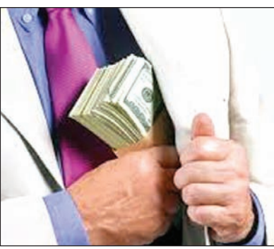
शुल्क बोर्ड ने आधिकारिक आंकड़े जारी किए हैं। धोखाधड़ी के इन मामलों में मध्यप्रदेश-छत्तीसगढ़ भी पीछे नहीं है। अधिकारियों के अनुसार, अन्य भारतीय राज्यों में फर्जी फर्मों की संख्या कम थी और जीएसटी चोरी भी कम मात्रा में पकड़ी गई थी। 4,153 फर्जी

एजेंसी, मुंबई दिसंबर 2023 को समाप्त तिमाही में सबसे ज्यादा फर्जी कंपनियों का भंडाफोड़ महाराष्ट्र में हुआ और सबसे ज्यादा जीएसटी चोरी दिल्ली में हुई। तिमाही के लिए, 12,036 करोड़ रुपये की संदिग्ध आईटीसी (इनपुट टैक्स क्रेडिट) चोरी में शामिल 4,153 फर्जी कंपनियों का पता चला। इनमें केंद्रीय जीएसटी अधिकारियों द्वारा 2,358 फर्जी कंपनियां भी शामिल थीं। इस कार्रवाई से 1,317 करोड़ रुपये का राजस्व बचाने में मदद मिली, जिसमें आईटीसी को अवरुद्ध करके 997 करोड़ रुपये और 319 करोड़ रुपये की वसूली और 41 लोगों को गिरफ्तारी शामिल हैं। रविवार को इस संबंध में केंद्रीय अप्रत्यक्ष कर और सीमा