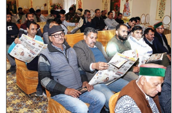
कार्यक्रम में अलग-अलग स्थानों पर बैठे गणमान्य लोगों ने अनंत ज्ञान का अवलोकन किया।