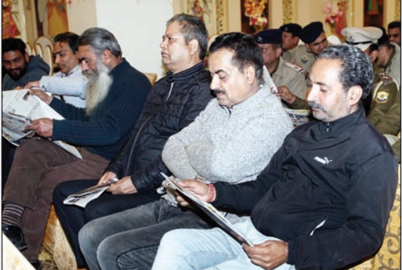
गणमान्य लोग काफी देर तक अनंत ज्ञान का अवलोकन करते रहे।