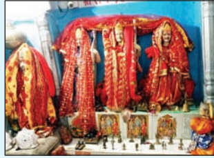
मंदिर में राम, लक्ष्मण, सीता माता व हनुमान की मूर्तियां

शक्तिपीठ ज्वालामुखी मंदिर के कालीधार पर्वतों पर स्थित रघुनाथेश्वर मंदिर आज लाखों भक्तों की आस्था का प्रतीक है। कहा जाता है कि भगवान श्रीराम चंद्र, माता सीता सहित यहां पर गुफा में कुछ समय के लिए रुके थे और इसी मंदिर में पांडवों ने भी अपने वनवास का कुछ समय व्यतीत किया था। यहां पर करोड़ों रुपए की मूर्तियां थीं, जो बार-बार चोरी हो जाने के बाद जिला कोषागार धर्मशाला में हिफाजत से रखी गईं हैं। कुछ समय तक यह मंदिर साधु समाज के अधीन था। बाबा लोग ही यहां का संचालन करते थे, परंतु कुछ समय बाद ही मंदिर न्यास ज्वालामुखी के अधीन इस मंदिर को लाकर इसका सस्कारिकरण कर दिया गया है। मंदिर न्यास की बजट बेटक में इस मंदिर के जीर्णोद्धार सौंदर्यीकरण करने, शहशाह अकबर की नहर के जीर्णोद्धार कर उसे मंदिर तक सहजने के लिए, रास्ते के निर्माण, बिजली, पानी व अन्य मूलभूत सुविधाएं यात्रियों को उपलब्ध करवाने के लिए बजट का प्रावधान किया जाता है।