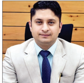
जिला निर्वाचन अधिकारी एवं उपायुक्त चंबा अपूर्व देवगन।

जिला निर्वाचन अधिकारी एवं उपायुक्त चंबा अपूर्व देवगन ने बताया कि भारत निर्वाचन आयोग के निर्देशानुसार जिला चंबा के पांचों विधानसभा निर्वाचन क्षेत्रों यथा एक-चुराह (अजा), दो-भरमौर (अजजा), तीन-चंबा, चार-डलहौजी तथा पांच-भटियात में प्रयुक्त होने वाली फोटोयुक्त मतदाता सूचियों का पुनरीक्षण पहली जनवरी 2024 को अहर्ता तिथि के आधार पर 27 अक्टूबर से नौ दिसंबर 2023 तक करवाया गया था। उन्होंने बताया कि पांच जनवरी 2024 को इस मतदाता सूची का अंतिम प्रकाशन हो चुका है। मतदाता सूची के अंतिम प्रकाशन के बाद अब जिला चंबा के कुल मतदाताओं की संख्या चार लाख एक हजार 168 हो गई है। इनमें पुरुष मतदाताओं की संख्या दो लाख तीन हजार 403 व महिला मतदाताओं की संख्या एक लाख