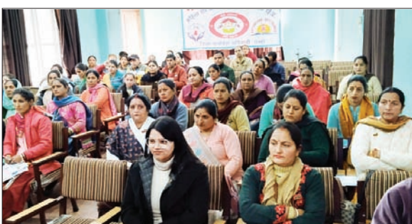
विकास खंड चंबा के समिति हॉल में कार्यक्रम में मौजूद महिलाएं।