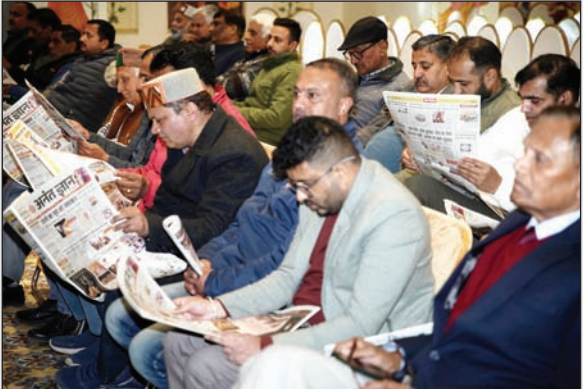
समाचार पत्र का अवलोकन करते अन्य गणमान्य नागरिक।