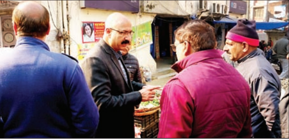
नगर निगम के महापौर मुख्य द्वार पर निरीक्षण के दौरान व्यापार यूनियन के प्रधान से बातचीत करते हुए।

बता दें की नगर निगम द्वारा मुख्य द्वार पर गेट का निर्माण किया जा रहा है जिसको लेकर निगम के जनरल हाउस से प्रस्ताव भी पारित हो गया है। इसके बाद टेंडर प्रक्रिया