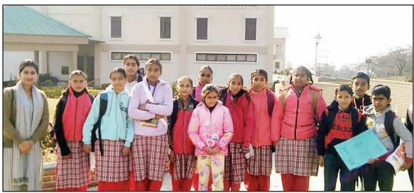
भ्रमण के दौरान जानकारी हासिल करते झंगगी स्कूल के छात्र।