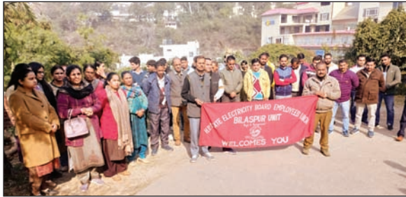
ओपीएस की बहाली व अन्य मांगों को लेकर बिजली बोर्ड के कर्मी प्रदर्शन करते हुए।

वेतन की मांग पूरी होने के बाद बिजली बोर्ड के कर्मचारियों ने ओपीएस की बहाली, आउटसोर्स कमचारियों के हित में स्थायी नीति बनाने तथा बोर्ड में स्थायी प्रबंध निदेशक की नियुक्ति, जैसी मांगों को लेकर अपना आंदोलन जारी रखा है।