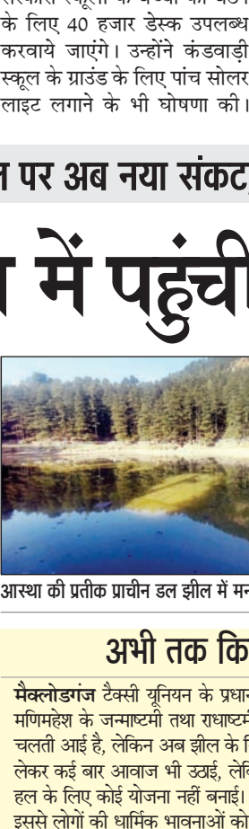
आस्था की प्रतीक प्राचीन डल झील में मनमोहक दृश्य (दाएं) वहीं, डल झील पहुंची सीवरेज की गंदगी।

पर खतरा बना रहेगा। आलम ये कि पानी के सूख जाने के कारण अब यहां सैलानी भी कमतर ही रुक रहे हैं। विभाग इसको लेकर पांच करोड़ रुपए की डीपीआर भेज कर फंड का इंतजार कर रहा है। उधर, रविवार को झील में सीवरेज का पानी पहुंच गया। हालांकि अब इसके प्रवाह में कमी आया है। यहां बताते चलें कि रिसाव के कारण पिछले डेढ़ दशक से झील में रिसाव जारी है तो वहीं इसके स्थायी हल के लोगों को लंबा इंतजार करना पड़ रहा है।