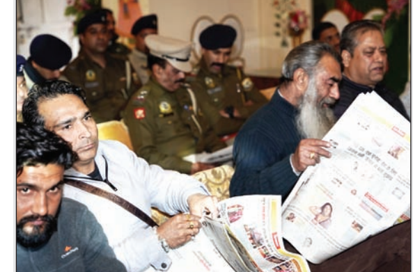
कार्यक्रम में अलग-अलग स्थानों पर बैठे गणमान्य लोगों ने अनंत ज्ञान का अवलोकन किया।