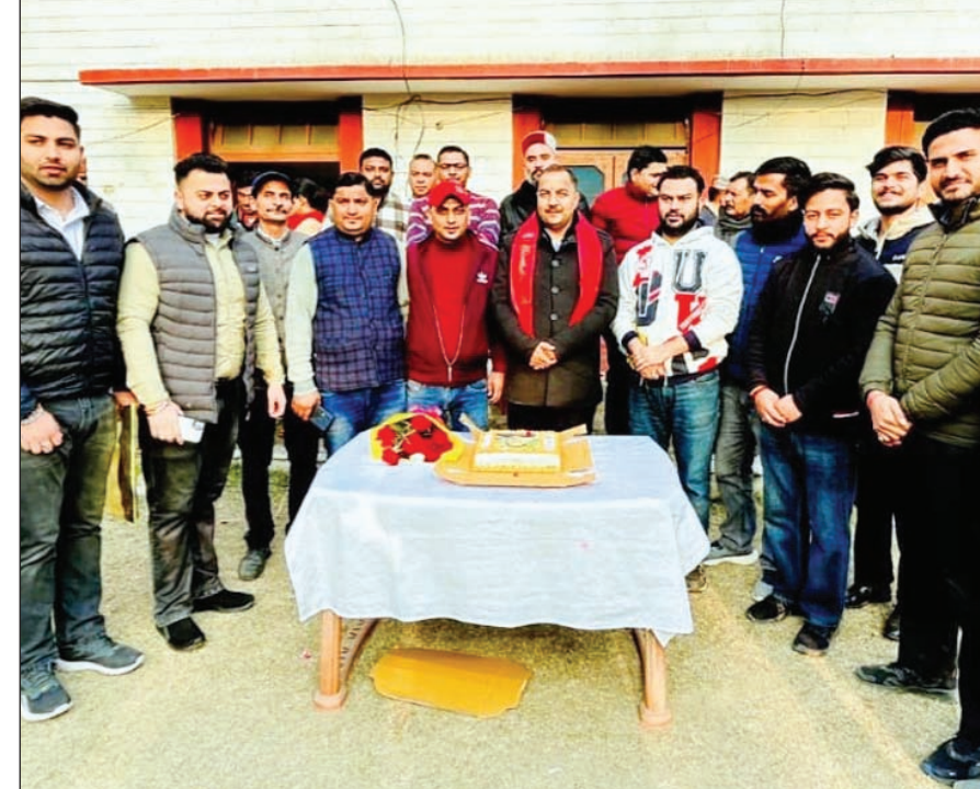
सोमवार को बिलासपुर सदर के विधायक त्रिलोक जम्वाल के जन्मदिवस के अवसर पर युवा मोर्चा सदर मंडल के कार्यकर्ता केक काट कर धूमधाम से विधायक का जन्मदिन मनाते हुए।