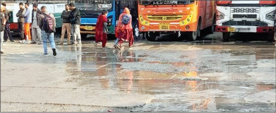
सरकाघाट बस स्टैंड पर खुले में बहता सीवरेज का गंदा पानी। इससे लोगों को रोज यहां दिक्कतों का सामना करना पड़ रहा है।

नगर परिषद सरकाघाट के अधिकारी इसे बस अड्डे वालों का अधिकार क्षेत्र बताते हैं तो दूसरी ओर एचआरटीसी के अधिकारी नगर परिषद का कार्य क्षेत्र बता रहे हैं। दो विभागों की आपसी लड़ाई का खामियाजा जनता को भुगतना पड़ रहा है। स्थानीय लोगों ने सरकार व विभाग से तुरंत इस समस्या का समाधान करने की