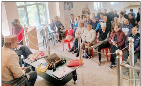
बैठक में मौजूद संगठन के सदस्य।

पेंशनर्स अब इस तरह की व्यवस्था से बेहद नाराज और खफा हैं उन्होंने प्रदेश सरकार से मांग की है कि उनकी समस्याओं का हाल शीघ्र किया जाए, क्योंकि ओल्ड ऐज में ऐसी समस्याओं का हल यदि शीघ्र न निकाल पाए तो बहुत पीड़ा होती है। जिलाध्यक्ष के गौतम को मौजूदगी में हुई इस बैठक में बताया गया कि पहली