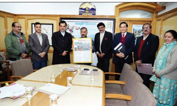
संपर्क विभाग के साप्ताहिक समाचार पत्र गिरिराज का कैलेंडर लांच करते सीएम।