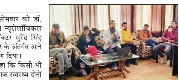
प्रशिक्षण के दौरान बैठे कार्यकर्ता और डॉक्टर।