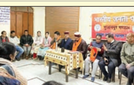
सेक्टर प्रचारियों की बैठक को संबोधित करते केंद्रीय मंत्री अनुराग ठाकुर।