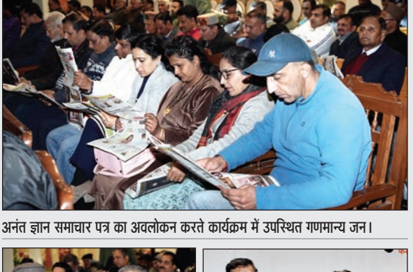
अनंत ज्ञान समाचार पत्र का अवलोकन करते कार्यक्रम में उपस्थित गणमान्य जन।