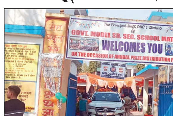
एनुअल फंक्शन के लिए मललाहड़ स्कूल के गेट में लगा स्वागत बोर्ड।

जानबूझ कर बच्चों की पढ़ाई को प्रभावित किया जा रहा है। अभिभावकों ने मुख्यमंत्री सुखविंद सिंह सुखू, शिक्षा मंत्री रोहित ठाकुर से मांग की है कि स्कूलों के वार्षिकोत्सव दिसंबर माह से पहले होने चाहिए तथा अभी स्कूलों में होने वाले वार्षिकोत्सव पर रोक लगाई जाए। (अनंत ज्ञान)