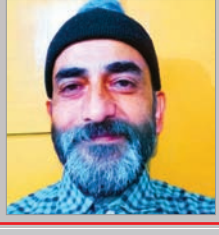
यह कॉलम ब्लॉगर के लिए है। इस व्हाट्सएप नंबर 9882400808 पर भेजें।

आज ही नहीं, ऐसा बीते कई-कई दशकों से चला आ रहा है। दूसरे देशों के मामलों में दखल देना व टांग अड्डना अमेरिका और अन्य पश्चिमी मीडिया अपना अधिकार समझता है और वह भी दोहरे-तिहरे मापदंडों के साथ। अमेरिकी संसद पर हुए उनके अपने ही नागरिकों के हमले की तो कथित बुद्धिजीवी आलोचना करते हैं, लेकिन लालकिले पर हुए देश विरोधियों के आक्रमण को यही लेखक, पत्रकार 'अभिव्यक्ति की स्वतंत्रता' कहते हैं। इन्होंने विषयों पर सुप्रसिद्ध लेखक, स्तंभकार अमीश त्रिपाठी के विचार व प्रतिक्रिया सर्वथा मननीय और प्रशंसनीय है। बहुत सारे लोगों को मालूम है कि अमीश त्रिपाठी कई श्रेष्ठ पुस्तकों के