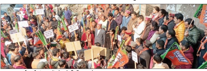
भाजपा कार्यकर्ता बंजार में रोप रेली निकालते हुए।