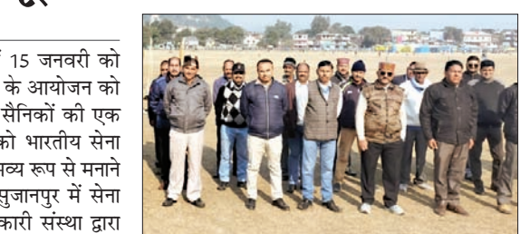
पूर्व सैनिक बैठक के दौरान सामूहिक चित्र में।

सुजानपुर के ऐतिहासिक चौगान में 15 जनवरी को सुबह 10.30 बजे 76वें सेना दिवस के आयोजन को अमली जामा पहनाने के लिए पूर्व सैनिकों की एक बैठक हुई, जिसमें इस आयोजन को भारतीय सेना की गौरवपूर्ण परंपराओं के अनुरूप भव्य रूप से मनाने के लिए हर पहलू पर चर्चा हुई। सुजानपुर में सेना दिवस का आयोजन सर्व कल्याणकारी संस्था द्वारा भूतपूर्व सैनिक लीग के साथ मिलकर इस बार 15 जनवरी को कर रही है।