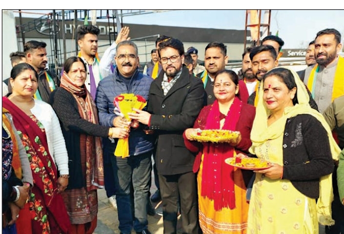
डिडवीं टिककर में भाजपा हमीरपुर संसदीय क्षेत्र के नेताओं के साथ अनुराग ठाकुर।

भ्रष्ट पुलिस अधिकारियों के लिए मुख्यमंत्री धरने पर बैठ जाए यह अराजकता नहीं तो और क्या है। इससे बड़ा कुशासन का और क्या उदाहरण हो सकता है कि भ्रष्टाचार जो इनके नेताओं ने किया, जो