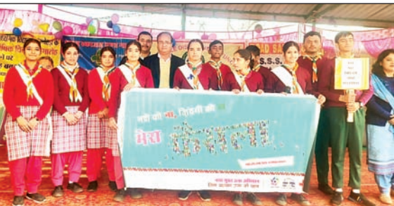
राजकीय वरिष्ठ माध्यमिक विद्यालय अंबेहड़ के स्टूडेंट्स नशे से दूर रहने का संदेश देते।