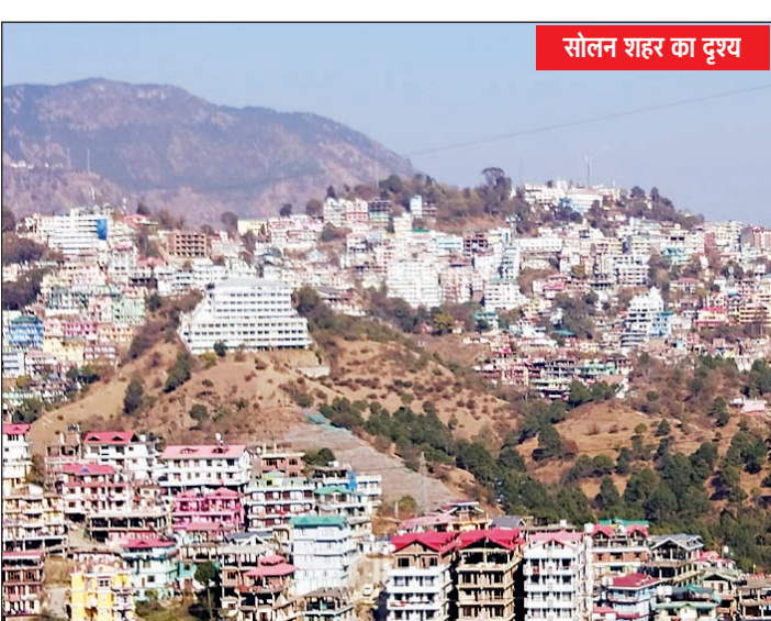
सोलन शहर का दृश्य

इस दिशा में आगे बढ़ते हुए निगम ने सार्वजनिक शौचालयों और सीवरेज व्यवस्था को अपग्रेड करने का दावा किया है। इसके चलते शहर को बाह्य शौच कृता (ओडीएफ प्लस प्लस) का रैंक हासिल हुआ है। निगम ने अब स्वच्छता में अद्वल आने का लक्ष्य रखा है। इसके तहत शहर के सभी सुलभ शौचालय और वाडों के सार्वजनिक शौचालय को अपग्रेड करने के साथ नालियों की सफाई और सीवरेज सिस्टम को बेहतर किया गया है। पहले चरण में सोलन शहर के माल रोड स्थित सुलभ शौचालय अपग्रेड करने के साथ पुराना बस स्टैंड, माल रोड, चिल्ड्रन पार्क, सपरून, चौक बाजार और कोटला नाला