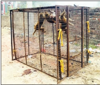
पिंजरे में काबू किए हुए बंदर।