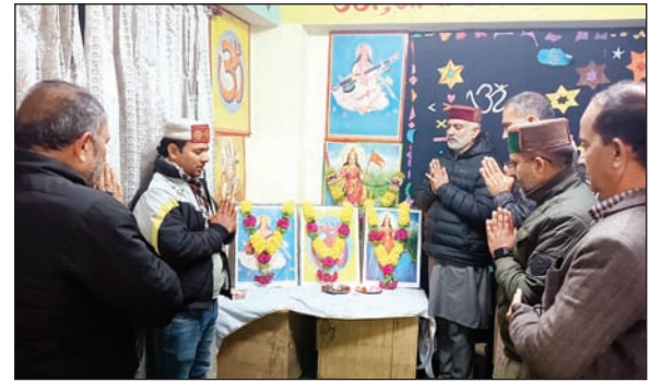
विद्या भारती के समर्पण अभियान के तहत सरस्वती विद्या मंदिर विद्यालय में मौजूद कार्यकर्ता।

हर वर्ष की भांति इस वर्ष भी बसंत पंचमी के उपलक्ष में आर्थिक रूप से कमजोर प्रतिभावान स्कूली बच्चों की मदद के लिए विद्या भारती आगे आई है। विद्या भारती के समर्पण अभियान के तहत सोमवार को सरस्वती विद्या मंदिर विद्यालय रौड़ा में बैठक आयोजित की गई।