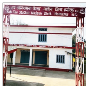
नवनिर्मित अग्निशमन केंद्र नादौन।

विधिवत लोकार्पण होते ही अपना कार्य सुचारु रूप से करेगा शुरू