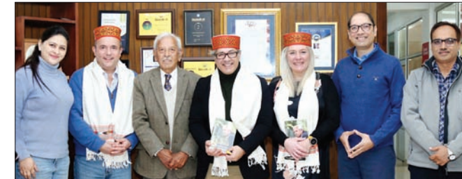
शूलिनी विवि के दौरे को पहुंची न्यूकैसल विवि की टीम।