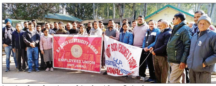
वेतन व पेंशन की अदायगी न करने पर जवाली में प्रदर्शन करते विद्युत कर्मों व पेंशनर्स।

इतिहास में पहली बार कर्मचारियों व पेंशनर्स को वेतन व पेंशन का भुगतान अभी तक नहीं हो पाया है। उन्होंने कहा कि विद्युत बोर्ड लिमिटेड के प्रबंधक वर्ग की गलत नीतियों के चलते बिजली बोर्ड का आर्थिक ढांचा बुरी तरह से चरमरा गया है। विद्युत बोर्ड में किसी सक्षम अधिकारी को विद्युत बोर्ड लिमिटेड का स्थाई प्रबंध निदेशक नियुक्त करने की मांग की है। उन्होंने कहा कि बिजली बोर्ड के