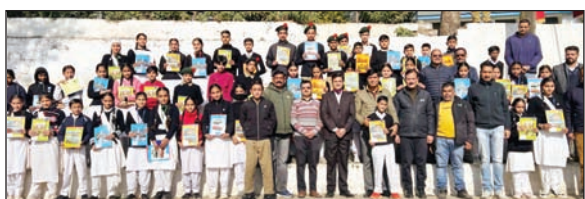
सड़क सुरक्षा को लेकर निकाली रैली के दौरान छात्र सामूहिक चित्र में।