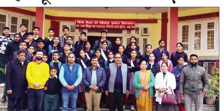
दशोल स्कूल के स्टूडेंट्स साइंस लैब का भ्रमण करते हुए।