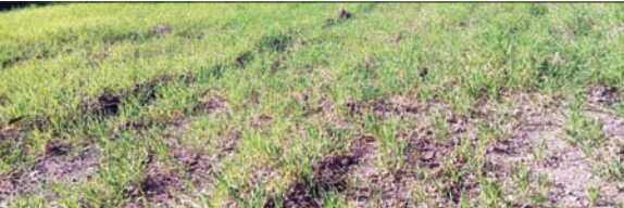
वर्षा के अभाव में खेत सूखने के कगार पर हैं।

सोलन जिले में इन दिनों मटर की फसल होती है। वर्षा न होने से फसल पर कोहरे व सूखे की मार पड़ रही है। किसानों को डर है कि यदि आने वाले कुछ दिनों में बारिश नहीं हुई तो उनकी मेहतान पर पानी फिर जाएगा। लंबे ड्राई स्पेल के कारण बागवान सूखे के डर से अभी नए पौधे लगाने से कतरा रहे हैं। किसान-बागवानों को जल स्रोतों के घटते जलस्तर की चिंता सता रही है। 21 हजार 300 हेक्टेयर पर लगाई