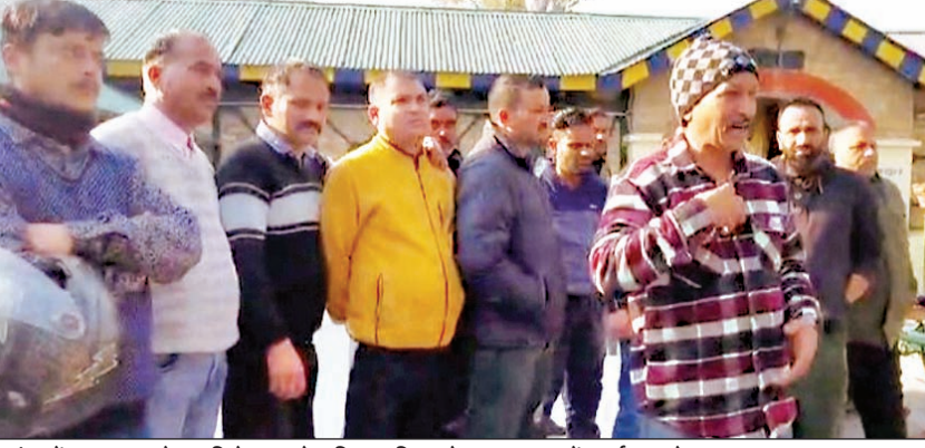
मारंडा में एक दुकान से मृत मिले युवक के परिजन पुलिस स्टेशन पालमपुर में प्रदर्शन करते हुए।