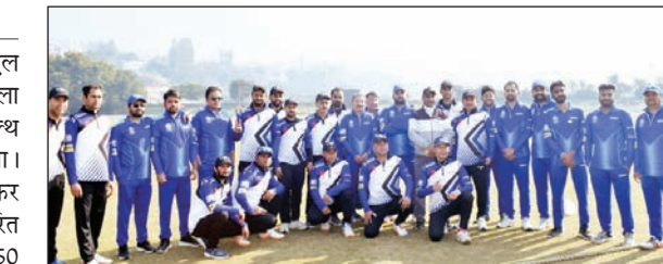
आईसीएल प्रतियोगिता के तीसरे दिन की क्रिकेट टीम।