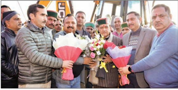
कैहलू में विधानसभा अध्यक्ष कुलदीप सिंह पटानिया को सम्मानित करते हुए।

अनंत ज्ञान, डलहौजी भटियात विधानसभा क्षेत्र के तहत ग्राम पंचायतों द्वारा निर्मित सभी संपर्क मार्गों को चरणबद्ध ढंग से लोक निर्माण विभाग के तहत लाया जाएगा। यह बात कैहलू में आयोजित जनसभा को संबोधित करते हुए विधानसभा अध्यक्ष कुलदीप सिंह पटानिया ने कही। उन्होंने इस दौरान 89 लाख रुपये की राशि से निर्मित होने वाले कैहलू-रेणा संपर्क मार्ग का शिलान्यास भी किया। उन्होंने कहा कि कैहलू-रेणा संपर्क मार्ग को संग्रहण तथा बलेरा गांव तक विस्तार दिया जाएगा। भटियात विधानसभा क्षेत्र के तहत सड़क निर्माण को लेकर अपनी प्रतिबद्धता की बात दोहराते हुए कुलदीप सिंह पटानिया ने कहा कि दिसंबर 2026 तक सभी गांवों को