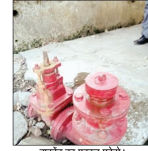
हाइड्रेंट का फाइल फोटो।

एक ऐसा मानक है जिसे जरूरी माना जाता है। वहीं, आलम यह है कि आजादी के सालों बाद भी अंग्रेजों के बसाए इस शहर तथा पर्यटन का केंद्र रहे इस शहर की सुरक्षा के लिए मूलभूत ढांचा तक मौजूद नहीं है। इसके अलावा धर्मशाला शहर में हाइड्रेंट हैं, जिससे शहर में आग जैसी किसी अनहोनी से बचने का सुरक्षा माध्यम मिलता है। (अनंत ज्ञान)