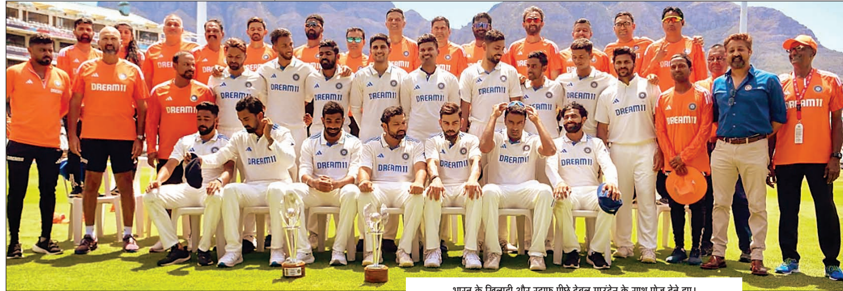
भारत के खिलाड़ी और स्टाफ पीछे टेबल माउंटन के साथ पोज देते हुए।