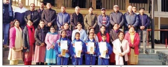
थुरल स्कूल में उत्कृष्ट खिलाड़ियों को सम्मानित करने का दौर।