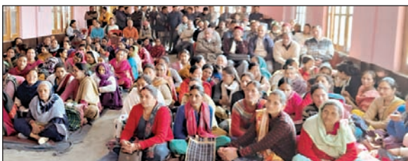
ग्राम पंचायत डलाह की आम सभा में उपस्थित ग्रामीण।

उन्होंने पंचायत किसान सम्मान निधि में प्रजीकृत करने और वर्ष 2004 से 2006 के बीच जन्मे बच्चों को वोट हेल्पलाइन ऐप में पंजीकृत करने बारे जानकारी दी। इस दौरान लोगों ने विकास कार्य न