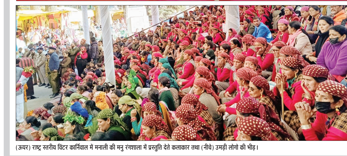
(ऊपर) राष्ट्र स्तरीय विंटर कार्निवाल में मनाली की मनु रंगशाला में प्रस्तुति देते कलाकार तथा (नीचे) उमड़ी लोगों की भीड़।