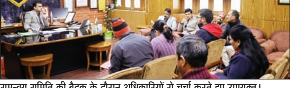
समन्वय समिति की बैठक के दौरान अधिकारियों से चर्चा करते हुए उपायुक्त।

अनंत ज्ञान ब्यूरो, कुल्लू उपायुक्त कार्यालय में मिजल्स-रूबेला उन्मूलन तथा स्कूल स्वास्थ्य कार्यक्रम की जिला स्तरीय समन्वय समिति की बैठक उपायुक्त आशुतोष गर्ग की अध्यक्षता में संपन्न हुई। उपायुक्त ने बताया कि वर्ल्ड हेल्थ ऑर्गेनाइजेशन (डब्ल्यूएचओ) तथा यूनिसेफ के अनुमान के मुताबिक देशभर में इस कार्यक्रम में पहली खुराक के अंतर्गत 82 प्रतिशत बच्चों को कवर किया गया था। इस अभियान के अंतर्गत 9 माह से 15 वर्ष तक के बच्चों को यह टीका लगाया गया। अगर बच्चे ने पहले भी टीका लिया है तो भी उसे