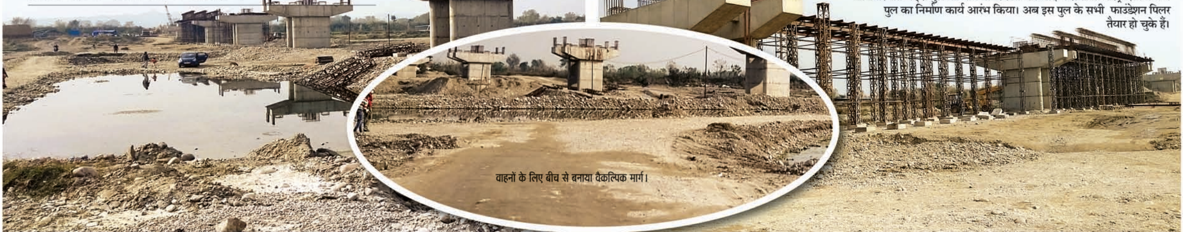
वाहनों के लिए बीच से बनाया वैकल्पिक मार्ग।

अब स्पैन जोड़ने का काम आरंभ, लोगों के लिए आवाजाही होगी आसान