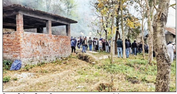
सिद्धबाड़ी के समीप पंचगिट्ट रमशानघाट का फाइल फोटो।