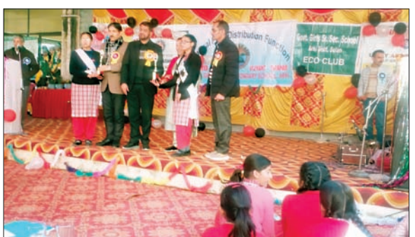
कार्यक्रम में मेधावियों को सम्मानित करते अतिथि।

वंदे मातरम् के साथ कार्यक्रम की शुरुआत होने के बाद दीप प्रज्वलन व सरस्वती वंदन किया गया। मुख्य अतिथि सम्मान के बाद विभिन्न छात्राओं ने भिन्न-भिन्न सांस्कृतिक कार्यक्रम प्रस्तुत किए। इन कार्यक्रमों में मुख्यतः प्रस्तुत किए गए अतिथियों व अतिथिबोधों ने भरपूर आनंद उठाया। मुख्य अतिथि ने अपने उद्बोधन में छात्राओं को जीवन में सफलता के सूत्र दिए। इस अवसर पर जमा दो कला संकाय से कृतिका