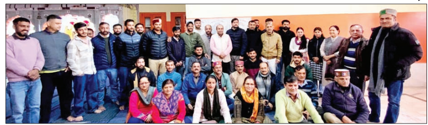
बैठक के बाद हाटी समिति की नाहन इकाई के सदस्य।