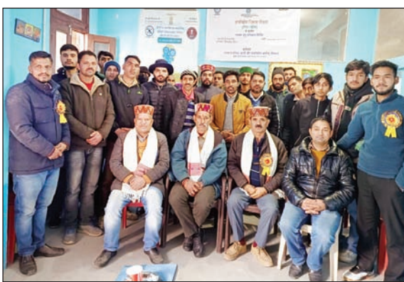
बालीचौकी में प्लंबर प्रशिक्षण शिविर के दौरान प्रशिक्षु सामूहिक चित्र में।

उन्होंने कहा कि प्रदेश के ग्रामीण क्षेत्रों में स्वावलंबन के लिए भारत सरकार का सूक्ष्म एवं लघु उद्योग मंत्रालय कई तरह की योजनाएं चला रहा है, जिसमें प्लंबर प्रशिक्षण का कार्य शामिल है। इस दौरान दी डोगरा तकनीकी एवं व्यावसायिक प्रशिक्षण संस्थान प्राइवेट लिमिटेड