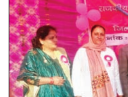
दसलेहड़ा स्कूल में वार्षिक पारितोषिक वितरण समारोह में भेद्यारियों को पुरस्कार देते हुए।