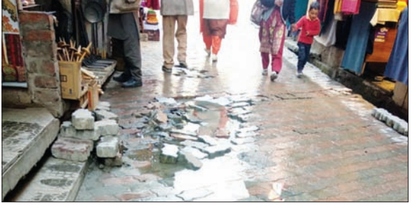
सरवरी में सड़क के नीचे से सड़कों पर बहते पानी का दृश्य।

सुरेंद्र तिबोगपा, कुल्लू कुल्लू शहर के सरवरी पुल के समीप एकांत आश्रम के नजदीक सड़क पर लगे पेबर के नीचे से पानी व्यर्थ बह रहा, लेकिन विभाग इसका कोई समाधान नहीं निकाल पाया है। पिछले दो दिनों से लगातार सरवरी एकांत आश्रम के नजदीक ज्वेलरी शॉप के सामने सड़क पर लगे पेबर के नीचे से पानी बाहर बह रहा है, जिस कारण लोगों को चलने-फिरने में परेशानी हो रही है। हालांकि इस बारे में संबंधित विभाग को सूचना दी गई थी और विभाग के कर्मचारियों ने पेबर उखाड़ कर