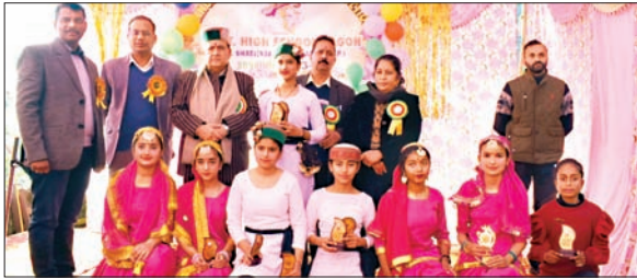
वार्षिक समारोह के दौरान स्कूल के होनहार मुख्यातिथि के साथ।

राजकीय उच्च विद्यालय डगोह में वीरवार को वार्षिक पारितोषिक वितरण समारोह मनाया गया। समारोह में विधानसभा अध्यक्ष कुलदीप सिंह पटानिया ने बतौर मुख्यातिथि शिरकत की। विधानसभा अध्यक्ष कुलदीप सिंह पटानिया ने इस दौरान 44 लाख से नवनिर्मित अतिरिक्त स्कूल भवन का लोकार्पण भी किया। पटानिया ने कहा कि प्रदेश सरकार द्वारा शिक्षकों के पदों को प्राथमिकता के आधार पर भरा जा रहा है। इसके अतिरिक्त वैकल्पिक व्यवस्था के तौर पर स्कूलों में रिक्त अध्यापकों के पदों को गेस्ट टीचर के रूप में भरने पर भी विचार किया जा रहा है। पटानिया ने स्कूल के खेल मैदान बनाने को लेकर लोक निर्माण