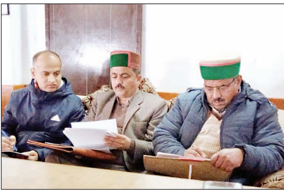
कुमारसैन में जिला परिषद वार्ड के विकास कार्यों की समीक्षा करते हुए।