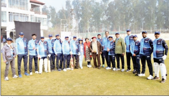
आईसीएम प्रतियोगिता के दूसरे दिन प्रेस इलेवन की टीम।