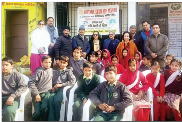
स्वास्थ्य जांच शिविर में उपस्थित पंचायत प्रतिनिधि, बच्चे व एनएसएस स्वयंसेवक।