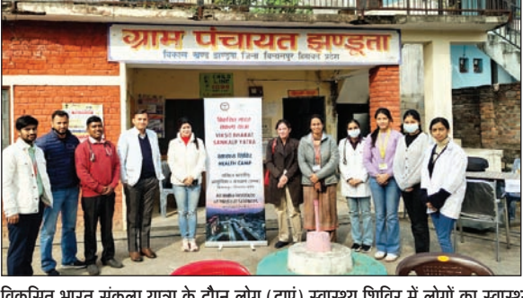
विकसित भारत संकल्प यात्रा के दौन लोग (दाएं) स्वास्थ्य शिविर में लोगों का स्वास्थ्य जांचते हुए डॉक्टर।