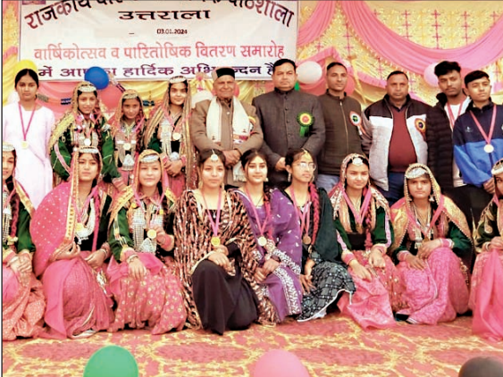
कार्यक्रम के दौरान छात्रों के साथ सामूहिक चित्र में बैजनाथ के विधायक।

सीपीएस ने कहा कि शिक्षा से मनुष्य महान बनता है। बिना शिक्षा के मनुष्य कुछ भी नहीं है। उन्होंने कहा कि उन्होंने चुनाव में किए सभी वादे पूरे किए हैं। बैजनाथ कॉलेज में एमए की कक्षाएं शुरू करवा दी गई हैं। उन्होंने कहा कि विस क्षेत्र में पेयजल योजना के अंतर्गत ओवरहेड टैंक बनाए जा रहे हैं। पेयजल की समस्या को आने वाले समय में