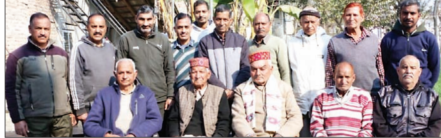
नेरचोक। भंगरोटू में बुधवार को आयोजित बैठक के दौरान उपस्थित ग्राम सुधार सभा बल्ह के पदाधिकारी।