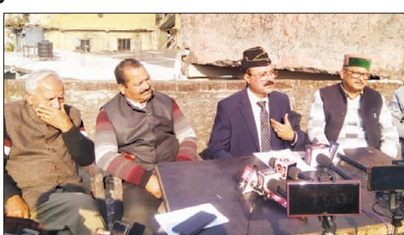
बैठक के दौरान जानकारी देते हुए पूर्व सैनिक लीग के सदस्य।