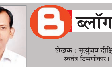
लेखक : मृत्युंजय दीक्षित स्वतंत्र टिप्पणीकार।

अयोध्या से सनातन का भव्य सूर्योदय पांच सौ वर्ष के सतत् संघर्ष और स्वतंत्रता प्राप्ति के बाद विकृत व दूषित मनोवृत्ति की राजनीति के कारण सर्दी, गर्मी व बरसात में भी फेरे टेट में सब प्रकार के कष्ट झेलने वाले रामलला अब अपने दिव्य एवं भव्य मंदिर में प्राण प्रतिष्ठित होने जा रहे हैं। जैसे-जैसे प्राण प्रतिष्ठा की तिथि (22 जनवरी 2024) निकट आ रही है भारत के पूर्वी से पश्चिमी और उत्तर से दक्षिणी छोर तक समस्त सनातनी रामभक्तों का उत्साह भी बढ़ता जा रहा है। सभी प्रभु श्रीरामलला के आगमन के आनंदोत्सव में डूबना चाह रहे हैं। यही कारण है कि प्रधानमंत्री नरेंद्र मोदी को अपनी विगत अयोध्या यात्रा में रामभक्तों के मन में भी धैर्य का भाव गगनमा पड़ा।