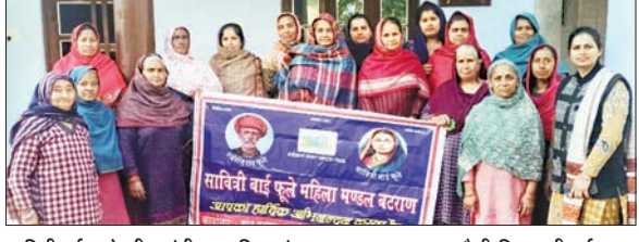
सावित्रीबाई फुले की जयंती पर महिला मंडल बटराण जागरूकता रैली निकालती हुई।