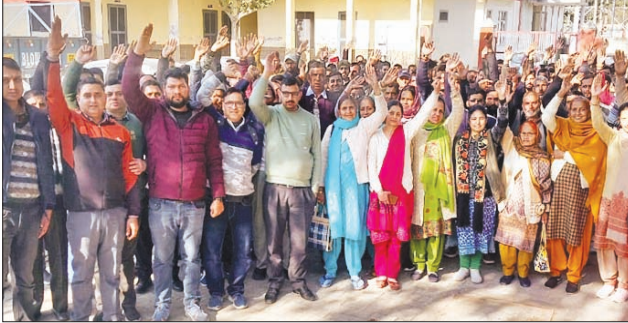
वेतन व पेंशन की अदायगी न होने पर बिजली बोर्ड के खिलाफ प्रदर्शन करते कर्मचारी।