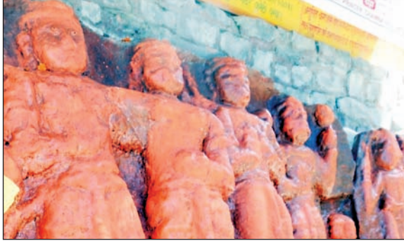
भगवान श्रीराम, सीता, लक्ष्मण व हनुमान सहित सुग्रीव, नल-नील की प्रतिमा।