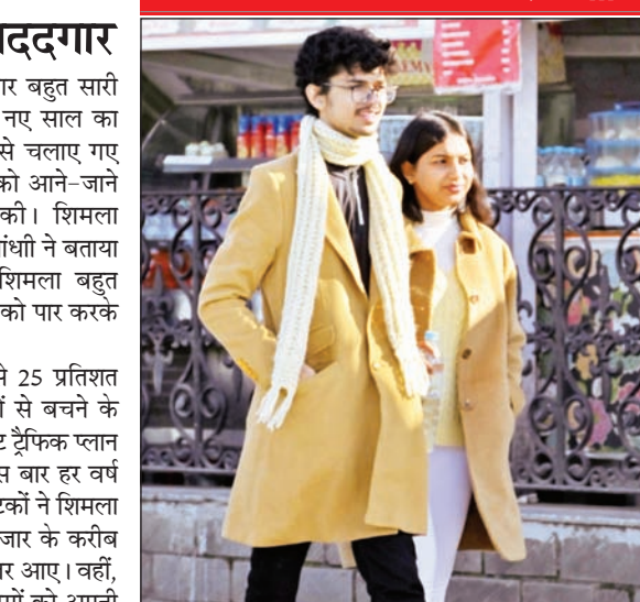
सर्दी से बचने के साथ युवा फेरन का भी खास ख्याल रखते हैं, इन दिनों फेरन और लॉन्ग कोट सभी को परसंद आ रहे हैं।