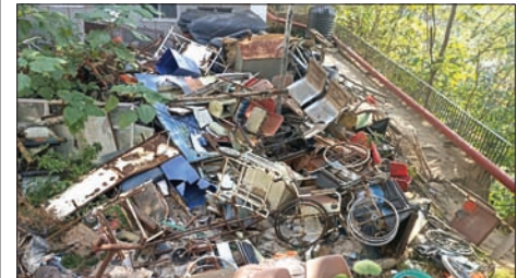
अस्पताल के बाहर बिखरा पड़ा कबाड़।