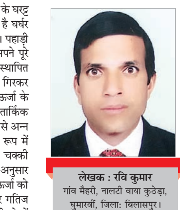
लेखक : रवि कुमार गंभ मैरी, नालटी वाया कुटेड़ा, घुमारवीं, जिला: बिलासपुर।

घराट शब्द की उत्पत्ति संस्कृत भाषा के घट्ट से हुई मानी जाती है, जिसका अर्थ है घर्ष की आवाज करते हुए अन्न पीसना। पहाड़ी क्षेत्रों में नदियां और खड्ड-नाले अपने पूरे वेग से बहते हुए अपना अस्तित्व स्थापित करते हैं और यहाँ-वहाँ ऊंचाइयों से गिरकर अक्षय ऊर्जा के स्रोत बन जाते हैं। ऊर्जा के इन्हीं स्रोतों का लाभ वैज्ञानिक व ताकिक भूखे जो रजाणा औक्खा। हिड्डु भरोया सोत्तड़ सुत्ता रज्येयो जो खुआणा औक्खा। जिह्वा जीभ रटा दी मैं मैं तिहाँ राम गलाणा औक्खा। धन दौलत लै मैंह अटारी राम दा नाम ऐ पाणा औक्खा।