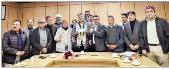
चेक भेंट करते पूर्व छात्र एसोसिएशन के पदाधिकारी।