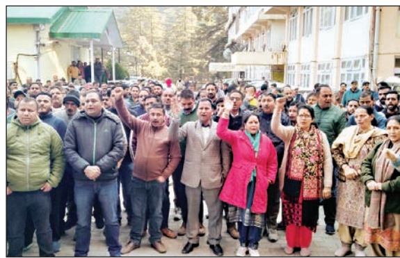
बिजली बोर्ड मुख्यालय में आयोजित गेट मीटिंग में भाग लेते अधिकारी व कर्मचारी।

मुफ्त की बिजली देने के सरकार के फैसले और बोर्ड के कुप्रबंधन चलते बिजली की हलात खस्ता है। बोर्ड में एमडी की स्थायी नियुक्ती नहीं हुई है। इसलिए कर्मचारियों को जल्द ओपीएस बहाल की जाए और एमडी की बोर्ड में स्थायी नियुक्ति की जाए, ताकि भविष्य में इस तरह की परेशानी से कर्मचारियों को जूझना न पड़े।