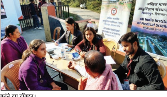
विशेषज्ञों ने मधुमेह और उच्च रक्तचाप से जुड़े शुरुआती लक्षणों और जोखिम कारकों का पता लगाने के लिए विस्तृत जांच की। कुल 386 लोगों की जांच की गई, जिनकी आयु 30 वर्ष या उससे अधिक थी। जांच करने पर लगभग

तहत 21 पंचायतों में स्वास्थ्य शिविरों का आयोजन किया। समुदाय को स्वस्थ जीवन शैली को सशक्त बनाने के लिए इन शिविरों में स्वास्थ्य संबंधित गतिविधियों को प्रदान करने के साथ प्रचलित गैर-संचारी रोग जैसे उच्च रक्तचाप, मधुमेह की जांच पर ध्यान केंद्रित किया गया। बहु-विशिष्ट शिविर में मेडिसिन, आर्थोपेडिक्स, ईएनटी विभाग के विशेषज्ञों ने भी भाग लिया। इन शिविरों का लोगों ने लाभ उठाया। प्रशिक्षित स्वास्थ्य