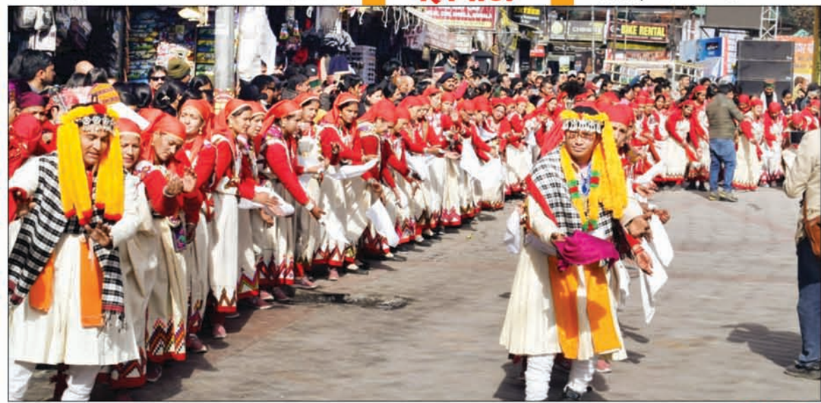
मनाली में चल रहे विंटर कार्निवाल के दूसरे दिन बुवार को मालरोड पर वामतक के 95 महिला मंडलों की एक हजार महिलाओं ने सामूहिक रूप से महानाटी डाली। -संक्षिप्त खबर पेज 8

1 घंटे तक मालरोड पर थिरकी महिलाएं सैलानी भी खूब नाचे, हिमाचली संस्कृति के हुए दीवाने