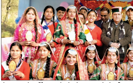
मोरठू स्कूल के वार्षिक समारोह के दौरान स्कूल के मेधावी मुख्यातिथि के साथ।