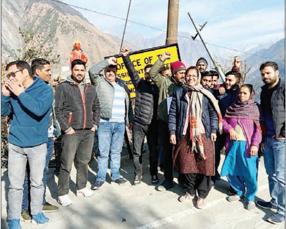
सहायक अभियंता कार्यालय भरमौर में अपनी मांगों को लेकर प्रदर्शन करते बिजली बोर्ड के अधिकारी व कर्मचारी।

अनंत ज्ञान, भरमौर पहली जनवरी को हिमाचल प्रदेश बिजली बोर्ड के कर्मचारियों के खाते में सैलरी न आने के कारण भरमौर में बिजली बोर्ड के कर्मचारियों ने सब डिवीजन में सांकेतिक धरना दिया। कर्मचारियों का कहना है कि पहली बार हुआ है कि तीन जनवरी बीत जाने के बाद भी अभी तक कर्मचारियों के खातों में सैलरी नहीं आई है। इस मौके पर कर्मचारियों ने मैनेजमेंट पर बोर्ड को खत्म करने की साजिश करने का आरोप भी लगाया है। कर्मचारियों का कहना है कि सभी कर्मचारी अपने-अपने हेडक्वार्टर पर सदियों में अपनी इच्छा को बखूबी निभा रहे हैं बावजूद इसके मैनेजमेंट द्वारा अभी तक उनकी सैलरी का भुगतान नहीं किया गया है। इस मौके पर उन्होंने