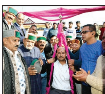
जालग पंचायत में पहुंचने पर गोमा को जलेबियों से तोलते कार्यकर्ता (दाएं) वहीं, कार्यक्रम में पहुंचने पर गोमा को सम्मानित करने का दौर।

खरा उतरते हुए जयसिंहपुर के विकास को तीव्र गति से आगे बढ़ाया जाएगा। उन्होंने कहा कि प्रदेश में 8 जनवरी से 12 फरवरी सरकार गांव के द्वार कार्यक्रम का आयोजन किया जा रहा है। उन्होंने कहा कि इस कार्यक्रम के माध्यम से सरकार की एक वर्ष को जन कल्याणकारी योजनाओं को धरातल पर पहुंचाने का कार्य होगा। उन्होंने कहा कि प्रधानमंत्री ग्रामीण सड़क योजना में नहालना से गदिवाड़ा सड़क के सुधार तथा विस्तार कार्य के लिए सात करोड़ तथा कोसरी से धुपक्यारा झूंगा देवी सड़क के विस्तार तथा सुधार कार्य के लिए 11 करोड़ स्वीकृत किए