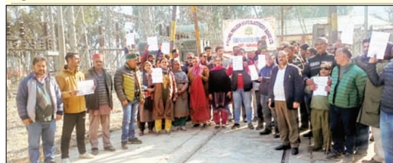
कुमारसैन में बिजली बोर्ड के कर्मचारी वेतन न मिलने पर प्रदर्शन करते हुए।