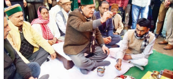
मोरठू-भेड़खड्ड संपर्क मार्ग का भूमि पूजन करते विस अध्यक्ष कुलदीप सिंह पटानिया।

अनंत ज्ञान, सिहता विधानसभा अध्यक्ष कुलदीप सिंह पटानिया ने बुधवार को मोरठू-भेड़खड्ड संपर्क मार्ग का भूमि पूजन किया। उन्होंने कहा कि इस सड़क के निर्माण पर 90 लाख की धनराशि व्यय होगी। उन्होंने यह भी कहा कि मोरठू-भेड़खड्ड संपर्क मार्ग को इंटर डिस्ट्रिक्ट मार्ग के रूप में विकसित कर इसके पुराने स्वरूप को वापस लाया जाएगा।