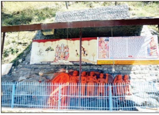
चंबा के सरोथा नाले में स्थित भगवान श्रीराम का मंदिर।