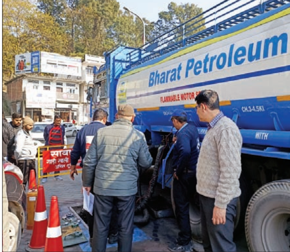
हमीरपुर शहर में एक पेट्रोल पंप पर खड़ा टैंकर।

हमीरपुर। पेट्रोल-डीजल को लेकर पिछले दो दिनों से जारी अफरा-तफरी कम हाल खत्म हो गया है, क्योंकि हड़ताल के खत्म होने ही हमीरपुर में बुधवार को पेट्रोल और डीजल के टैंकों का आना शुरू हो गया है। हमीरपुर शहर में भी टैंकर पहुंचते ही लोगों ने बड़ी राहत की सांस ली है। जिला के अन्य इलाकों में भी स्थिति सामान्य हो गई है, क्योंकि अब अफरा-तफरी है नहीं। हमीरपुर शहर में तकरबीबन आधा दर्जन पेट्रोल पंप हैं, जिन पर आज वाहनों की लंबी-लंबी कतारें तो देखी गईं, लेकिन पेट्रोल और डीजल इन्हें उपलब्ध होना शुरू हो गया है। पिछले काल से लगभग सारे पेट्रोल पंप ड्राई हो चुके थे।