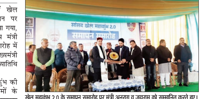
खेल महाकुंभ 2.0 के समापन समारोह पर मंत्री अनुराग व जयराम को सम्मानित करते हुए।

समारोह में खेल महाकुंभ की विजेता व उपविजेता टीमों के खिलाड़ियों लाखों रुपए के पुरस्कार देकर सम्मानित किया। पूर्व मुख्यमंत्री जयराम ठाकुर ने सभी खिलाड़ियों को बधाई देते हुए उनके उज्ज्वल भविष्य की कामना की। उन्होंने कहा कि प्रधानमंत्री नरेंद्र मोदी के नेतृत्व में देश पहले से अधिक सशक्त हुआ है। खेलों में खिलाड़ियों ने देश व प्रदेश का मान बढ़ाया है। केंद्रीय मंत्री अनुराग ने कहा कि घुमारवाँ विधानसभा क्षेत्र में शीघ्र इंडोर स्टेडियम बनाया जाएगा। इससे यहां के खिलाड़ियों को लाभ मिलेगा। अनुराग ठाकुर