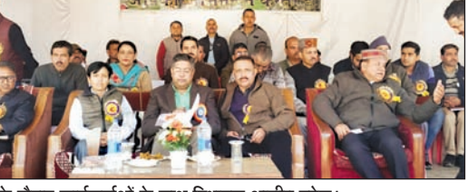
कार्यक्रम के दौरान कार्यकर्ताओं के साथ विधायक आशीष बुटेल।

पालमपुर के विधायक आशीष बुटेल ने सरकार पशु पालकों की समस्याओं के प्रति काफी गंभीर हैं और दूध और दुग्ध उत्पादों से पशु पालकों की आय में बढ़ोतरी के नए तरफ एवम वैज्ञानिक तरीके खोज कर रही है। इससे कि बेरोजगार और शिक्षित युवा इस व्यवसाय की तरफ आकर्षित हों और पशु पालन इन युवाओं के लिए आय का साधन बन सके। मुख्य संसदीय सचिव आशीष बुटेल ने बुधवार को कंडवाड़ी में प्रोजेनी टेस्टिंग जर्सी प्रोजेक्ट के तत्वावधान में पशुपालन विभाग के द्वारा आयोजित कॉफ रैली में बतौर मुख्यातिथि अपने संबोधन में कहा कि वर्तमान सरकार ने पशु पालकों के लिए 500 करोड़ रुपए की दूध गंगा योजना आरंभ की गई है। इसके तहत गांवों से दूध एकत्रित कर क्लस्टर स्तर पर चिलिंग प्लांट