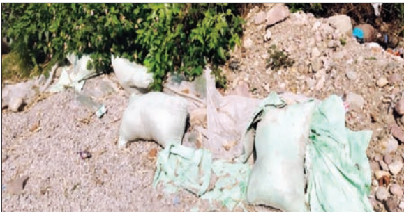
संधोल में नाले में पड़ी सरकारी सीमेंट की बोरियां।

लोगों का आरोप है कि यह वही सरकारी सीमेंट है, जिसका उपयोग विकास कार्यों में होना था, लेकिन जिम्मेदारों की लापरवाही और मनमानी के कारण अब यह मिट्टी में मिल रही है। लोगों ने सवाल उठाया कि जब गांवों की टूटी