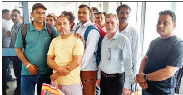
शारीरिक शिक्षक भर्ती साक्षात्कार में पहुंचे अभ्यर्थी