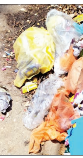
बीडीओ कार्यालय सुंदरनगर को जाने वाले मार्ग पर बिखरा कूड़ा-कचरा और खाली शराब की बोतलें।

अनंत ज्ञान नगर परिषद सुंदरनगर क्षेत्र में सफाई व्यवस्था को लेकर एक बार फिर लोगों में नाराजगी देखने को मिल रही है। बीडीओ कार्यालय सुंदरनगर को जाने वाले सार्वजनिक मार्ग तथा कार्यालय के मुख्य प्रवेश द्वार से सटे क्षेत्र में कूड़े-कचरे और खाली शराब की बोतलों के ढेर लगे होने से राहगीरों और कार्यालय आने-जाने वाले लोगों को भारी परेशानी का सामना करना पड़ रहा है। स्थानीय लोगों का कहना है कि लंबे समय से इस क्षेत्र में सफाई व्यवस्था बदहाल बनी हुई है, जिससे दुर्गंध फैल रही है और प्रदूषण का खतरा भी बढ़ता जा रहा है। लोगों को यहां से गुजरते समय नाक ढकने के लिए मजबूर होना