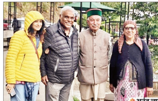
नारकंडा में अपने प्रवास के दौरान अभिनेता आशीष विद्यार्थी अपने प्रशंसकों के साथ।