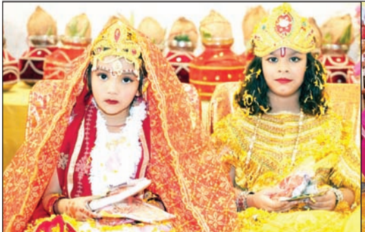
भगवान श्रीराम व माता सीता के रूप में नन्हें बच्चे व श्रीराम कथा के दौरान पंडाल में झूमती महिलाएं।