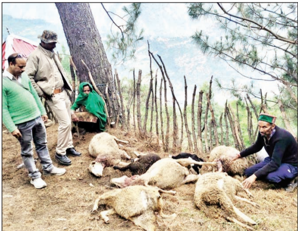
मृत पड़ी भेड़ों के साथ बैठा पीड़ित परिवार।