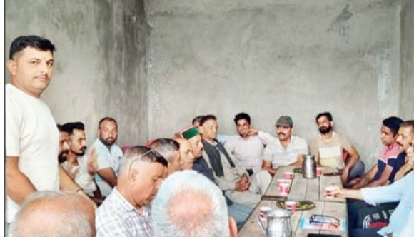
बैठक में शामिल सदस्य।

इस वर्ष भी दंगल का आयोजन 18 जून को दोपहर 1 बजे से किया जाएगा। उन्होंने क्षेत्र के पहलवानों