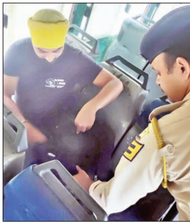
भविष्य में भी निरंतर जारी रहेंगे तथा नशा तस्करी के विरुद्ध कानून के अनुसार सख्त कार्रवाई अमल में लाई जाएगी।

अनंत ज्ञान नादौन। पुलिस थाना नादौन द्वारा नशे के विरुद्ध चलाए जा रहे विशेष अभियान के तहत बुधवार को थाना क्षेत्र के विभिन्न स्थानों पर विशेष नाकाबंदी एवं चेकिंग अभियान चलाया गया। इस दौरान पुलिस टीमों द्वारा मसेहखड्ड, ब्यास पुल, फिटपाल तथा अन्य प्रमुख मार्गों पर नाके स्थापित कर सख्त चेकिंग एवं वाहनों को गहन जांच की गई। मोटरसाइकिलों तथा व्यक्तिगत मोटरसाइकिलों की तलाशी ली गई तथा नशीले पदार्थों की तस्करी एवं अन्य अपराधिक गतिविधियों पर निगरानी रखी गई। पुलिस द्वारा क्षेत्र में चिट्ठा तथा अन्य मादक पदार्थों की अवैध तस्करी पर प्रभावी अंकुश लगाने के उद्देश्य से यह विशेष अभियान चलाया गया। पुलिस थाना नादौन द्वारा आम जनता से अपील की गई है कि नशा तस्करी अथवा किसी भी सख्त गतिविधि की सूचना तुरंत पुलिस को दें। नशे के विरुद्ध इस प्रकार के अभियान