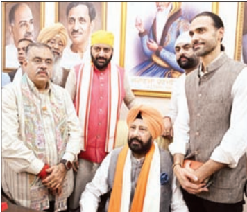
रक्तदान से शरीर में कोई कमजोरी नहीं आती और यह अन्य संस्थाओं के लिए प्रेरणा का स्रोत बनता है।

◆ विशेषज्ञ बोले-अनुशासित निवेश ही लंबी अवधि की सफलता की कुंजी