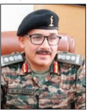
कर्नल जीपी सिंह

उन्होंने कहा कि कुछ एनसीसी कैडेट्स ने एनडीए का पहला पेपर पास कर लिया है अब सितंबर माह में होने वाले पेपर के बाद और अधिक युवा ऑफिसर के लिए भर्ती होंगे। उन्होंने कहा कि जून माह एनसीसी कैडेट्स के तीन कैंप लगाए जाएंगे इसमें 1800 कैडेट्स को प्रशिक्षण देंगे। उन्होंने कहा कि यह कैंप 10 दिन का होगा जो 4 से 13 जून तक जवाहर नवोदय विद्यालय डुंगरी में आयोजित किया जाएगा। इसमें 100 कैडेट्स शिमला से थल सेना कैंप के लिए भी आएंगे। इसमें 700 एनसीसी कैडेट भाग लेंगे। इसी प्रकार दूसरा कैंप 14 से 23 जून तक डुंगरी में आयोजित किया जाएगा इसमें 600 एनसीसी कैडेट्स भाग लेंगे। इस कैंप एनसीसी कैडेट्स को मांडटेन