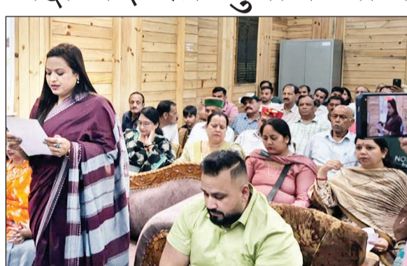
चंबा नगर परिषद चुनाव के लिए संशोधित शेड्यूल जारी। अनंत ज्ञान

उन्होंने कहा कि इस कारण निर्वाचन की कार्यवाही को स्थगित करते हुए अध्यक्ष एवं उपाध्यक्ष पद के निर्वाचन हेतु संशोधित कार्यक्रम जारी किया गया है। उन्होंने बताया कि संशोधित कार्यक्रम के अनुसार अध्यक्ष एवं उपाध्यक्ष पद हेतु नामांकन पत्र 4 जून को प्रातः 11:00 बजे से दोपहर 12:00 बजे तक उपमंडल अधिकारी