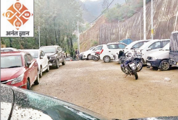
पार्किंग में खड़े बाहरी वाहन।

स्थानीय लोगों का आरोप है कि नगर निगम अभी तक पार्किंग का टेंडर जारी नहीं कर पाया है। ऐसे में बाहरी वाहन चालक मुफ्त में पार्किंग का उपयोग कर रहे हैं, जबकि क्षेत्र के निवासियों को अपने वाहन खड़े करने के लिए जगह नहीं मिल रही। शाम होते ही पार्किंग क्षेत्र और आसपास अव्यवस्थित तरीके